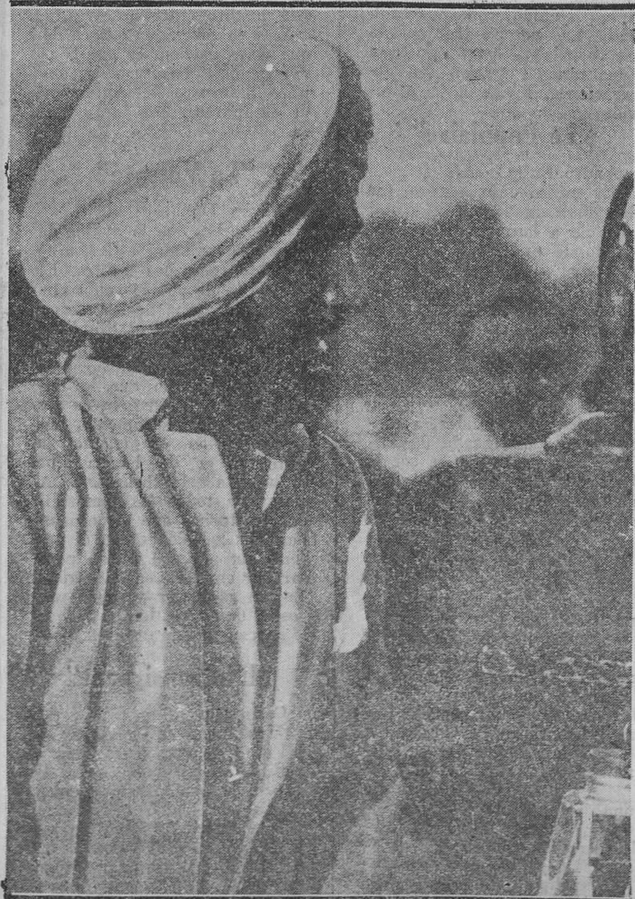
El capitán del Varsity Asiatick, primer equipo de "Hockey" que vino a España exhibiendo jugadores tocados de tubos...