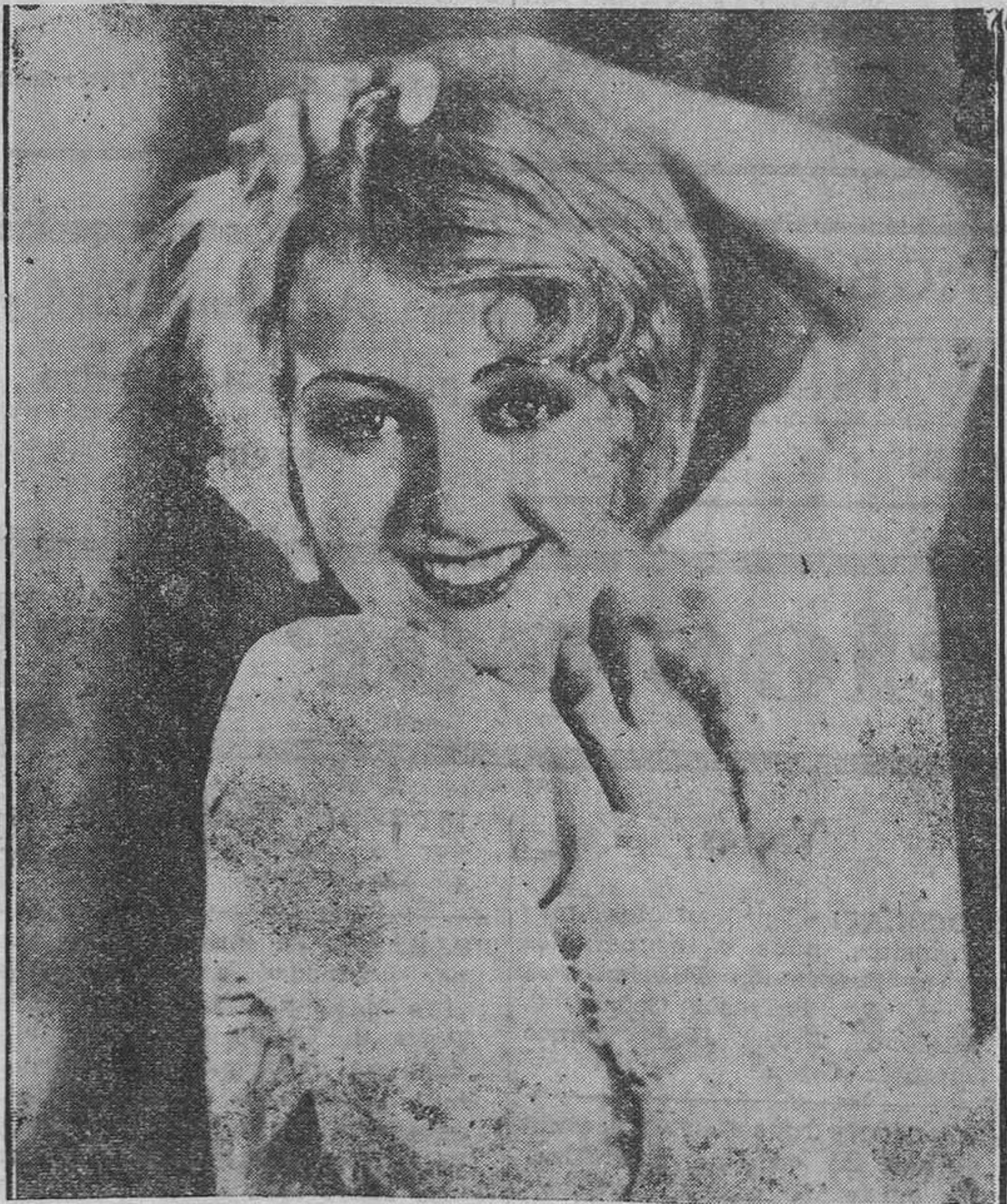
La encantadora ingénuo Joan Blondell, deliciosa intérprete de muchas hermosas películas.