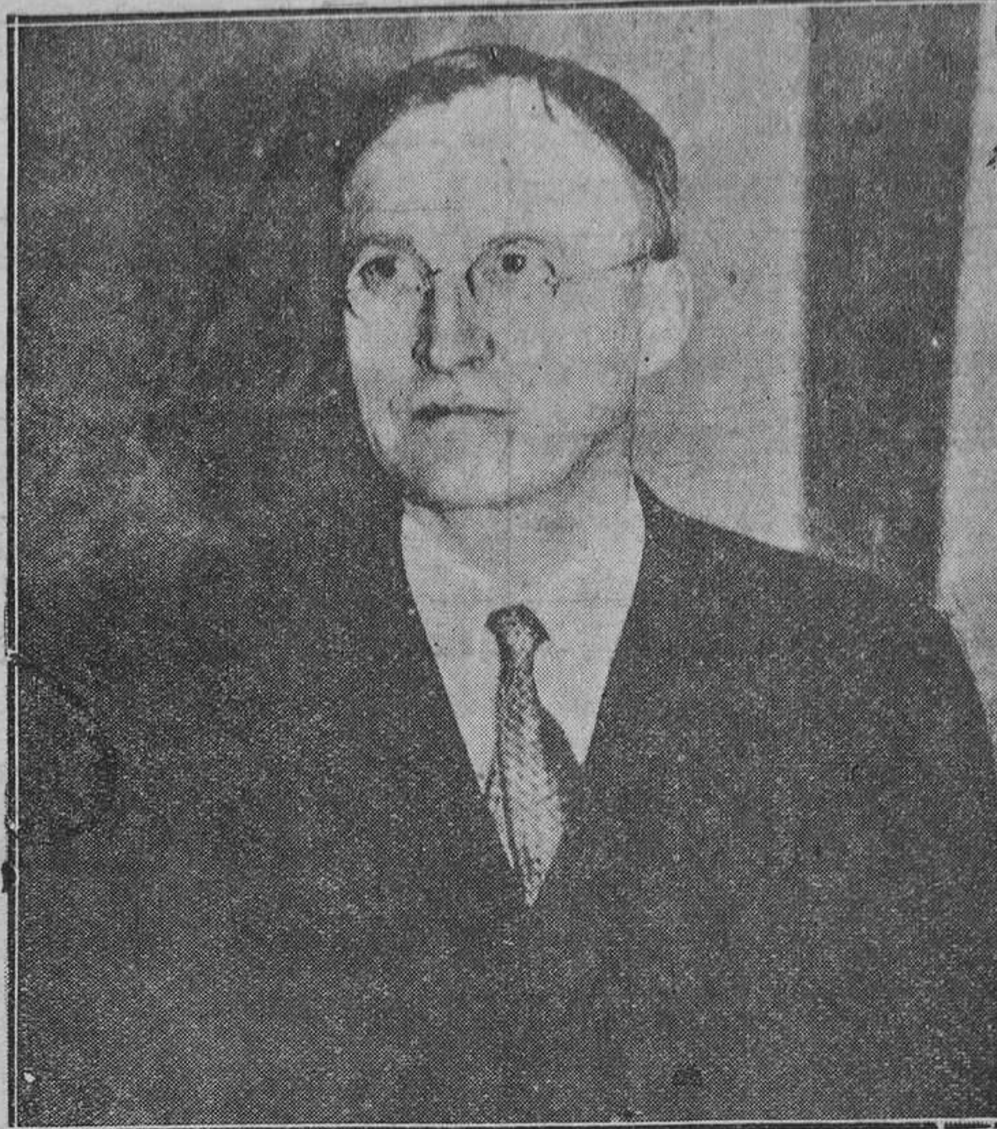
Harward.—El profesor George Birkhoff, ganador del premio de Matemáticas ofrecido por el Papa.