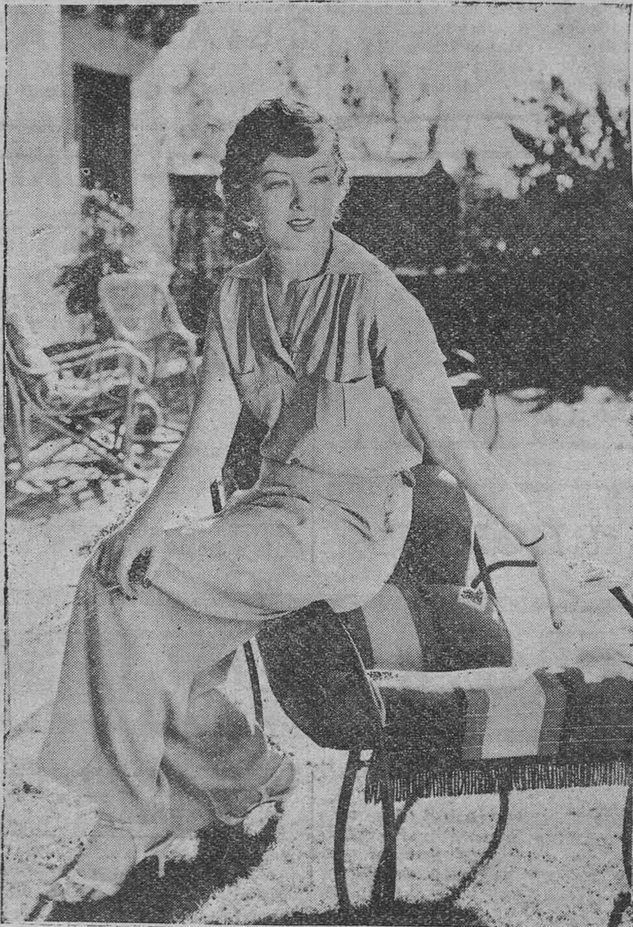
Myrna Loy, popular sirena, que últimamente se ha destacado interpretando roles dramáticos en varias películas de la Metro-Goldwyn-Mayer.