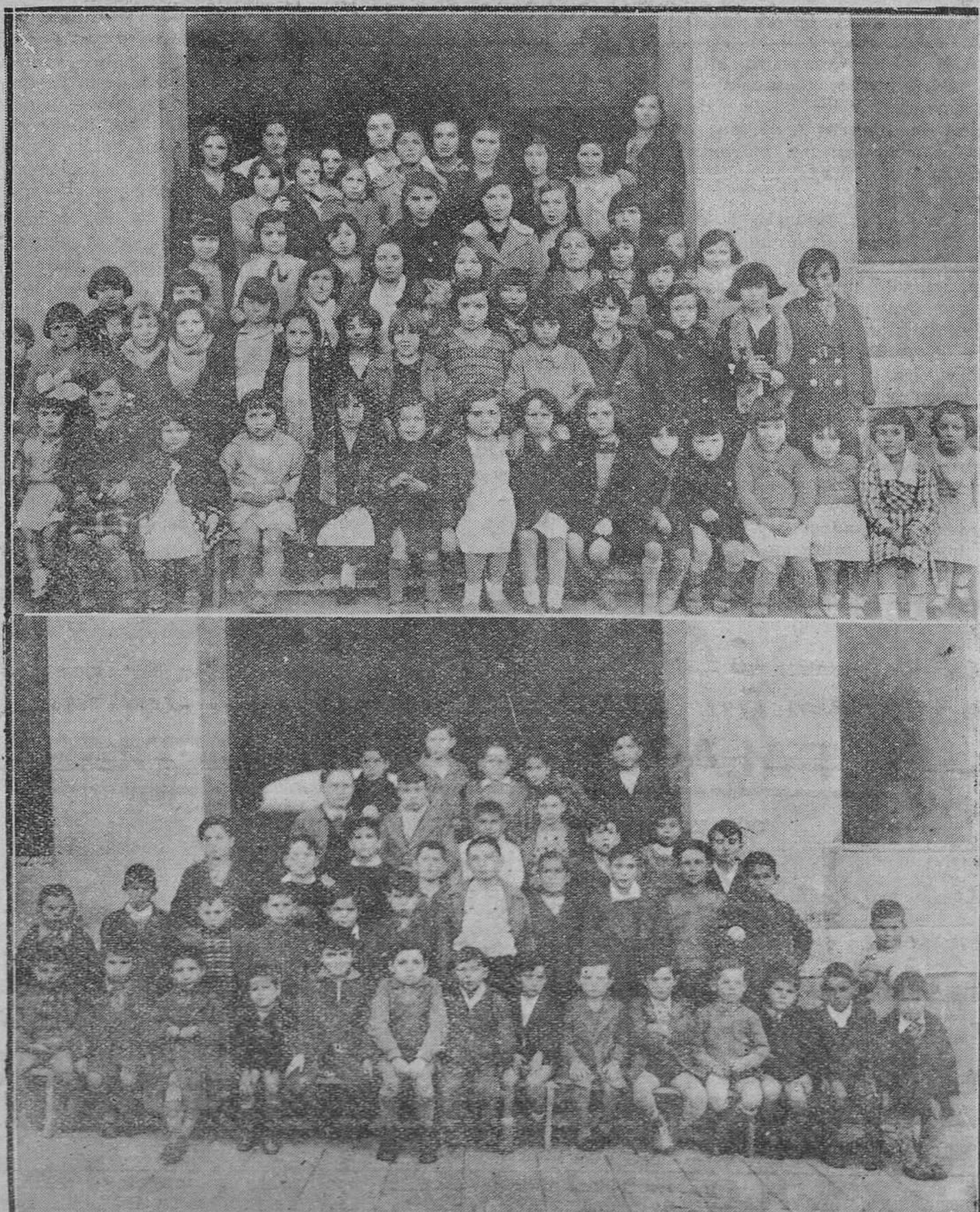
Grupos de niños y niñas que acuden al Catecismo que bajo los auspicios de las RR. MM. Dominicas funciona en el Colegio instalado en Pérez de la Sala.