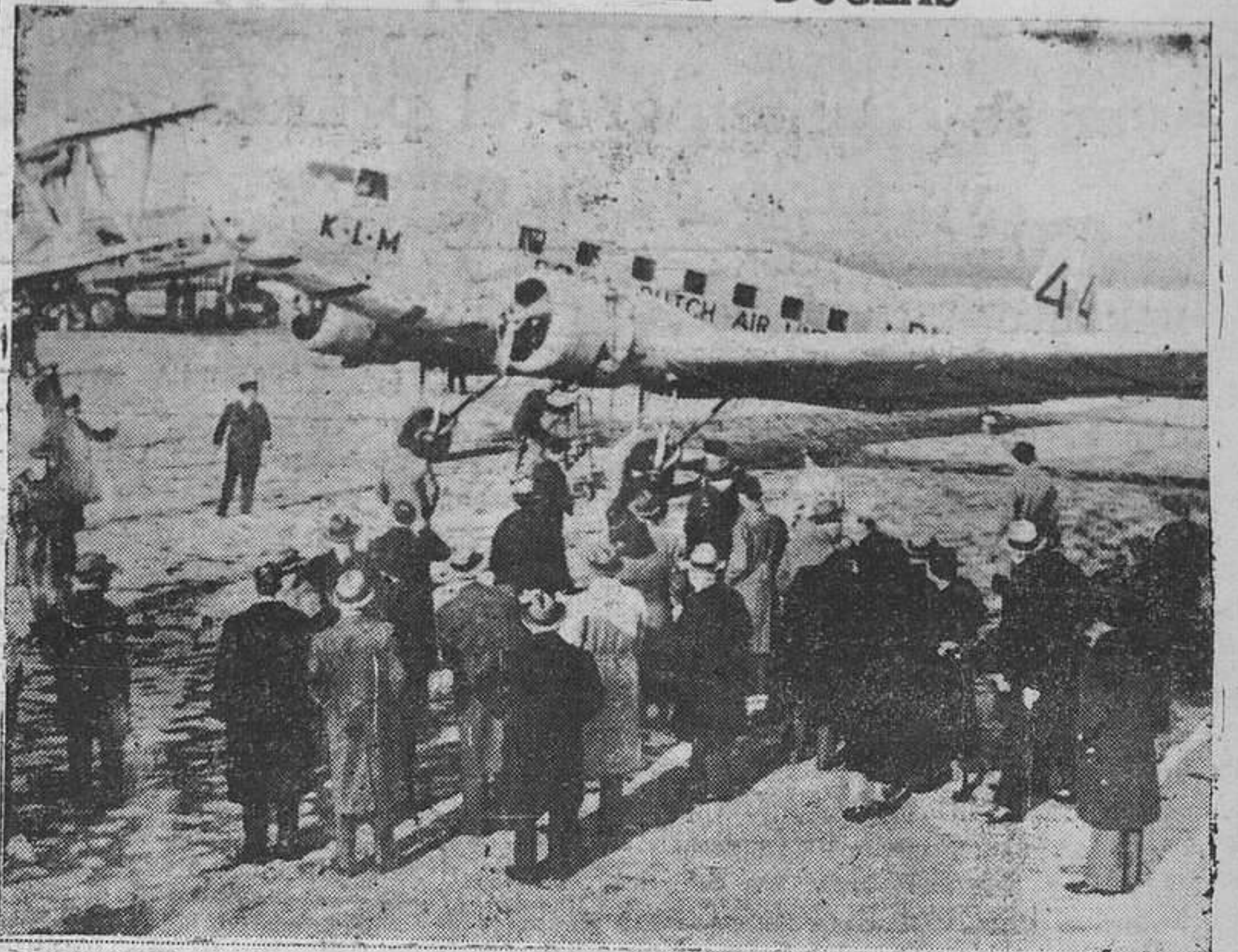
El avión holandés "Duglas", que participó en el "raid" Londres-Australia, y que recientemente salió de Amsterdam con 30.000 cartas de Navidad para Batavia, y del que no se tienen noticias desde su salida de El Cairo. Se teme que se haya extraviado. He aquí el "Duglas" al emprender el vuelo.