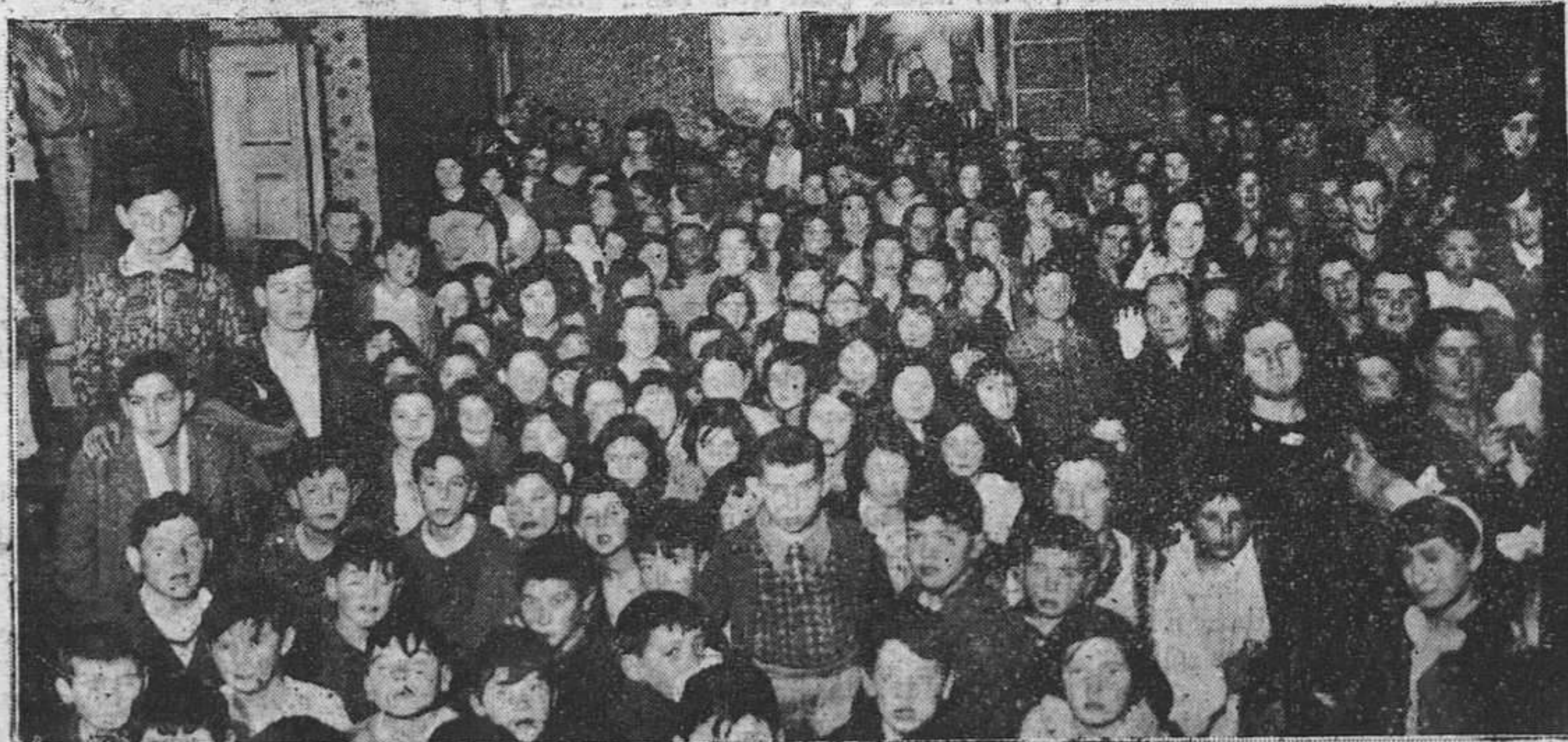
Un aspecto del salón del Instituto de Puericultura durante el acto de reparto de prendas celebrado ayer.