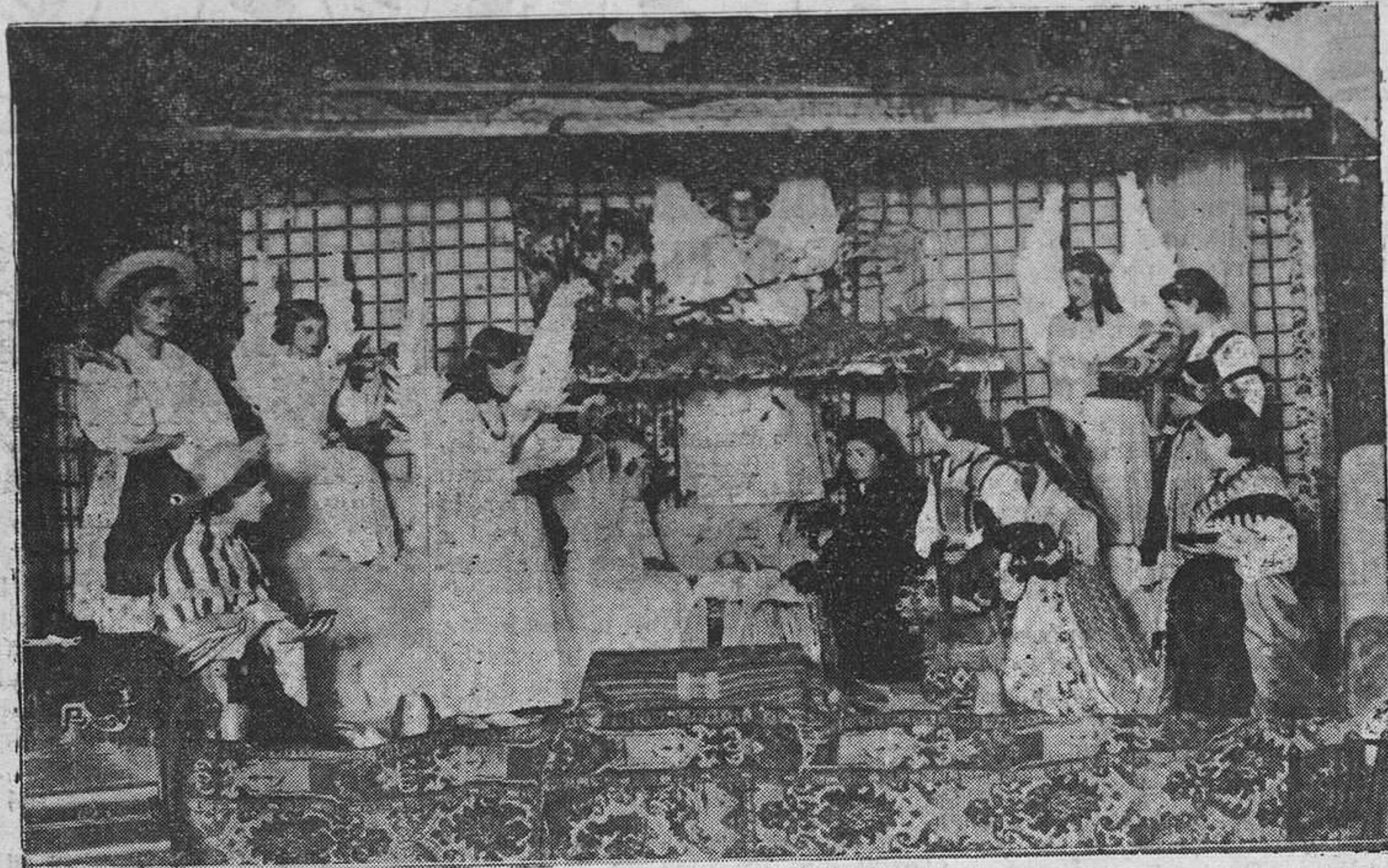
Una escena del festival celebrado ayer en Acción Católica de la Mujer, en honor de los niños de la Catequesis de San Lázaro.

También en el domicilio social de Acción Católica de la Mujer ha habido un hermoso y simpático acto con motivo de la festividad religiosa de ayer.