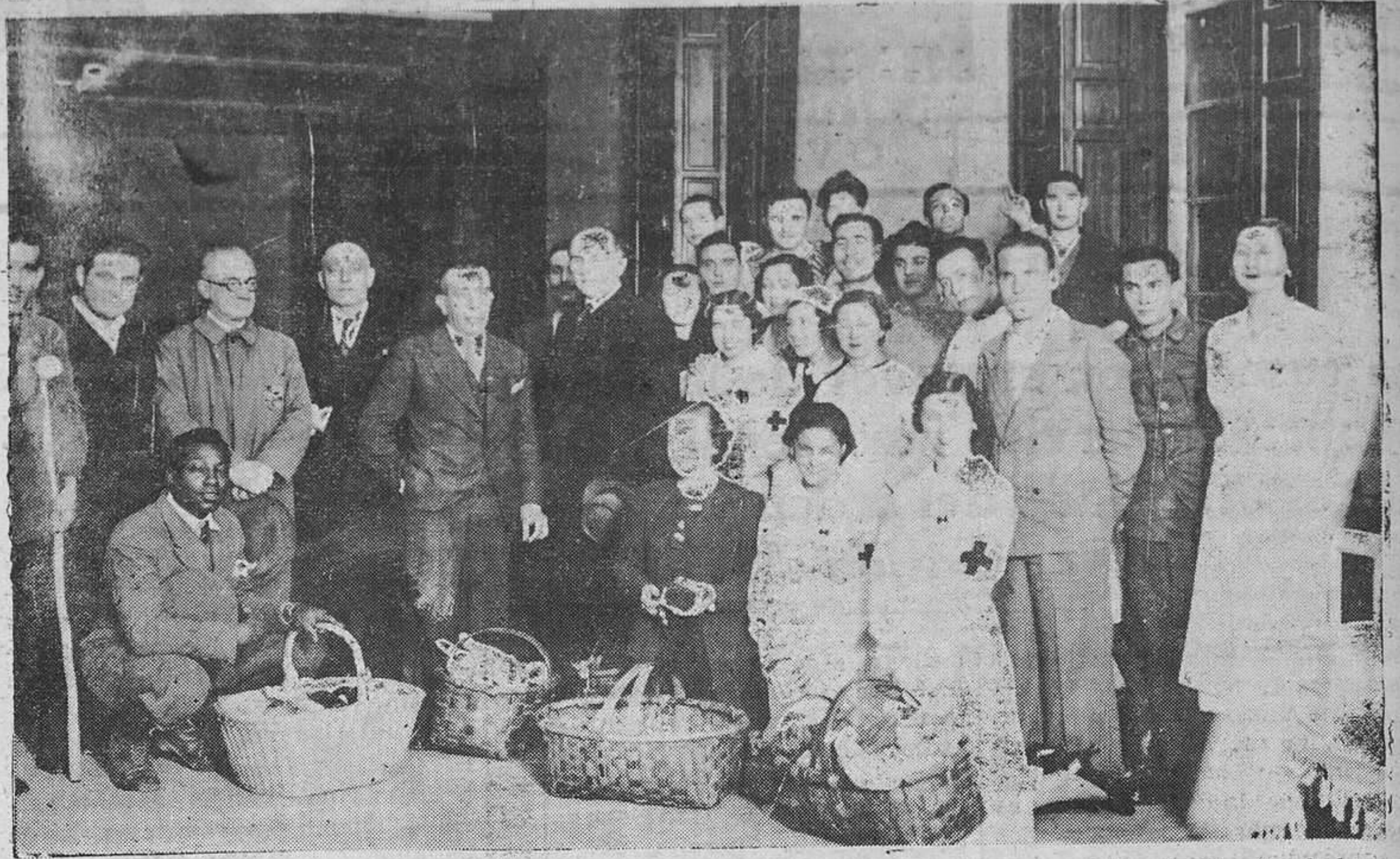
Señoritas y miembros de la Cruz Roja que asistieron a la comida extraordinaria de Nochebuena a los heridos y enfermos del Hospital.