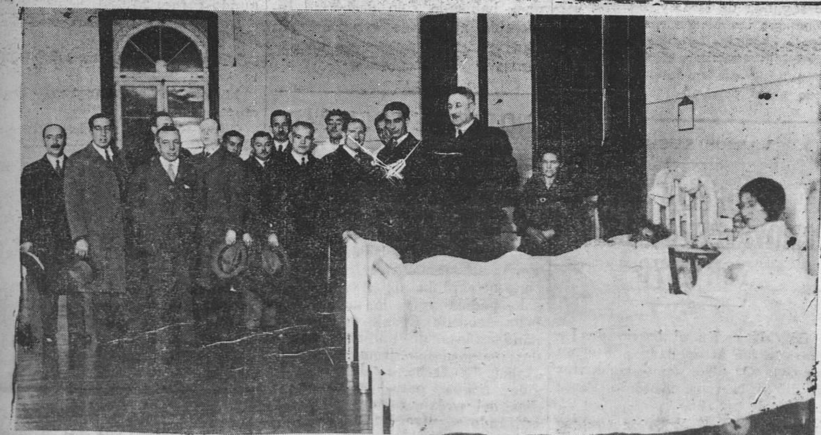
Las autoridades en la visita hecha a los enfermos del Hospital con motivo de la cena extraordinaria de Nochebuena, figurando entre aquellos el gobernador señor Velarde.