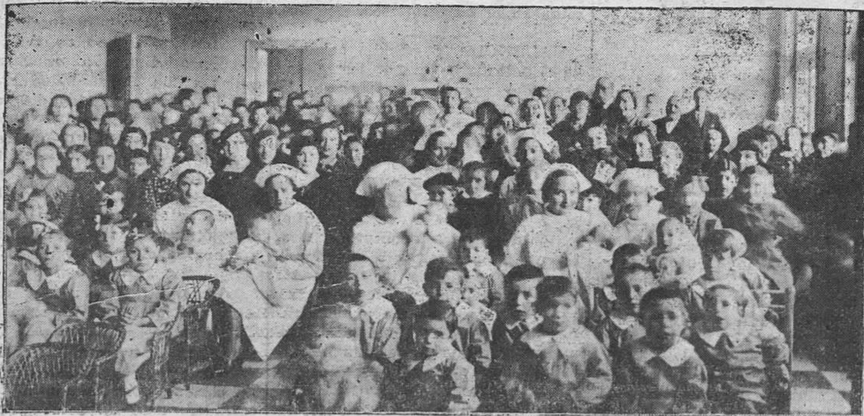
Un aspecto del teatro instalado en Acción Católica de la Mujer, durante el festival en honor de las niñas de la Catequesis de San Lázaro.