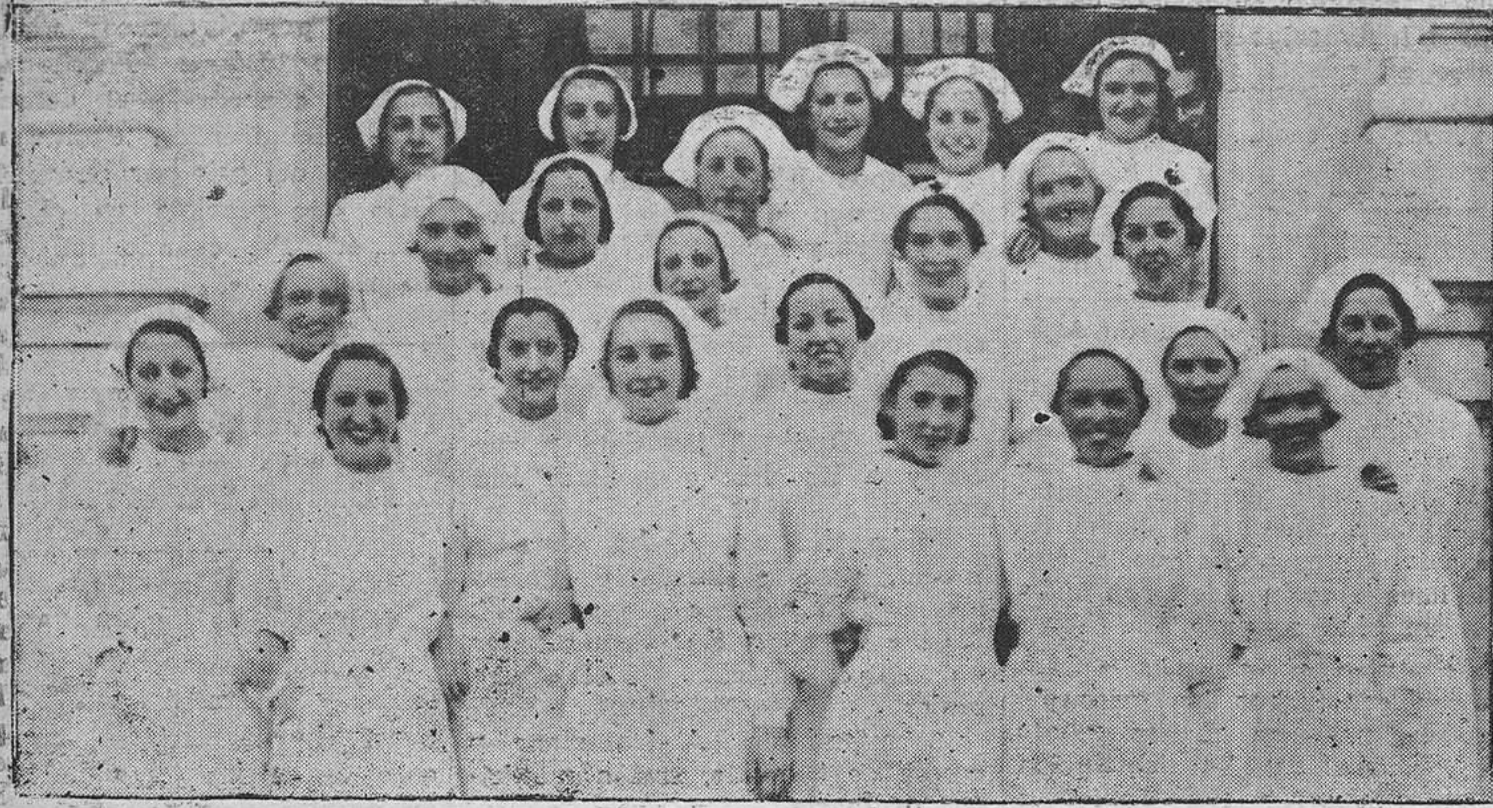
Bellas y distinguidas señoritas ovetenses que prestaron entusiástica mente su altruista labor en el Instituto de Puericultura, al cui dado de los huerfanitos.