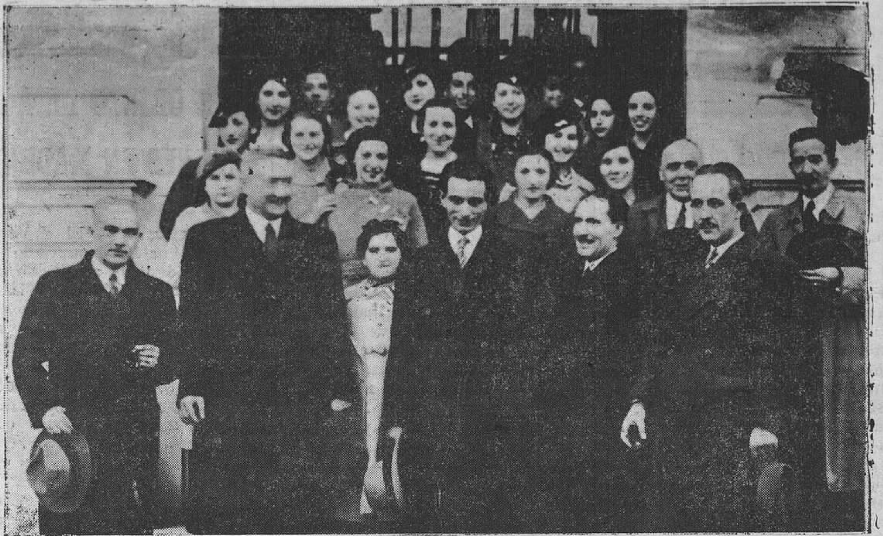
Grupo de concurrentes al acto celebrado ayer en el Instituto de Puericultura. En primer término, las autoridades locales.