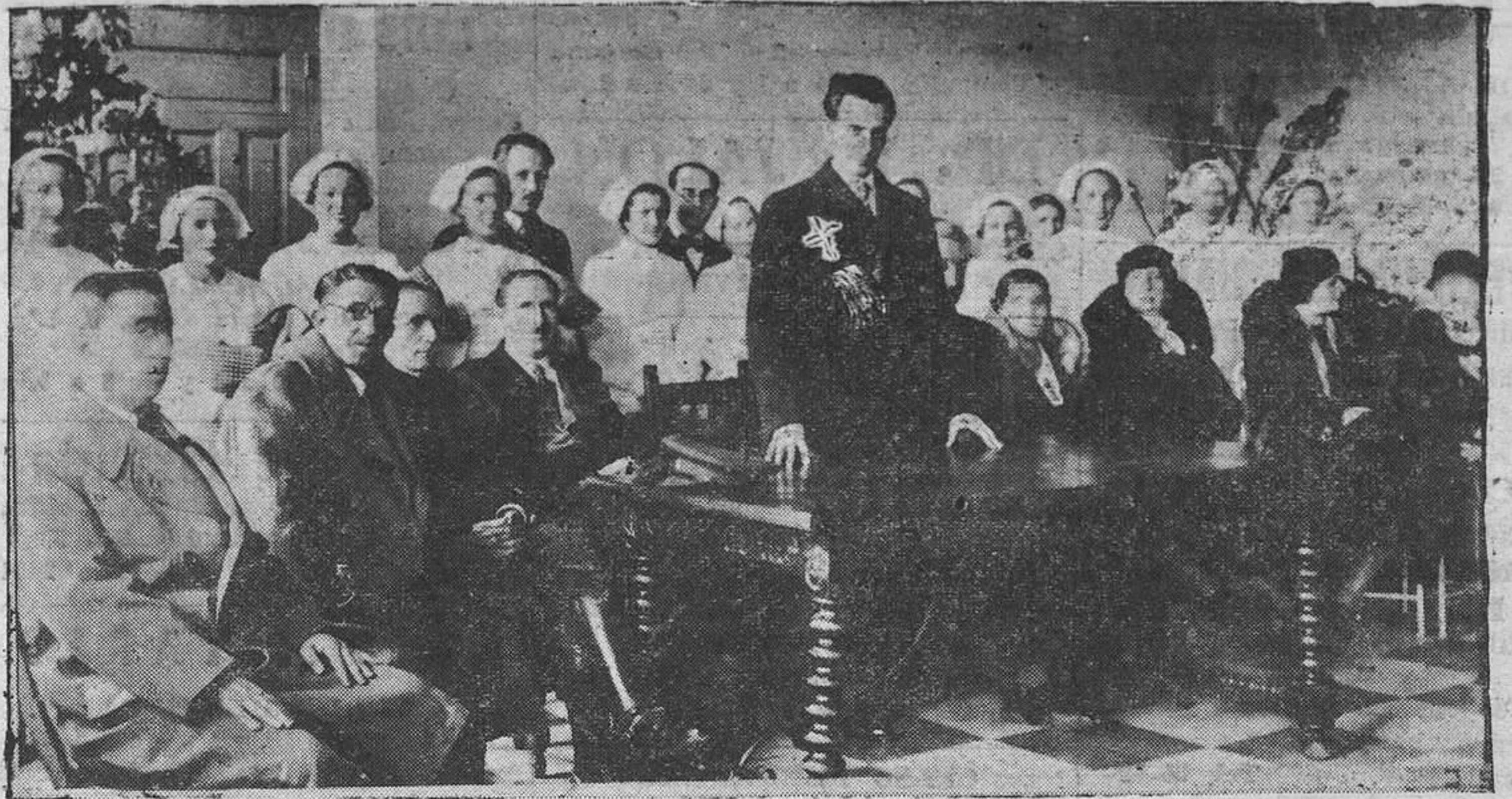
Durante el acto celebrado en el Instituto de Puericultura, el Gobernador general, señor Velarde, (X) pronunció un bello discurso de tonos elevados, ensalzando la labor en favor de los niños humildes.