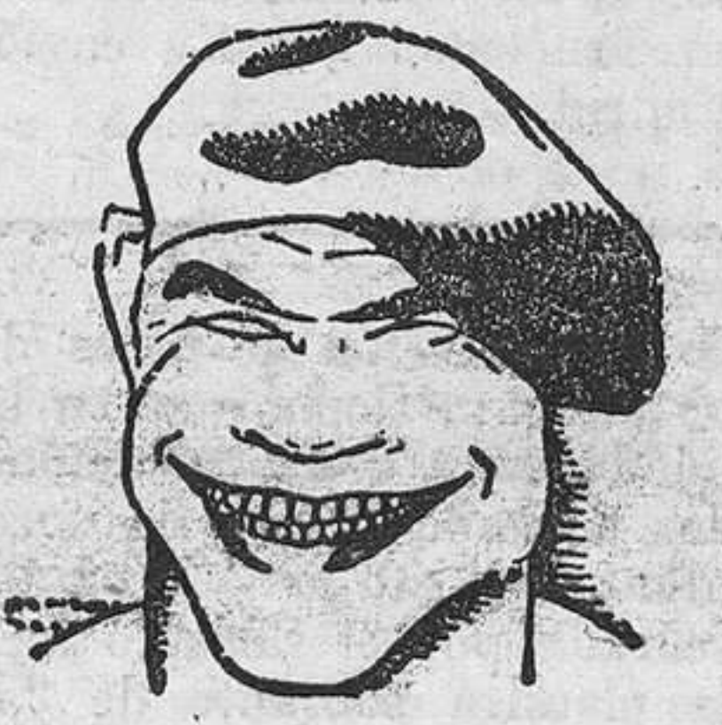
El gran Paulino Uzcudum, que el día 5 de enero peleará con Primo Carnera en Buenos Aires.

El Madrid alineó el siguiente equipo: Ridrigo; Bonet, Quesada; Sauto, Valle, López; Eugenio, Valle II, Gurruchaga, Hilario y Lazcano.