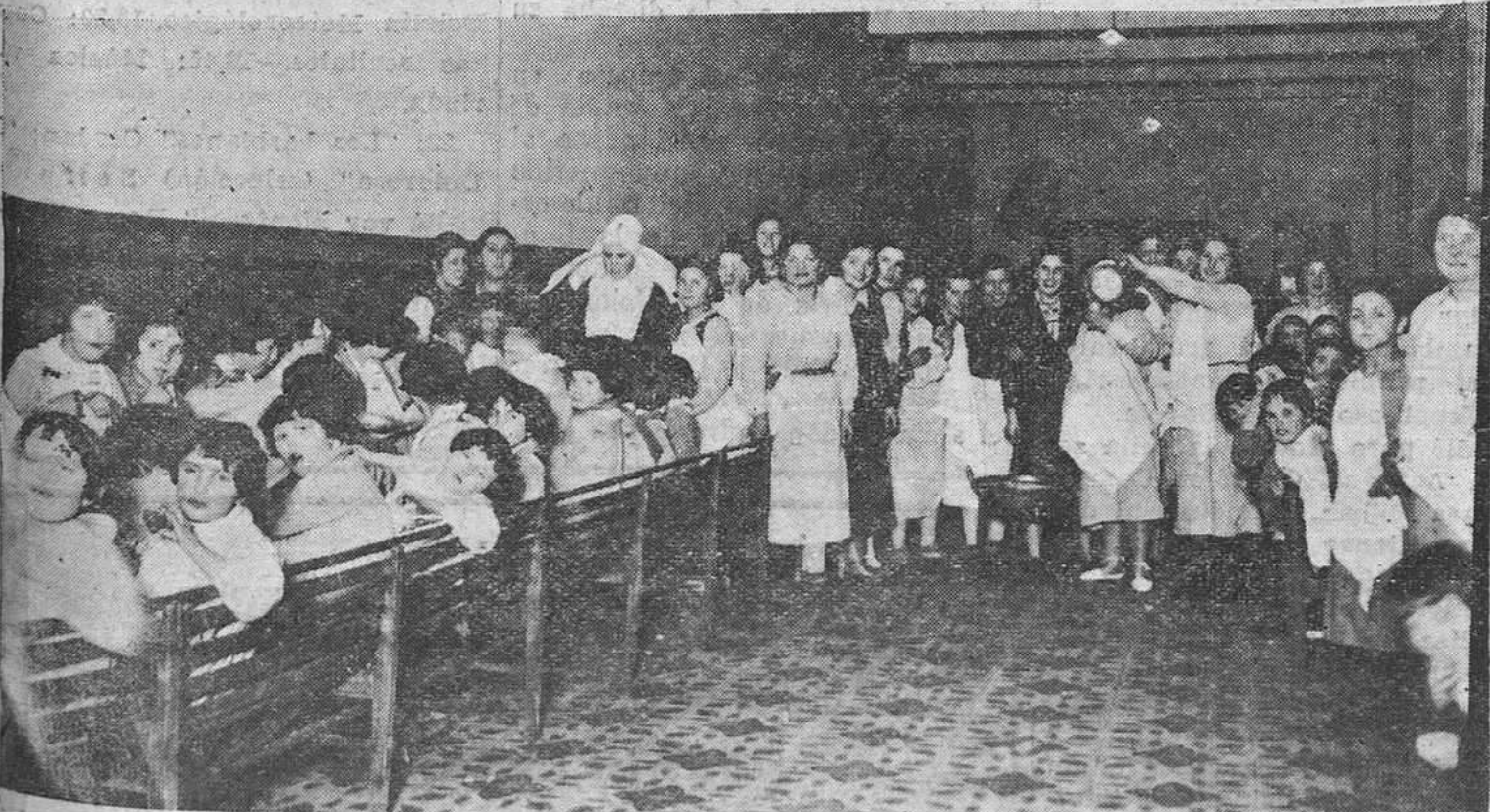
Los niños de la Residencia provincial, siguiendo la costumbre de años anteriores fueron obsequiados ayer con una comida extraordinaria, en la que no faltaron los turrónes y mazapanes. La comisión provincial, tuvo especial interés que en estos días, tanto los niños asilados en dicho establecimiento, como los enfermos del Hospital y los ancianos de la Caridad de San Lázaro, disfrutaran de las clásicas fiestas de Nochebuena y Navidad.