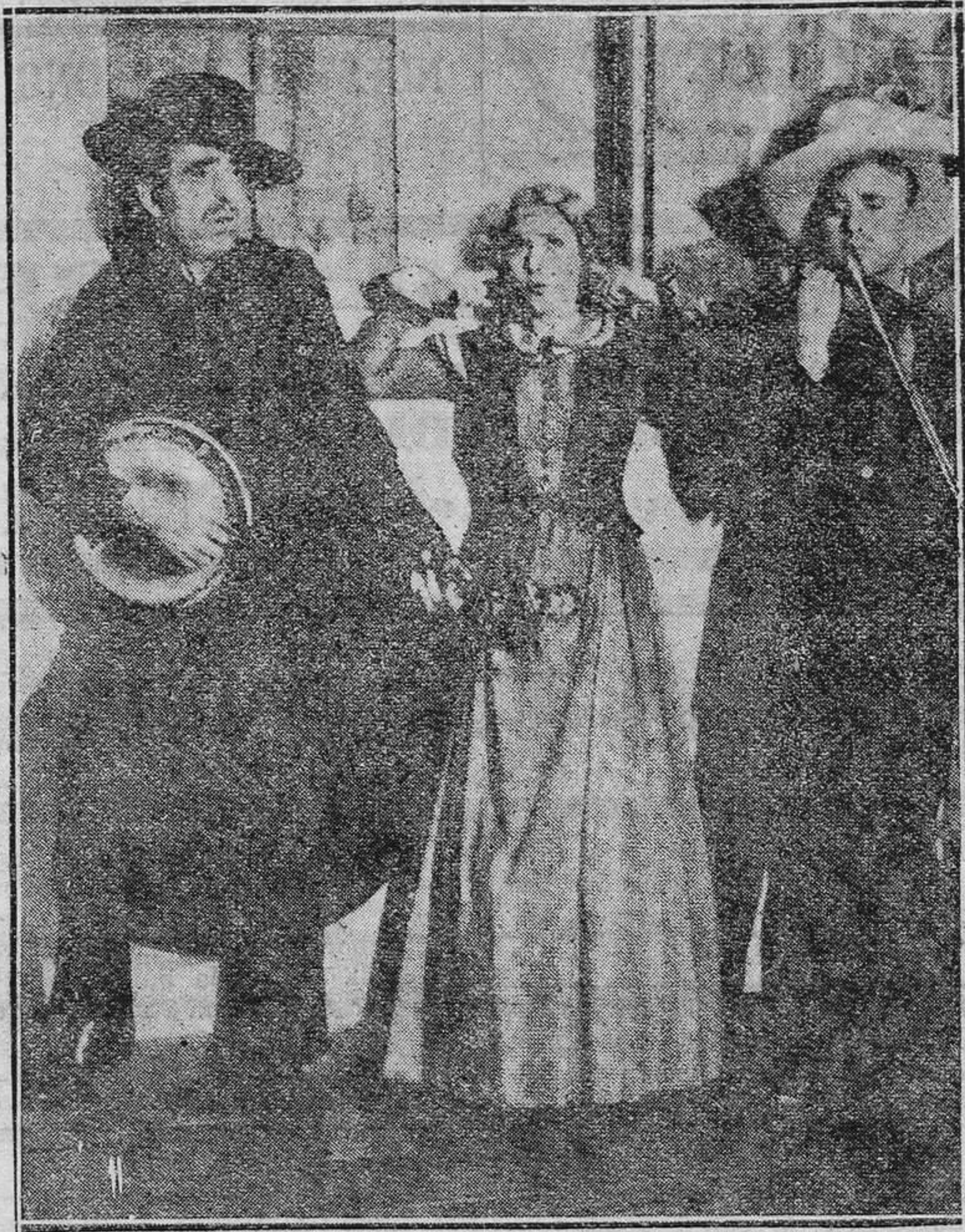
La que se tapa los oídos para no escuchar estas armonías, es Mary Pickford, y de los que le dan esta serenata a domicilio, el de la derecha y el del inmenso sombrero, es Charlie Chaplin, y el de la izquierda, pulsando el banjo desafiado, el marido de Mary, Douglas Fairbanks