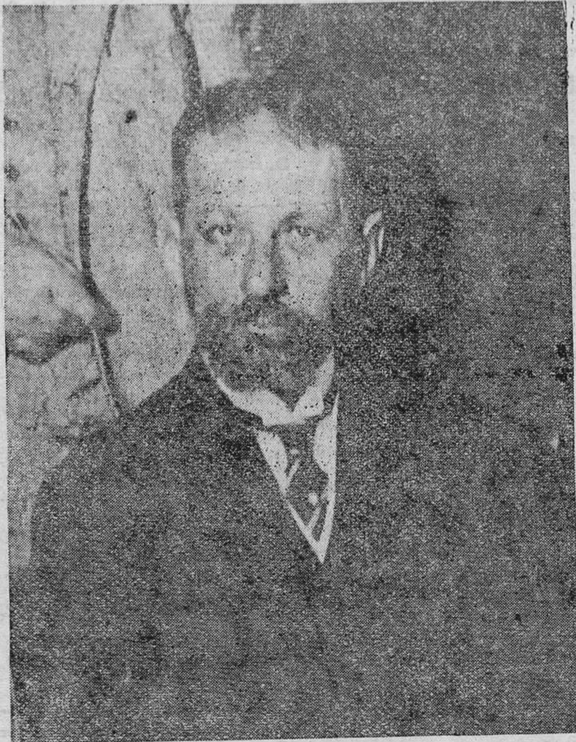
El ex presidente de Cuba, general Menocal, que ha regresado a su país con motivo de la huida del general Machado