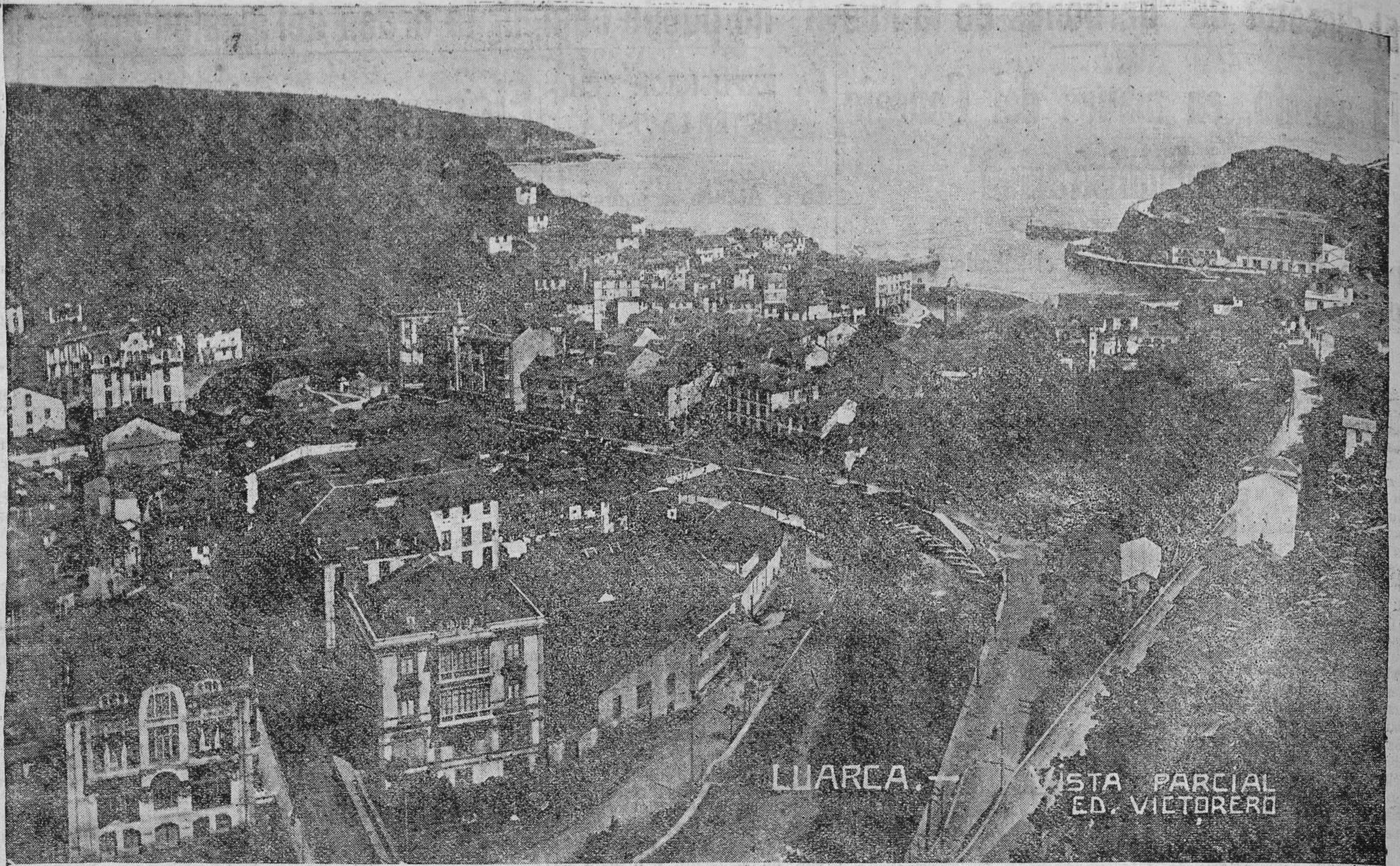
LUARCA.—Una espléndida vista parcial de la hermosa villa.

PARALISIS INFANTIL El mejor preventivo BOMBONES RIQUER EURINOL SOLDUGA Farmacia Estrada FOTO-FILM La casa mejor surtida en toda clase de artículos fotográficos. JOVELLANOS, 27.—G I J O N