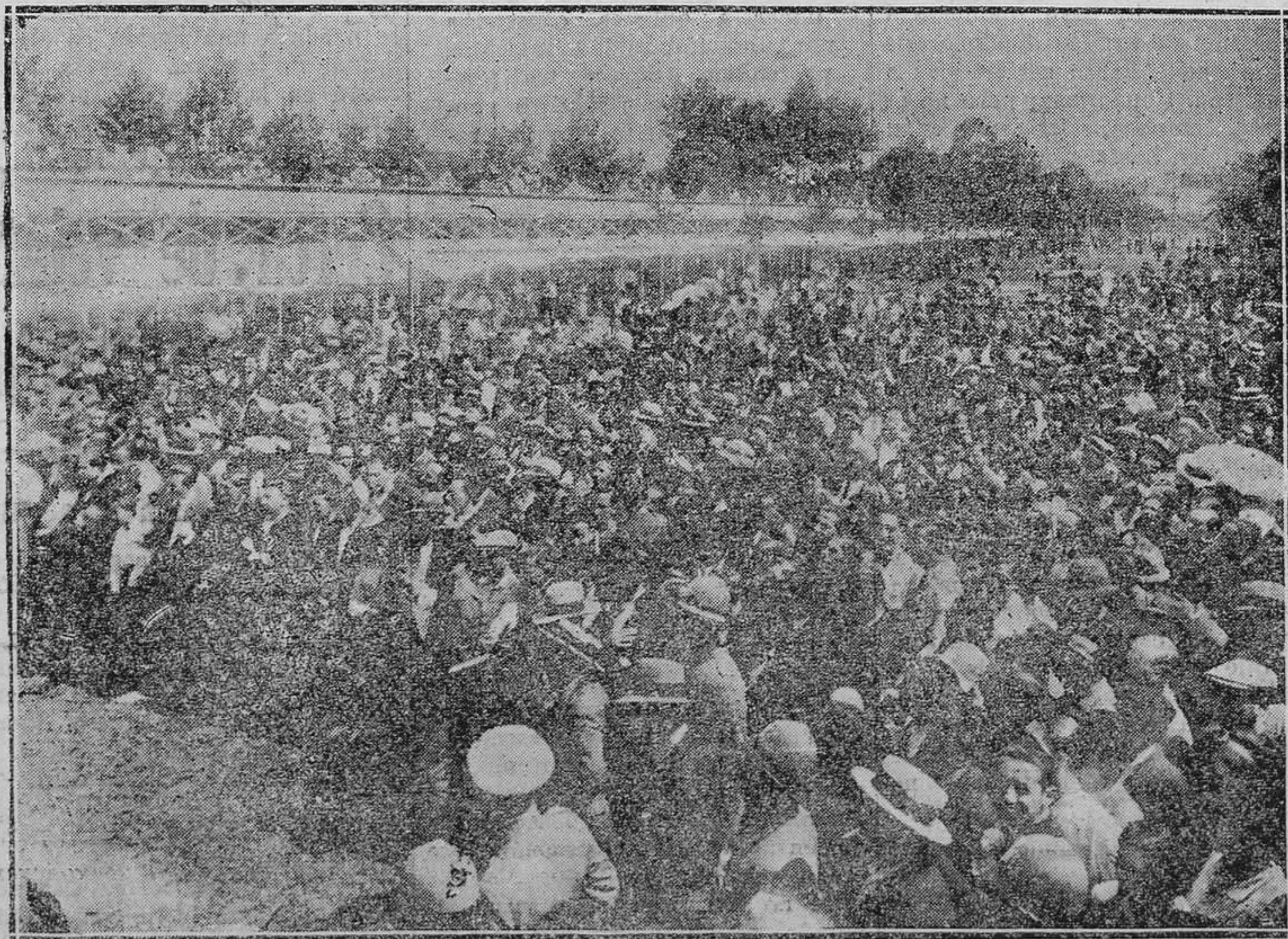
AVILES.—Un detalle de la extraordinaria concurrencia que en la explanada de la Exposición precedió el desfile de los ejemplares premiados