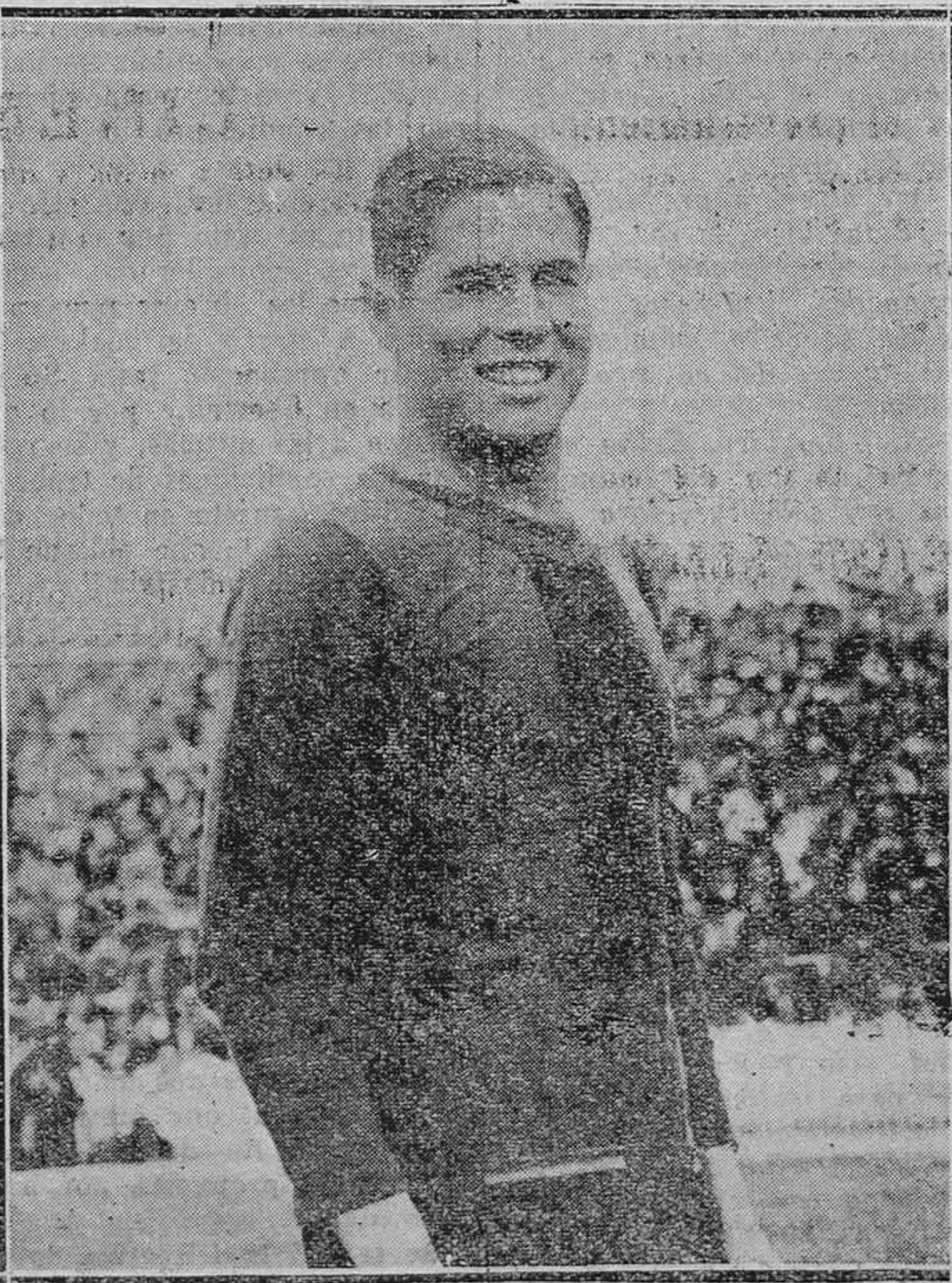
Arocha, gran jugador canario, es la figura de actualidad deportiva en toda España. El canario se resiste a firmar por el Barcelona; el Español quiere contar con su concurso; el Oviedo le hace "tilín, tilín". ¿Para dónde, Arocha? La solución... en septiembre. Ya verá usted.