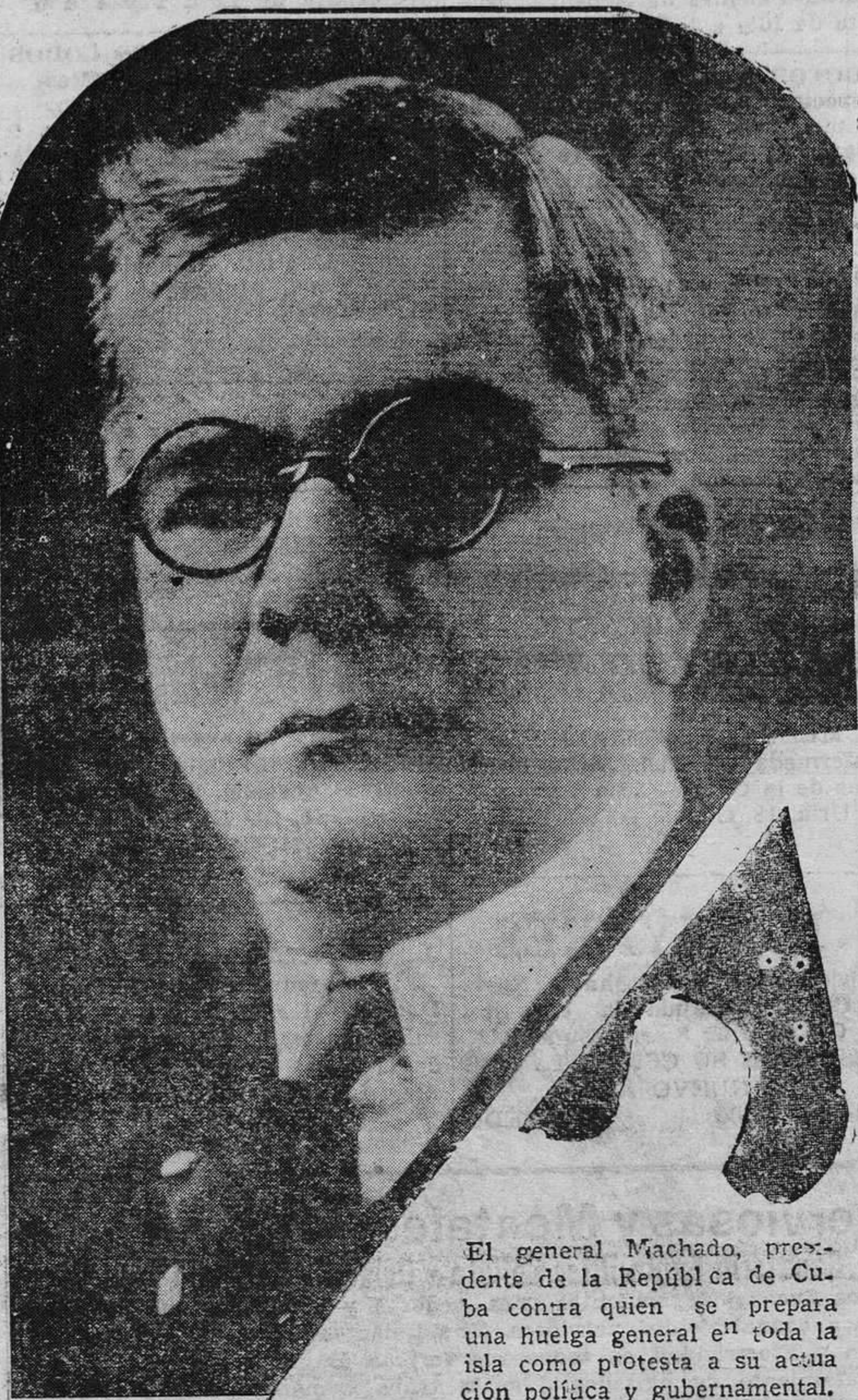
El general Machado, presidente de la República de Cuba contra quien se prepara una huelga general en toda la isla como protesta a su actuación política y gubernamental.

El ayudante del chófer sufre gravísimas heridas.