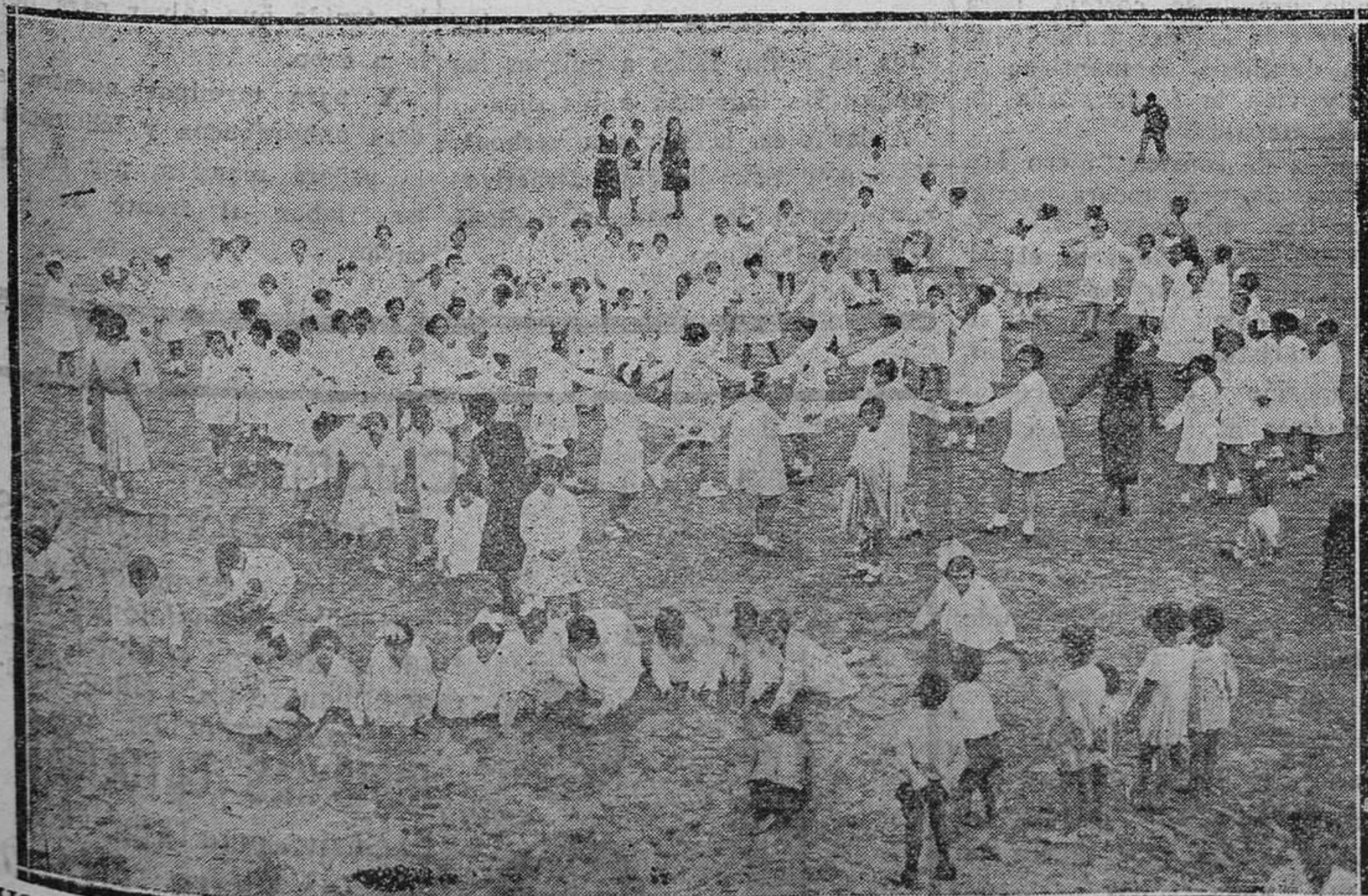
GIJÓN.—Las niñas de la colonia escolar madrileña juegan alegremente en la playa.

Redactor corresponsal en Gijón, don Corsino Ordiz, Linares Rivas, 17.