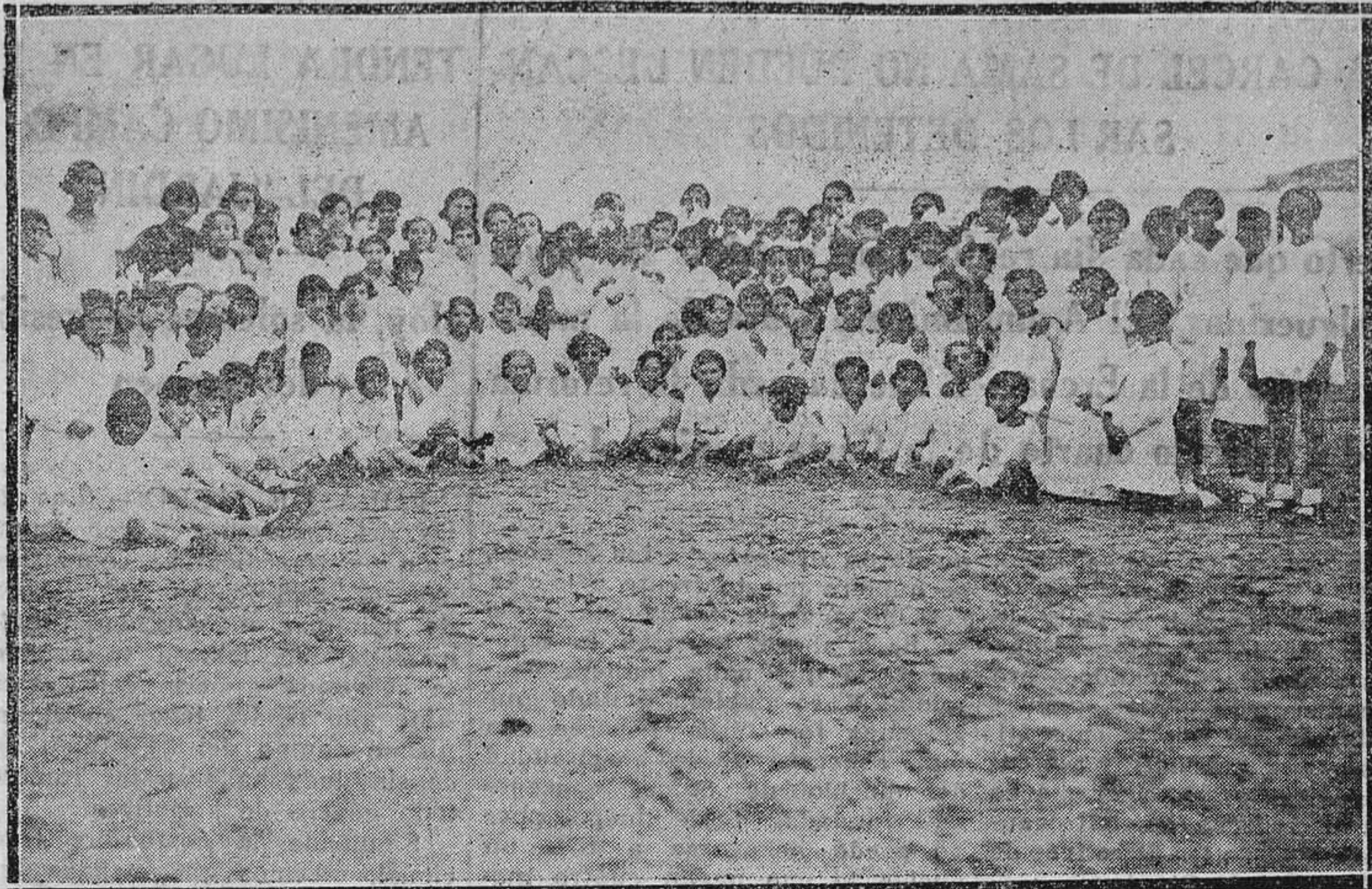
GIJÓN.—La colonia escolar madrileña de niñas en la playa de San Lorenzo.

En la misma asamblea en que se trató el anterior asunto, se examinó el referente a la actuación del Sindicato de Defensa de Intereses Públicos, y se acordó publicar un manifiesto exponiendo que la organización obrera afecta a la Casa del Pueblo, está dispuesta a apoyar en todo momento a ese Sindicato, tanto en lo que se refiere a los desahucios como en las demás mejoras que tratan de obtener.