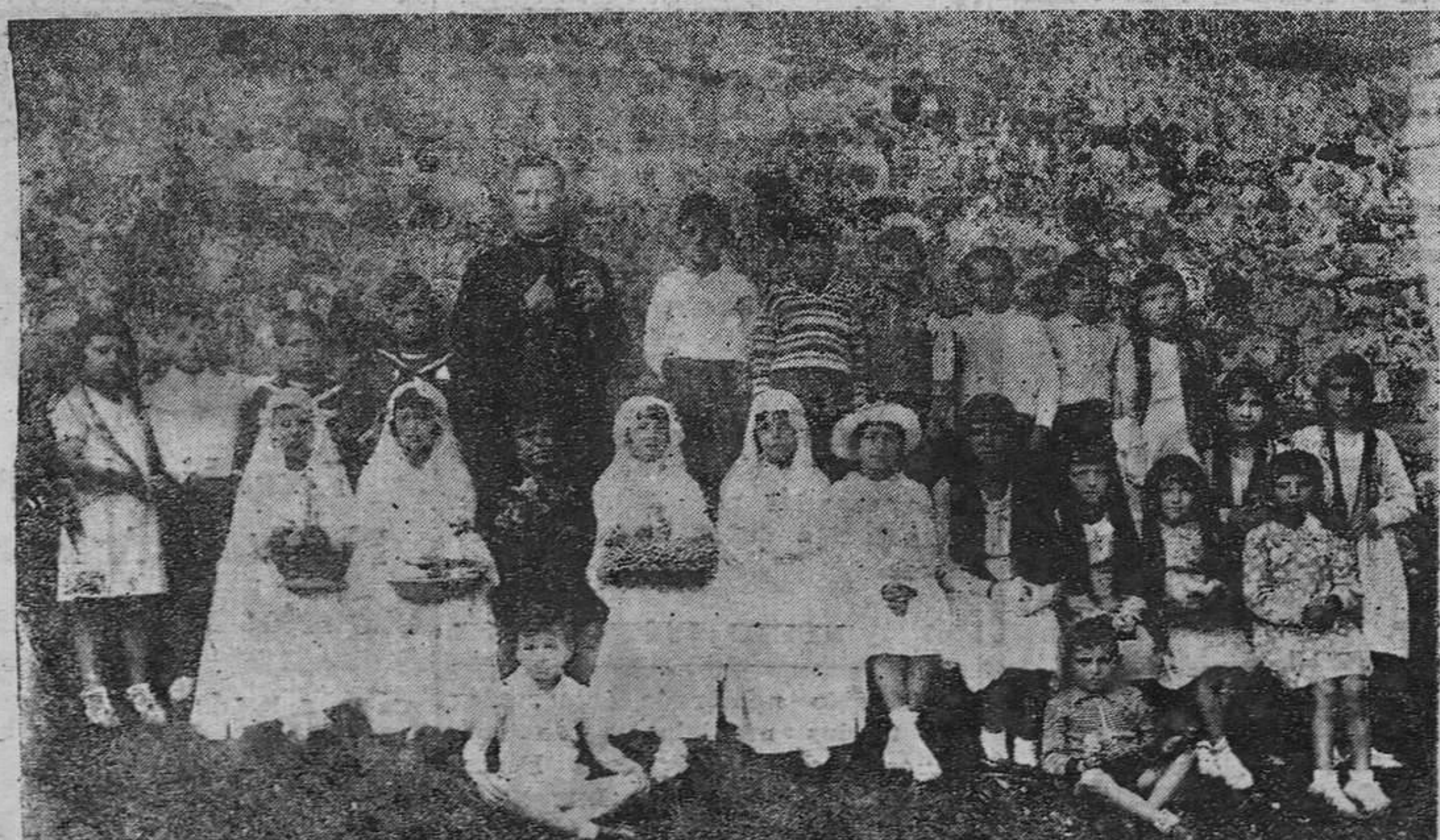
POLA DE LENA.— Grupo de niñas y niños que hicieron la primera Comunión en el pintoresco pueblito de Castiello.