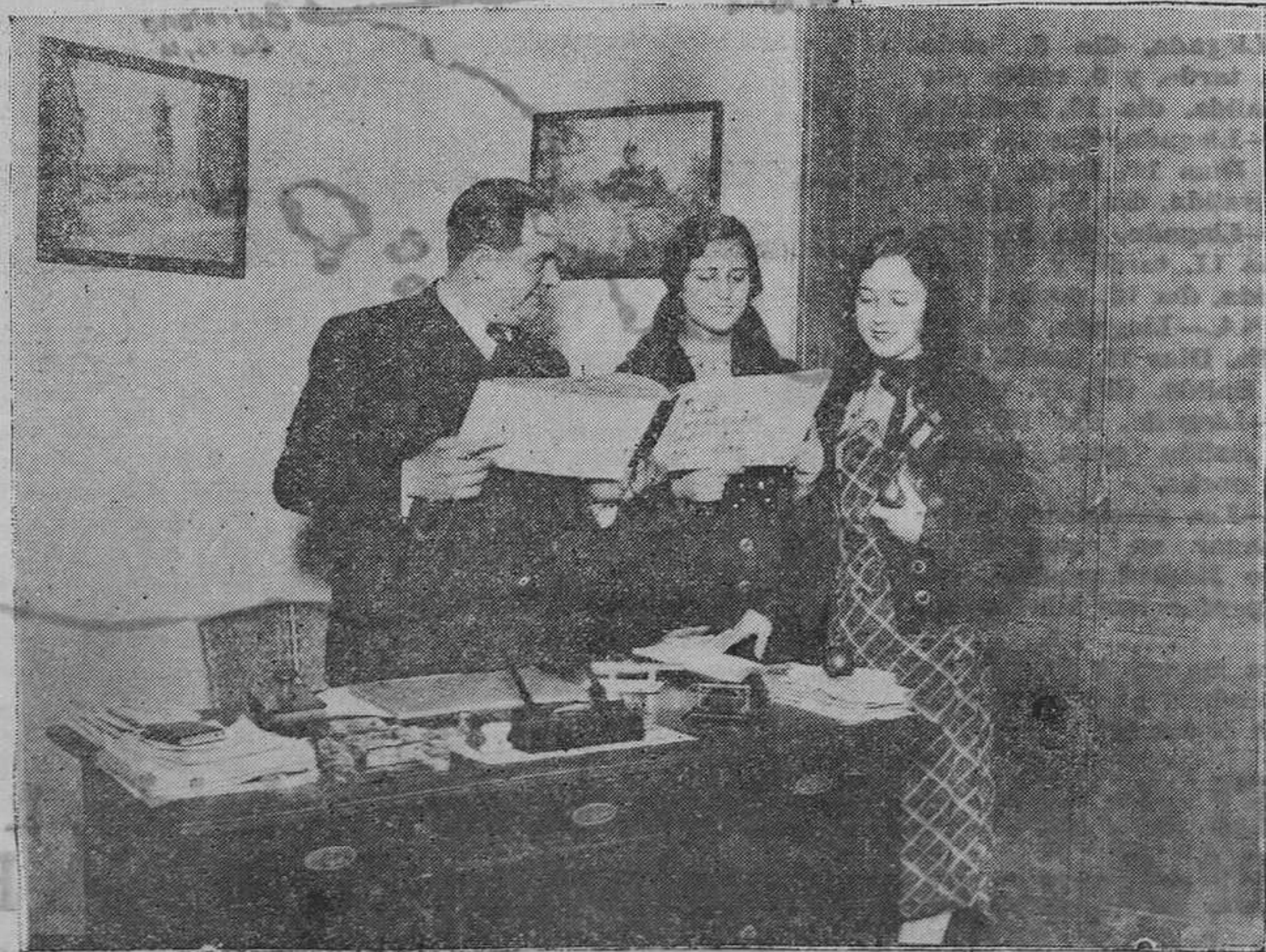
Arriba. Grupo de concurrentes al baile celebrado el jueves en el Círculo Mercantil en honor de "Miss Asturias" y de los jugadores del Athletic de Bilbao. Abajo: Momento en que el autor del álbum "Las Bellezas de Asturias" entrega un ejemplar a "Miss Asturias".