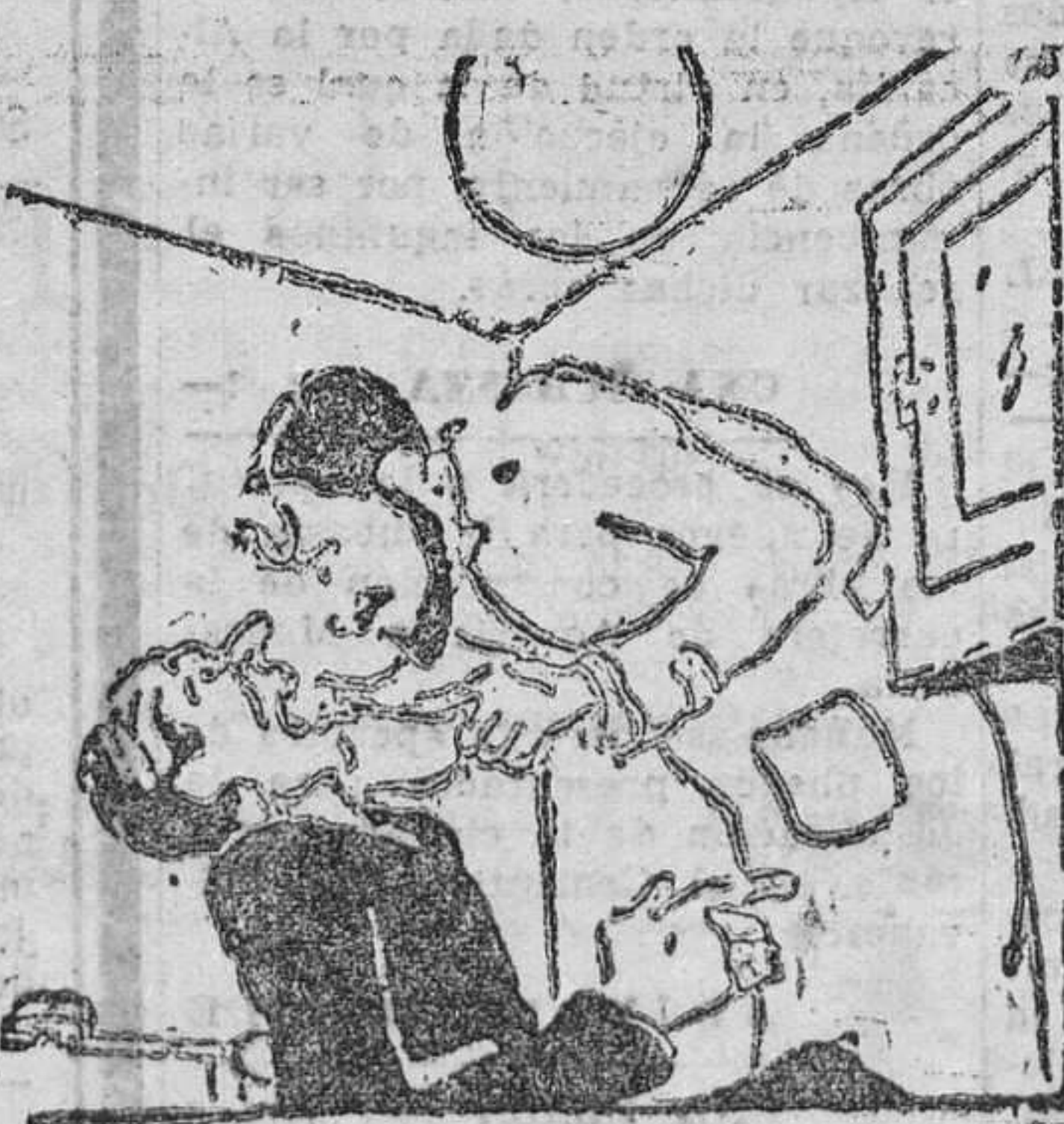
—Sí; tiene usted un absceso, pero no me preocupa nada. —Claro, si lo tuviera usted tampoco me preocuparía a mí. (De "Moustique", Charleroi.)