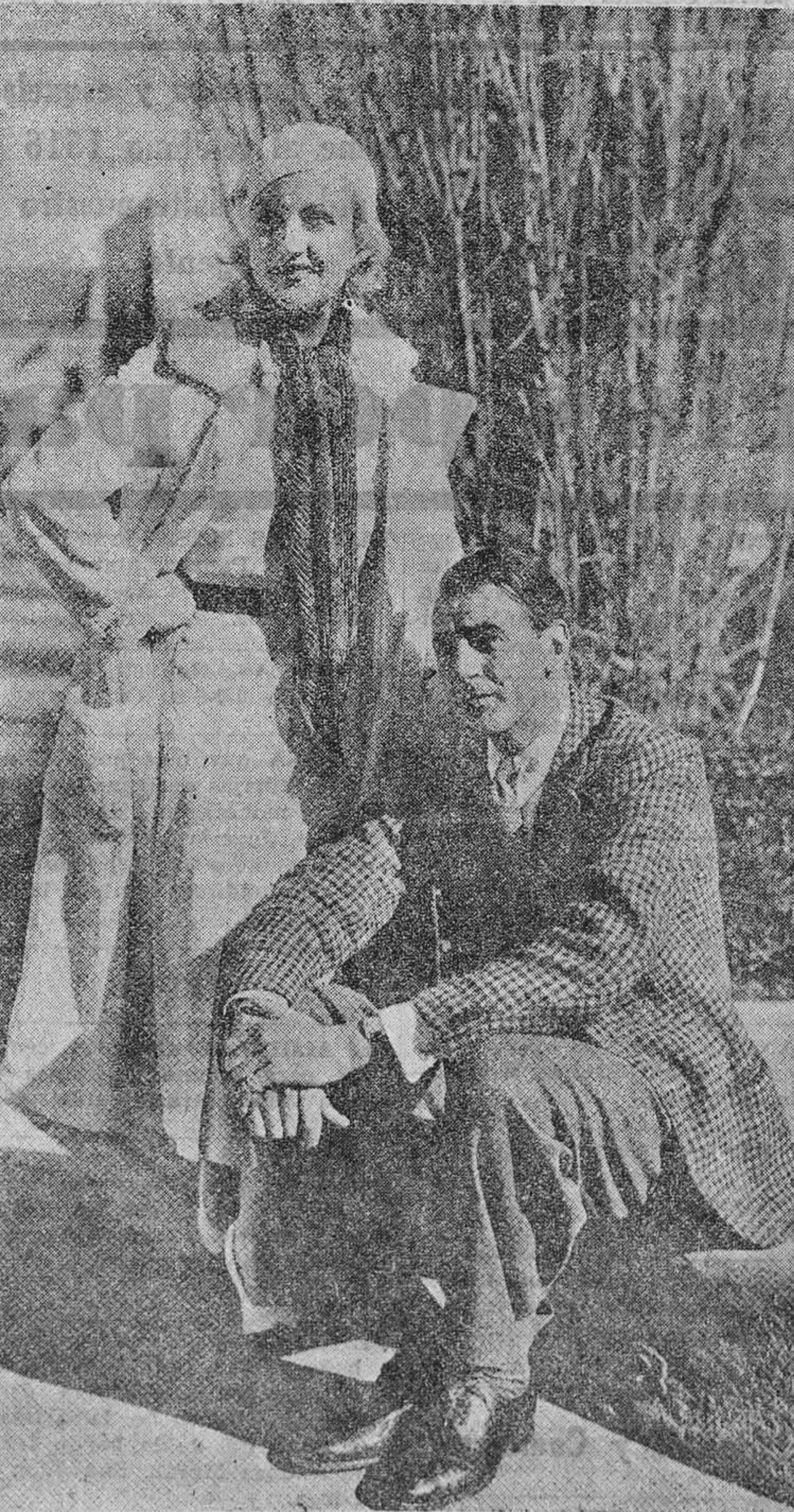
La espléndida belleza rubia de Carole Lombard alegra este rincón del jardín de los estudios Paramount, al lado de Gary Cooper, que parece encantado de haber nacido.