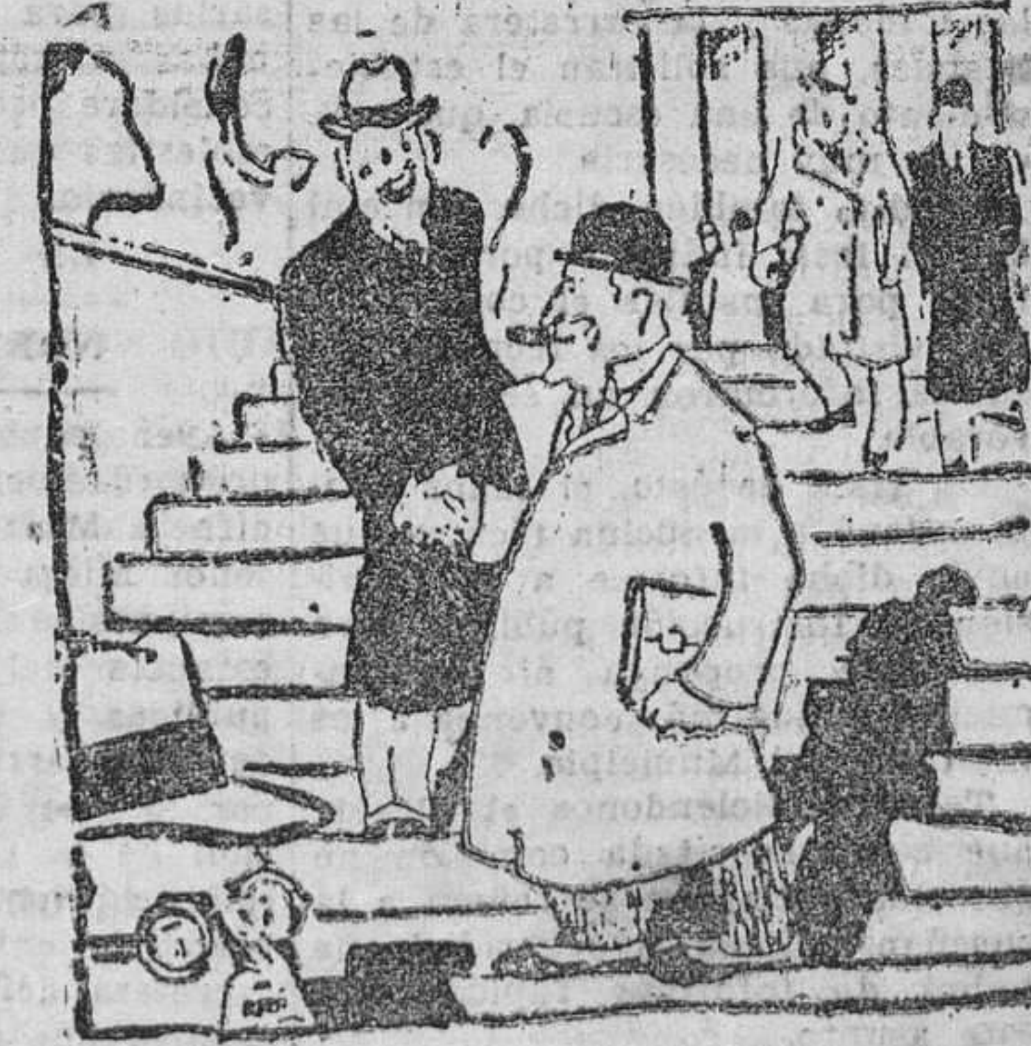
ENTRE FINANCIEROS.—¿Qué tal? ¿Ha recobrado la reputación? —Sí. Y usted, ¿continúa en la verdad provisional? (DE "Ric-Rac", París.)