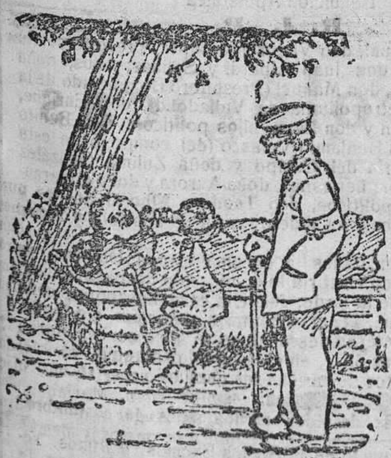
EL GUARDA.—Son las diez y vamos a cerrar las puertas. EL VAGABUNDO.—Gracias, guarda; por fin voy a poder dormir tranquilo.

Es ridículo que la conferencia de Ginebra haya aplazado sus trabajos hasta conocer la declaración de Hitler. ¿No la conoce ya? ¿O es que espera que el canciller, aconsejado por sus augures, sabrá hallar contemporizadoras que los delegados de Ginebra recogerán para evitar el fracaso de la conferencia? Es paradójico este proceder: porque consiste en esperar del principal adversario de la paz general unas fórmulas que permitan crecer en la tranquilidad. ¿Qué gran error y qué falta de franqueza!