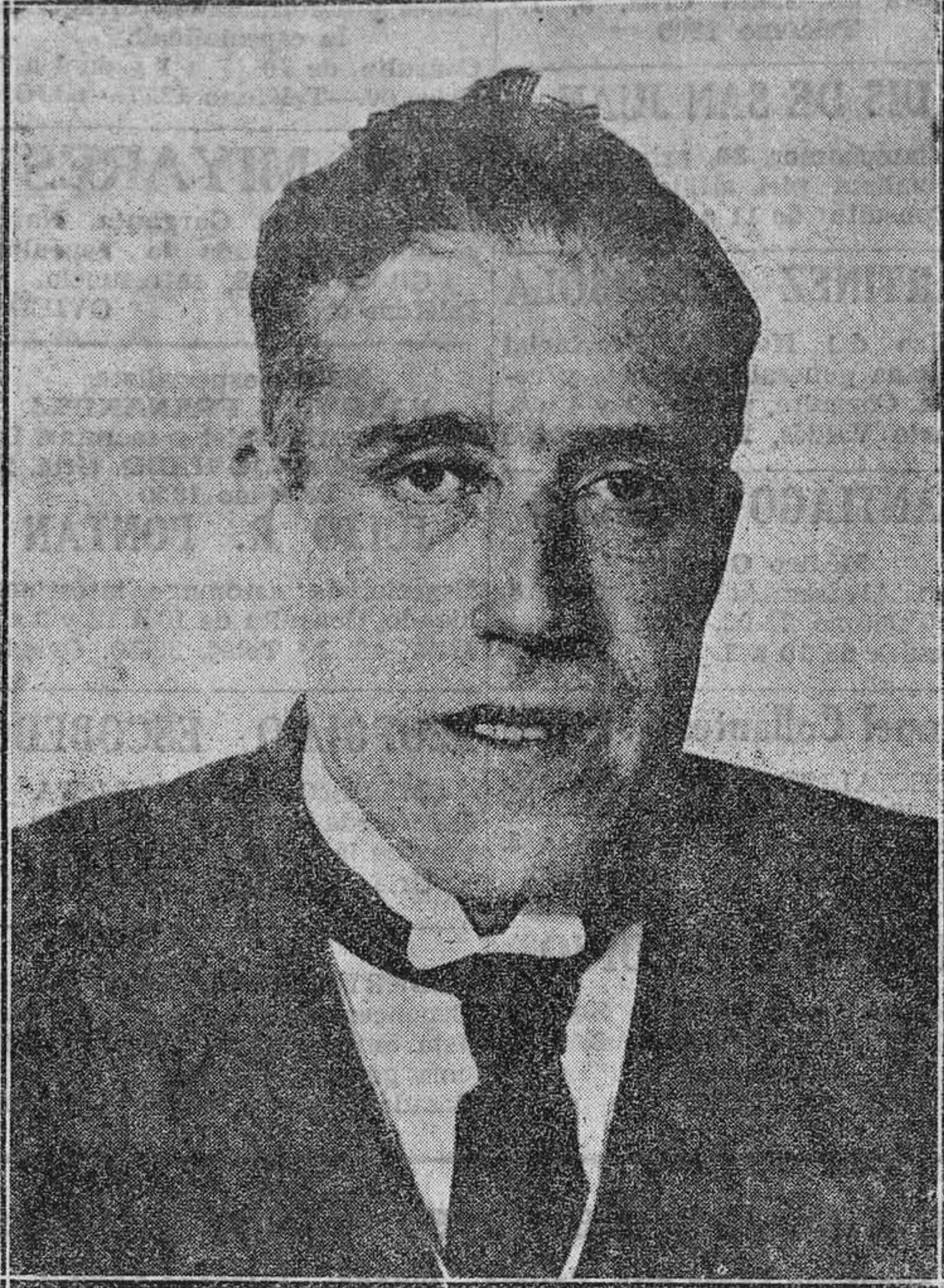
D. Julián Besteiro, presidente de las Cortes Constituyentes, a quien se interpelló anteayer en el Parlamento con motivo de la circular enviada a los organismos de la U. G. T.