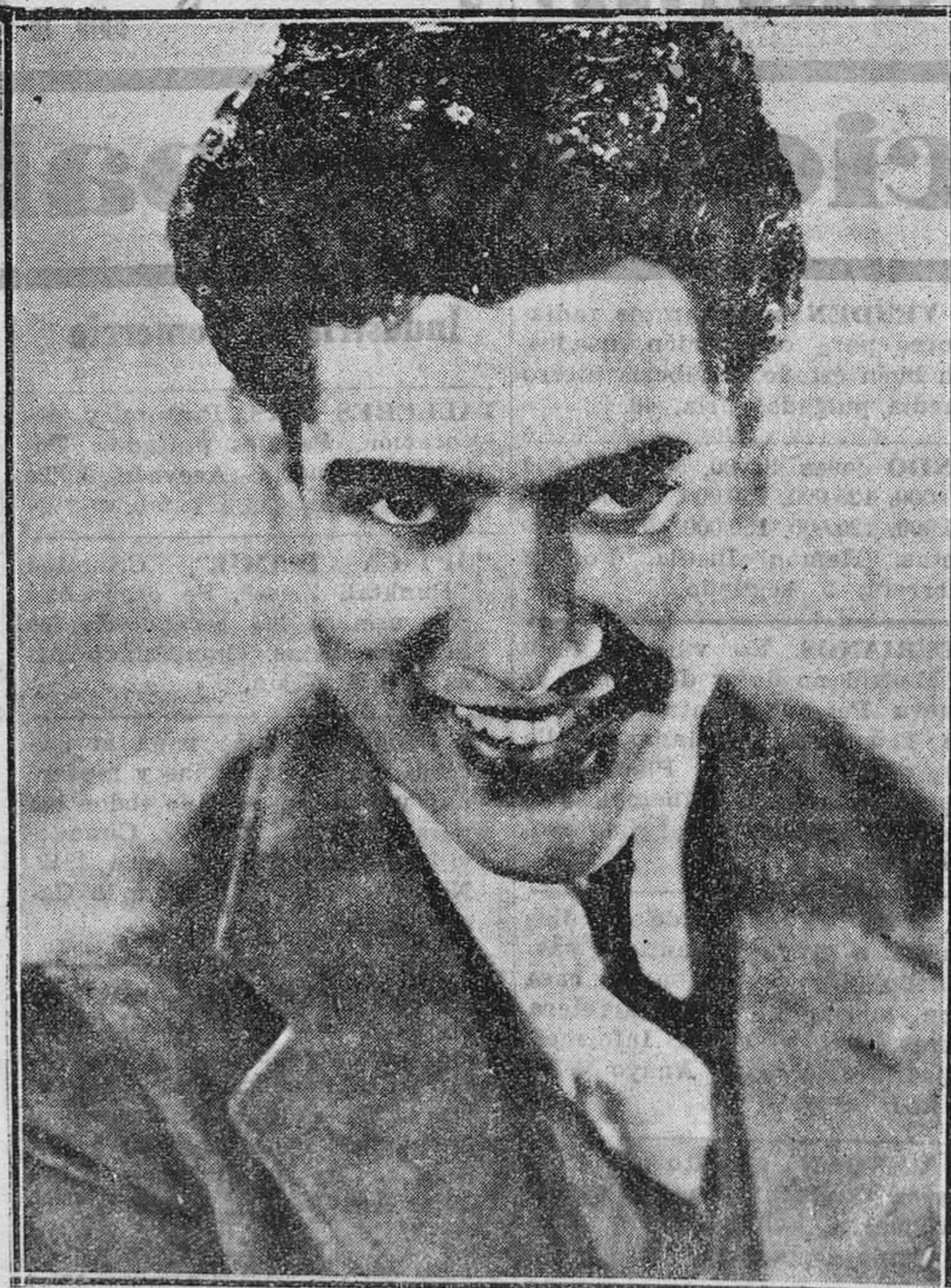
José Mojica, ídolo de los países latinos y de habla hispana. Ha filmado varias producciones habladas y cantadas en español, destacándose por su maravillosa voz y simpática figura. Entre sus producciones más recientes destacan "Mi último amor", "El caballero de la noche" y "El rey de los gitanos", que actualmente se filma en los estudios de la Fox, en Hollywood