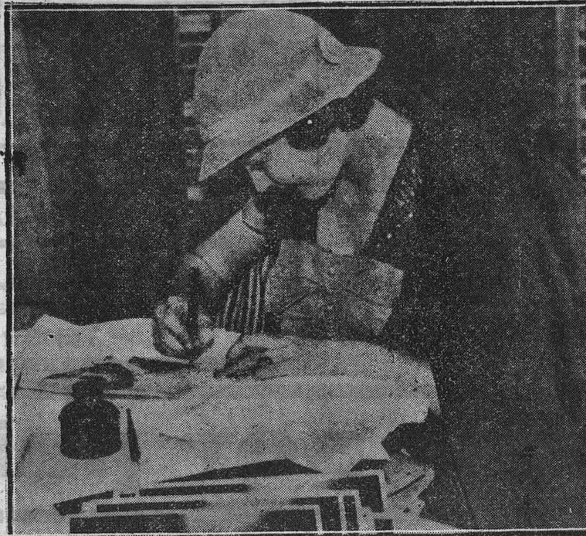
También las famosas artistas de cine tienen su penitencia. Que lo diga Sylvia Lydry, dedicada a escribir autógrafos en el transcurso de un cocktail dado en su honor recientemente.