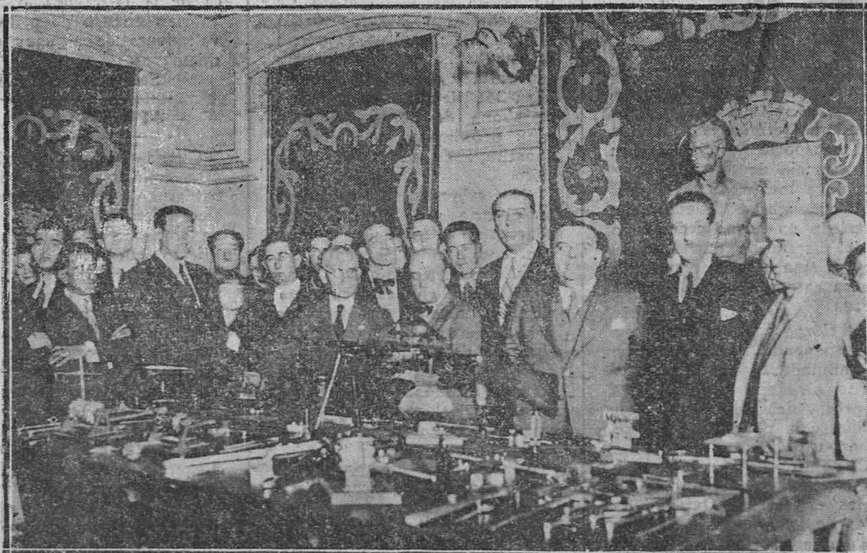
OVIEDO.—El gobernador, el alcalde y otras personalidades en el acto inaugural del Certamen del Trabajo organizado por el Orfeón Ovetense.

por segunda vez, de sexta parte ideal de labor y prado "Liosa de Rozada", en el lugar de Rozada, concejo San Martín Rey Aurelio, al tipo de 1.800 pesetas, que se celebrará a las dieciséis horas del 24 de los corrientes en la Notaría de Laviana, en la que informarán.