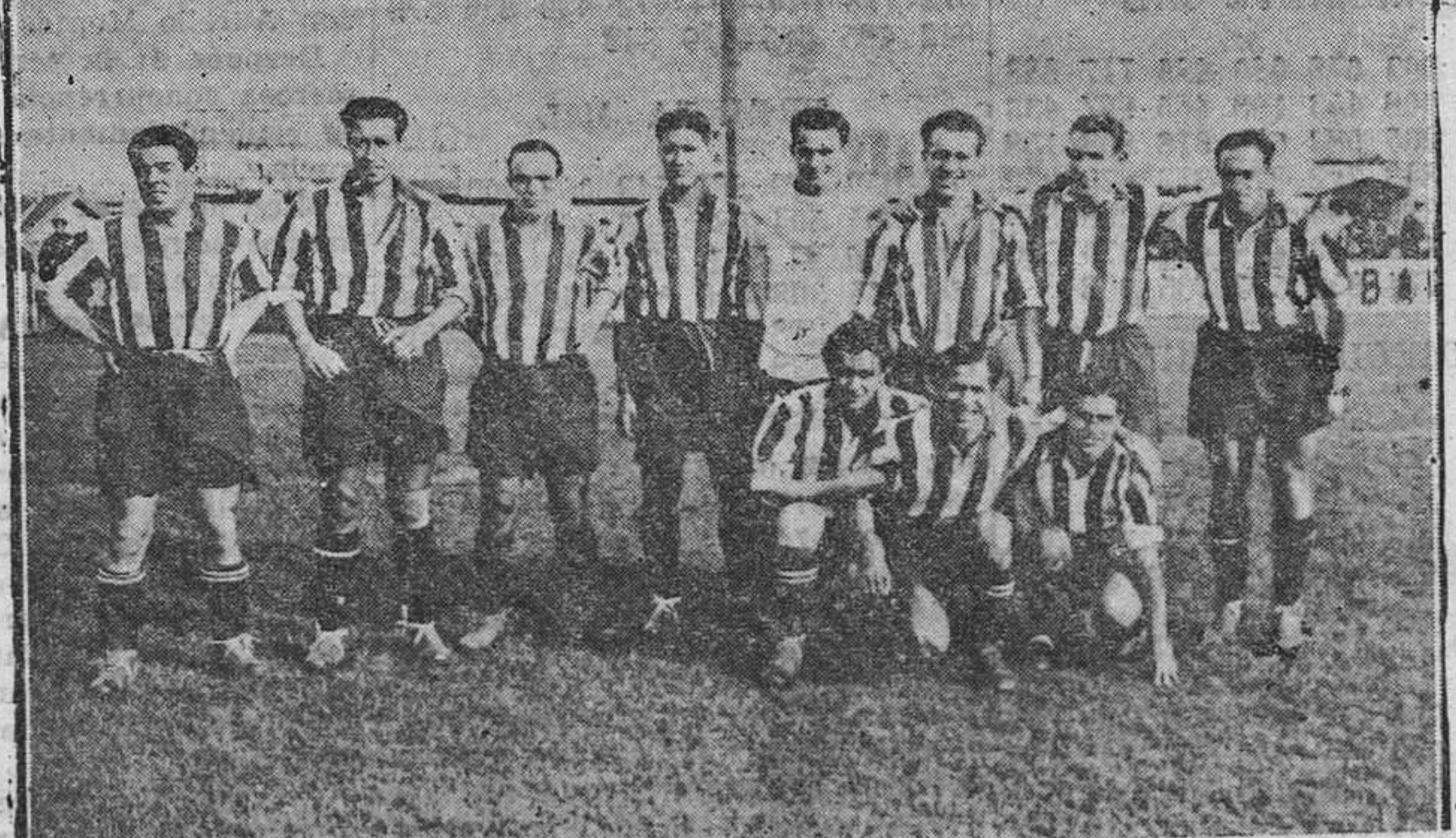
OVIEDO.—El equipo de Atlético de Madrid que ayer estuvo en Buenavista "pescando" goles.

Auguramos a este coquetón cinema Dorado grandes éxitos de público para esta temporada que ahora empieza y enviamos nuestra felicitación a la señora vinda de Rozada Paredes, por el constante sacrificio que está haciendo en beneficio del público.