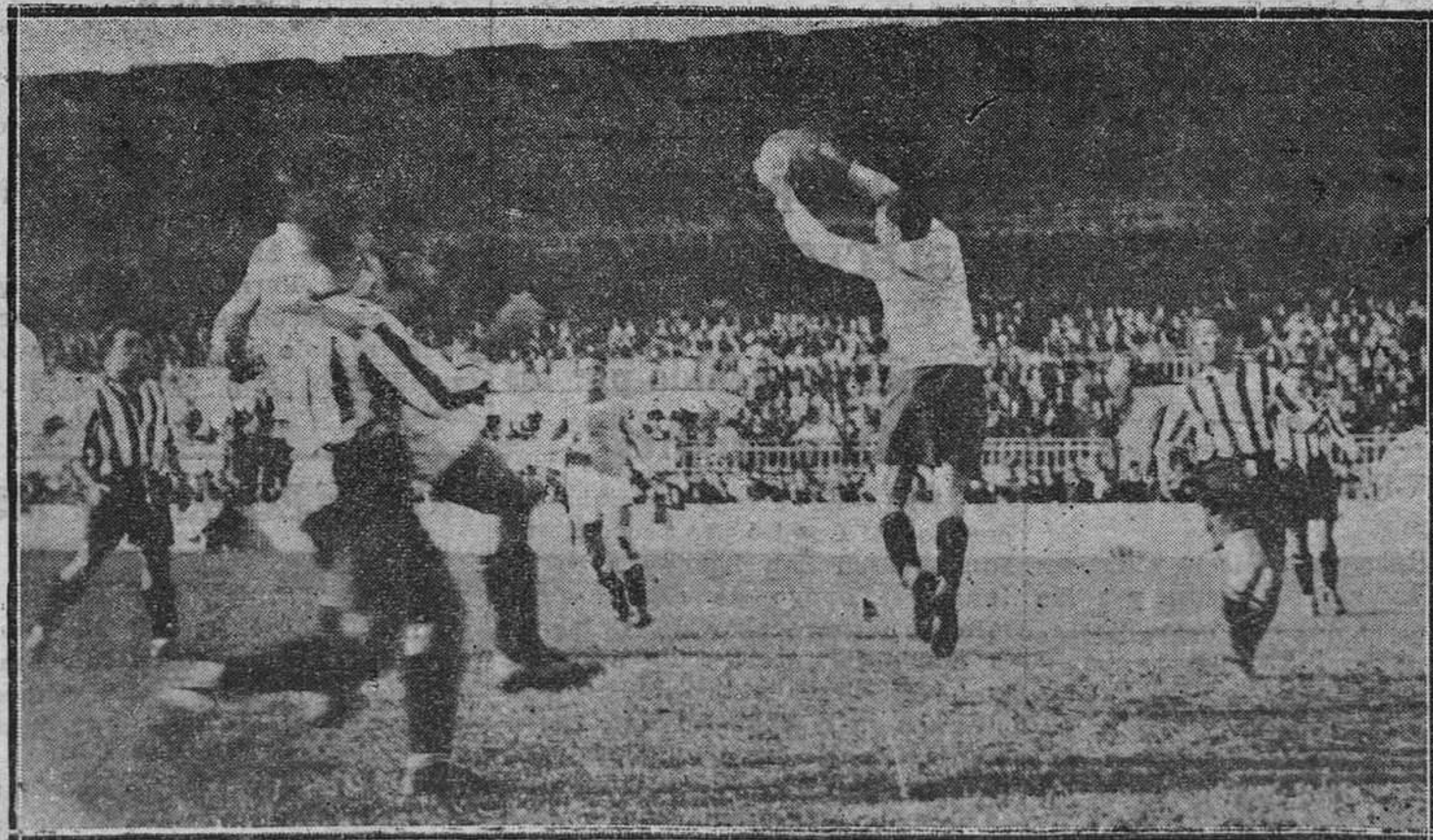
OVIEDO.—Pecheco, que dem ostró una clase excepcional bloca ndo por alto, detiene un tiro fuerte de Herrerita.

Para anuncios y esquelas llame al teléfono 1516 y pida le visite nuestro agente.