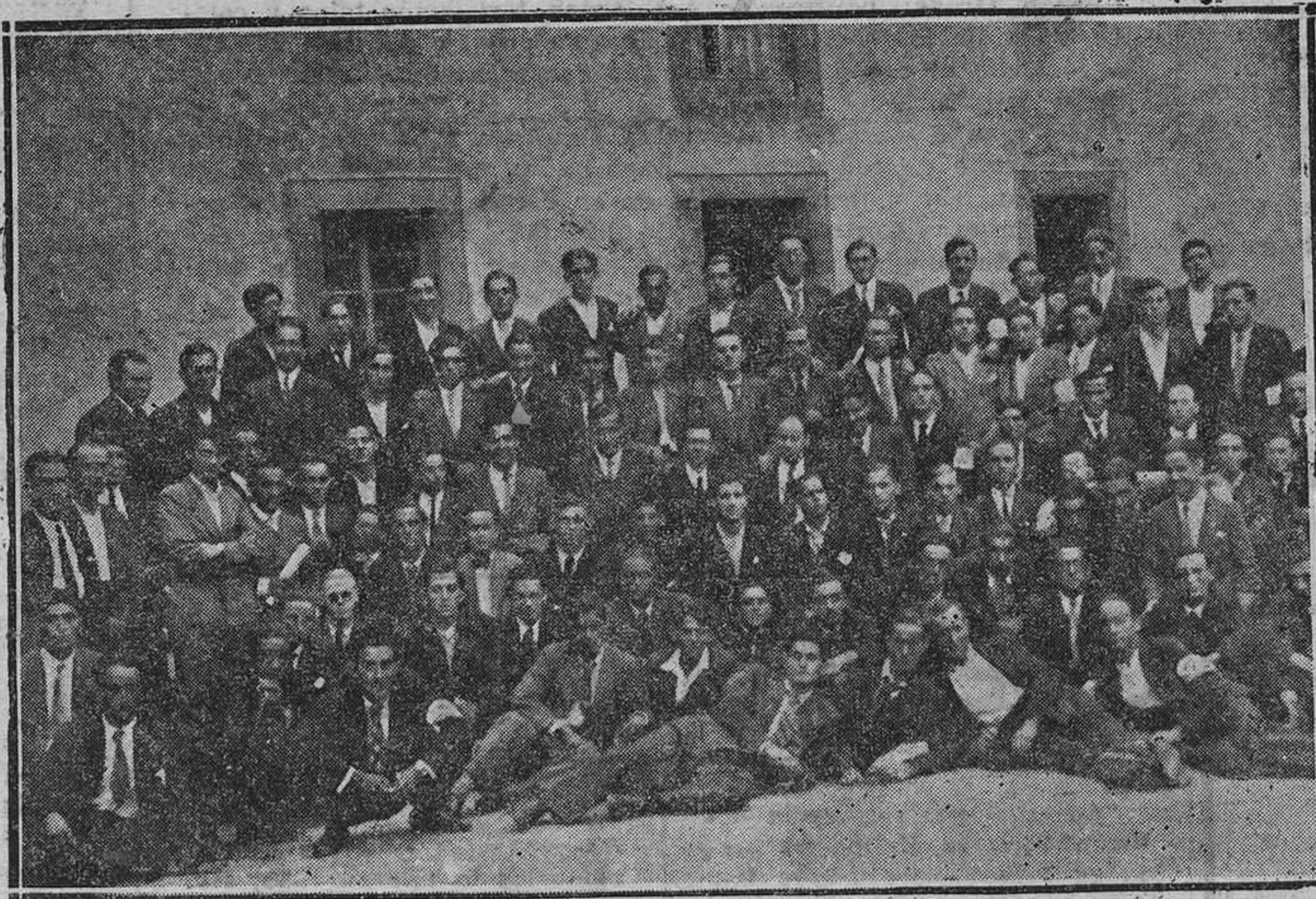
Jóvenes católicos de toda Asturias que acuden a la "Semana de Estudios Sociales", que, con gran esplendor se celebra en Oviedo

Desayuno: Café con leche. Primera comida: Poté asturiano, tortilla española, pte. vino. Segunda comida: Judías con carne y chorizos. Ensalada de bonito.