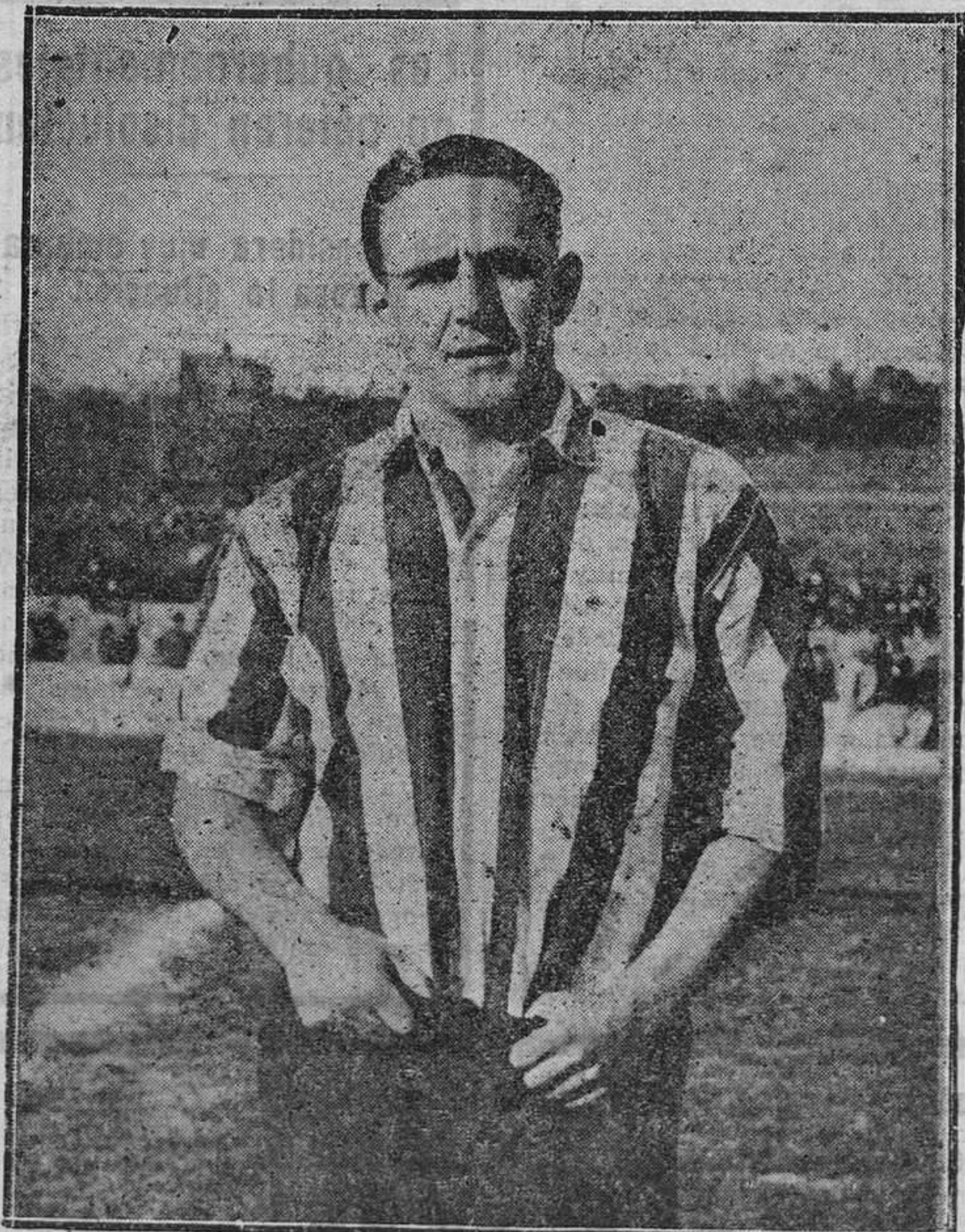
El gran "bala roja", que en la excursión futbolística que por Canarias realiza el Athletic de Bilbao, asombró al público con sus fulgurantes escapadas