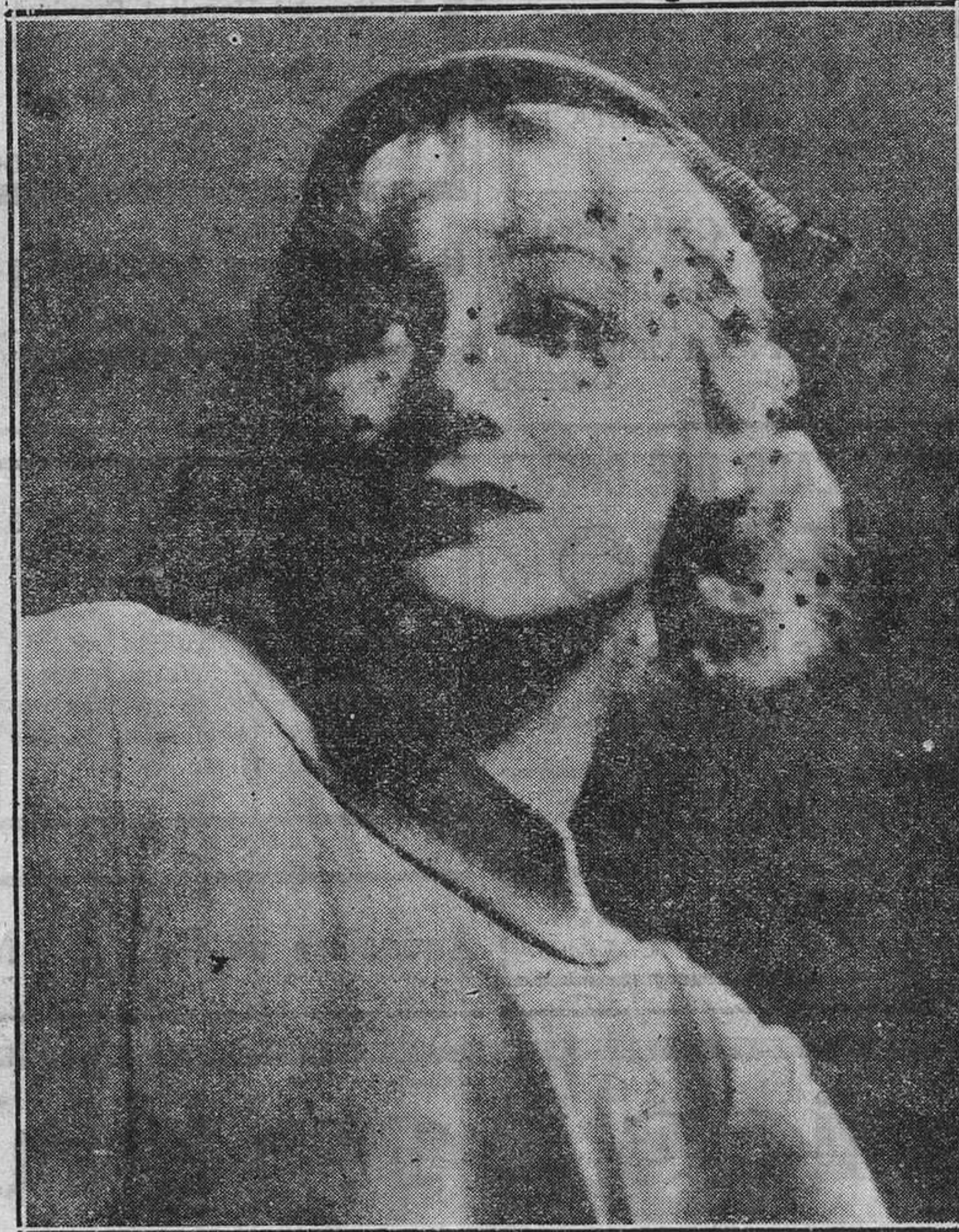
Greta Nisól es una de las rivales que se han valido a la incomparable Greta Garbo.