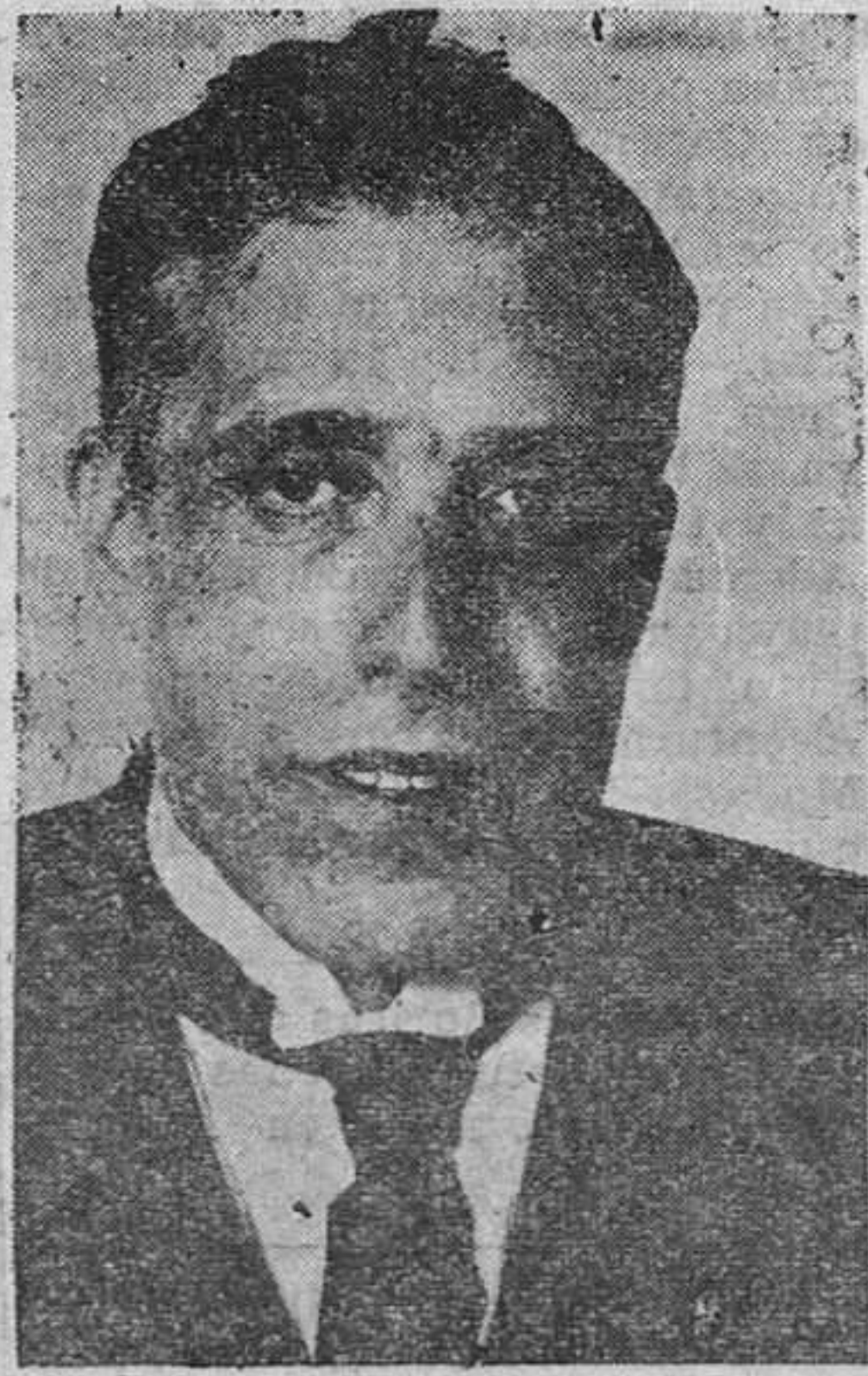
DON JULIAN BESTEIRO