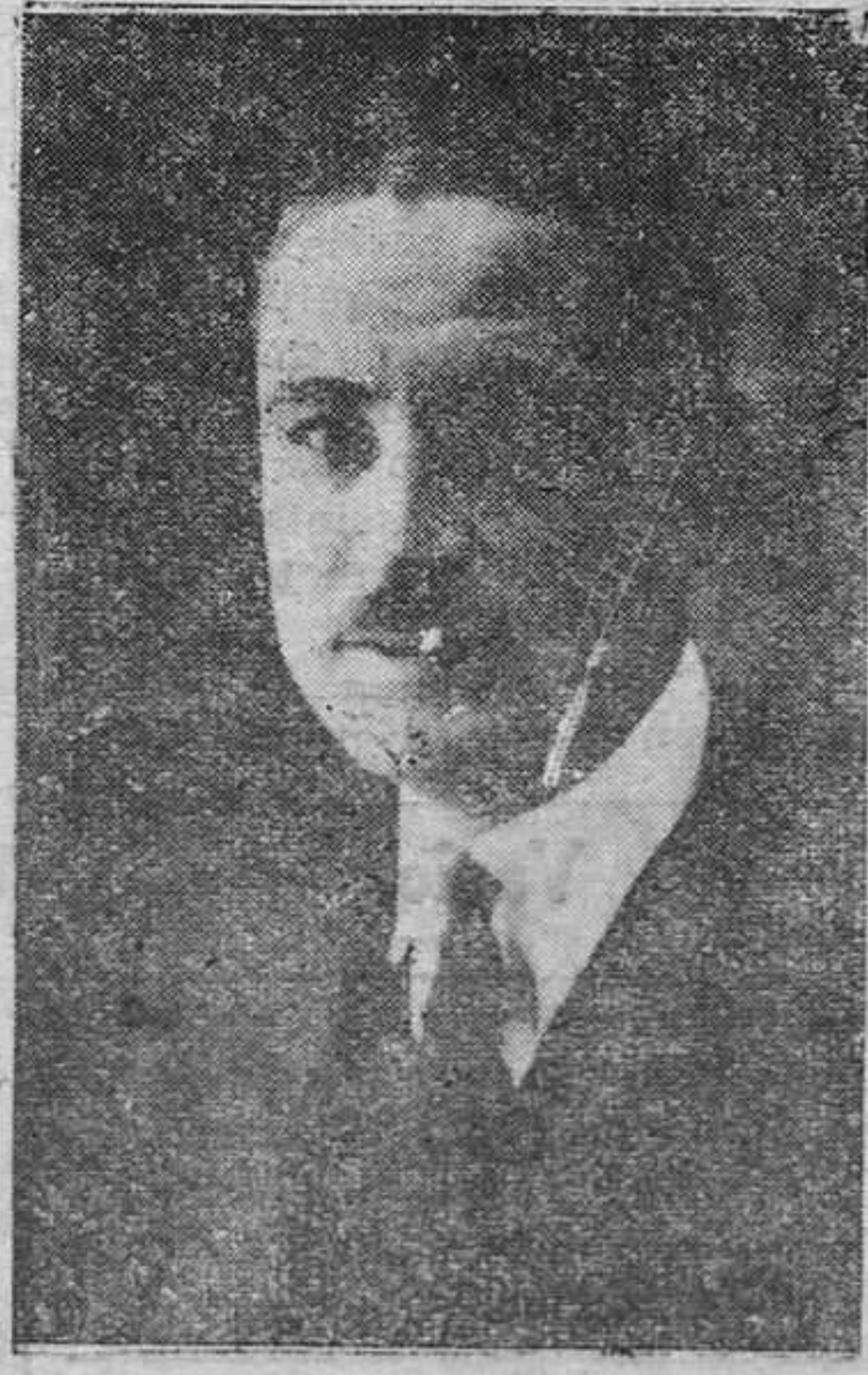
DON MIGUEL MAURA