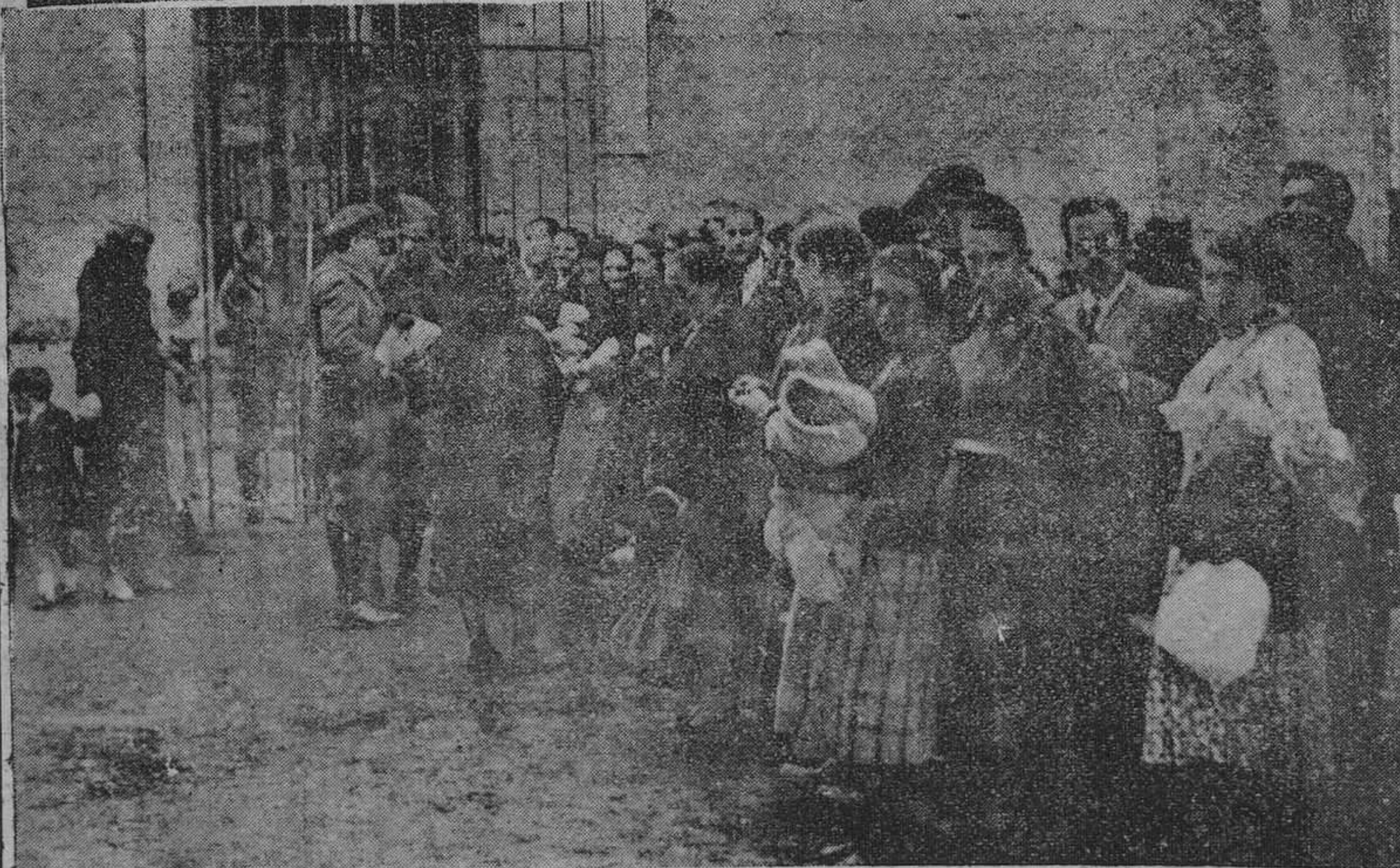
ARRIBA.—Parte de los soldados que forman la guardia de la cárcel ante el establecimiento penitenciario a donde acuden familiares de los detenidos. ABAJO.—Cola de público en espera de entrada a la prisión.