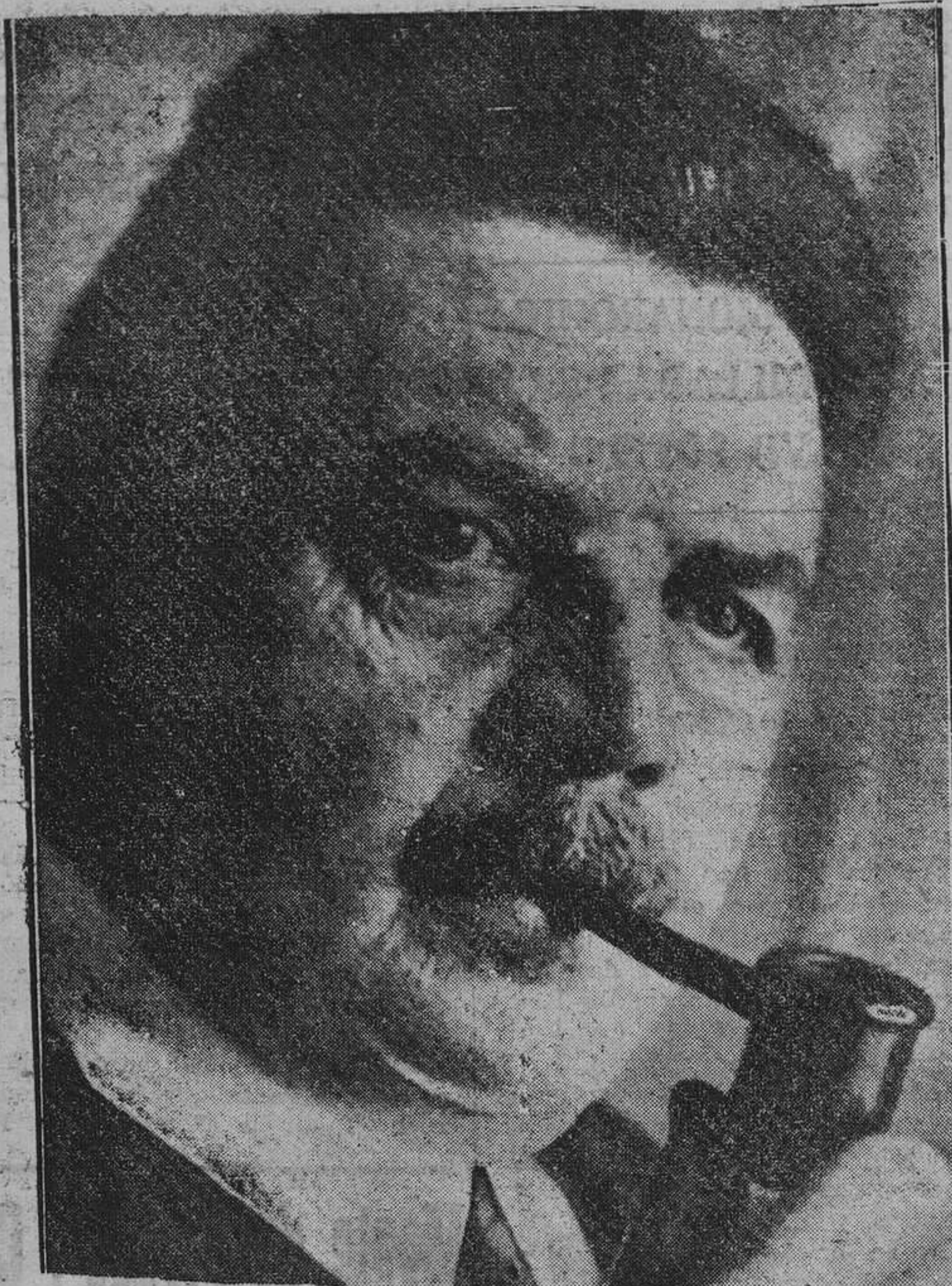
El señor Herriot jefe del partido radical socialista que provocó la dimisión del Gobierno.