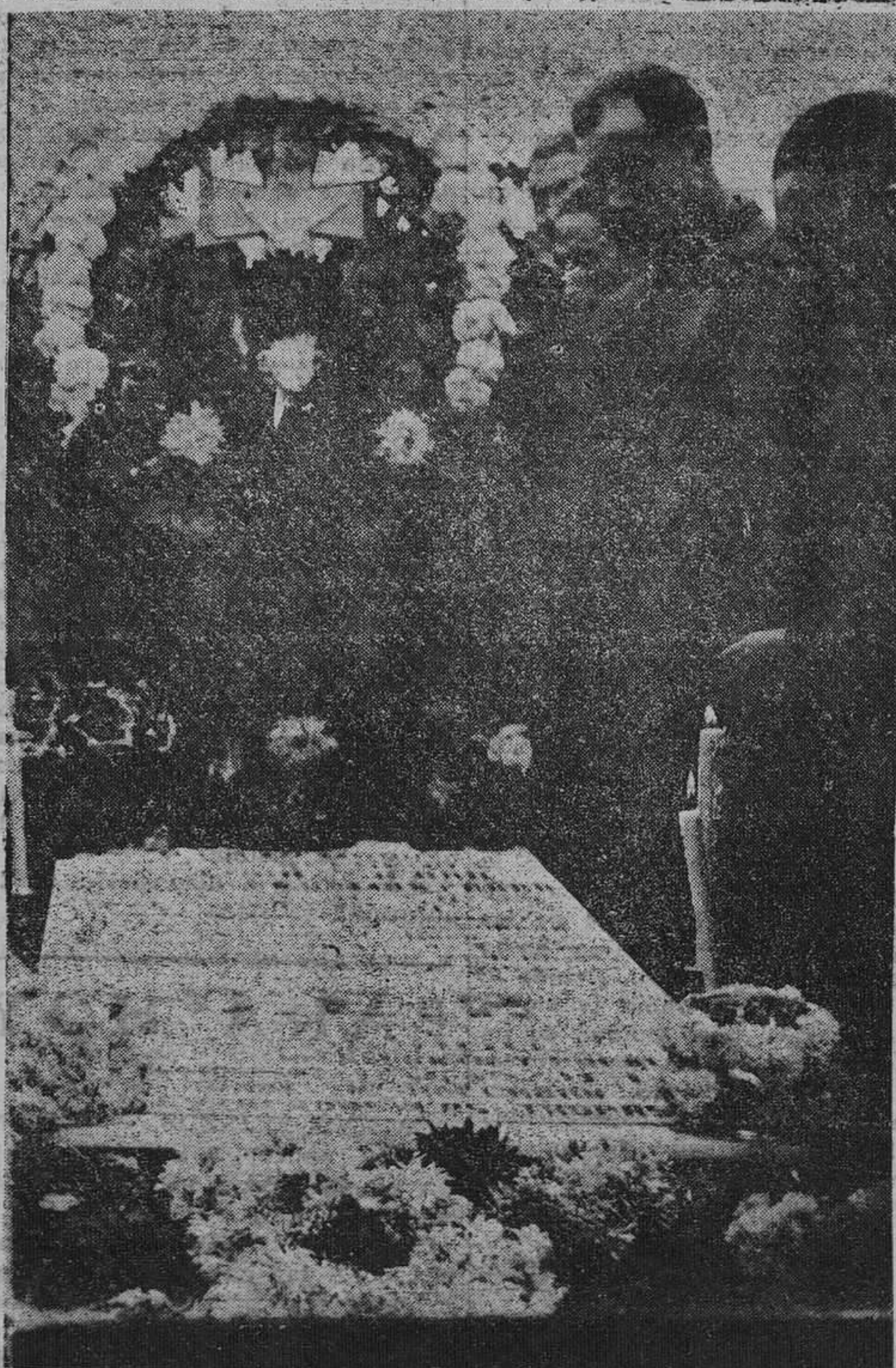
PRAVIA. — Tumba de dos soldados muertos por los rebeldes en Caborana. Esta sepultura fué visitadísima por cuantas personas acudieron al Cementerio el día de Difuntos.