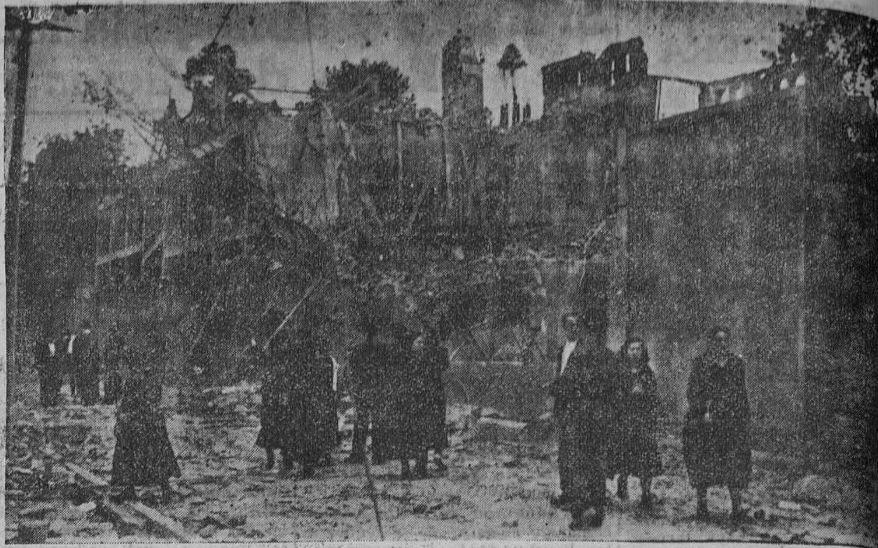
OVIEDO.— El edificio en que se hallaba instalado el Instituto nacional de Segunda Enseñanza (antigua finca de Roel y luego Colegio de los PP. Jesuitas) que fué volado con dinamita por los rebeldes, destruyendo la tremenda explosión las próximas casas de la calle de Santa Susana y causando grandes desperfectos en otras muchas de la ciudad. Para juzgar de la magnitud de la explosión citamos el hecho de que la documentación de la Secretaría del Instituto fué lanzada hasta El Condado, en Las Segadas.

Los detenidos, después de declarar, quedaron en libertad.