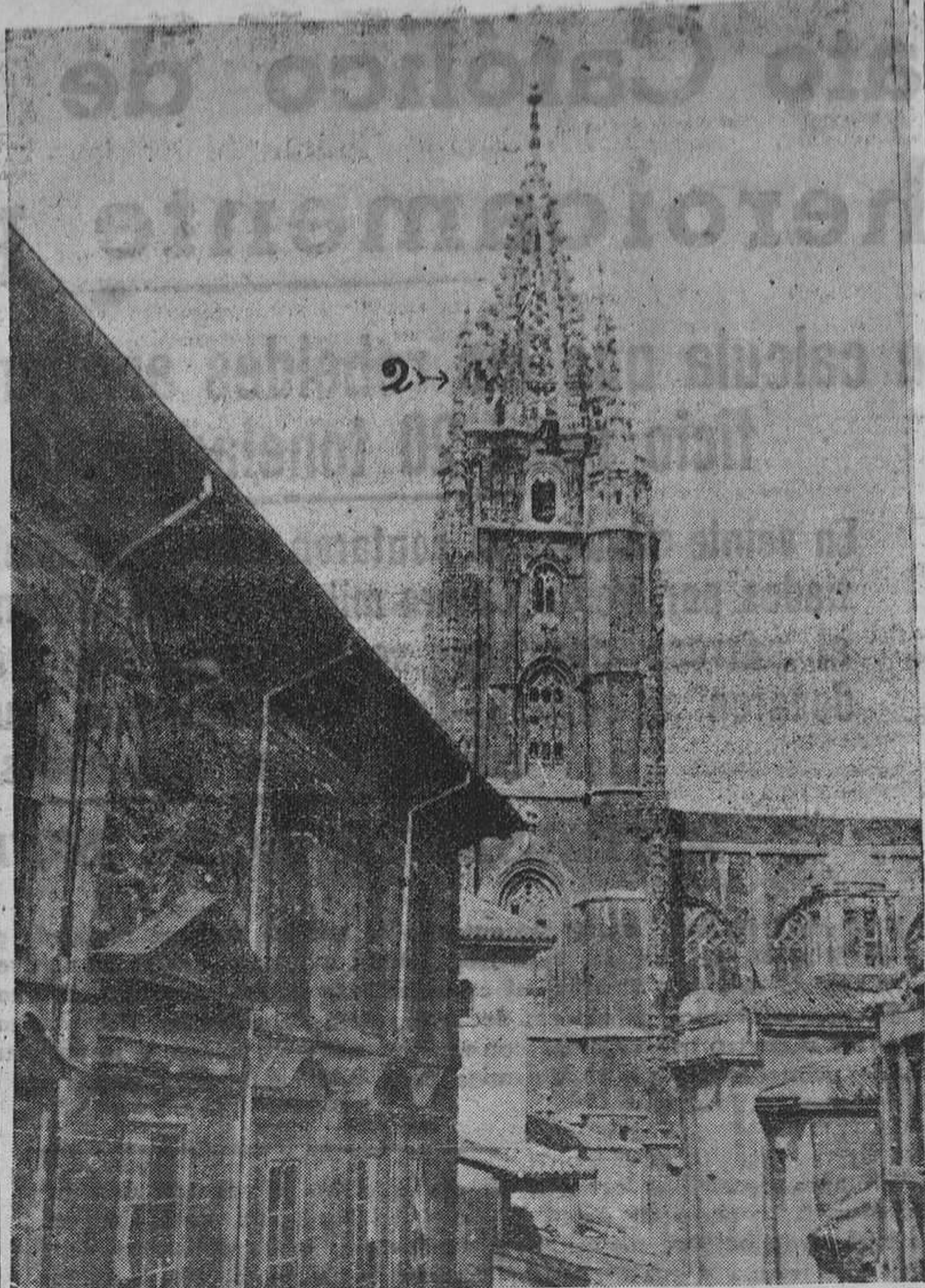
La torre de la Catedral vista desde la calle de Santa Ana, después de los sucesos. La fachada se halla llena de impactos, especialmente en torno a los ventanales, y en ella puede apreciarse la torrecilla (C) deshecha por un cañonazo y la ventana (1) cuyo antepecho sufrió también enorme desperfecto por la misma causa.

EL PALACIO DE LAS MEDIAS Pelayo, 9 OVIEDO Tlfo. 2490