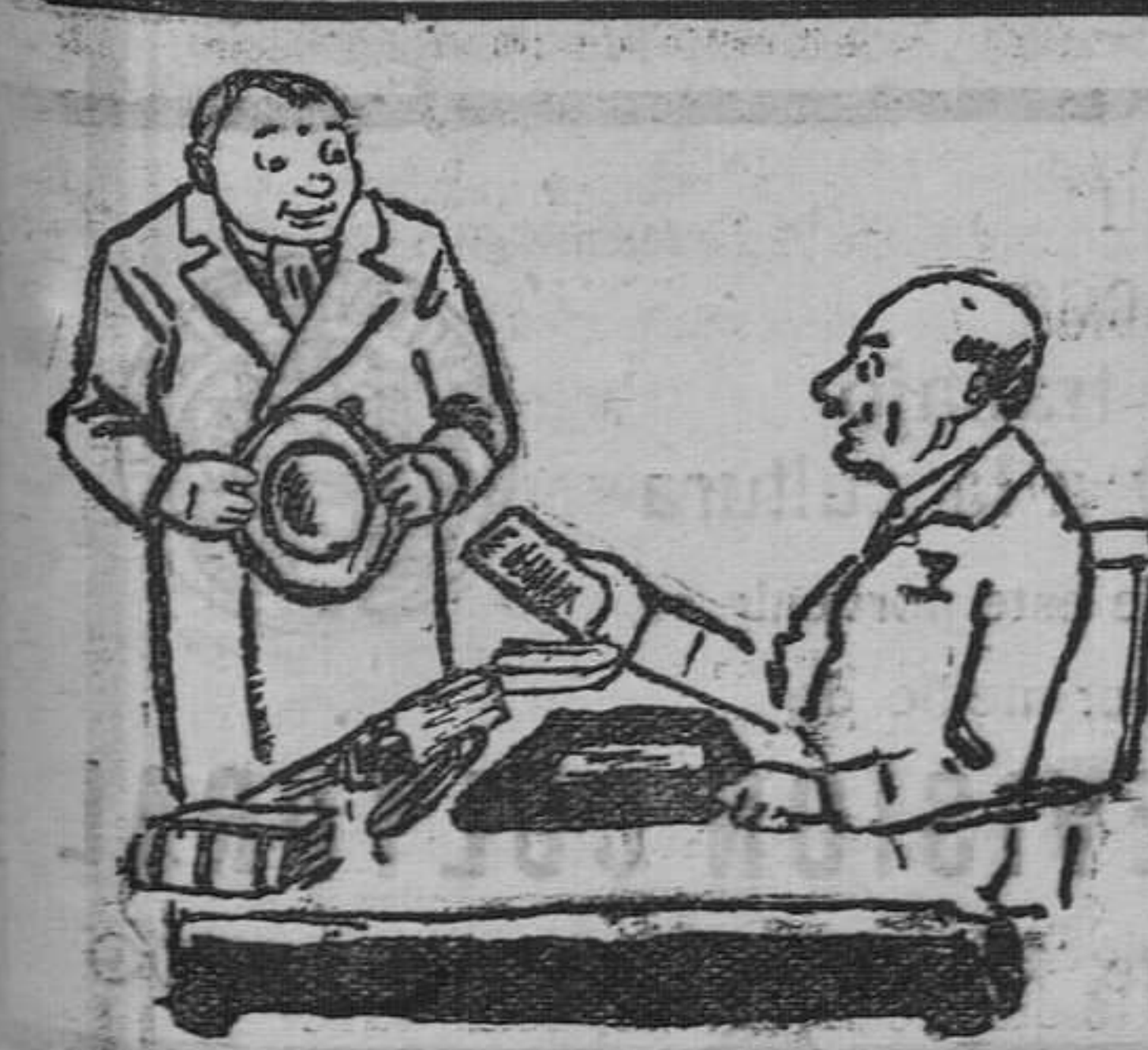
Doctor.-- Yo creo que soy bastante popular entre mis enfermos. Paciente.-- Sí, he conocido a muchos que han muerto y han sido enterrados suyos.