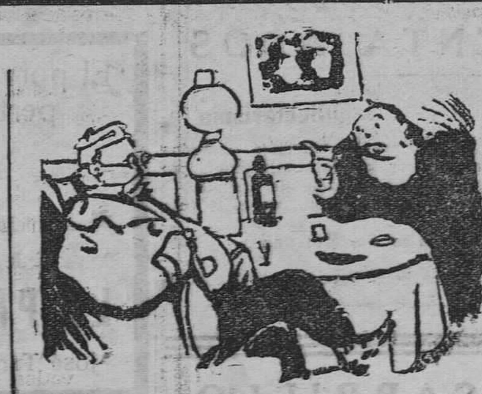
--Van a traer a Francia las tenidas del duque de Reichardt.