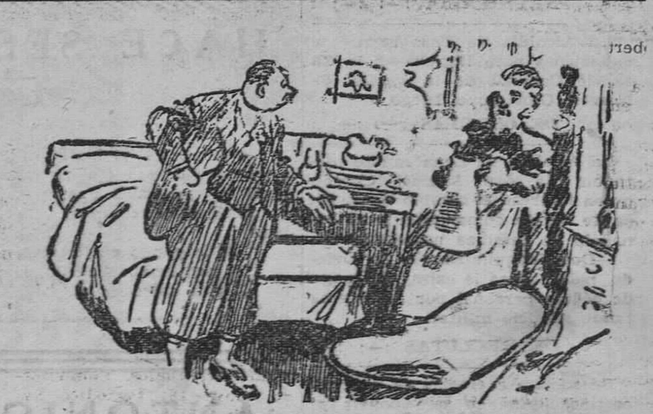
El viajero.-- ¿Cree usted que yo puedo bañarme en este cacharro? La dueña.-- ¡Oh, señor! Yo no pretendo saber cosas tan íntimas.