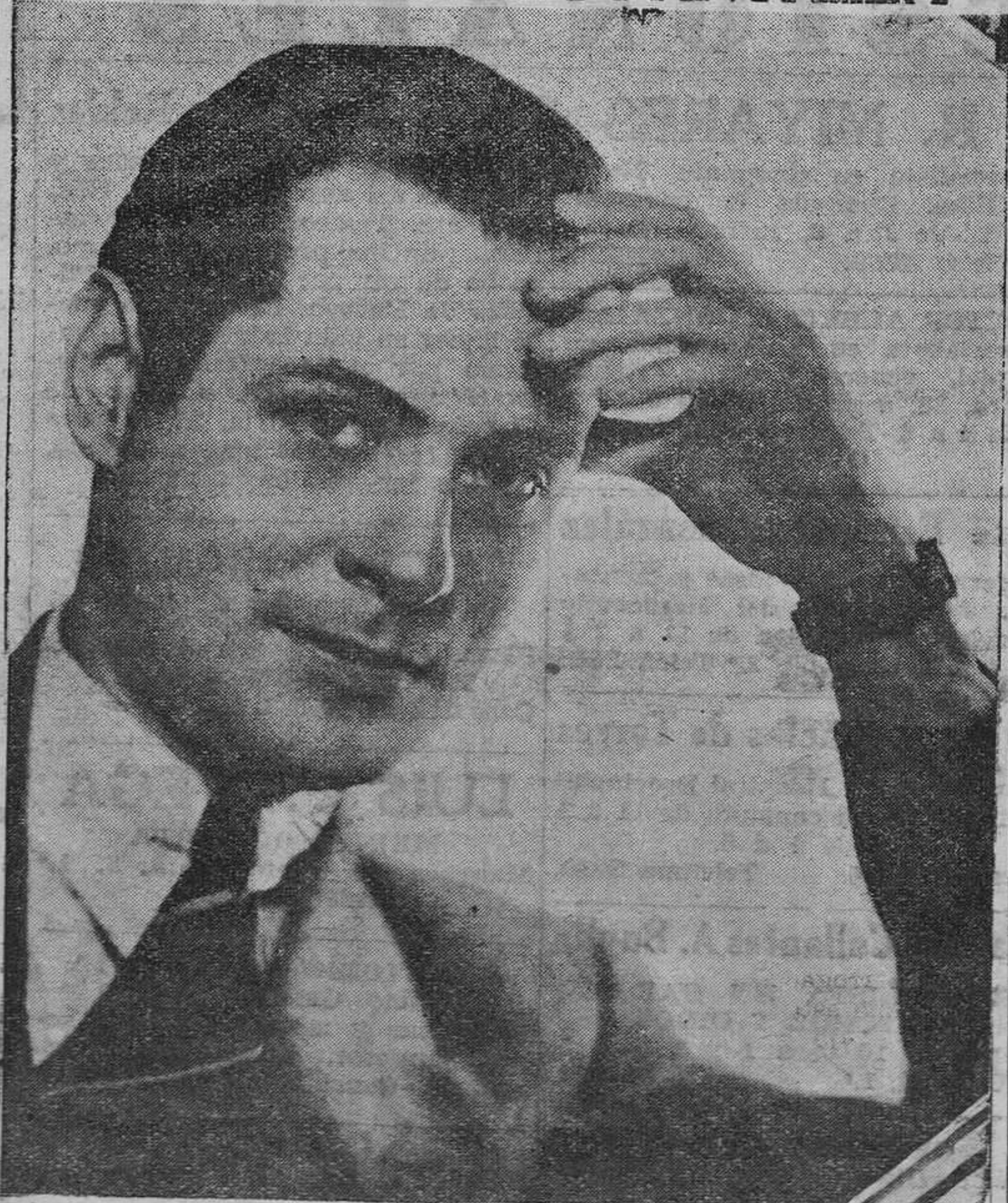
Robert Montgomery, el triunfador intérprete de "Compañeros" y de tantas otras admirables producciones, hubo de luchar duramente por la vida, cuando aun no contaba diez y siete años. De cómo supo abrirse paso hasta llegar al lugar preeminente que ocupa en el mundo cinematográfico, puede darnos clave su norma favorita, que es la siguiente: "Viva y deje vivir. Ocúpese de lo suyo y deje que cada cual haga lo mismo. Muchas complicaciones, muchos obstáculos y sufrimientos innecesarios obedecen simplemente, más que a ninguna otra causa, a entrometarse uno donde no le llaman, aun cuando se haga con la mejor buena voluntad".