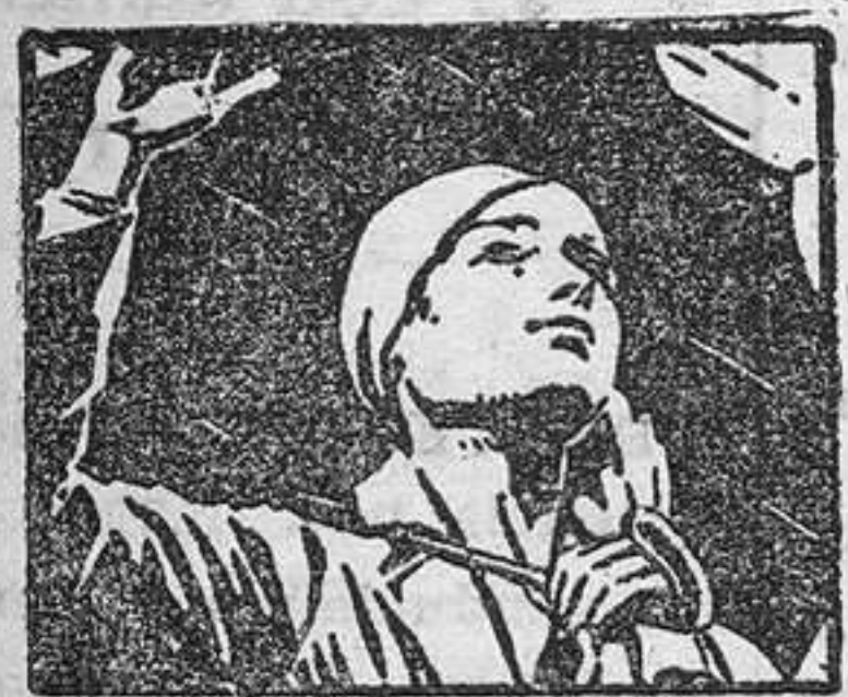
EVITA RESFRIADOS Y ENFRIAMIENTOS.

es la revista de este género que Vd. encontrará más agradable.