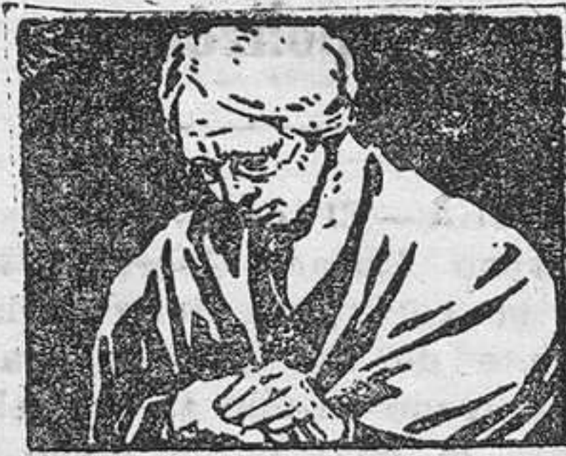
CALIENTA COMO LOS RAYOS DEL SOL