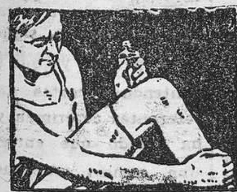
LINIMENTO DE SLOAN PENETRA SIN FROTAR