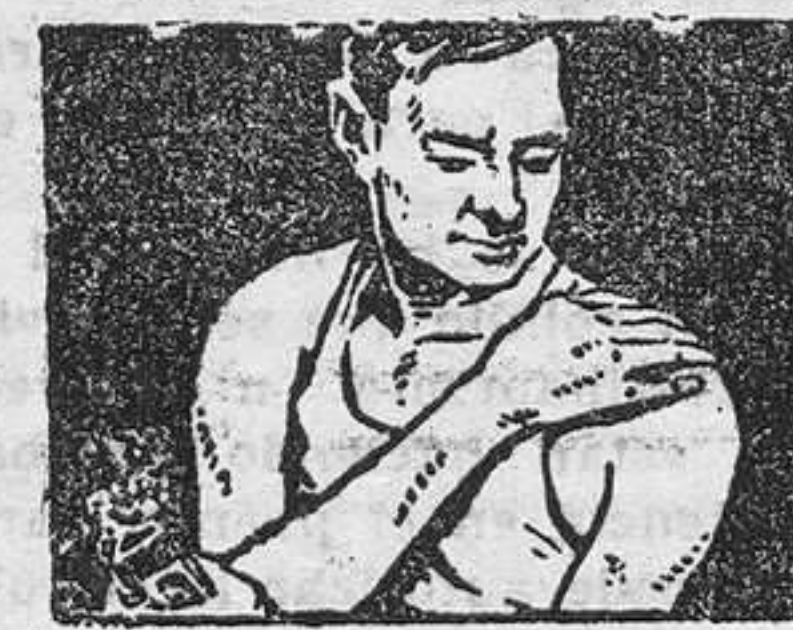
DESCONGESTIONA Y PRODUCE BIENESTAR