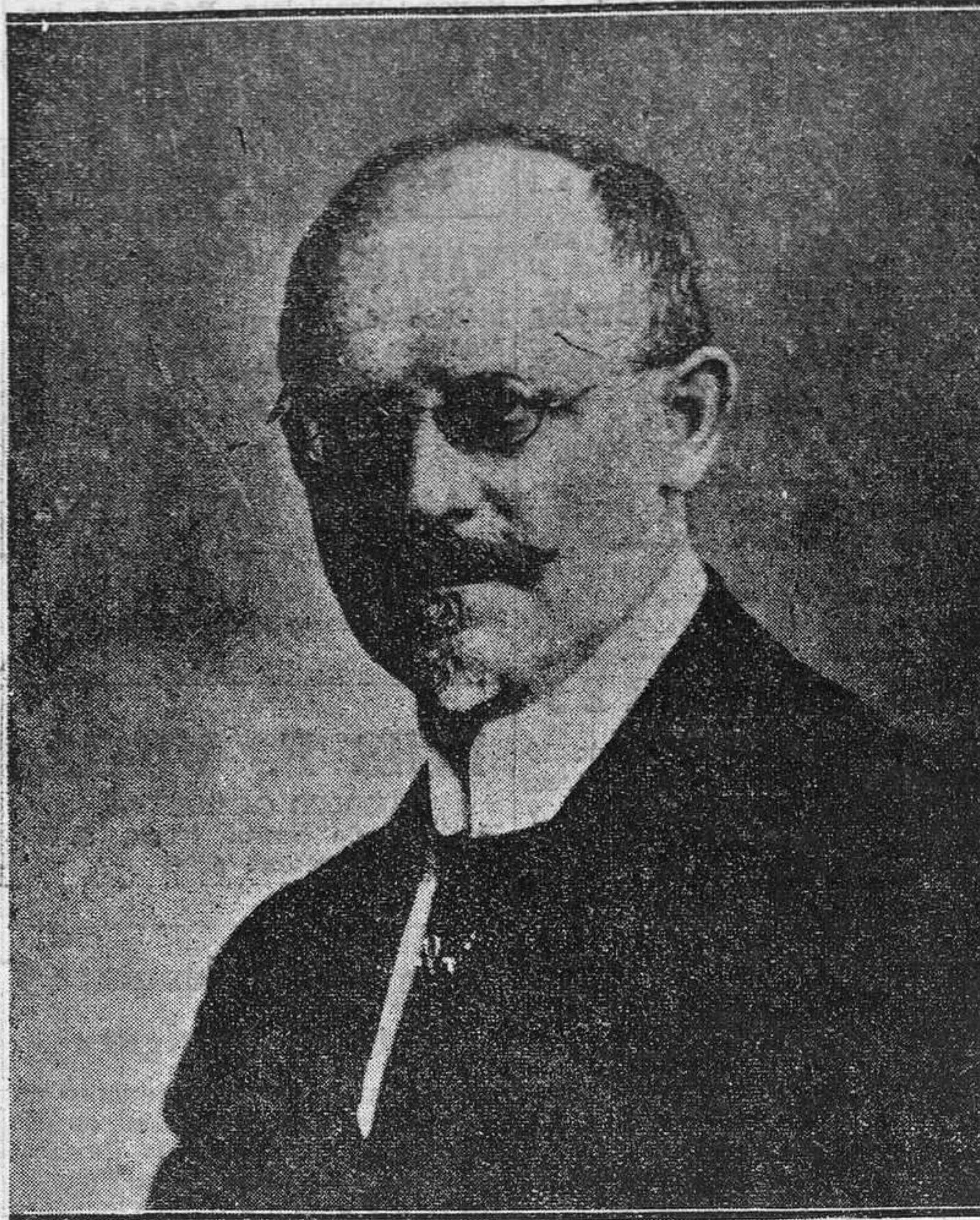
El señor Held jefe del Gobierno de Baviera, que ha dimisionado el cargo.