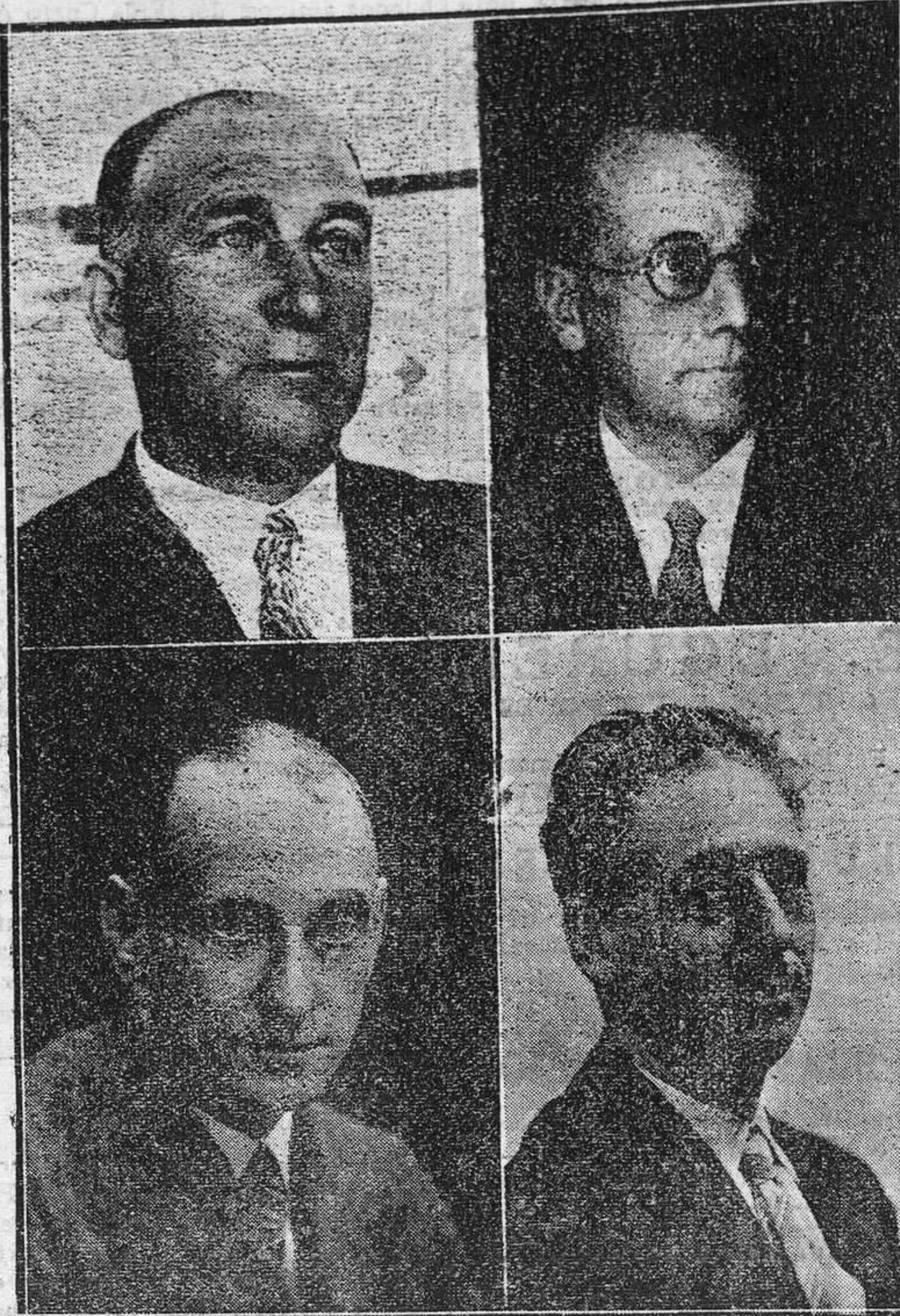
Cada día nos trae una nueva combinación política más o menos absurda. Aquí están los cuatro últimos nombres que se han barajado: Largo Caballero, Giral, Casares Quiroga y Companys. El primero de ellos sonó incluso para la Presidencia del Consejo de Ministros.

Rechaza la posibilidad de un Gobierno socialista, pues dice que el país no aguantará una dictadura socialista. Un Gobierno socialista, quiérase o no y haya o no explosiones inmediatas, desaparecerá al mes, o a los dos meses, o a las veinticuatro horas, una reacción incercible.