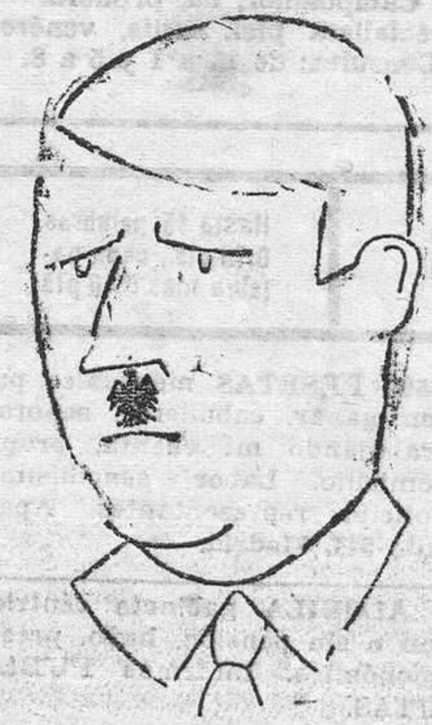
Un apunte de Hitler. Tiene de original, que el célebre bigote del canciller de Alemania, está representado por el águila imperial.

ARRIENDASE espacioso local con amplia huerta, buena orientación, en Fuente del Prado. Informes: "AGENCIA" Uría, núm. 13, entresuelo