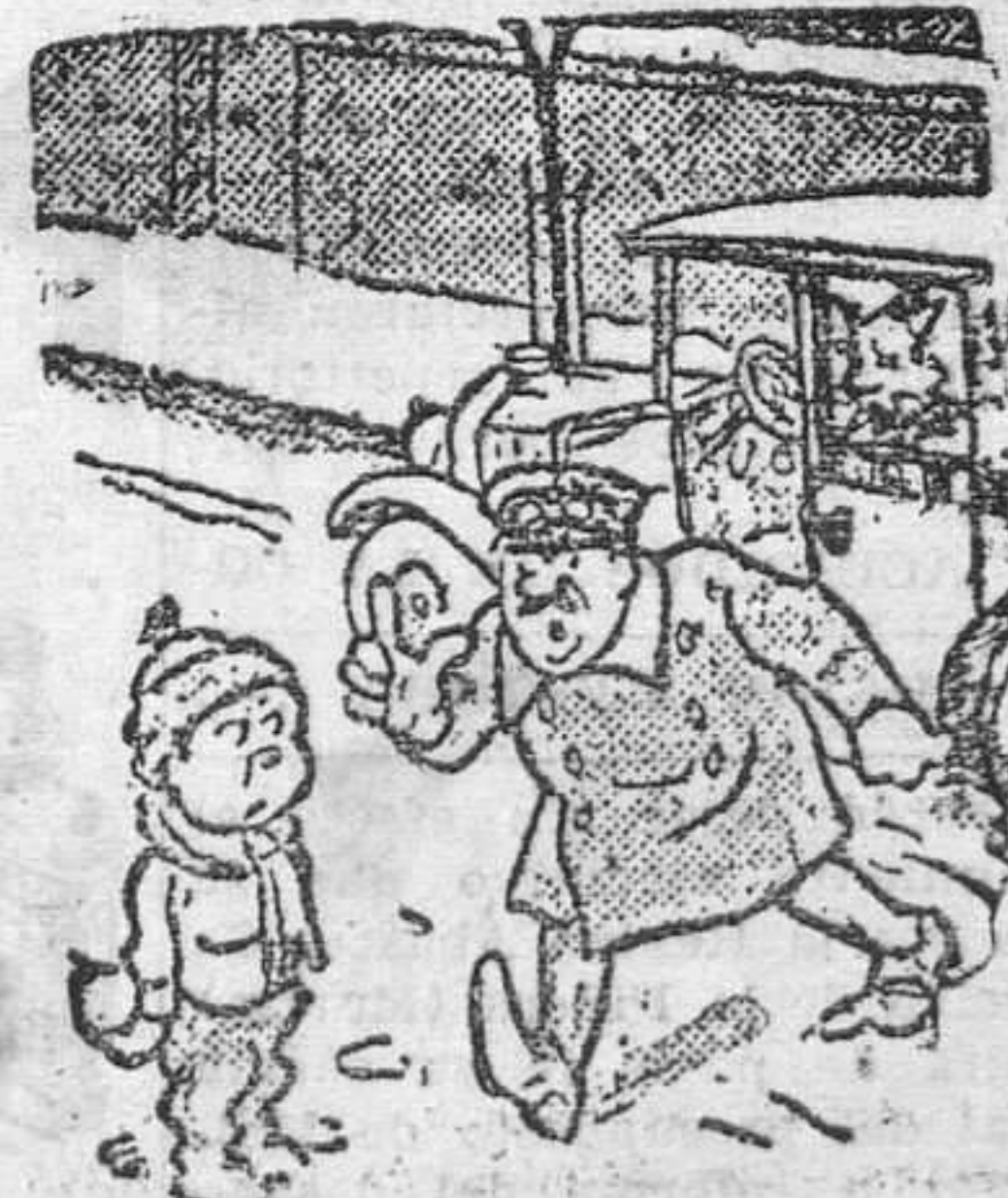
— ¡Bribón! ¡Le va a costar este caro a tu padre! ¡Romper un cristal irrompible!