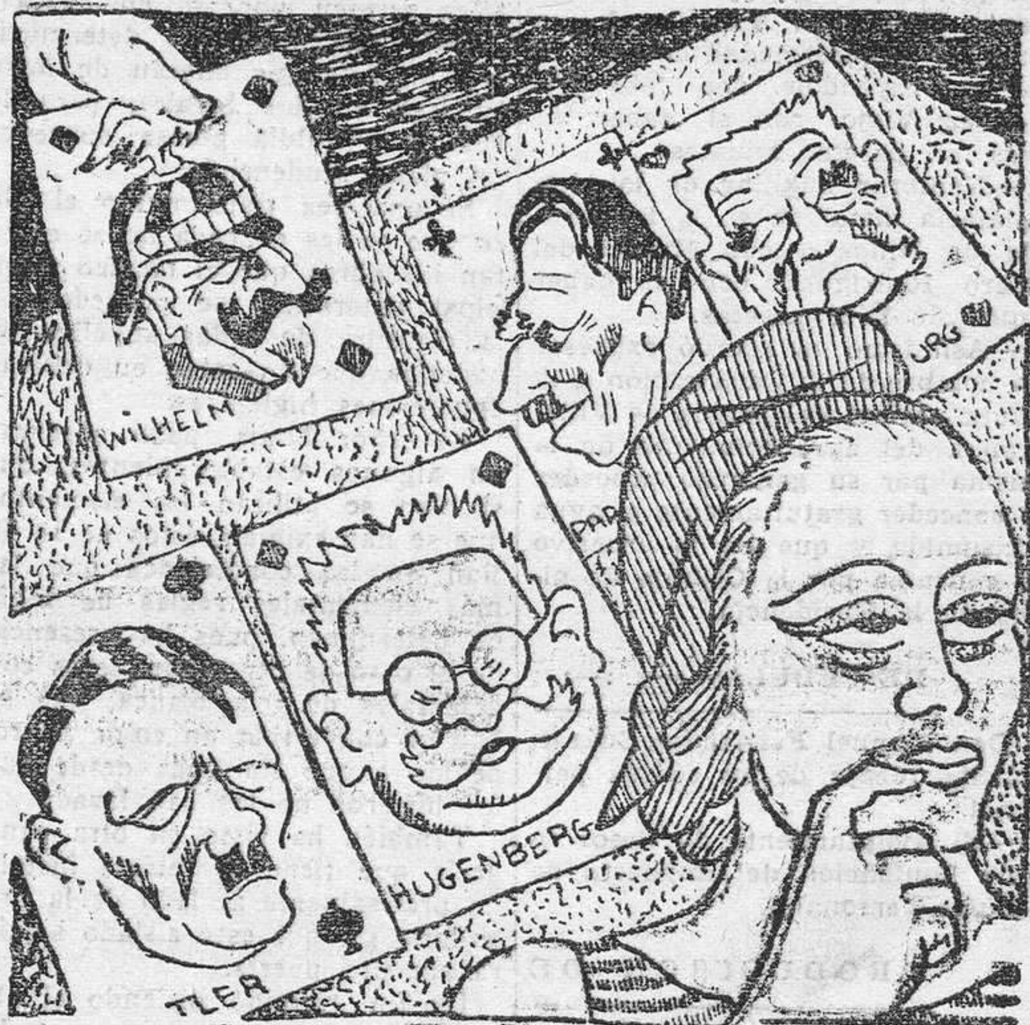
ALEMANIA.— Me juego las cuatro sotas y aún me reservo el Rey. ¿Y tú? FRANCIA.— Yo busco un as.