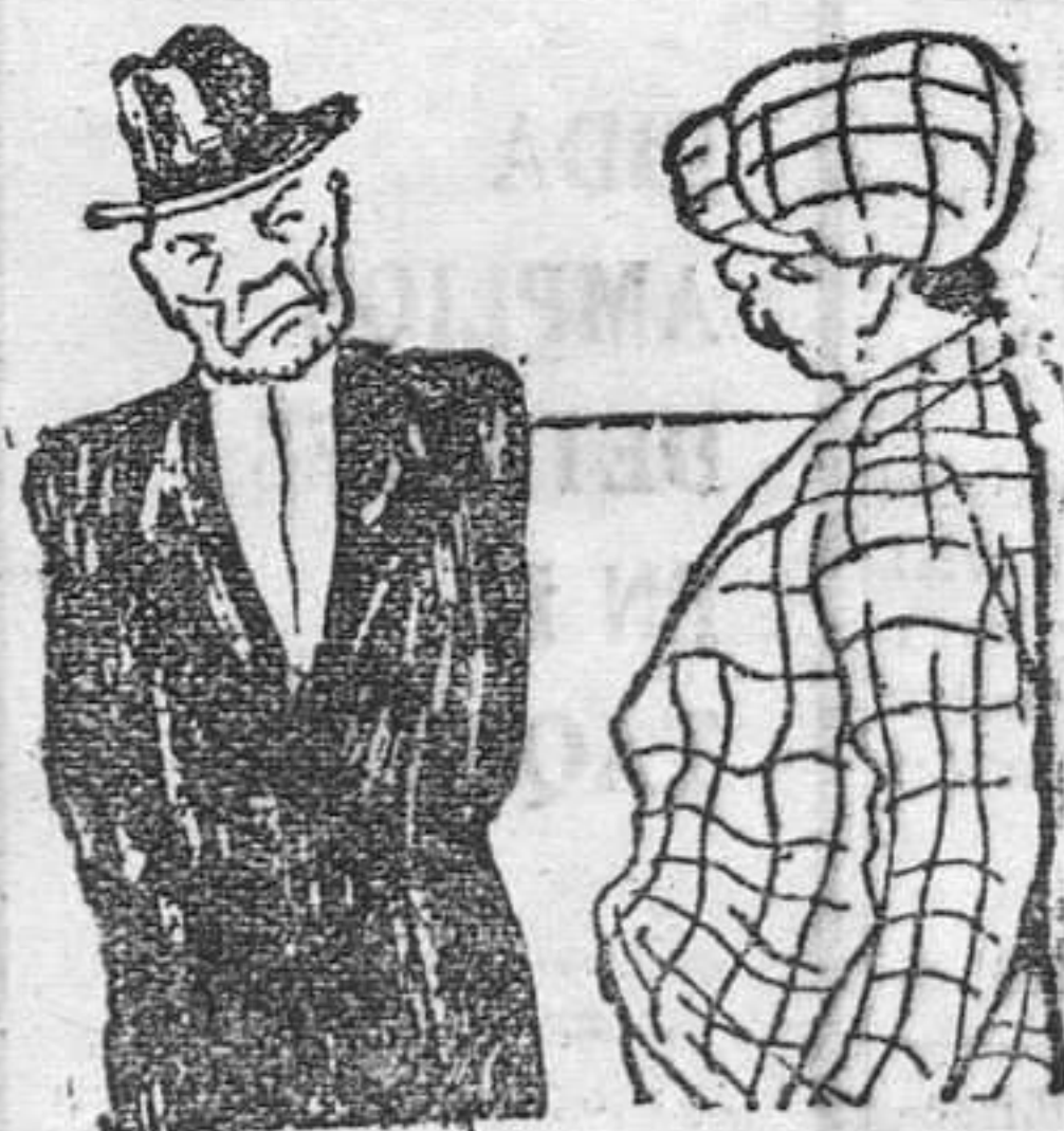
—¿Hay en su familia algún caso de locura? —Si, señor: Mi hermana rehusó casarse con un millonario.