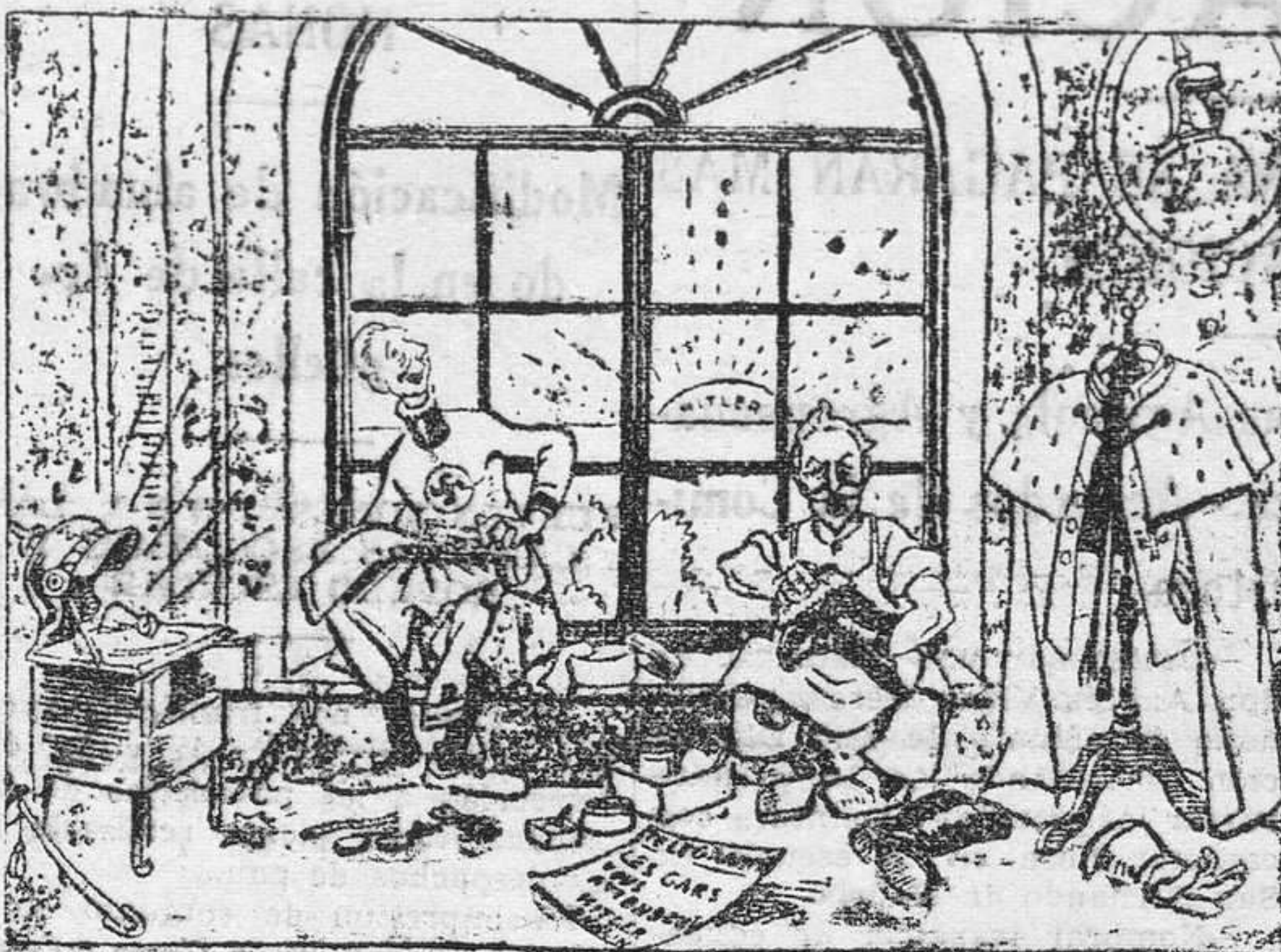
Guillermo y su primogénito.—¡Se avecinan los días felices!