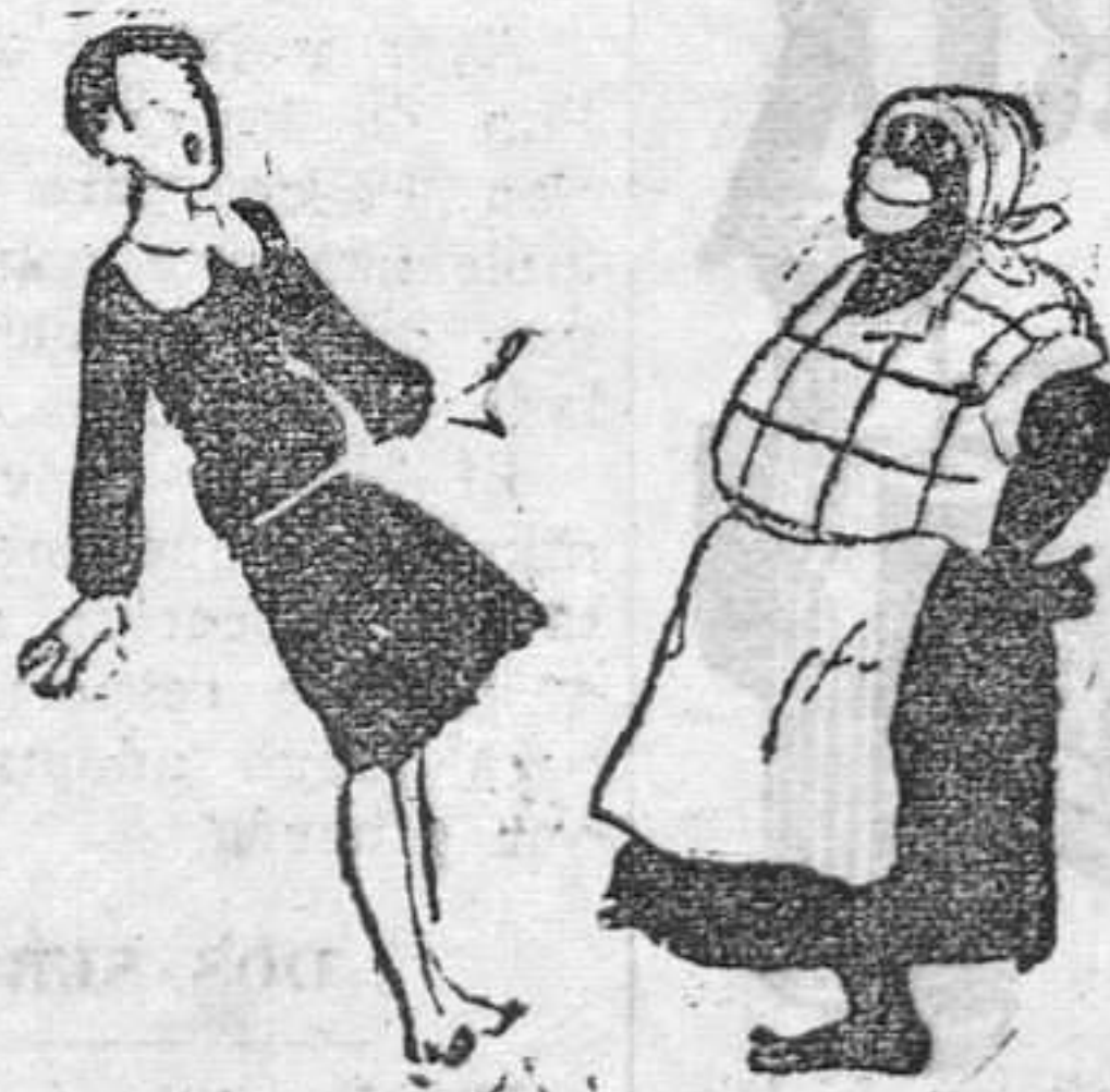
—La señorita.— ¿Le gustan los niños? La nueva cocinera negra.— ¡Ya lo creo; tiernos y estofados son muy buenos!