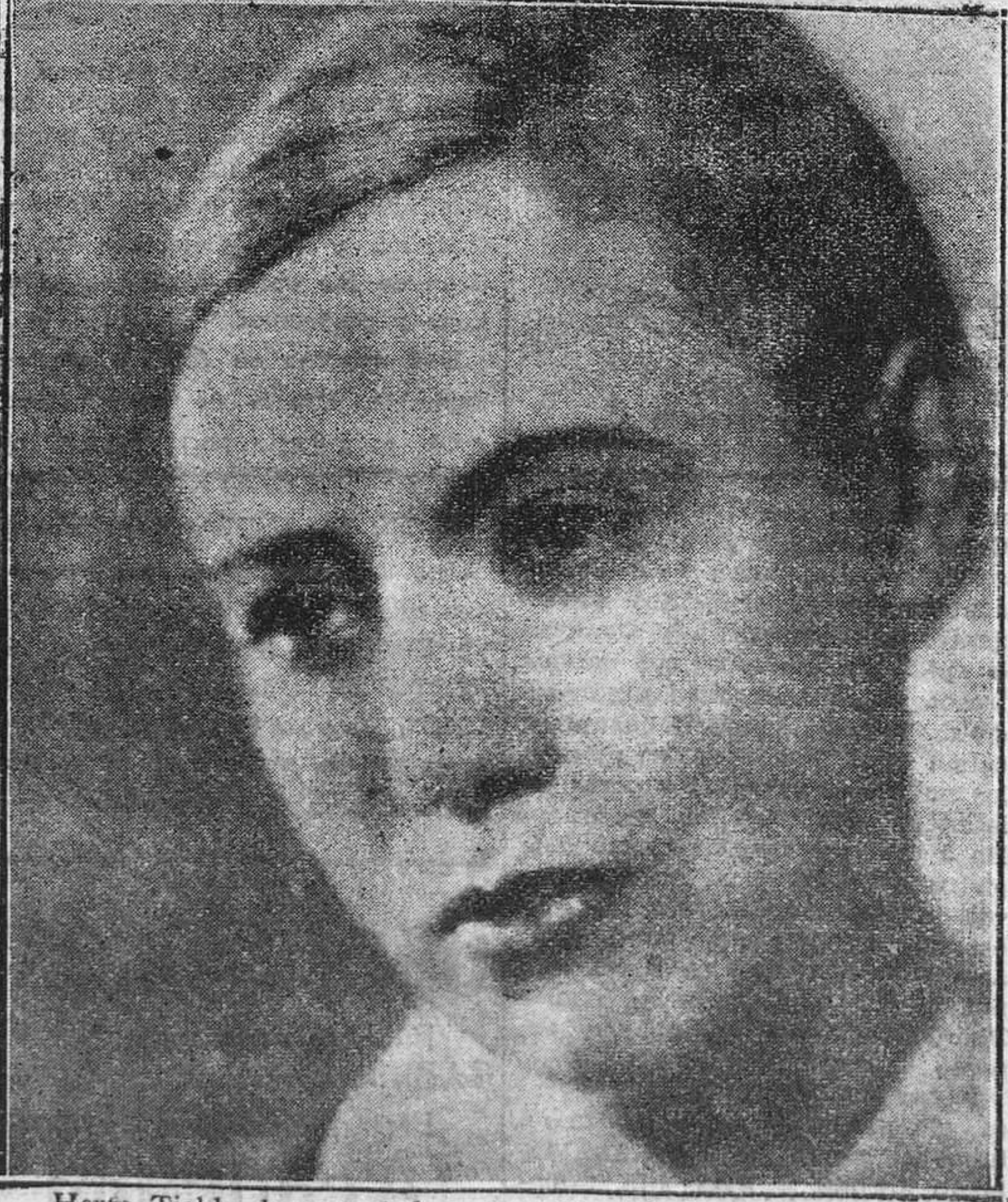
Herta Tiabe, la encantadora protagonista de "Muchachas de uniforme".