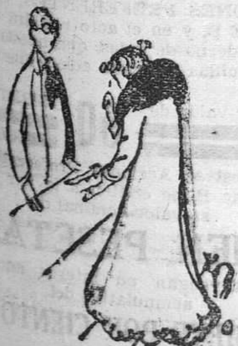
—He pagado tres guineas por este par de zapatos, y después de pasear medio día se me han roto. —Pasear, señora? Nuestros clientes van en automóvil.

José Tartière, 19 - Teléfono 2444 - OVIEDO