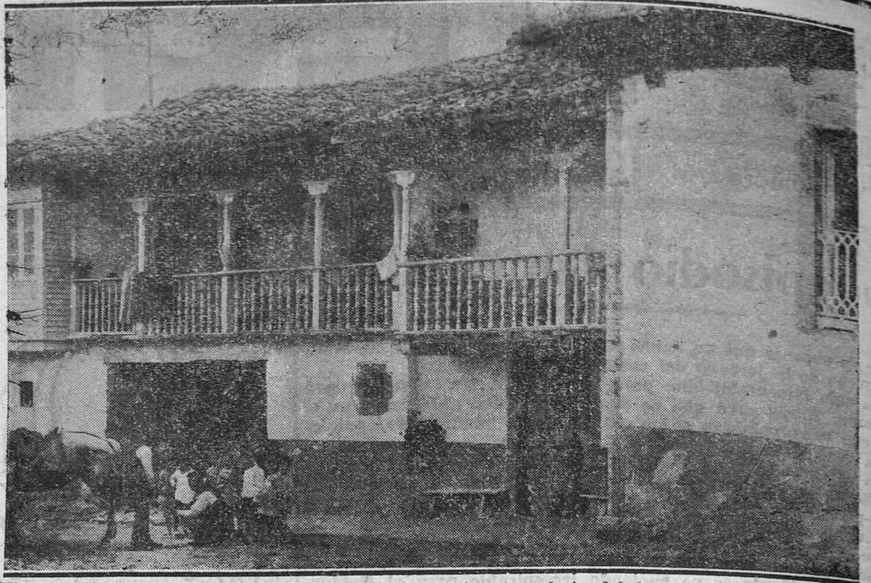
CECEDA.—Un grupo de alegres "rapacinos" presencia el trabajo del herrador, mientras ríen complacidas esas dos lindas mocitas.

Ultimamente nos expresa el señor Hevia que para el día 17 de