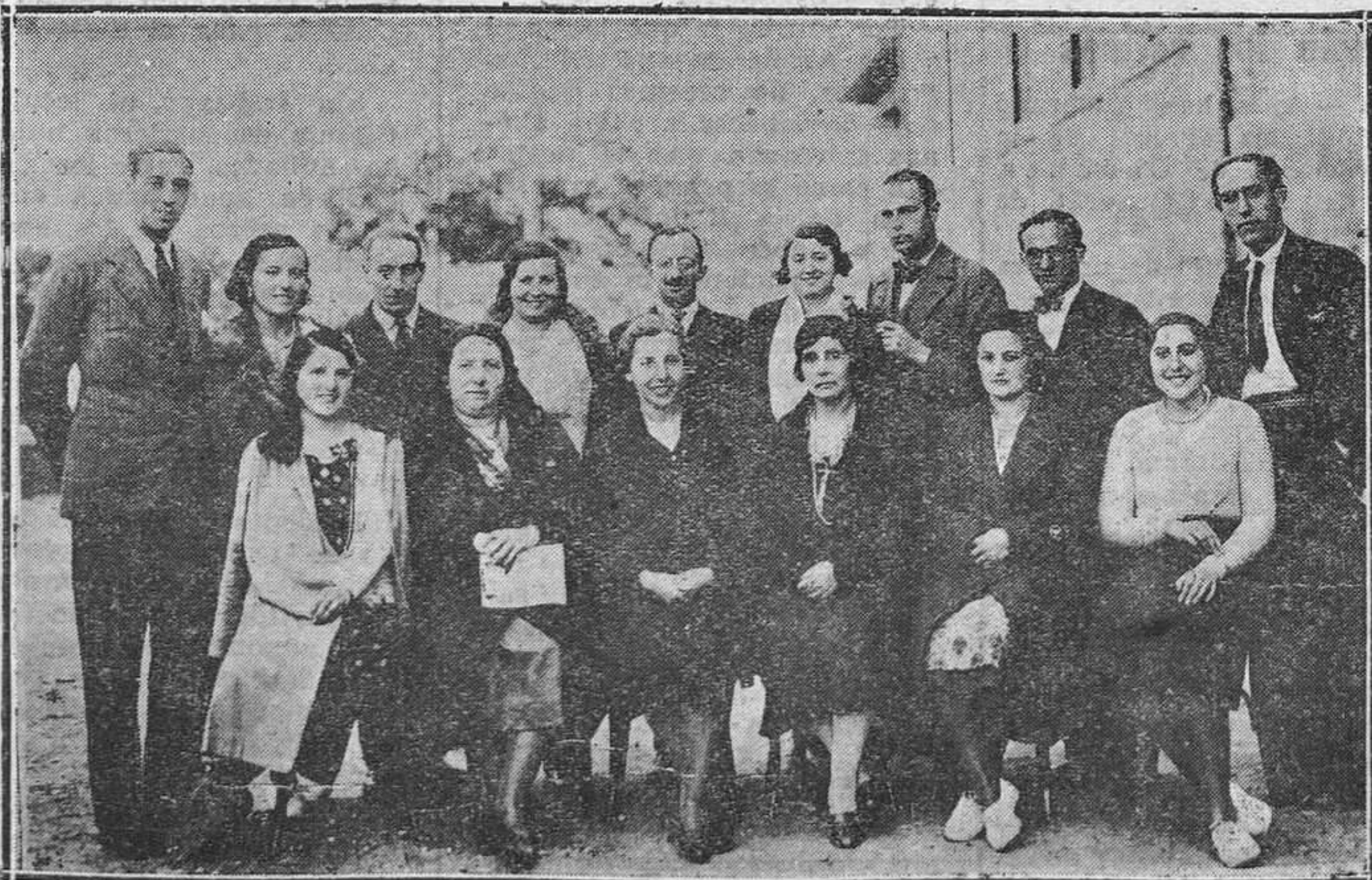
PRAVIA.—Maestras y maestros cursillistas que han hecho el segundo ejercicio de prácticas en las escuelas graduadas de esta villa. (Foto Varela).

Se da cuenta de la actuación del Comité permanente de Madrid en relación con el paro, y con el propósito del ministerio de Obras Públicas, de publicar un nuevo Reglamento de Transportes, a propuesta de la Directiva se acuerda, con entusiasmo, que por esta Asociación se gestione la federación de todas las organizaciones provinciales del Norte de España, para solicitar y tratar de conseguir por todos los medios la intervención en la Comisión encargada de confeccionar el proyecto de Reglamento para que no falte allí la voz razonada de los transportistas por carretera, al igual que existen las de otras representaciones de distintas ramas del transporte.