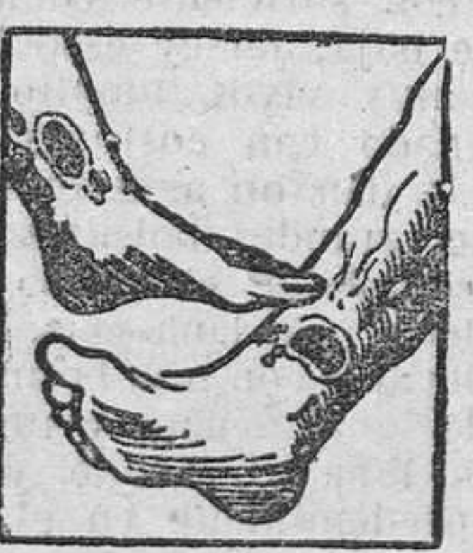
Males en las piernas

La sangre del artrítico esta entorpecida por venenos que provienen de una insuficiencia de vitalidad y por consiguiente, su circulación es del todo defectuosa. Las piernas del enfermo estan hinchadas y entorpecidas con varices dolorosas con peligro de ruptura o de ulceración interminable. Con frecuencia el artrítico esta atormentado con dolores gotosos o reumáticos que le hacen achacosos y con el tiempo le agotan. Sus riñones estan generalmente obstruidos con nefritis, albuminuria; arena en la orina (mal de piedra) y a veces fuertes dolores en la espalda. Las arterias duras y quebradizas como tubos de pipa (arteriosclerosis) amenazan a cada instante, accidente generalmente pronosticado con insomnios y dolores de cabeza. La mujer artrítica tiene épocas irregulares y penosas y su edad crítica es un largo suplicio, con bocanadas de calor, vértigos, jaquecas, postración profunda, con frecuencia fibromas o tumores en el vientre. Los artríticos de ambos sexos tienen tambien enfermedades de la piel, acné, eczemas, herpes, sarpullidos, prurigo, sporiasis, forunculos, etc., con lesiones molestas y comezónes intolerables. Todos esos enfermos de la sangre, todas esas victimas martires del artritis- mo no tienen que desesperarse y creerse incurables pues el