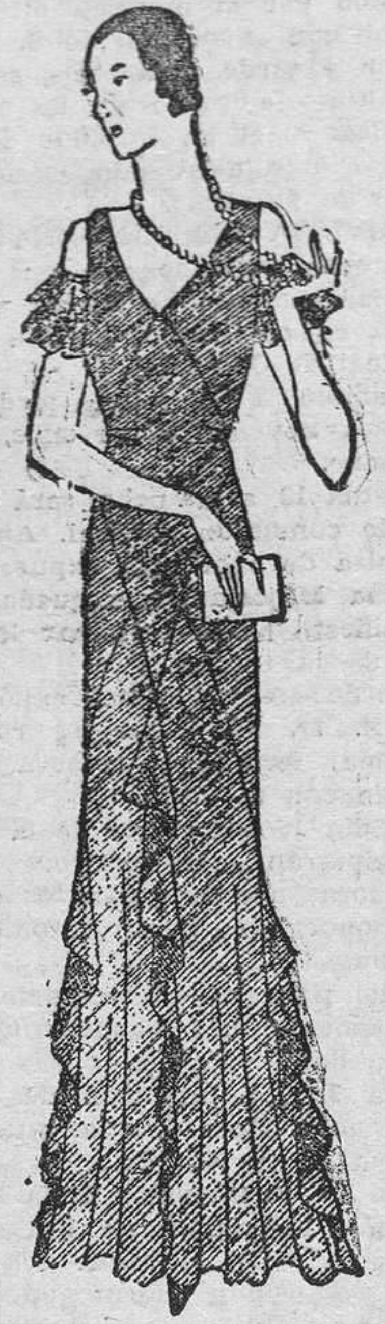
VESTIDO PARA NOCHE

De "crépe" azul oscuro y "crépe" azul claro. Mangas anchas y puños de "crépe" azul oscuro.