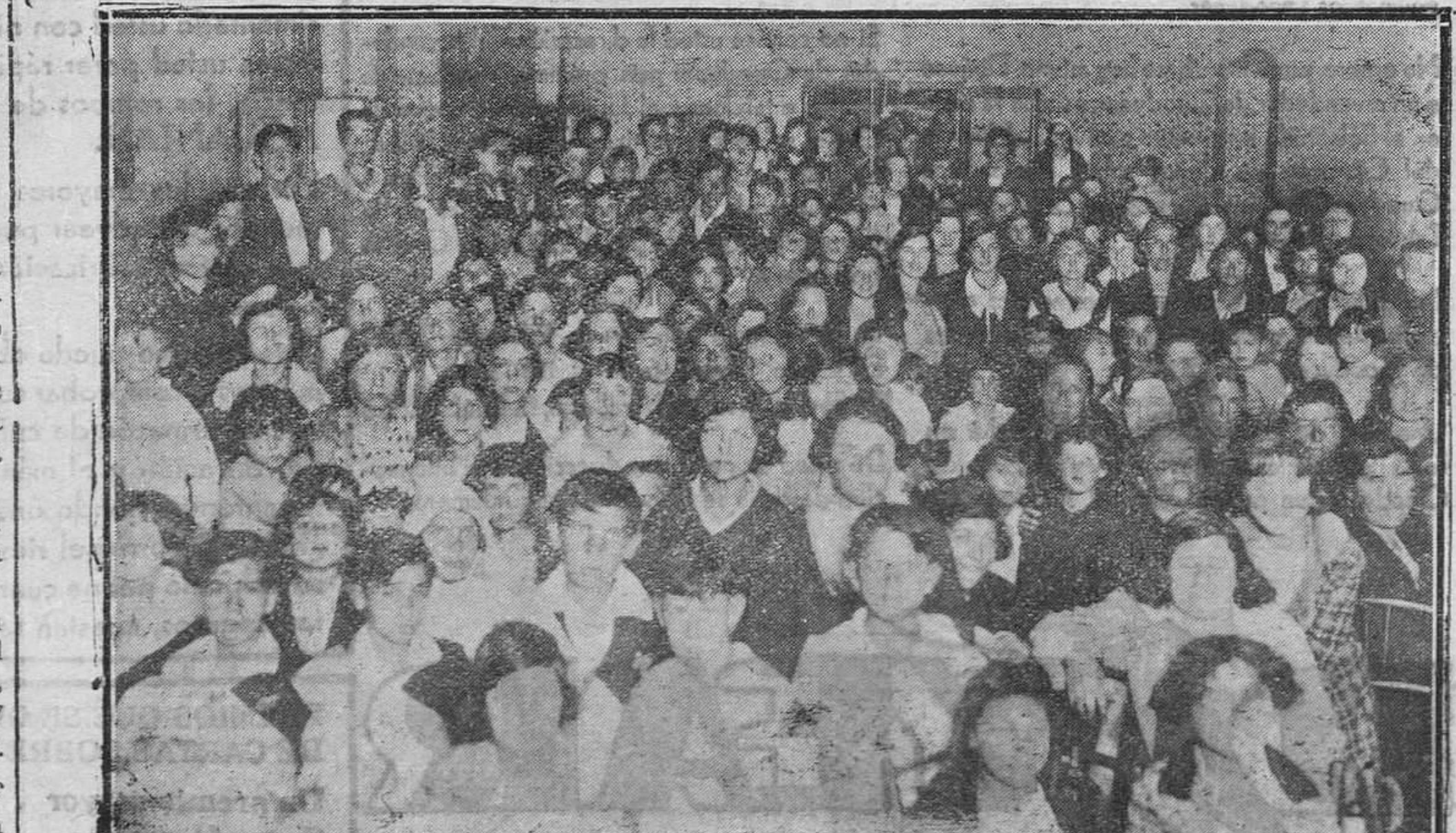
OVIEDO.—Los niños del Catecismo de San Lázaro que asistieron a la velada de Acción Católica de la Mujer.

TOKIO.— Charles Chaplin ha sido acogido con grandes demostraciones de entusiasmo popular al llegar hoy a esta capital, procedente de Kobe. Miles de personas esperaban la llegada del actor cinematográfico en la estación ferroviaria. Chaplin fué recibido también con grandes agasajos esta mañana en Kobe. Para el tren especial que conujo a Charles Chaplin y sus admiradores desde Kobe a Tokio, se utilizaron dos locomotoras y dieciseis coches de ferrocarril. Sábase que el conocido actor piensa quedarse un mes en el Japon, y después seguir su viaje alrededor del mundo.