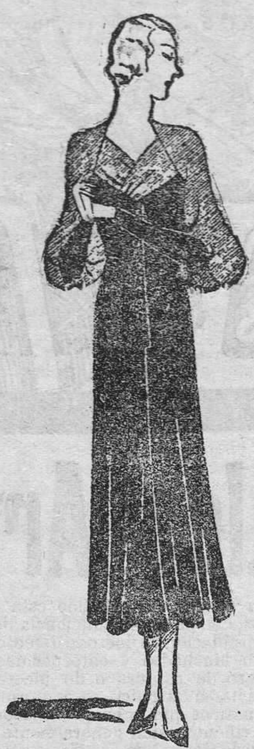
VESTIDO PARA TARDE

Tiritas, secciones e incrustaciones, adornan estos finísimos zapatos de horma de sandalia o de clásico corte saka.