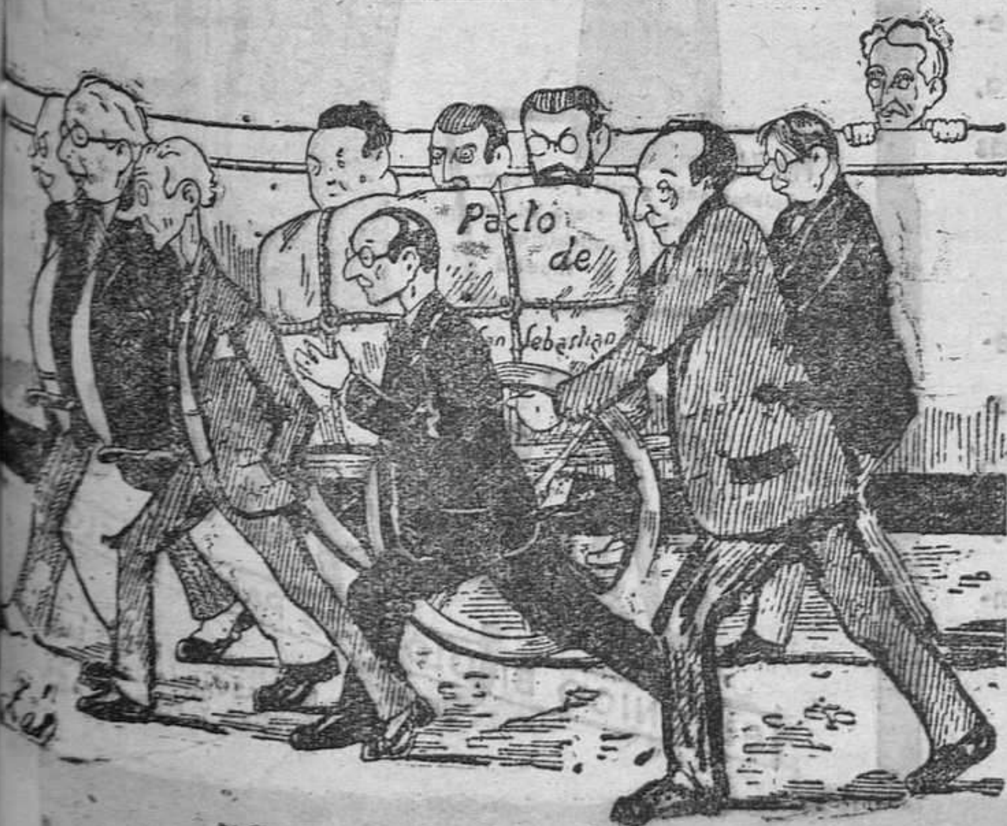
¡Caray lo que pesa este fardo!!