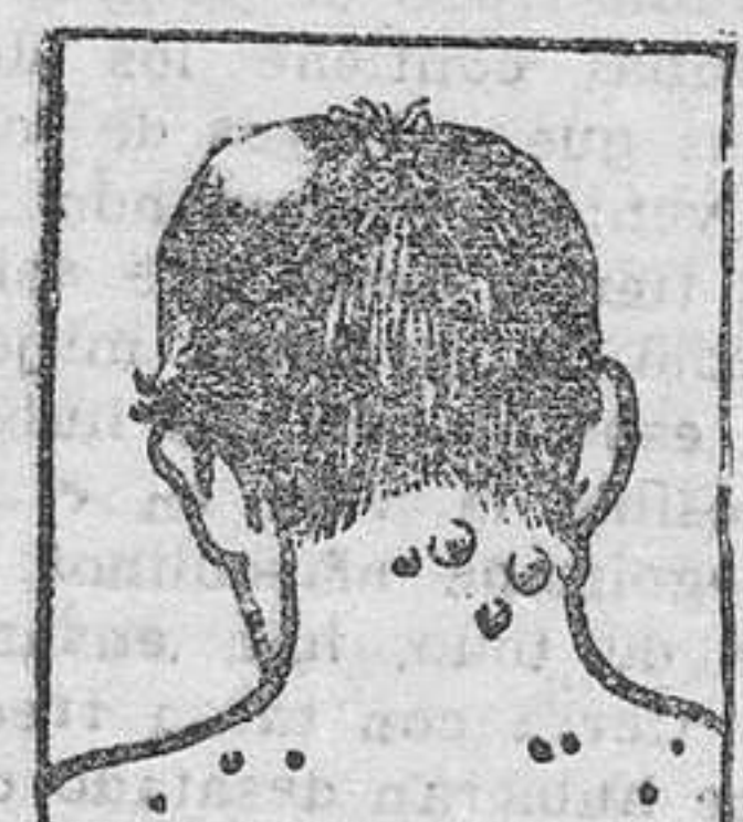
Granos - Foruncles