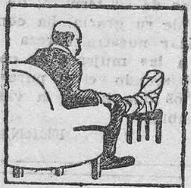
Gota - Dolores