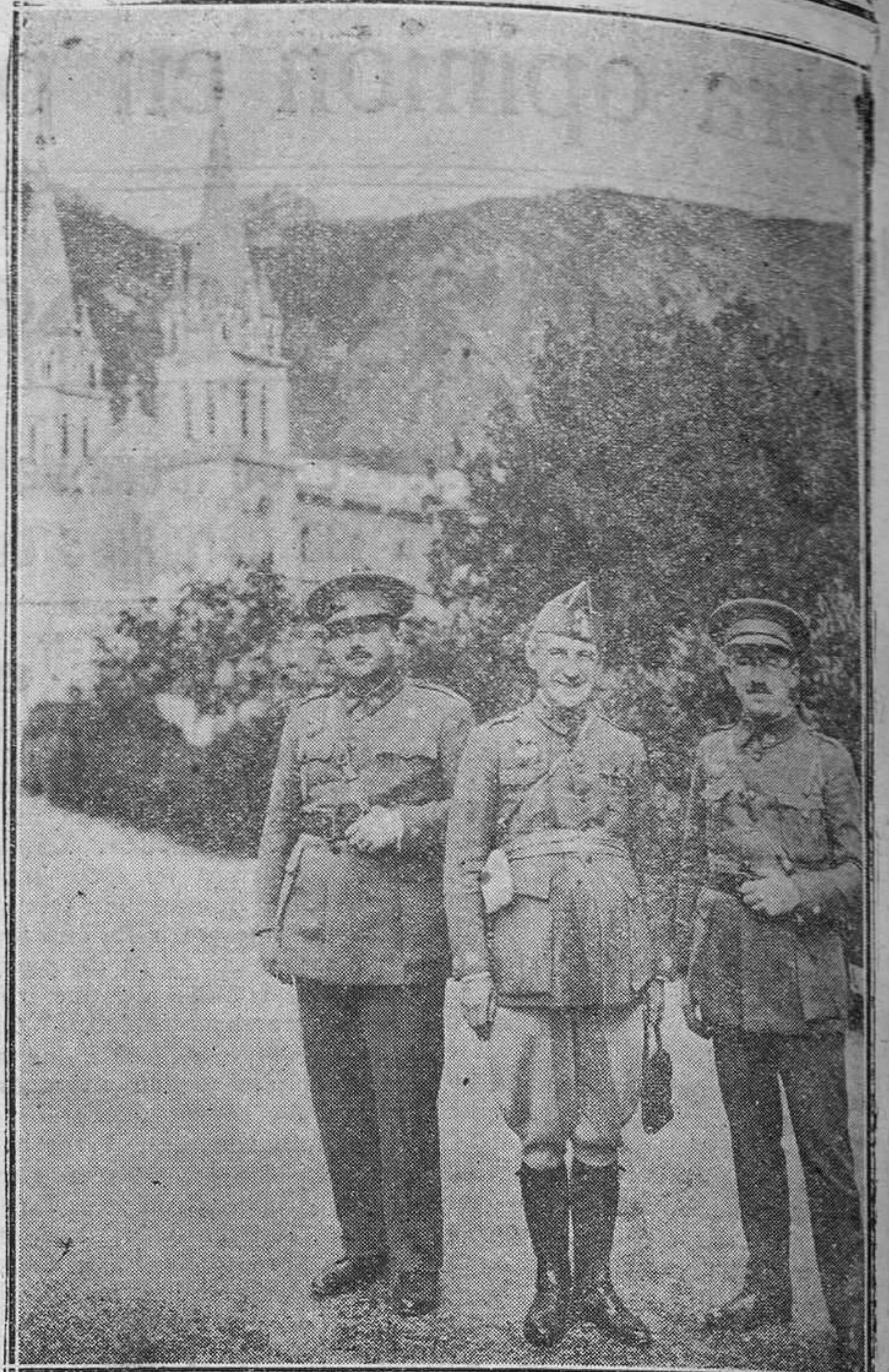
Profesores de la Escuela Superior de Guerra que en viaje de prácticas por varias provincias de España visitaron Covadonga el día 3 del actual.

18.25: Radio Teatro. — 20: Concierto. — 21.20: Informaciones. — 21.45: Música ligera.