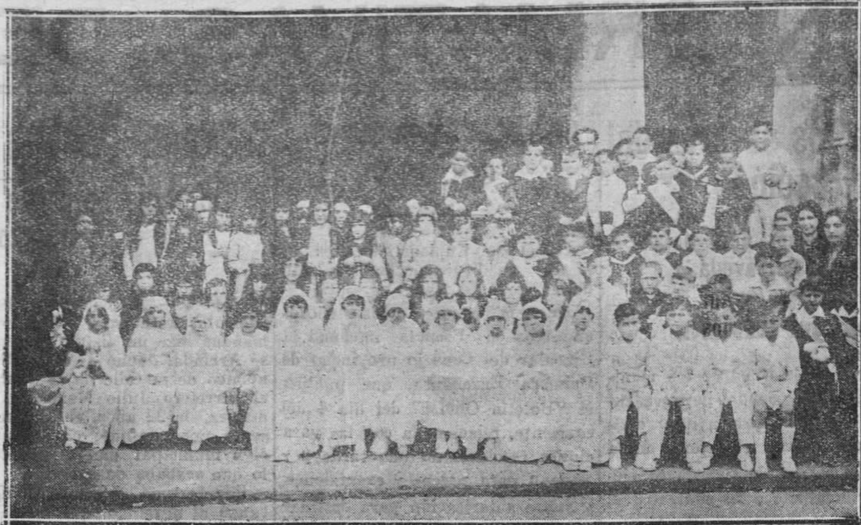
POLA DE LENA.—Niños que han hecho la primera comunión en esta iglesia parroquial.

Nosotros, ante lo reconfortante de la fiesta, tenemos que felicitar a cuantos han tomado parte en la preparación de los nuevos comulgantes, y en manera especial a nuestro párroco, por lo mucho que han tenido que sacrificarse en todos los órdenes: pero Dios se lo pagará.