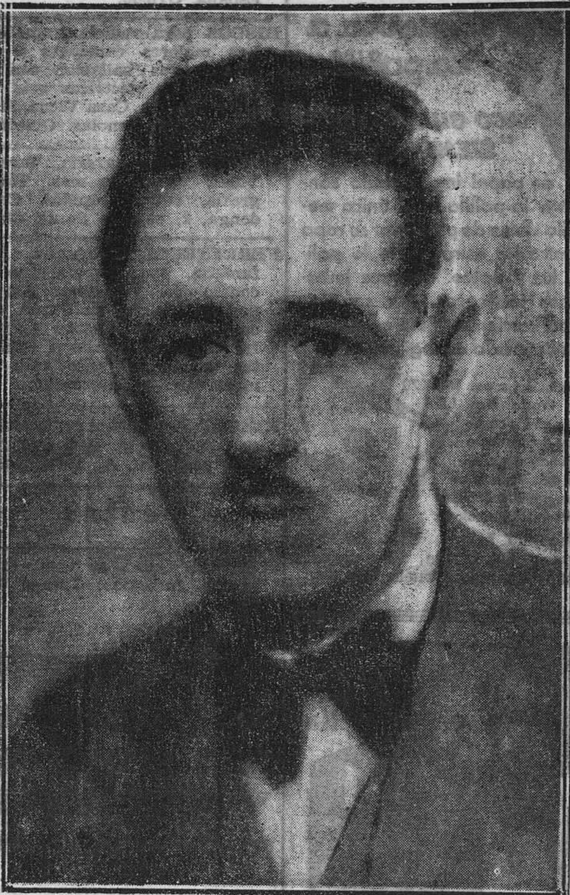
Ya es alcalde de Oviedo, don Félix Miaja, después de innumerables cabildos. Llega en circunstancias harto difíciles para la vida del Municipio de Oviedo. Tenemos muy poca fe en esta etapa municipal, pero deseamos, claro está, en bien de todos, que realice una brillante y fructífera labor.