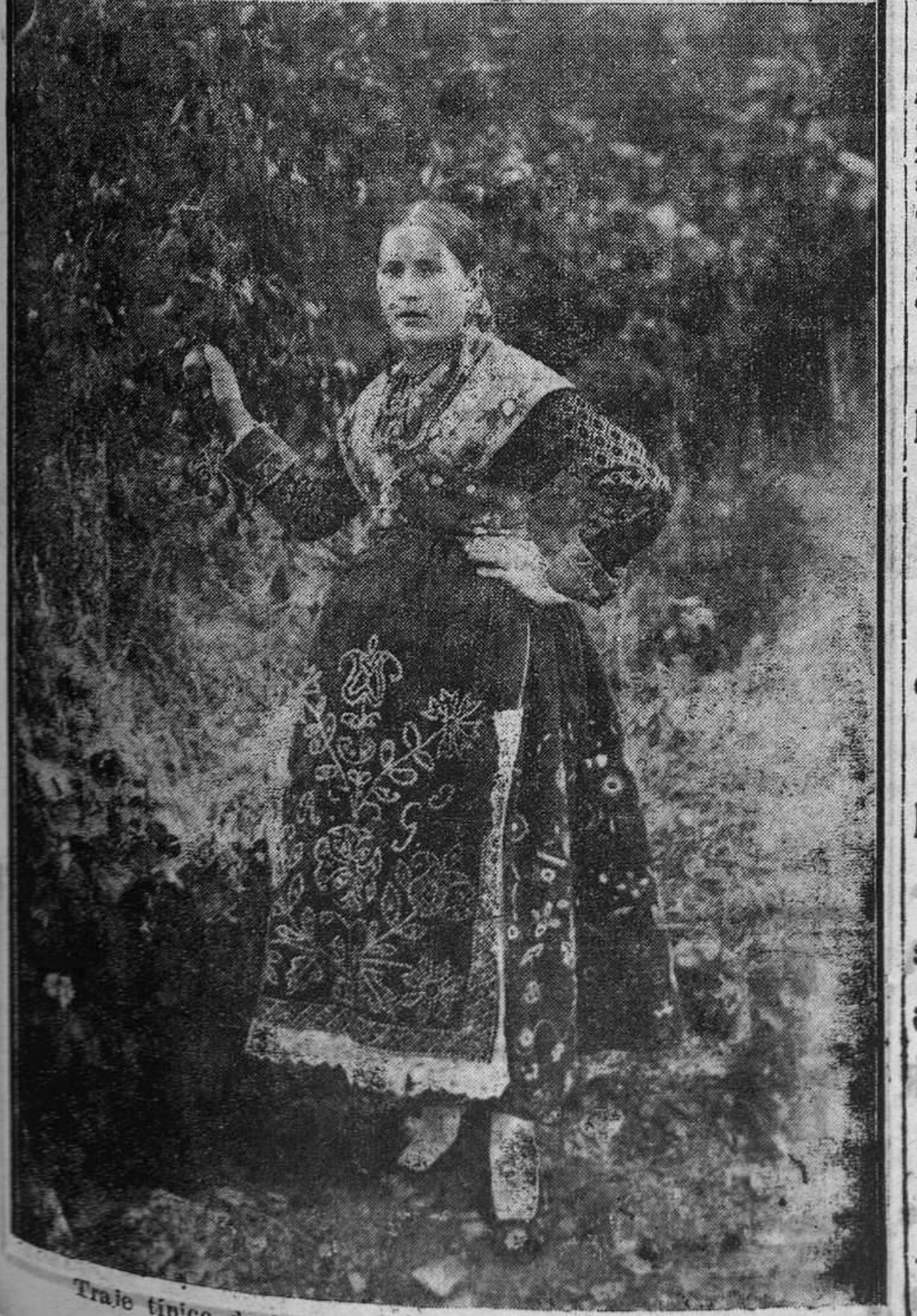
Traje típico de la provincia de Zamora. (Foto Vidal).