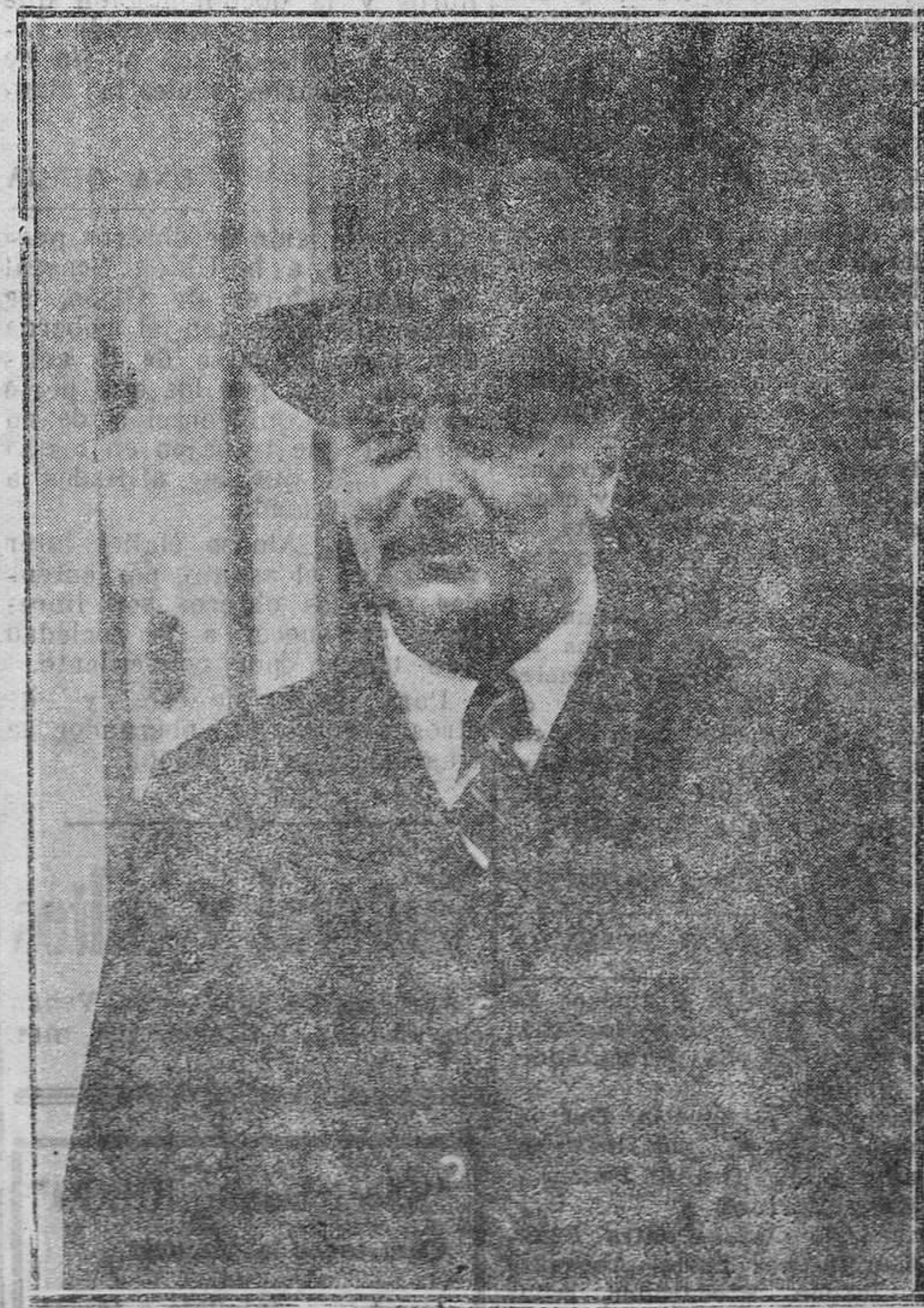
H. G. Wells, el notable literato inglés, que hoy esperado en Madrid y que el jueves dará una conferencia en el teatro Español.