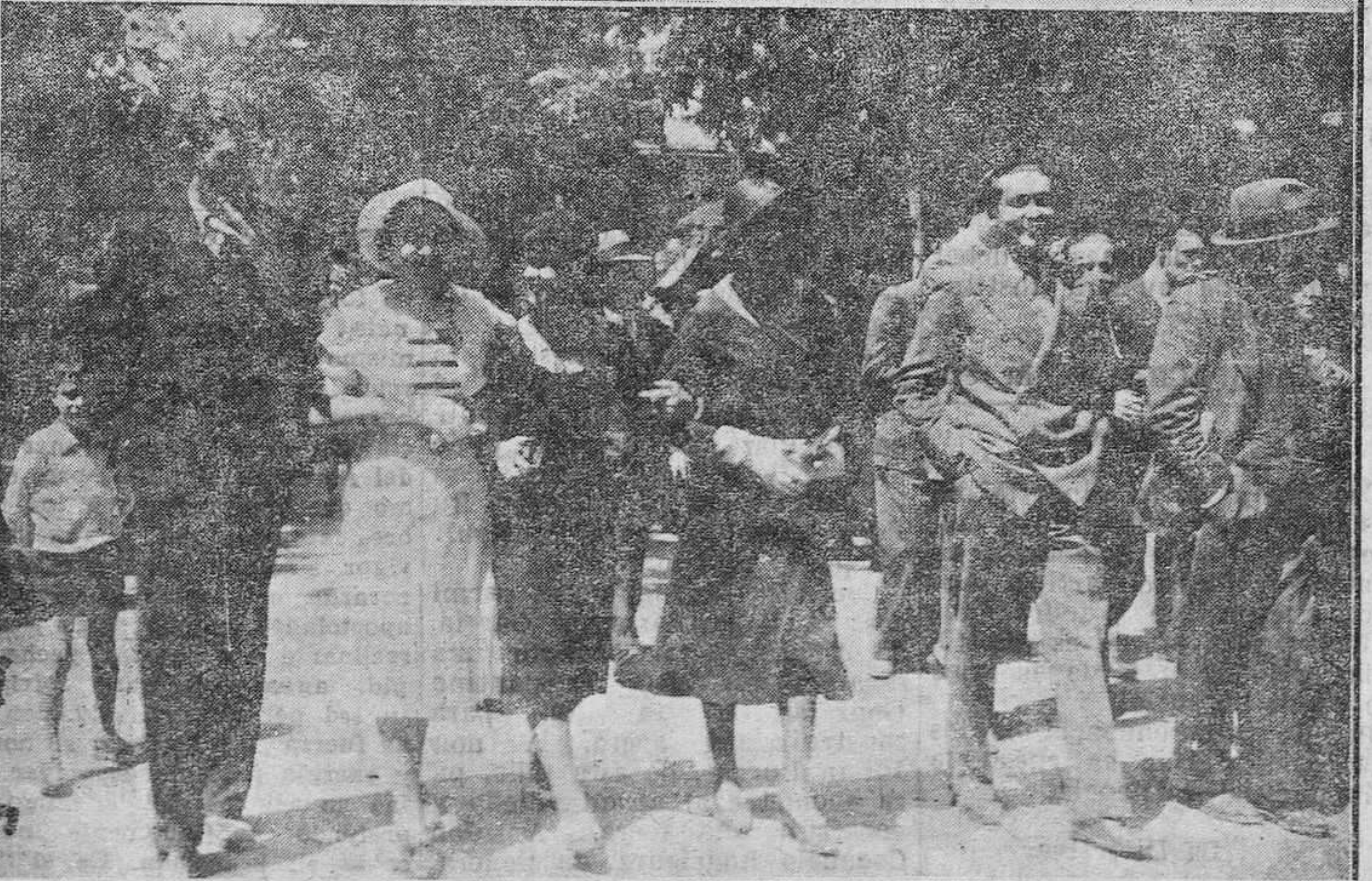
ARRIBA: El puesto de reparto de los bollos a los socios de La Balesquida.—CENTRO: La carroza con un "cargamento" de "gwapes neñes", anunciando el acto del reparto del "bollo" y el vino. ABAJO: "Ella y éllos" de paseo en el Campo de San Francisco, donde se celebró la fiesta.

En los artificiales pradecillos, se estaban celebrando muchísimas comidas al aire libre. Entre ellas, llamaban la atención especialmente las de no pocas tertulias de amigos. En una de ellas, titulada "El Aguarrás", se cantaba ya por todo lo alto hacia las tres de la tarde, y no menor era la animación en las demás, entre las que había otra, presidida por un quintosol descomunal de vistosos colores, bajo el cual se cobijaban, entre otros elementos, un guitarrista y un panderctólogo, mientras desafiaba al viento un enorme rótulo que decía: "Tertulia de 'El Culerín'.—Ya somos bastantes". No hay que decir que en cada una de ellas, formaban respetables pirámides las cajas de botellas de sidra.