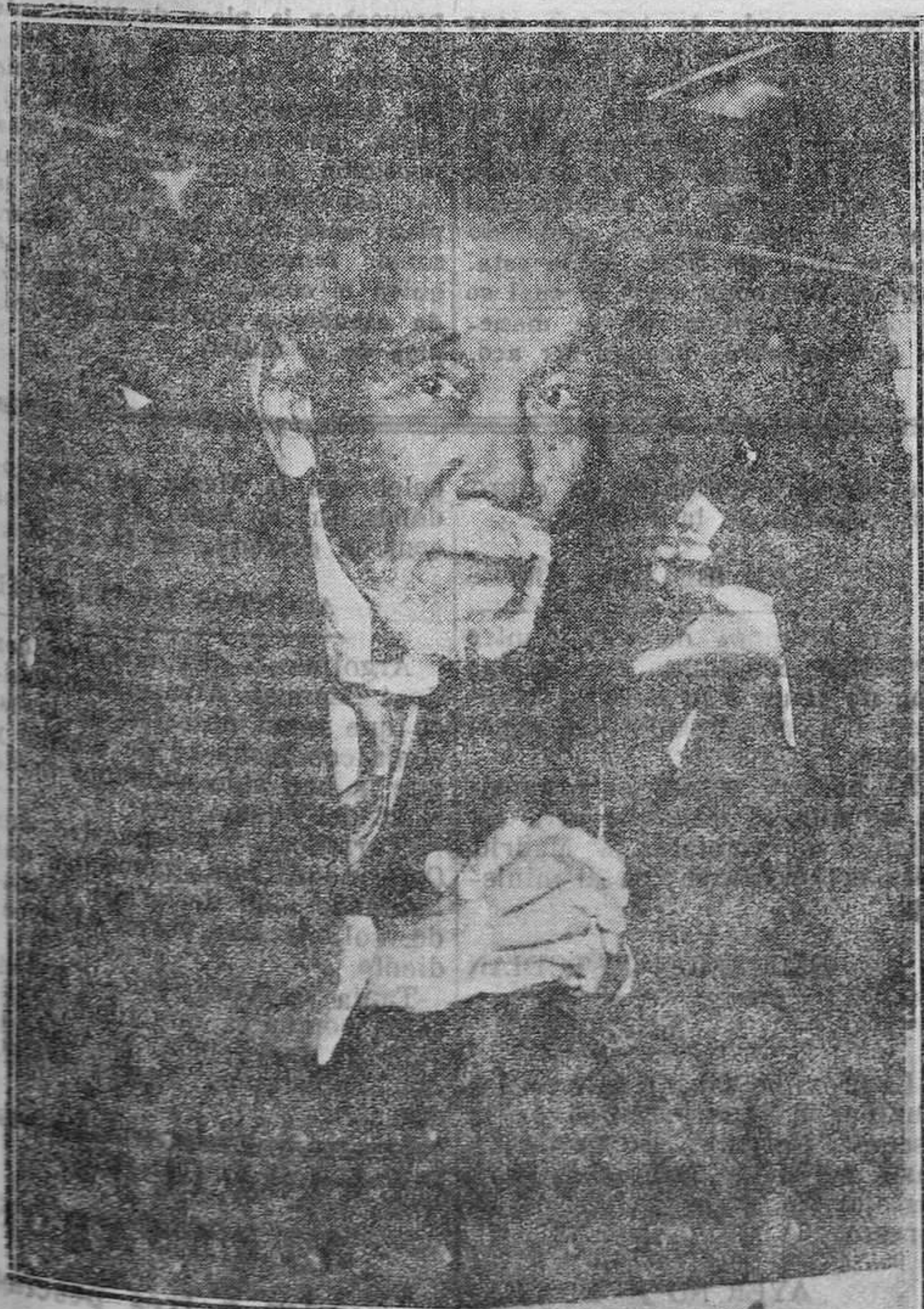
Takeshi Inukai, primer ministro del Japón, que ha sido muerto a tiros.