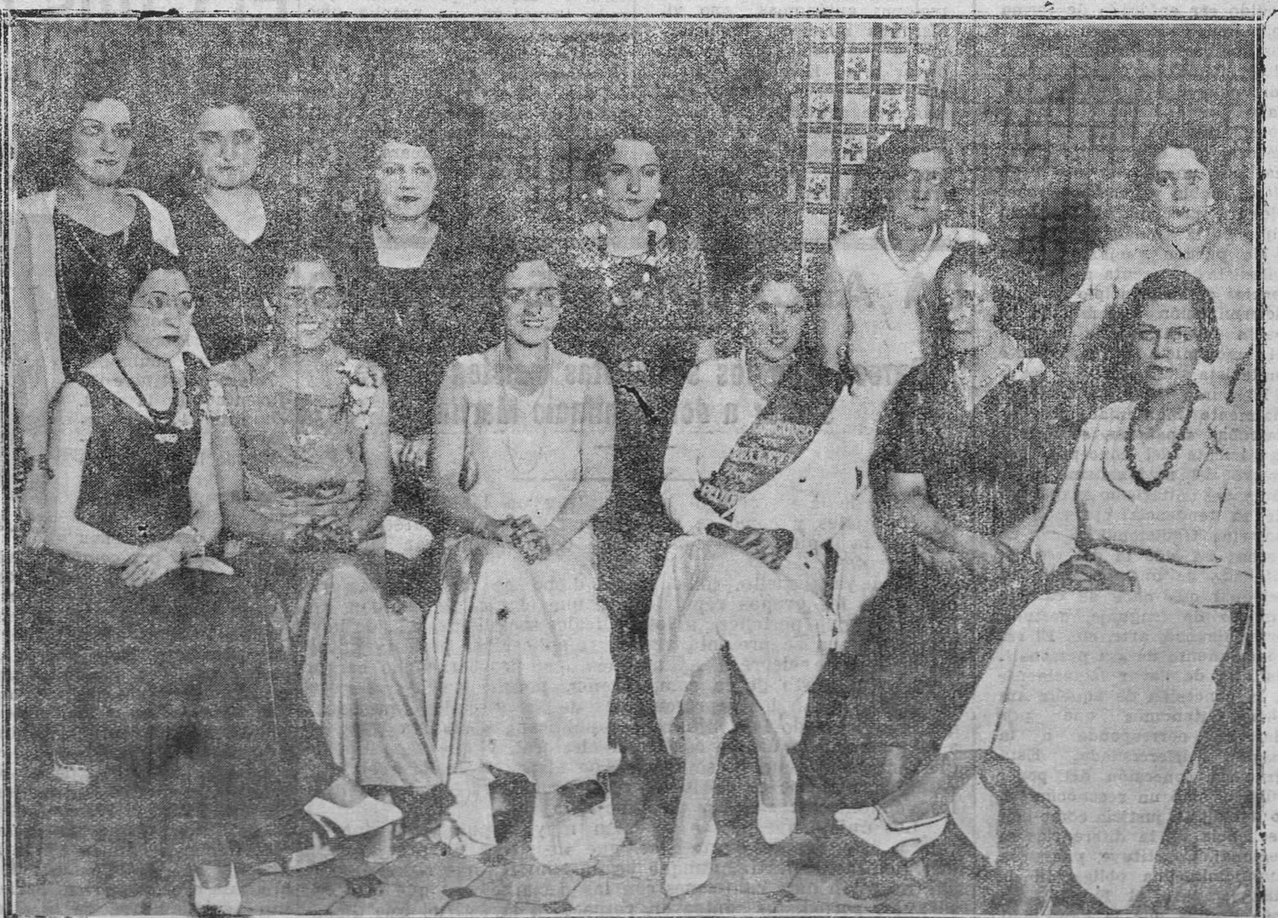
BILBAO.—La reina de la belleza de los peluqueros. (Foto Gil del Espinar).