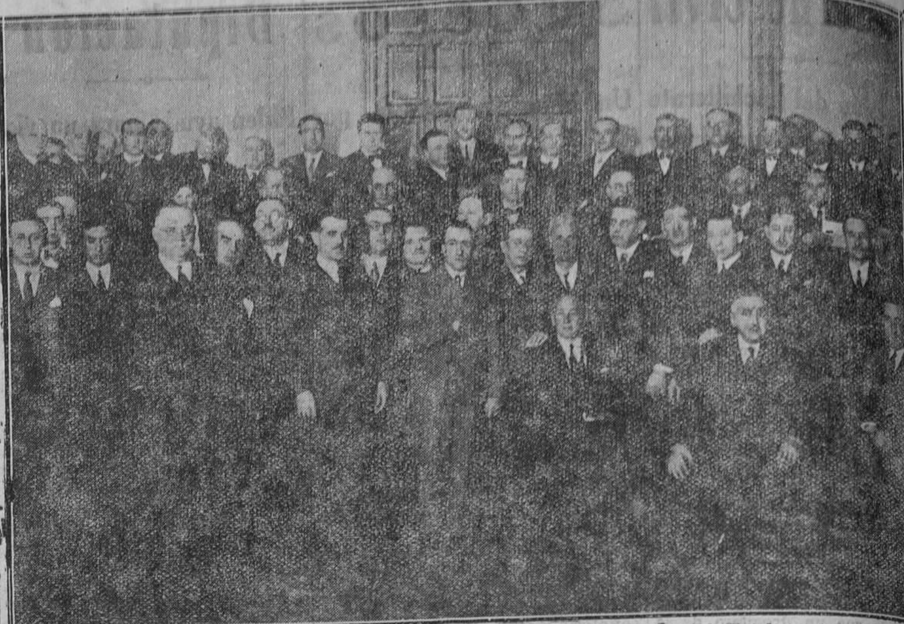
MADRID.—Grupo de concurrentes a la asamblea de la Cámara Oficial Hotelera, acto celebrado en el ministerio de Agricultura.

A continuación nos dijo nuestro amable comunicante, que dicha torre quizás haya sido, según testimonio de Seigas, la de la muralla primitiva de Oviedo en tiempos del rey Alfonso el Casto; y, según otros, la torre primitiva de la Catedral. También pudo haber sido —agrega— la torre del Palacio de los reyes, que estaba situado muy cerca.