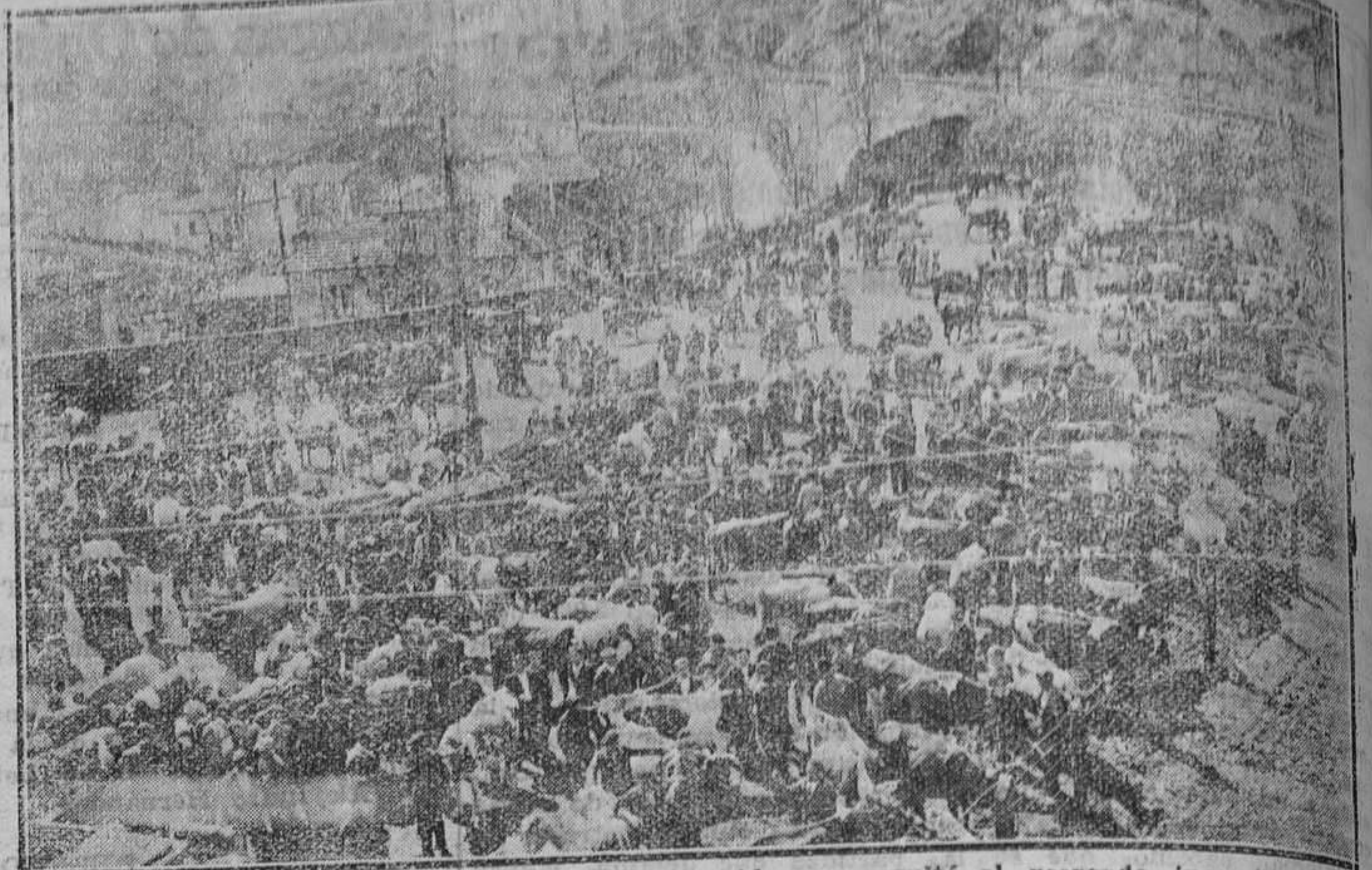
LLANES.—Un aspecto que indica lo concurrido que resultó el mercado inaugurado en esta villa, que promete halagüeñas esperanzas.

Como llanisco, debemos congratularnos de que este mercado inaugurado el martes, haya nacido con la pujanza que lo hizo, prometedor de un porvenir francamente rosa.