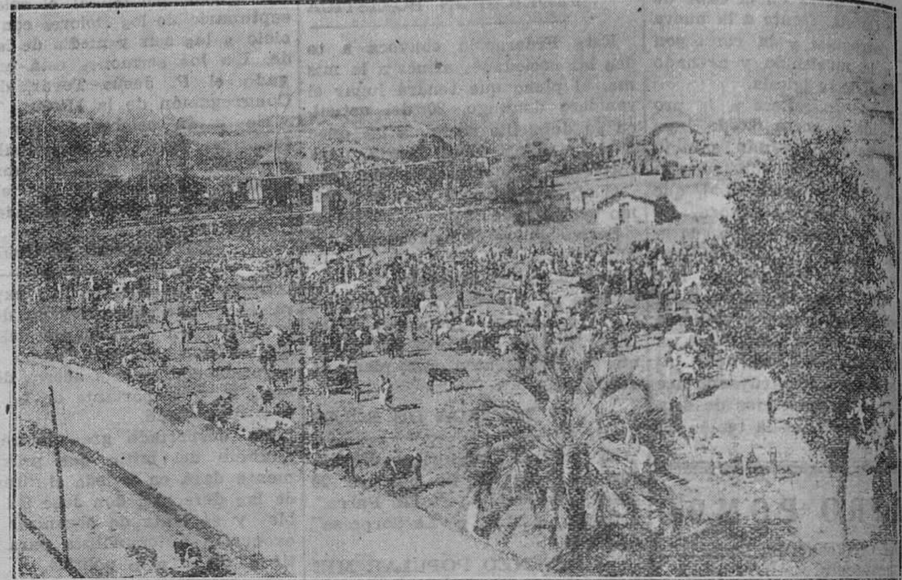
LLANES.—A la hora de terminarse el mercado el tren pasó propicio para recoger los reses que ha de llevarse para las grandes urbes.