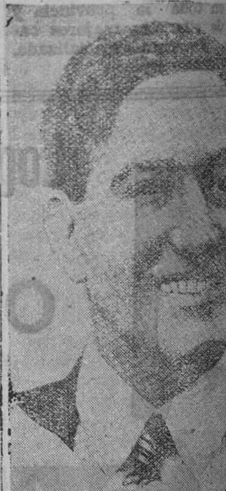
Miguel Fléta, que cantará hoy en Oviedo por primera vez.

BARCELONA.— La Guardia civil ha puesto a disposición del Juzgado a un individuo acusado de ser uno de los autores del atraco cometido hace días en la carretera de Rabasada.