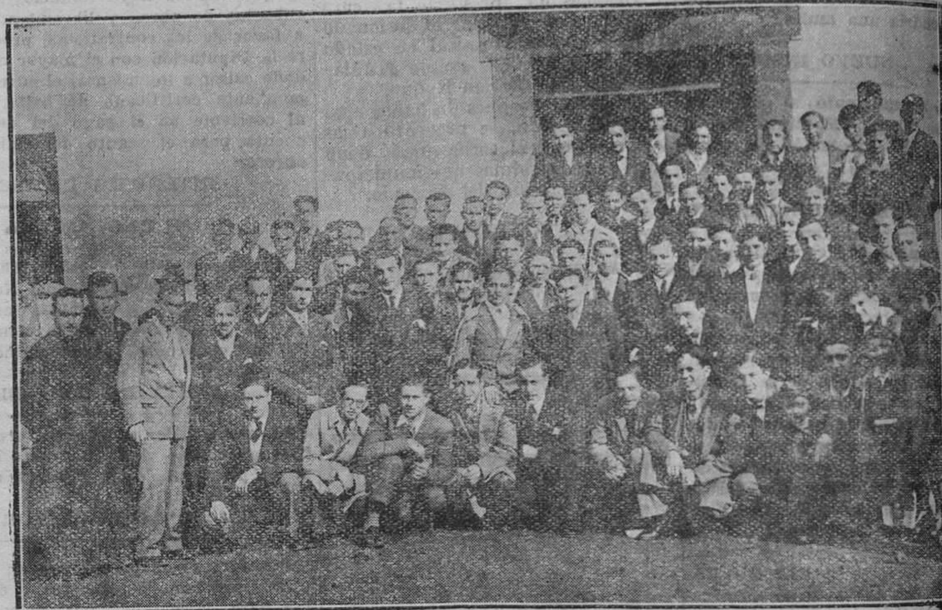
PRAVIA.—Un grupo de la Juventud Católica momentos des pués de asistir a la misa de comunión general, celebrada el día 13 del corriente, fecha del segundo aniversario de existencia de dicha Asociación. (Foto C. López).

REGION Apartado número 42 Teléfonos 1516 1517