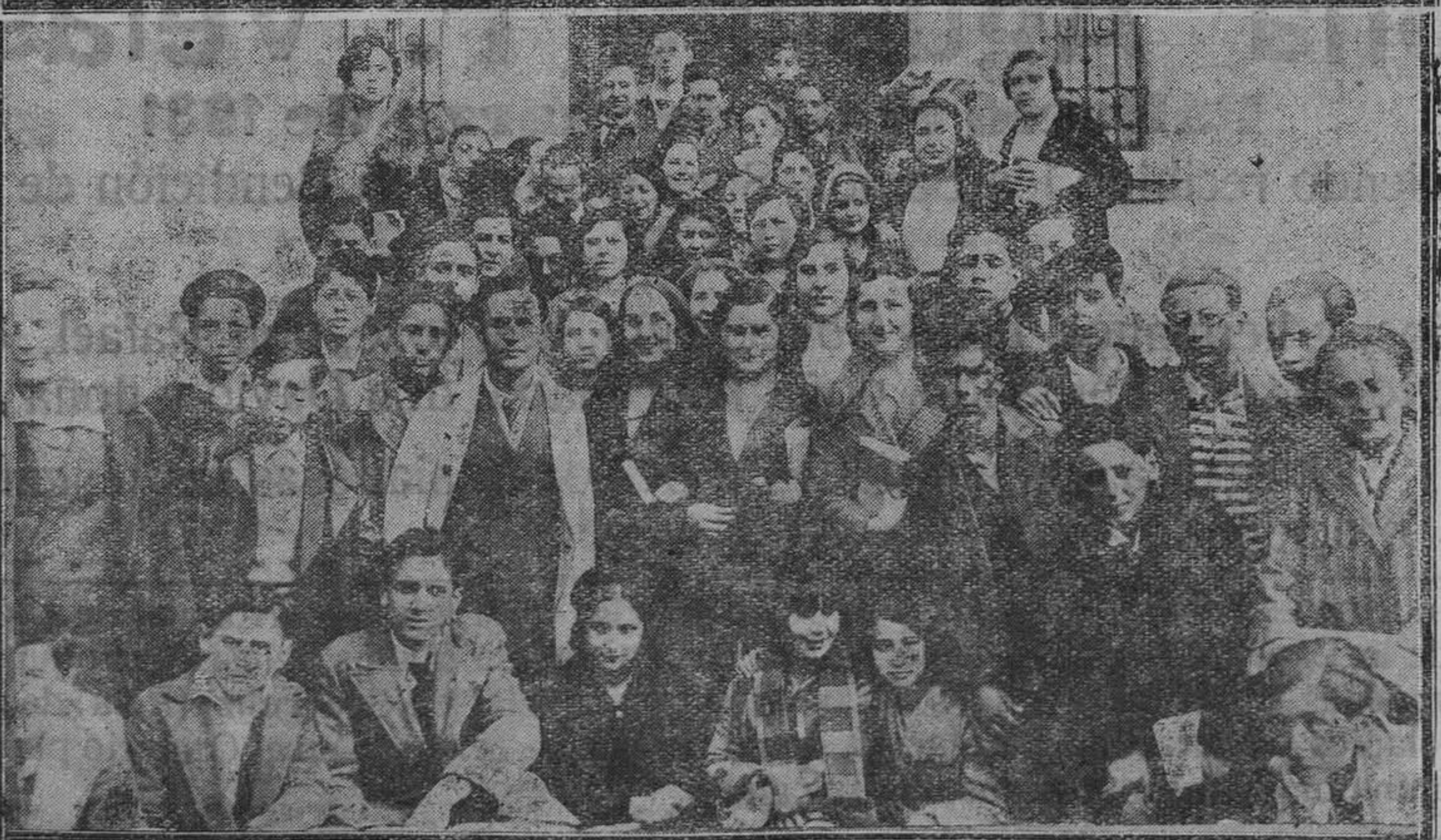
El Colegio de los Jesuitas de Oviedo, donde han quedado instaladas las clases del Instituto. Grupo de alumnos de dicho centro oficial de enseñanza.