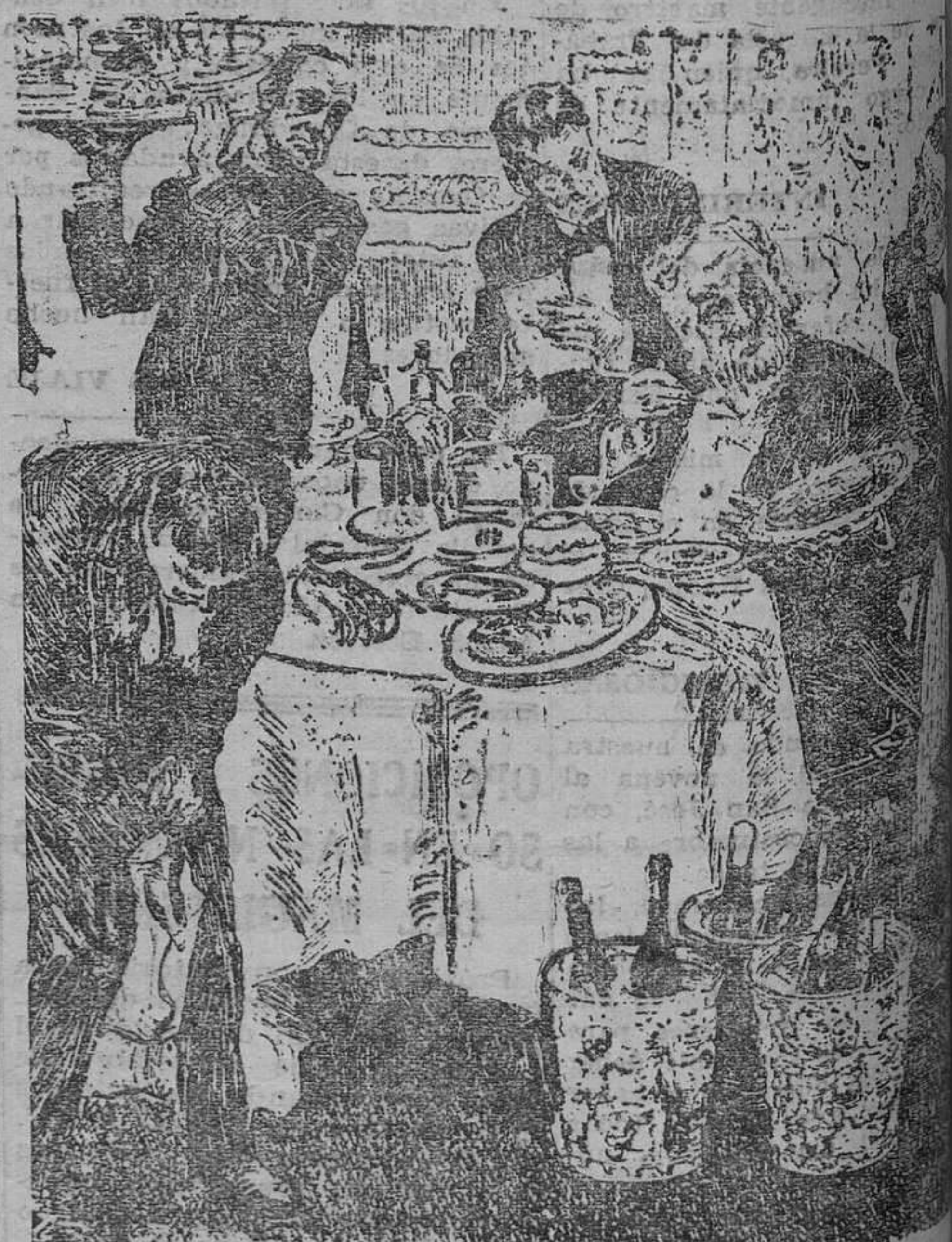
—¡Oiga, mozo! Tráigase el éter, porque este bifee está nervioso.

Volviendo al tema primero de la conversación, dijo que no negarse a estampar su firma en proposición porque necesitaba para que cuando tengan que le algún palo lo hagan solamente.