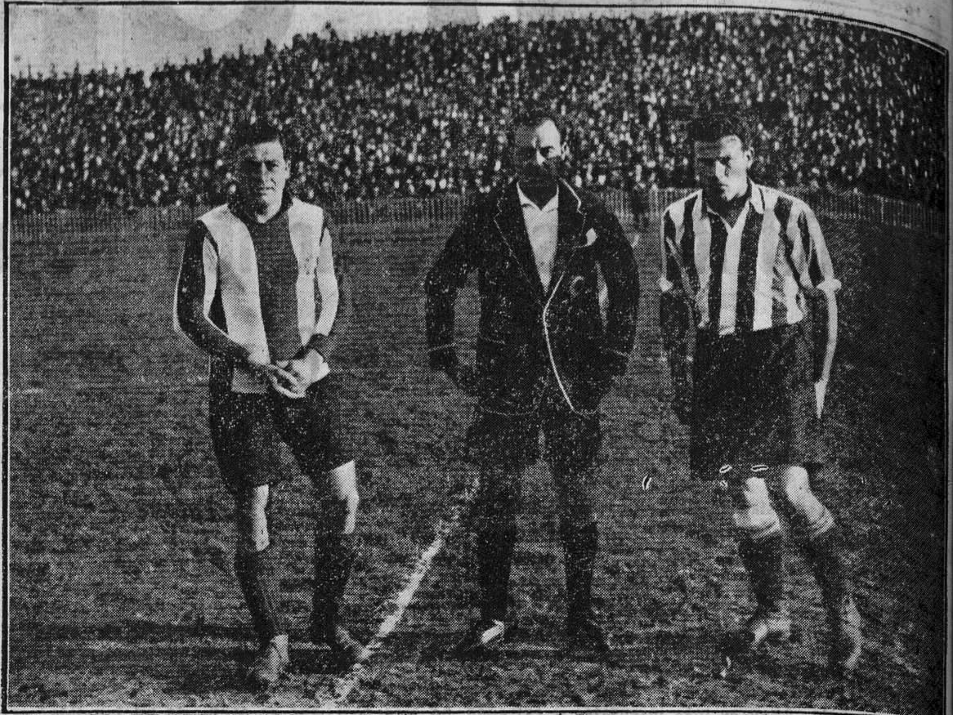
BILBAO.— Los capitanes y el árbitro antes del partido del domingo entre el Español de Barcelona y el Athletic de Bilbao.