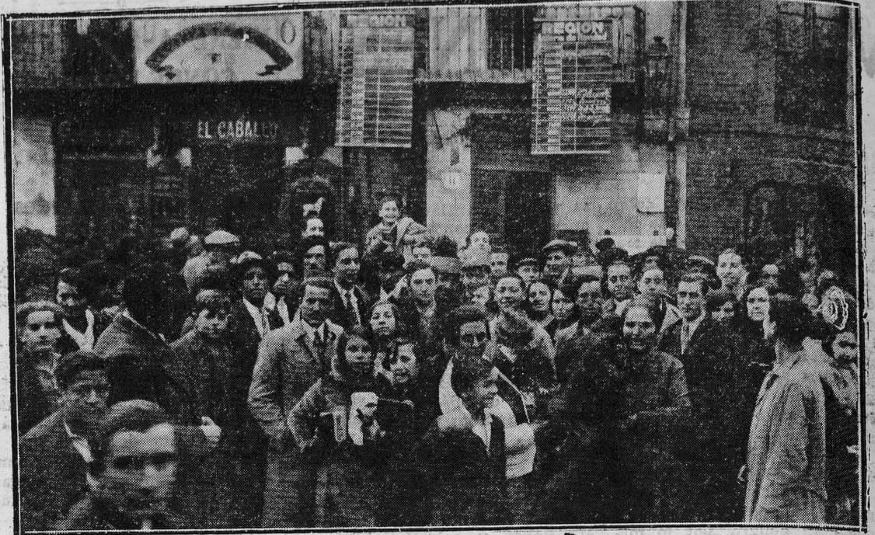
OVIEDO.—Nuestras pizarras, en la plaza del Ayuntamiento.