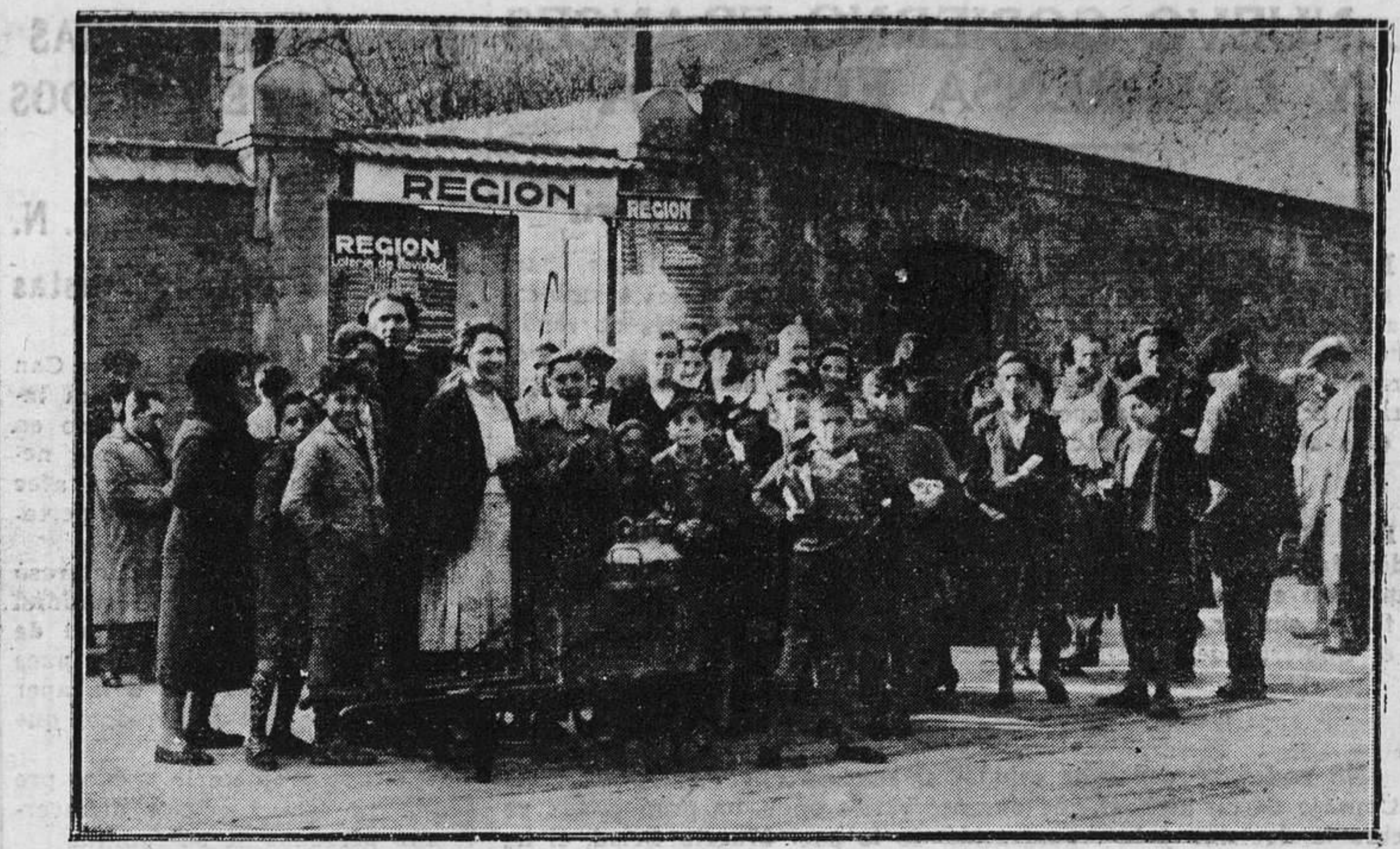
OVIEDO.— Nuestras pizarras, a la puerta de REGION. (Foto Mena).

Antes de las doce de la noche de anteayer, se sintió tiro en la barriada de La Pomar. Inmediatamente los de Asalto, y cuando se acercaban ya cerca al lugar del atentado explotó una bomba, que inmediatamente no les alcanzó. Este motivo se cree que el que precedió a la explosión de una especie de llamada a las víctimas en el momen-