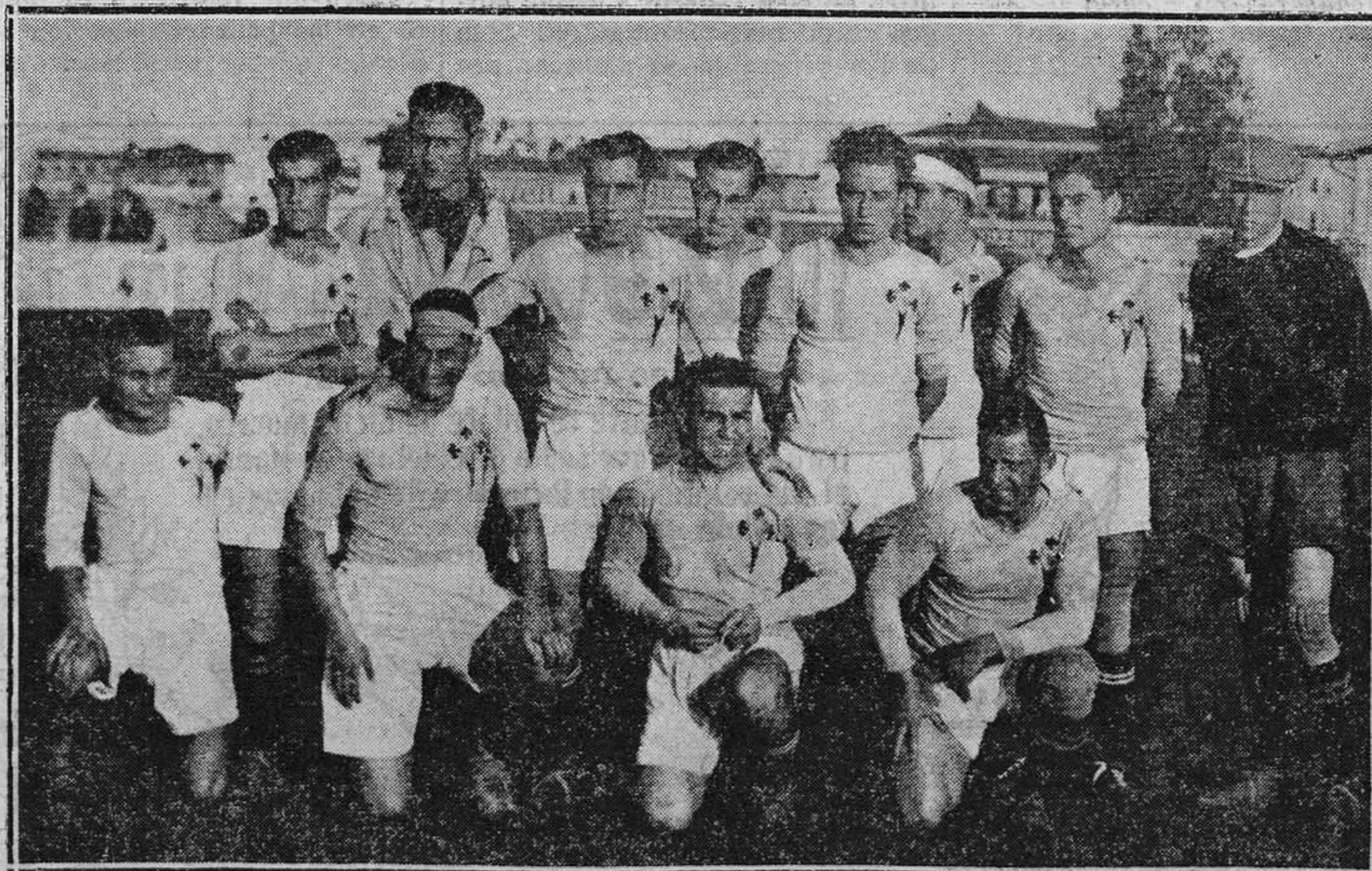
OVIEDO.— El Celta que jugó el domingo en Buenavista

Por este triste motivo del aniversario de la muerte del que fué tan excelente caballero, renovamos nuestro más expresivo pésame a todos sus familiares, pero muy especialmente a sus hijos.