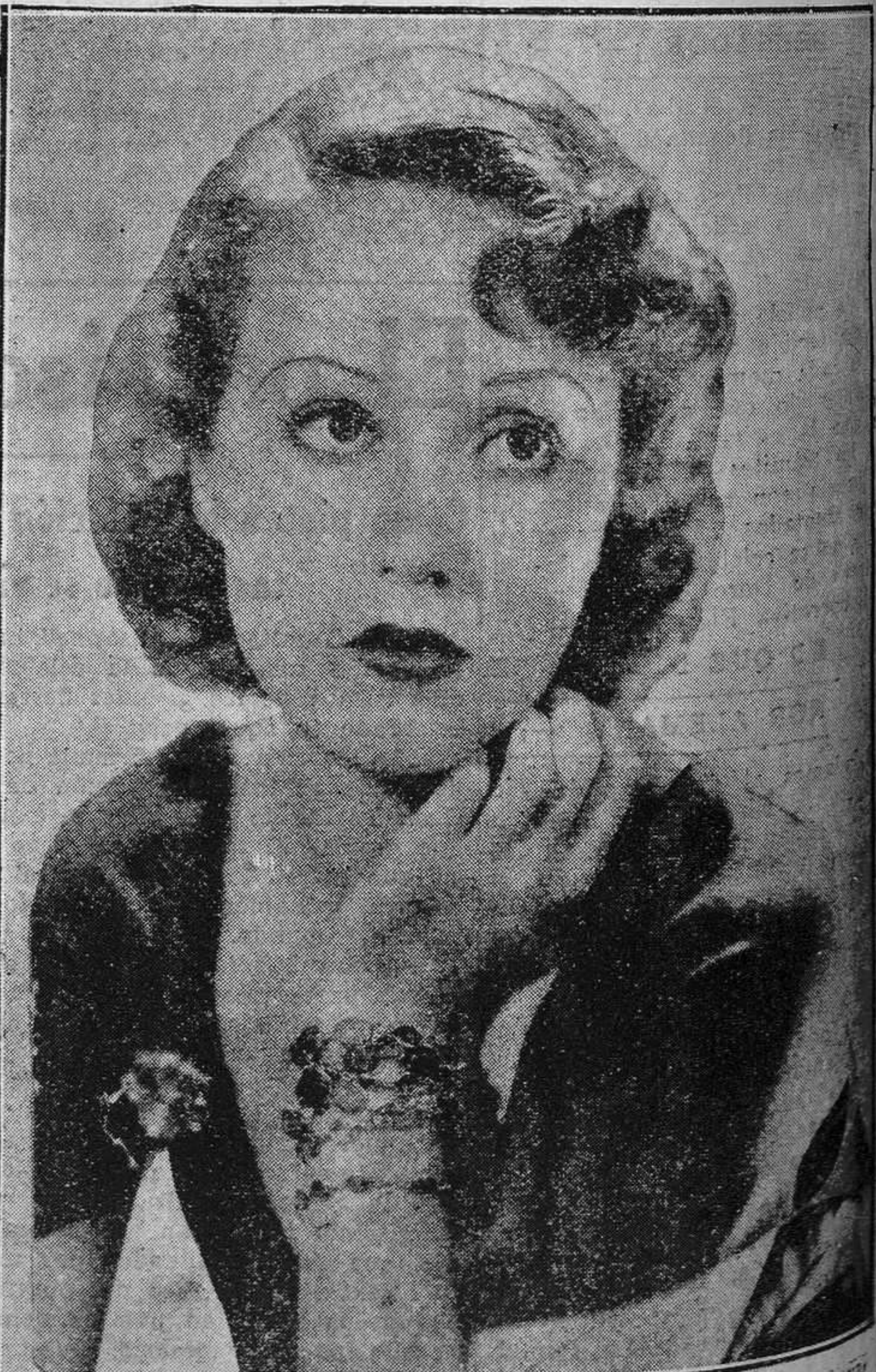
Esta belleza es Fray Way, que pertenece a las "estrellas" que ya no vemos. Y su "estrellato", no está tan lejano. Todavía el año pasado hubimos de admirarla en varias producciones, y decimos ahora mirarla, porque en realidad más atendía el espectador a sus singulares encantos que al arte que sus intervenciones destilaban. Nos la irupuso la Paramount. La Paramount nos la ha llevado. No hay noticias de ella, ni en lo que va de temporada hemos vuelto a ver su nombre en las películas de las diferentes casas que a nosotros llegaban.