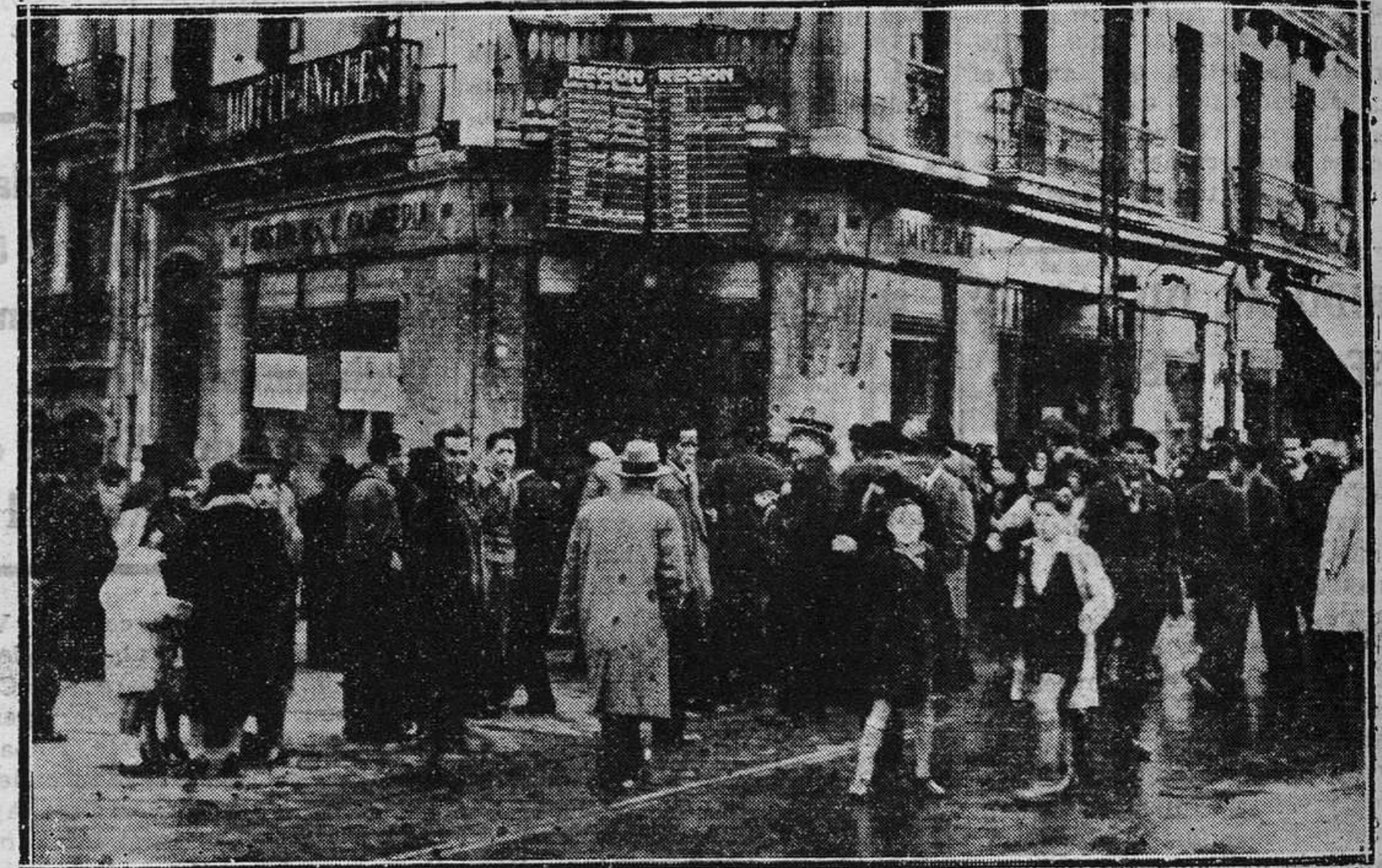
OVIEDO.—Nuestras pizarras en la calle de Fruela.

99 aproximaciones de 10.000 pesetas cada una para los 99 números restantes de la centena del primer premio. 99 aproximaciones de 10.000 pesetas cada una para los 99 números restantes de la centena del segundo premio. 99 aproximaciones de 10.000 pesetas cada una para los 99 números restantes de la centena del tercer premio. Dos aproximaciones de 100.000 pesetas cada una para los números anterior y posterior al del primer premio. Dos aproximaciones de 60.000 pesetas cada una para los números anterior y posterior al del segundo premio. Dos aproximaciones de 37.000 pesetas cada una para los números anterior y posterior al del tercer premio. Tienen reintegro todos los números que terminen en 7.