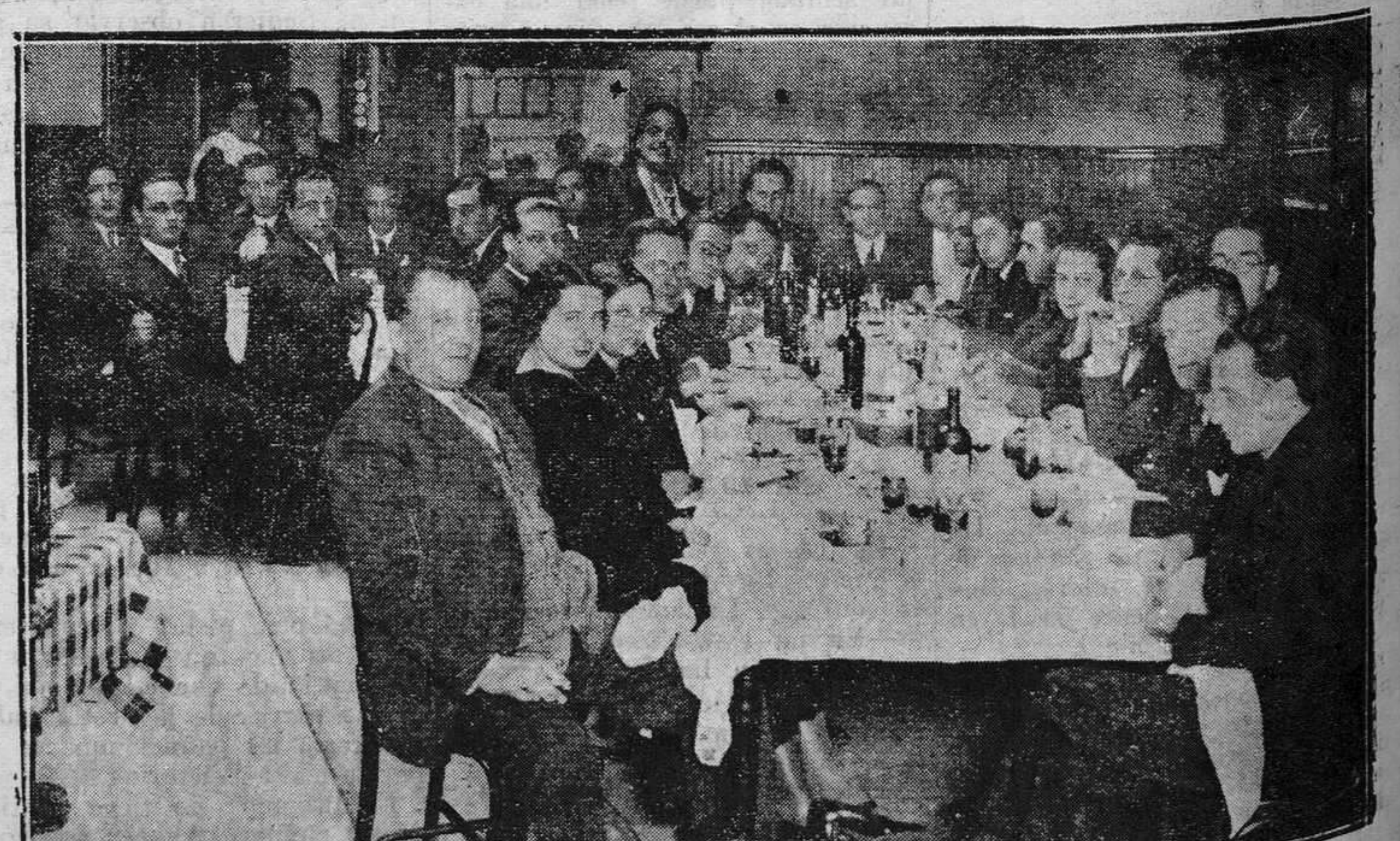
OVIEDO.— Banquete con que los médicos aspirantes al título de inspectores municipales de Sanidad pusieron remate al cursillo que tuvo lugar en el Instituto de Higiene.