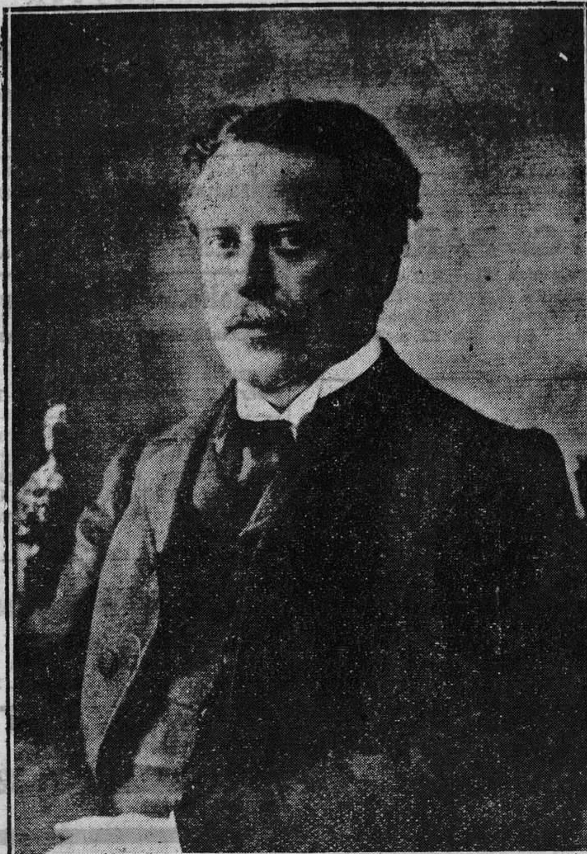
El dramaturgo francés Eugenio Brieux, que ha fallecido en Niza.

REGION publica los martes números de 20 páginas