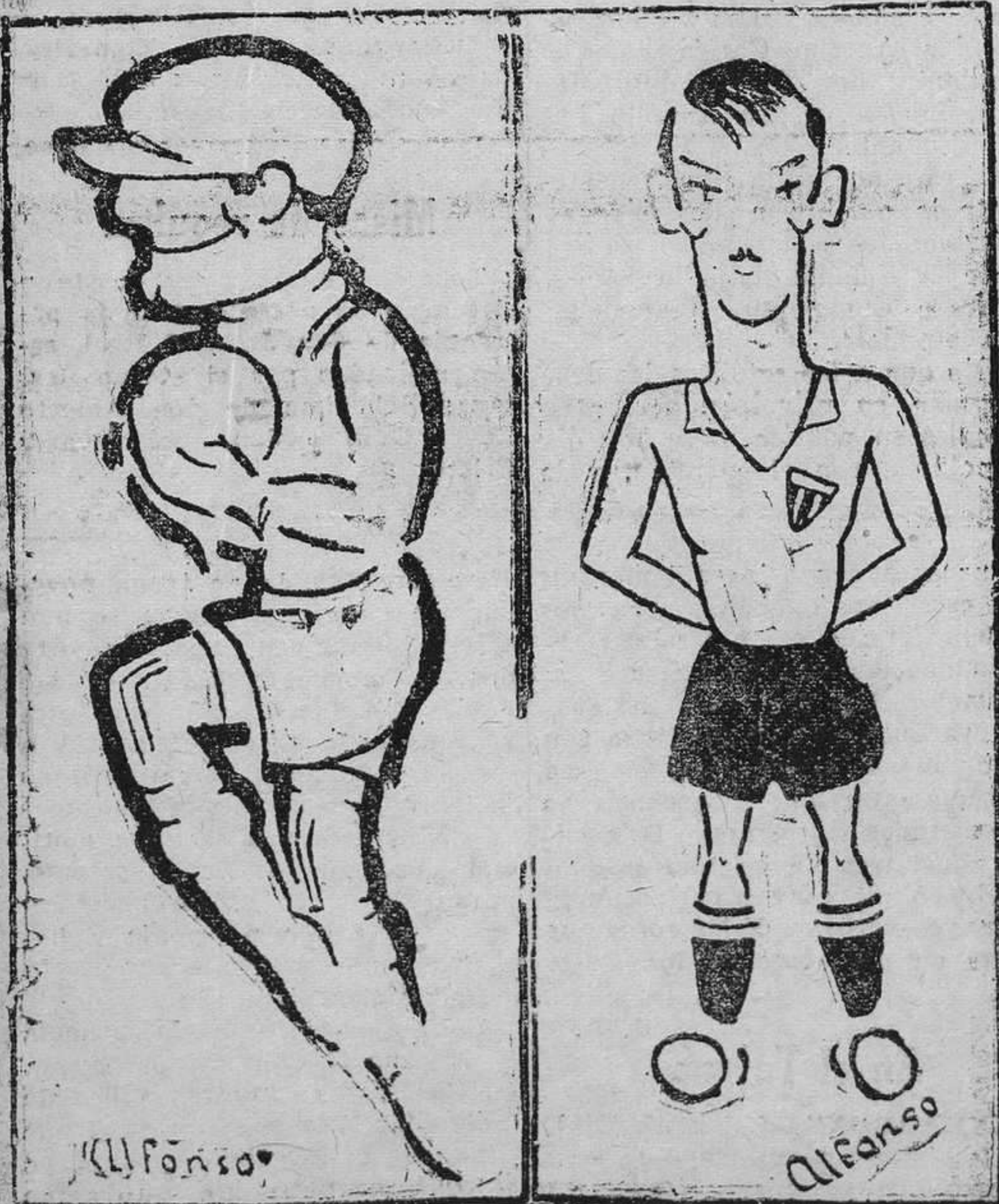
Oscar, el formidable guardameta del Oviedo, que es casi seguro de fienda hoy en Buenavista la puerta del Oviedo. Estrada, la "bala sacavera", una de las figuras más relevantes del "match" de hoy en Torre de los Reyes.