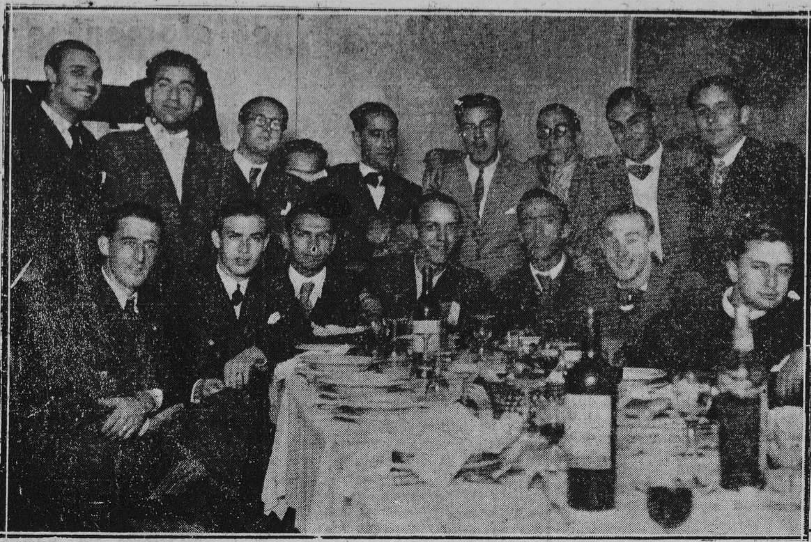
OVIEDO.—Los alumnos que terminaron la carrera de Derecho que se reunieron en banquete el viernes último.