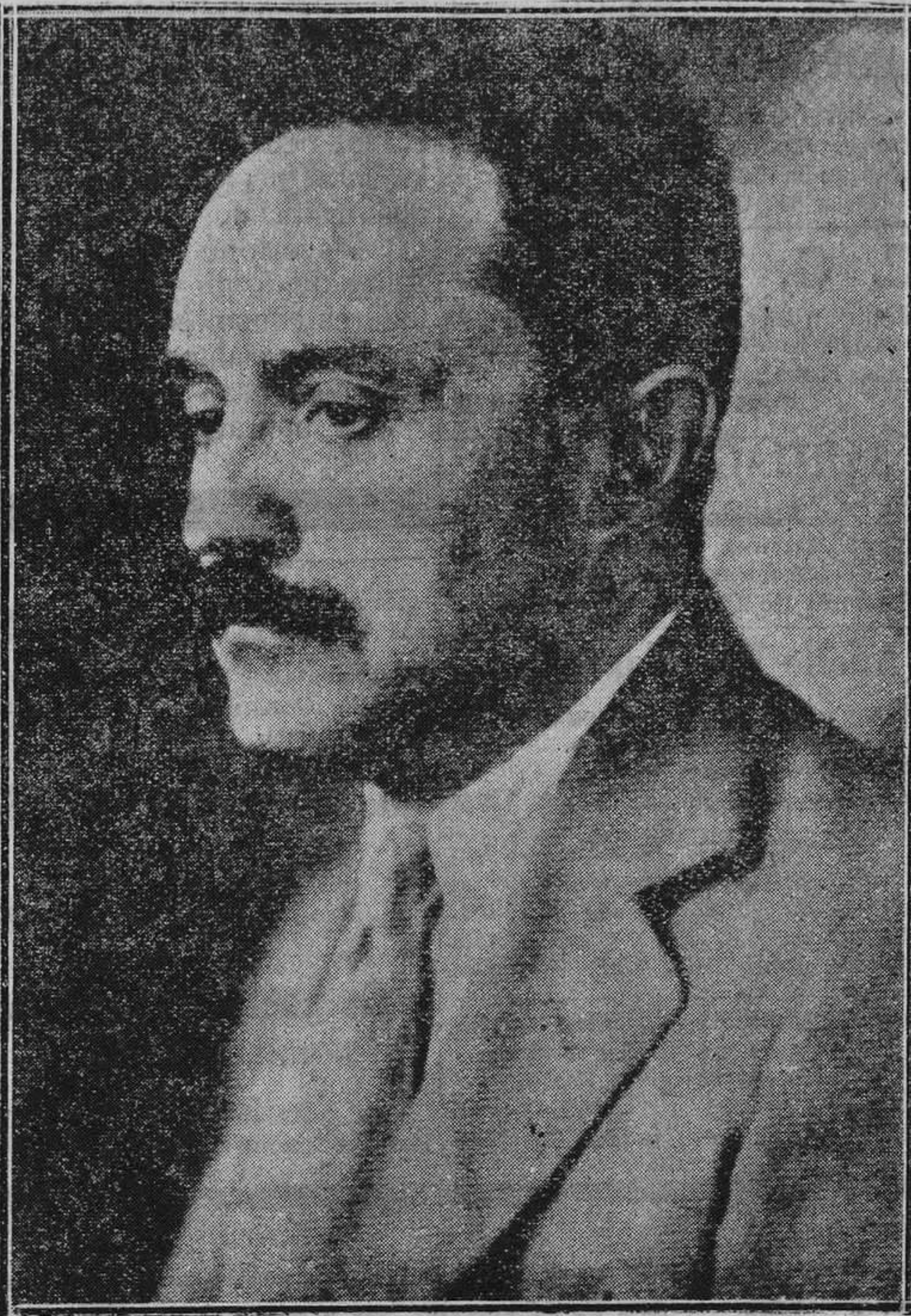
El ilustre político e intelectual mejicano señor Vasconcelos, que en Gijón ha hecho unas interesantes declaraciones para este periódico.

En un contrafondo se ocupa de la baja de la libra y dice que personalidades inglesas de relieve en las finanzas opinan que el Tesoro no debe, en manera alguna, intervenir para sostener a la moneda en cotizaciones artificiales.