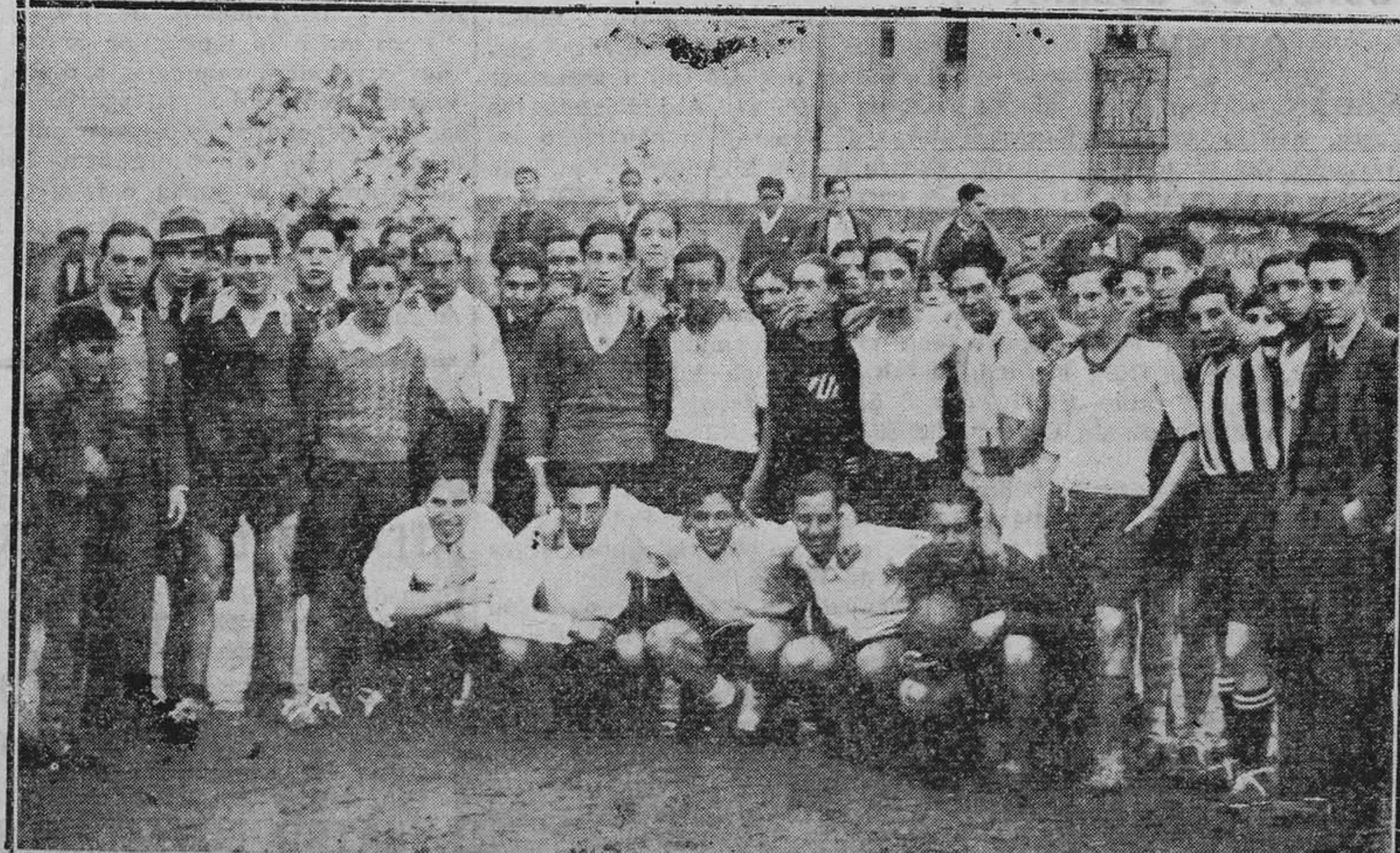
OVIEDO.—La fiesta de Santa Catalina. Alumnos de Ciencias y Letras que jugaron ayer un interesante partido en Vetusta.

estuvo destinado a Comandancia de Carabineros, a fin de que no se demore la declaración de monumento nacional a favor del claustro de San Vicente ni el envío de los fondos necesarios para su restauración, de conformidad con lo que ha pedido la Junta de Monumentos.