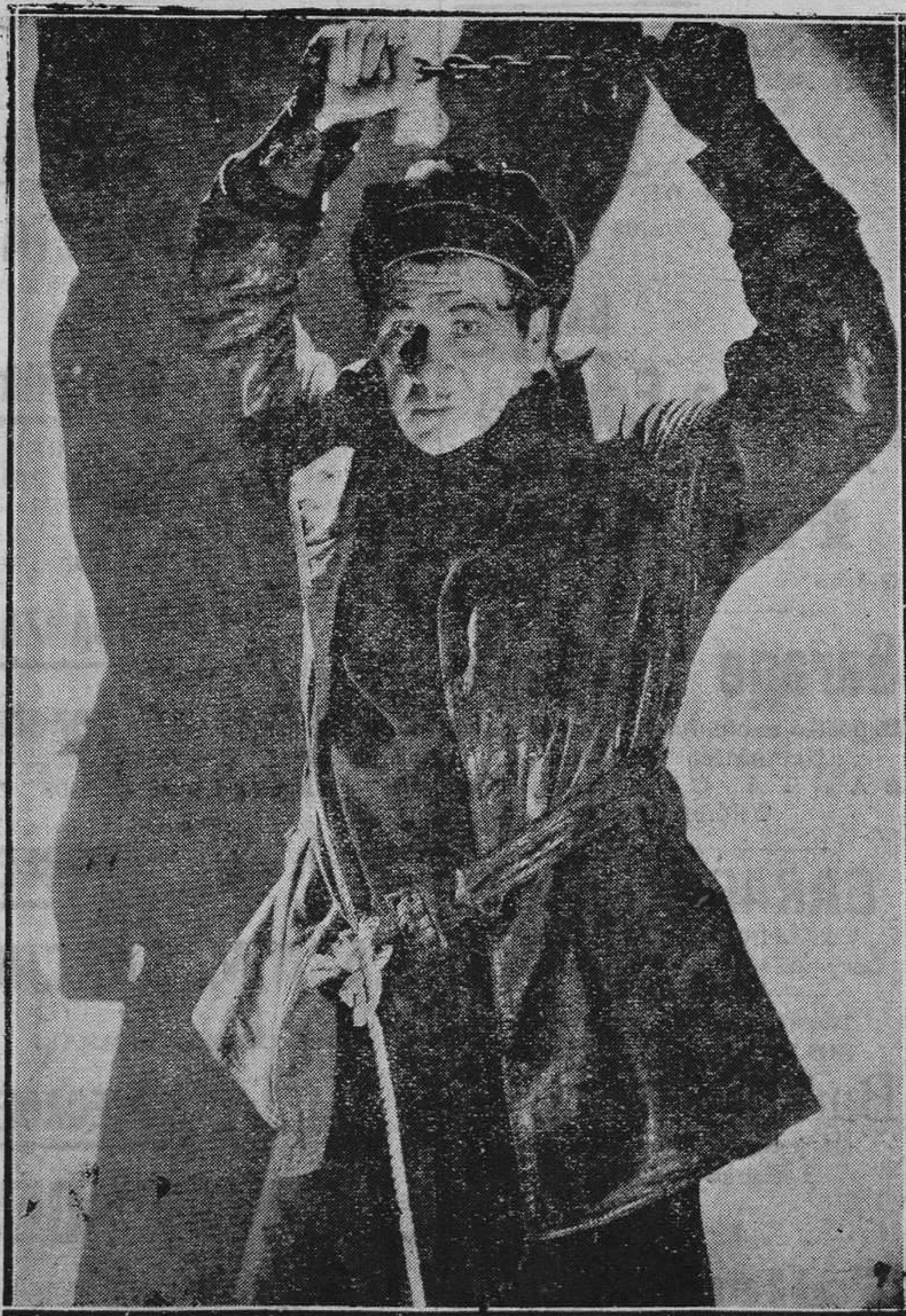
George Bancroft, el formidable intérprete de "El Lobo de Wal Street", "La Fascinación del Bárbaro" y "Un reportaje sensacional", entre otras. El verdadero creador e insuperable protagonista, que por sus maravillosas condiciones y excelentes cualidades de actor de carácter, nunca ha tenido imitadores. Los mencionados "films", realizados por otros artistas, nunca podrían llegar a alcanzar el éxito que con Bancroft obtuvieron. Esto quiere decir que Bancroft, es el alma de los mismos.