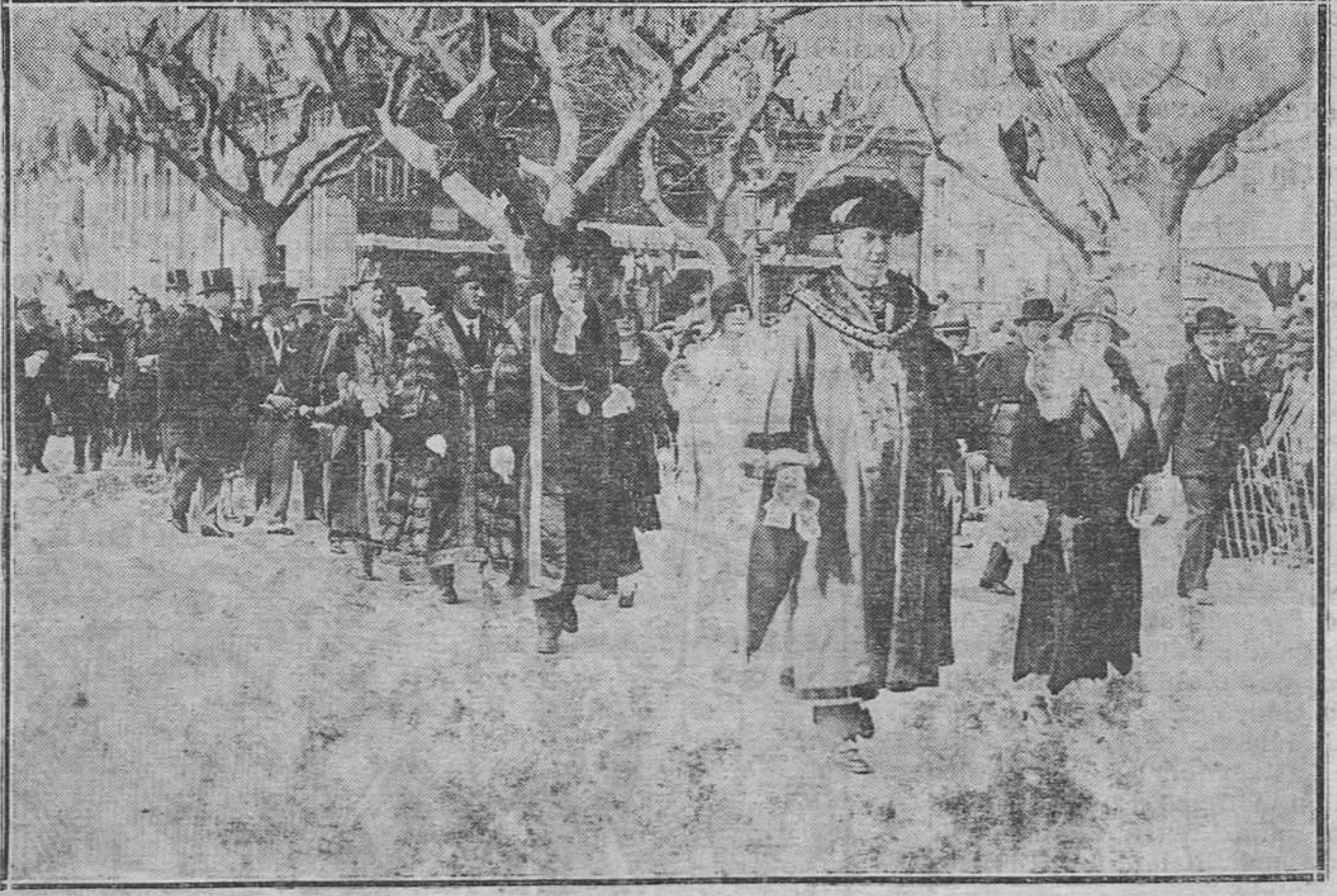
LAS FIESTAS FRANCO-BRITANICAS, EN CANNES. — Los aliados de Manchester, York, Hull, Cardiff y Coventry, dirigiéndose con sus trajes de ceremonia de inauguración de la lápida conmemorativa del 25 aniversario de la Entente Cordial.

PAGINAS ESCOLARES. — El último número publicado contiene un sumario interesantísimo. En él se estudia la personalidad de San Isidoro de Sevilla, algunas informaciones literarias y gráficas sobre los Ejercicios Espirituales de Celorio, una página de arte sobre Lucca della Robbia con interesantes grabados y al-