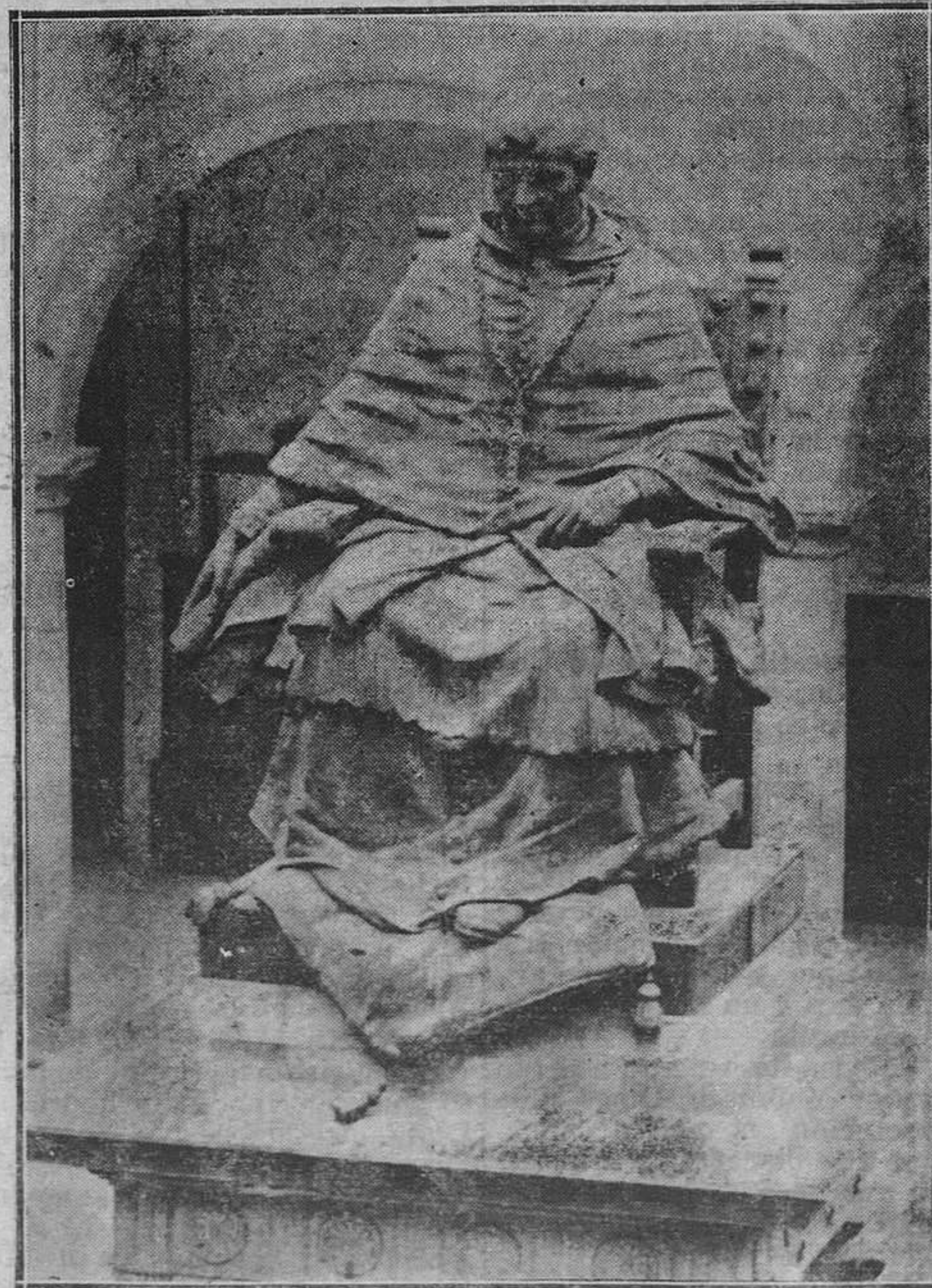
Escultura del Arzobispo Valdés, obra del escultor señor Folgueras, que figura en el patio de nuestra Univesidad.

Este anuncio sensacional ha sido hecho por el barón Stakatan, ex alcalde de Tokio, en la Junta general celebrada por dicho club.