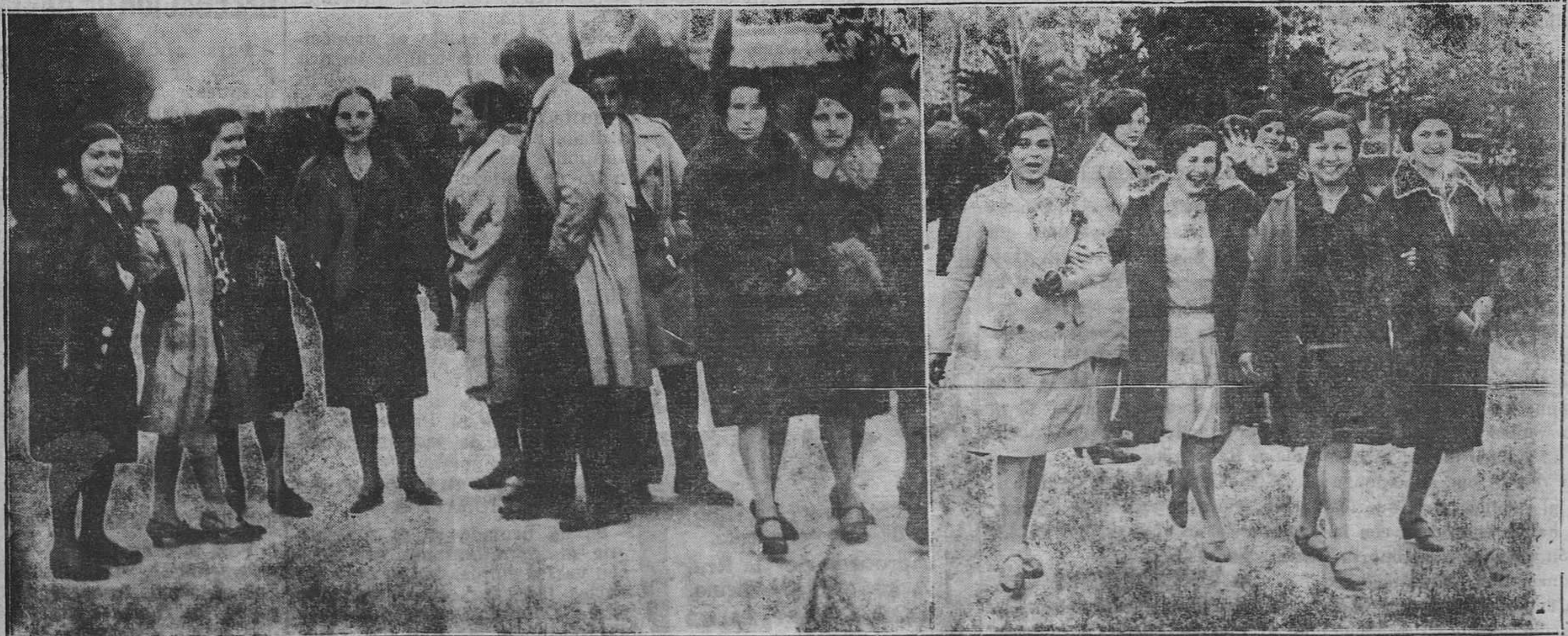
POLA DE SIERO.—Lindas muchachas, que animaron con su juventud la tradicional fiesta de Pascua.

y los demás Bancos y Banqueros de España, que acepten la intervención.