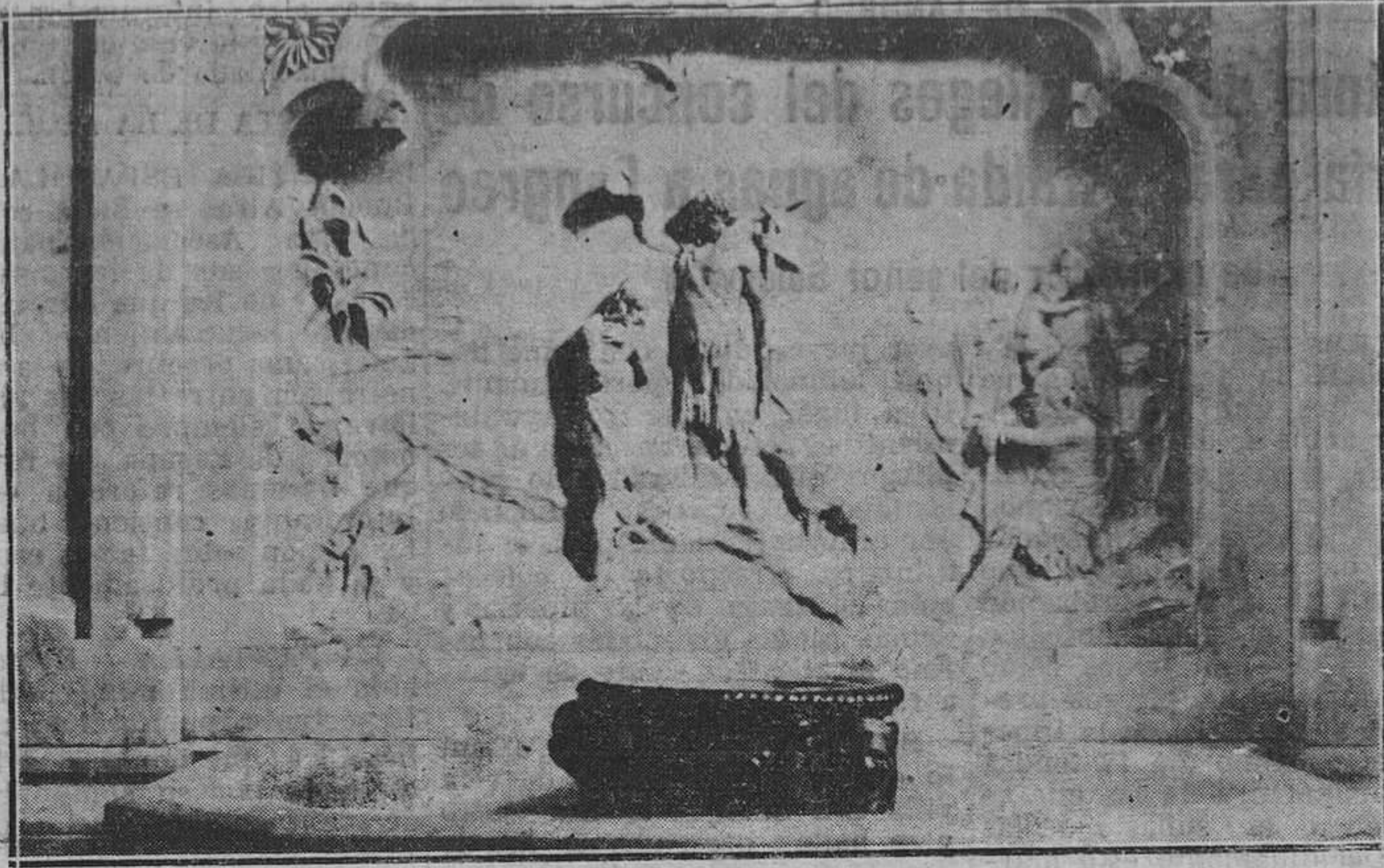
FOLGUERAS — El bautismo del Salvador en la pila bautismal de San Juan

No dudamos que la obra constituirá también un éxito en Madrid, para lo cual no se han regateado medios, pues se constituyó al efecto una excelente Compañía, e irá de Oviedo un admirable intérprete de las canciones asturianas.