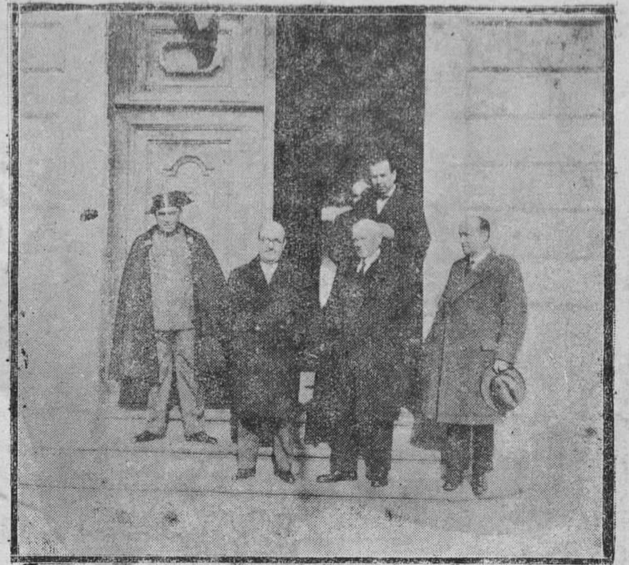
LUANCO. —El gobernador civil con el alcalde, el director del Instituto y el jefe de línea de la Guardia civil en la visita que efectuaron al Instituto del Santísimo Cristo del Socorro.

A ambos familiares enviamos nuestra más cordial enhorabuena.