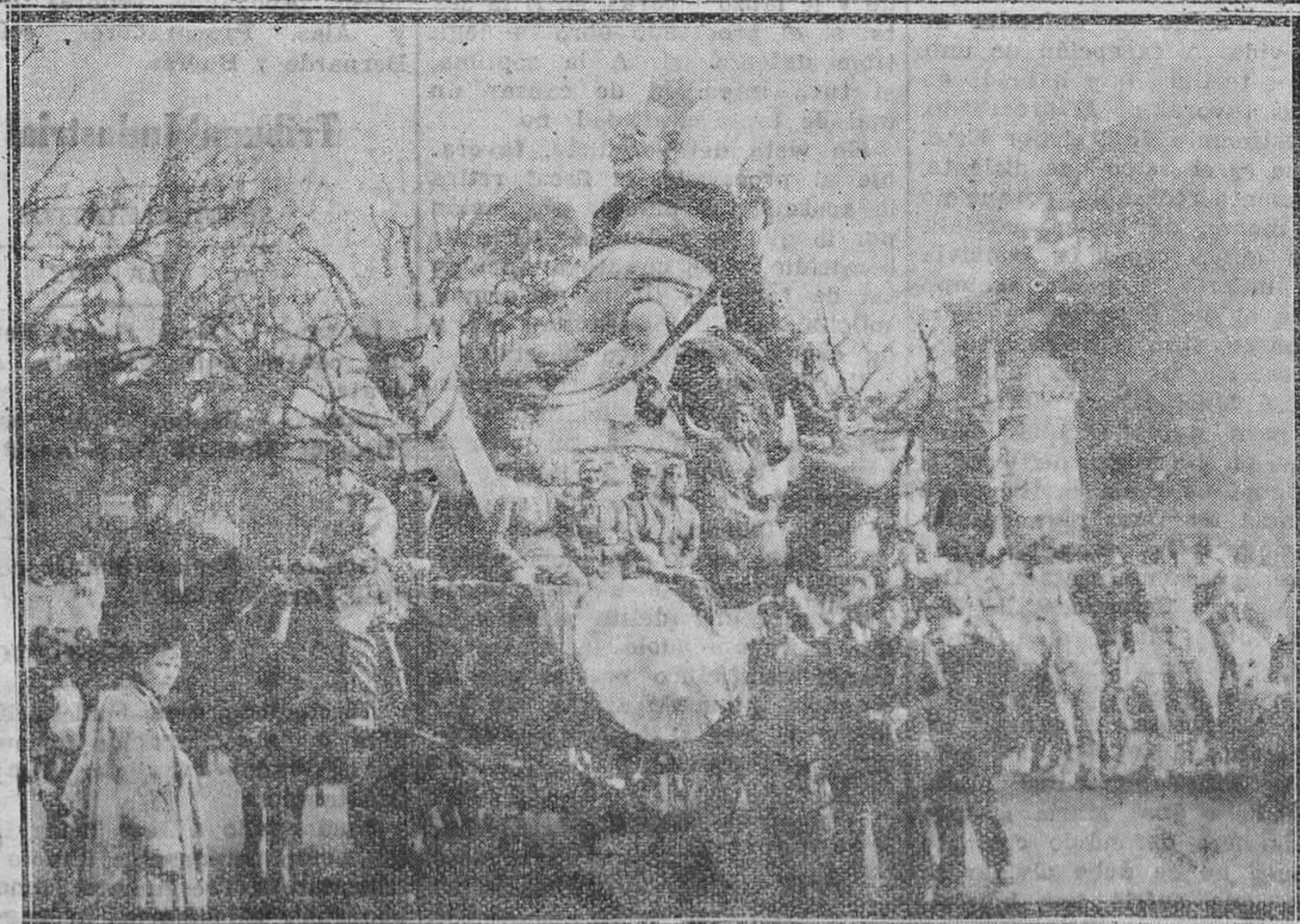
MADRID.—"Los Caracoles", carroza que figuró en el desfile por la Castellana durante los días de Carnaval..

Será a las siete y media en el nuevo salón de conferencias, Rívero, 5, habiendo despertado este acto gran interés entre las asociadas y demás personas identificadas con este ideal.