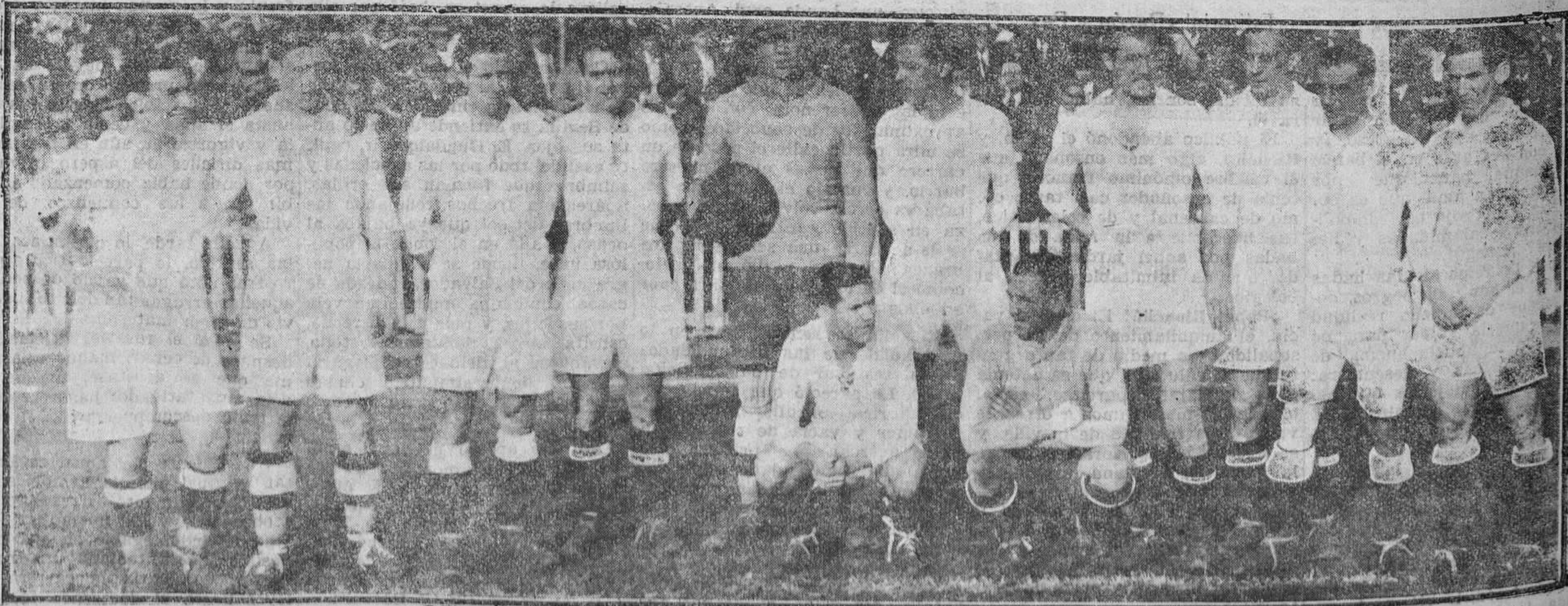
BILBAO.—Equipo del Madrid, que al empatar en San Mamés figura en la cabeza de la primera división de Liga, por el "goal average".

REGION está editada por una sociedad anónima cuyos accionistas se hallan distribuidos por todo Asturias. Ella proporciona al periódico un aliento espiritual y una garantía de independencia que trasciende de todos sus comentarios y campañas.