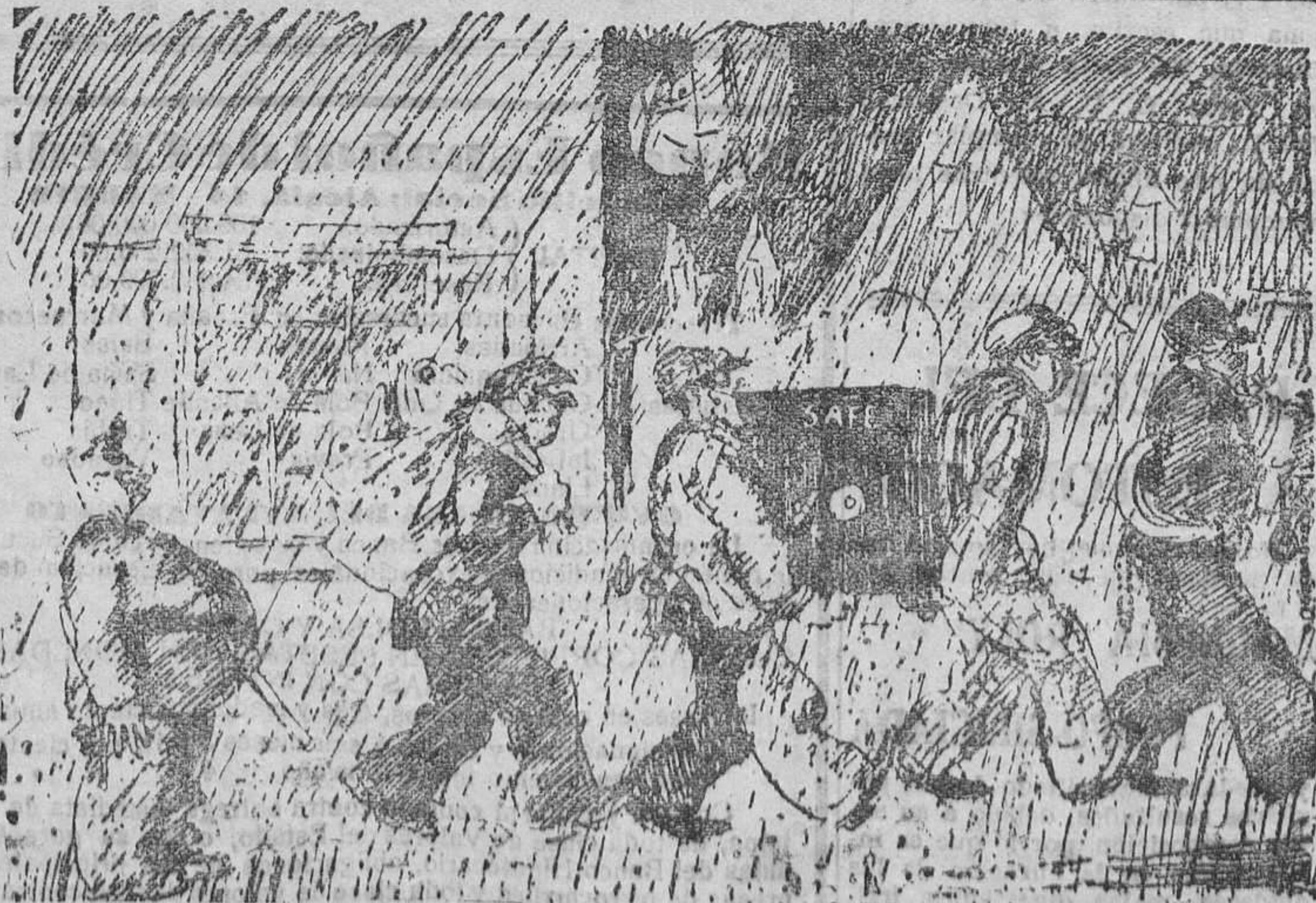
EL GUARDIA INGENUO.—;Se necesita buen humor! ;Mira que disfrazarse de ladrones!

La fecha de la boda ha sido fijada para el día veinte del corriente mes. Por este motivo enviamos nuestra más expresiva felicitación a sus apreciables familiares.