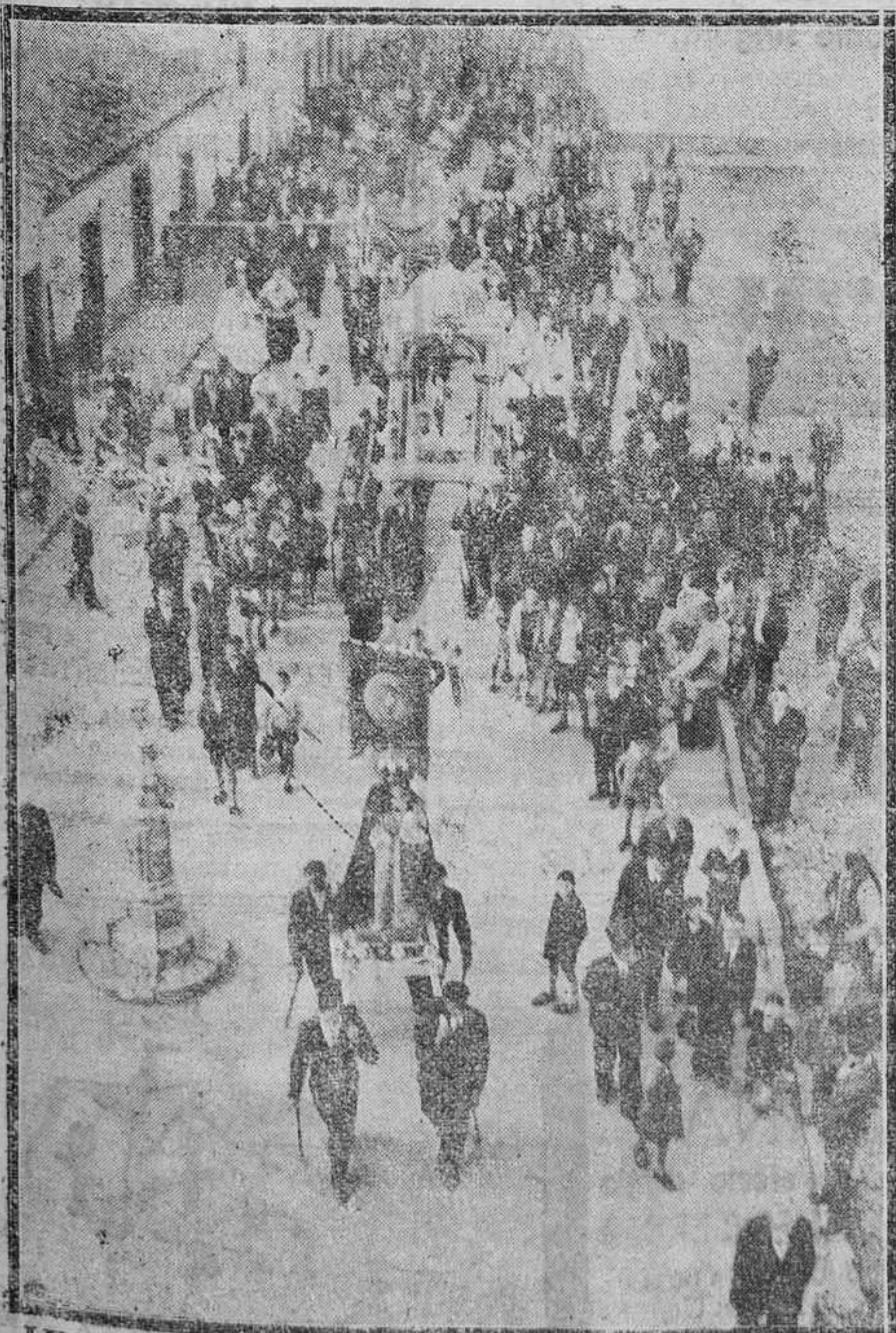
LUANCO. —La procesión del Santísimo Cristo del Socorro, cuyas fiestas se celebraron con gran brillantez, estando en la Iglesia. (Foto Mori).

Hoy, a las once y media, se reunirán en la Escuela de Comercio los alumnos de este Centro que pertenecen a la Asociación Mercantil, para tratar asuntos de importancia.