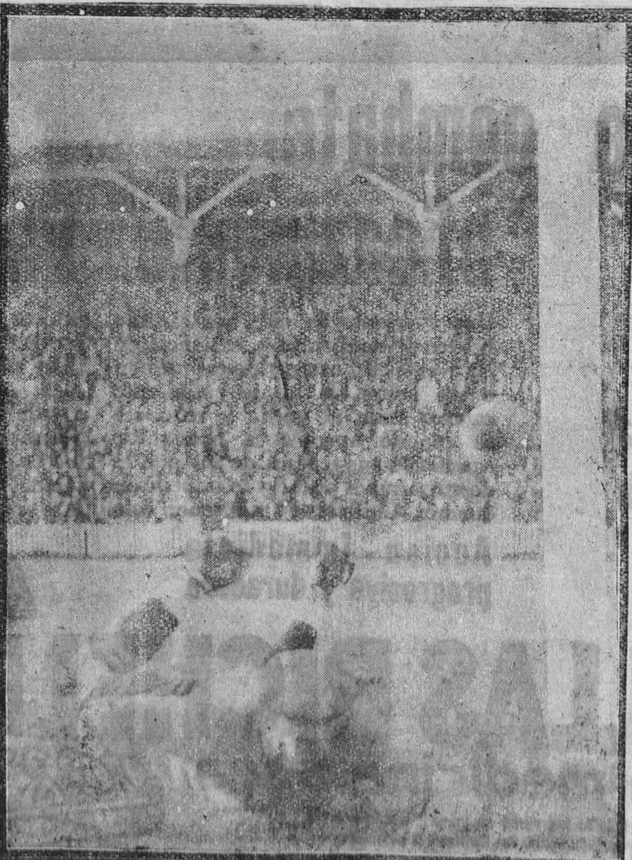
BILBAO.—Un momento del partido jugado el pasado domingo entre el Athletic y el Madrid.