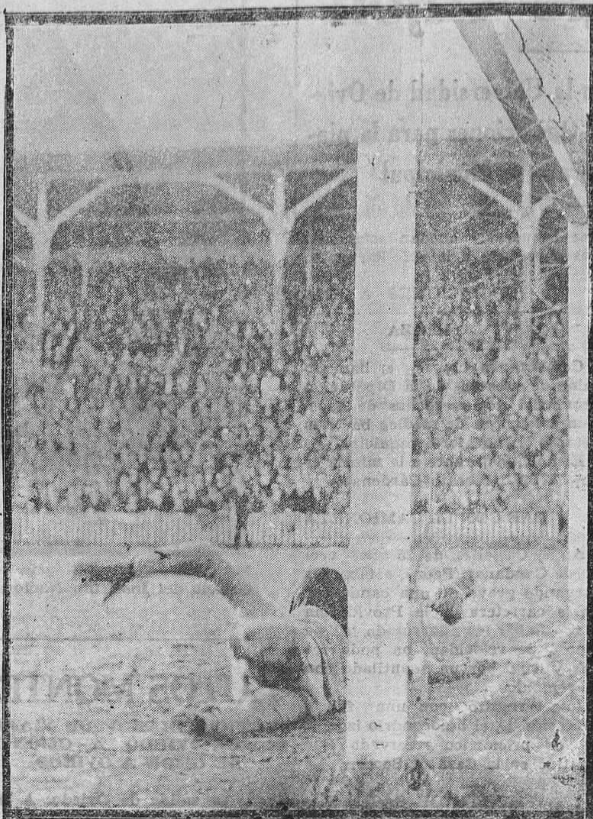
BILBAO.—El guardameta del Athletic en una de sus intervenciones en el partido jugado el pasado domingo con el Madrid.