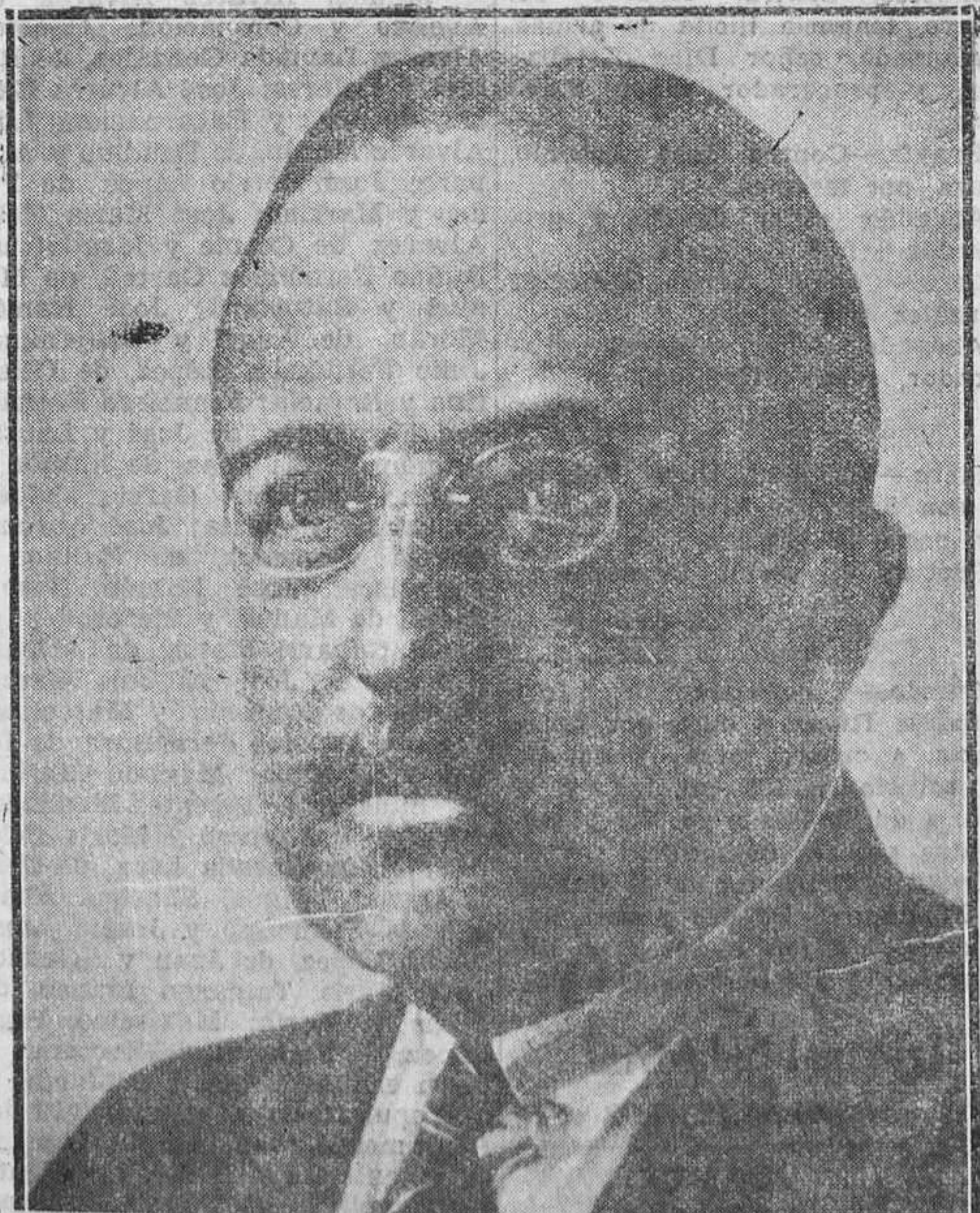
MR. Tardieu, ex-ministro de la Guerra en el Gobierno francés.

Se nos dice que alguno de los guardias desnudó el sable y que hubo algunos pequeños sustos sin importancia, refugiándose algunas señoras en los portales próximos al lugar del incidente.