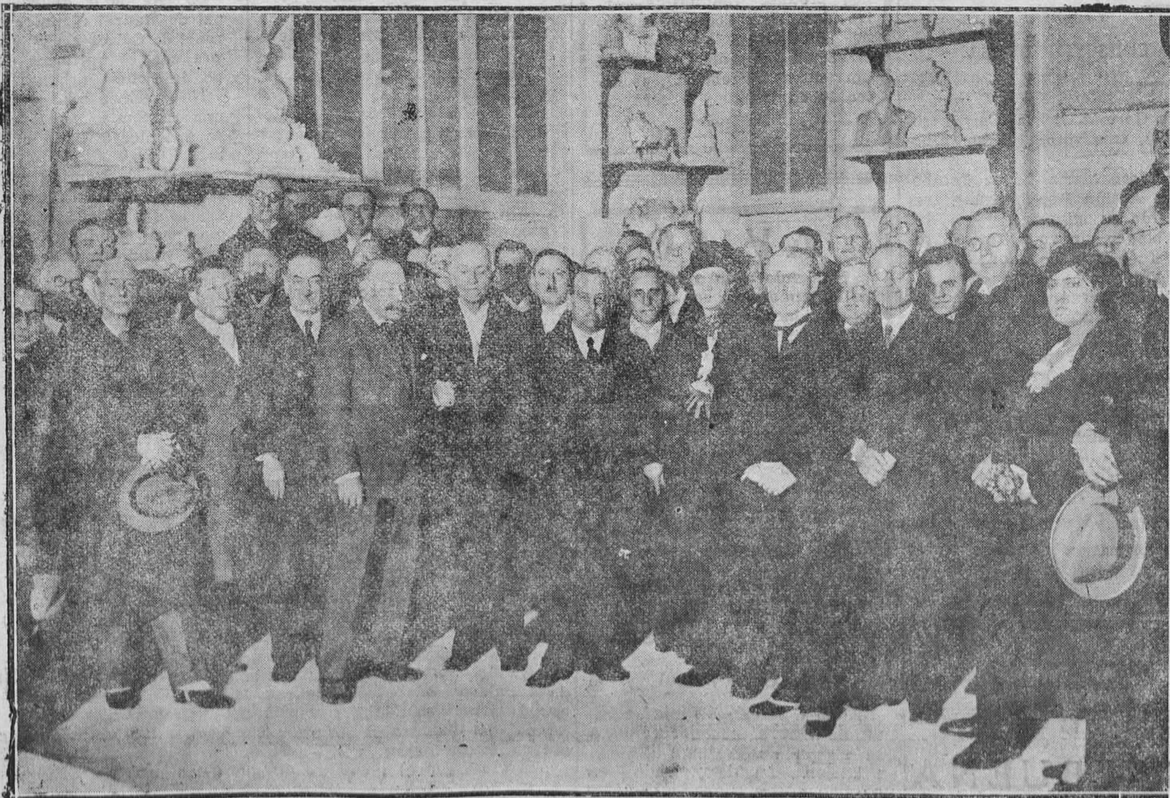
La Masa Coral de Maestros de Moravia (Checoslovaquia), que dirige el eminente maestro Vach, visita el estudio del pintor y escultor don Mariano Benlliure, acompañada del ministro de su país en España, señor Kybal.