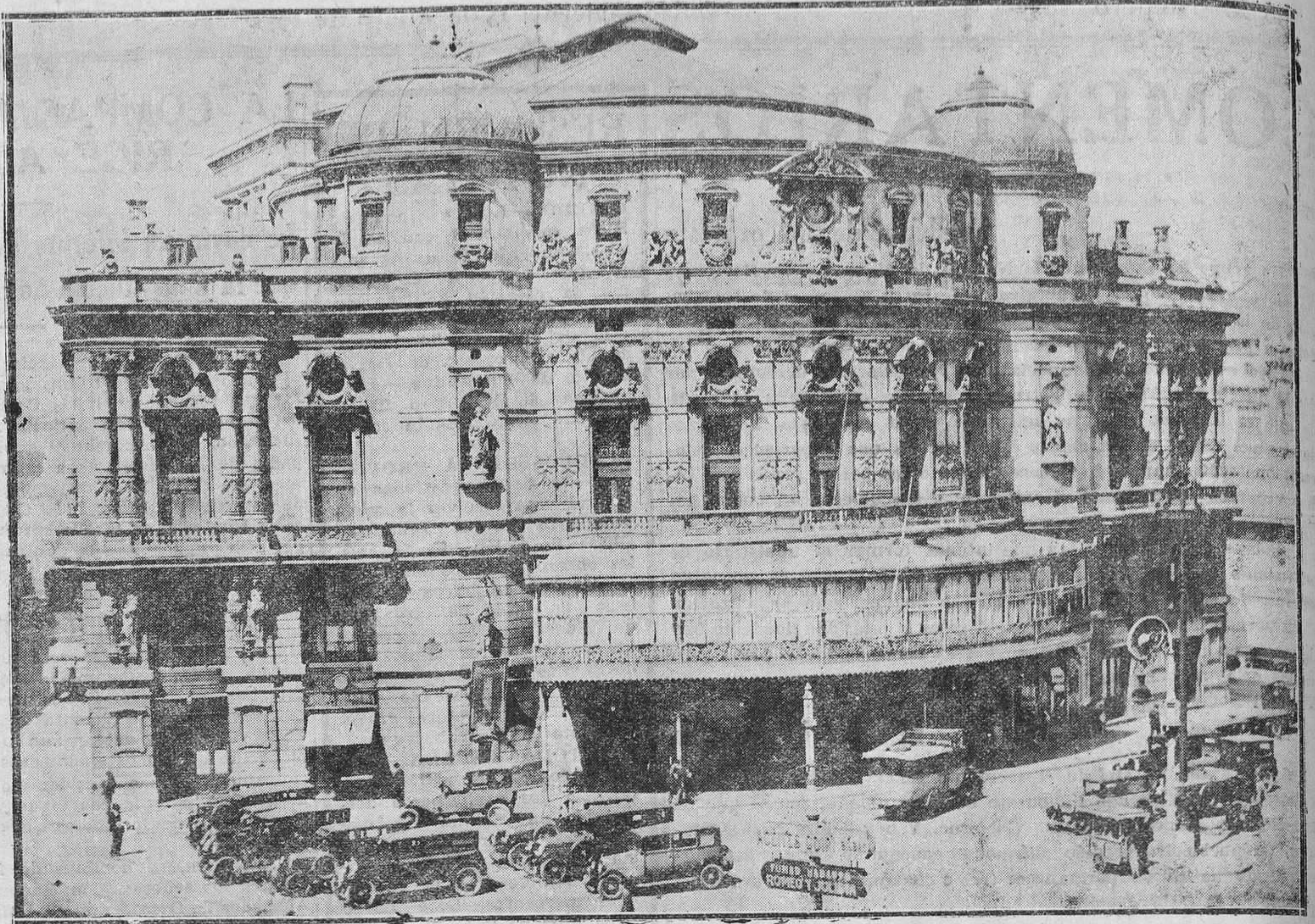
BILBAO.—Expulsados del Paraíso. En el Teatro Arriaga, el más aristocrático de la invicta villa, al estrenarse el juguete cómico de Muñoz Seca "L. A. O. C. A." se alborotó el gallinero estrepitosamente, cantándose "La Internacional" y "La Marsellesa". Los guardias desalojaron el paraíso a sablazos. Los nuevos Adanes protestaron, y hubo que devolvérseles el importe de la entrada.