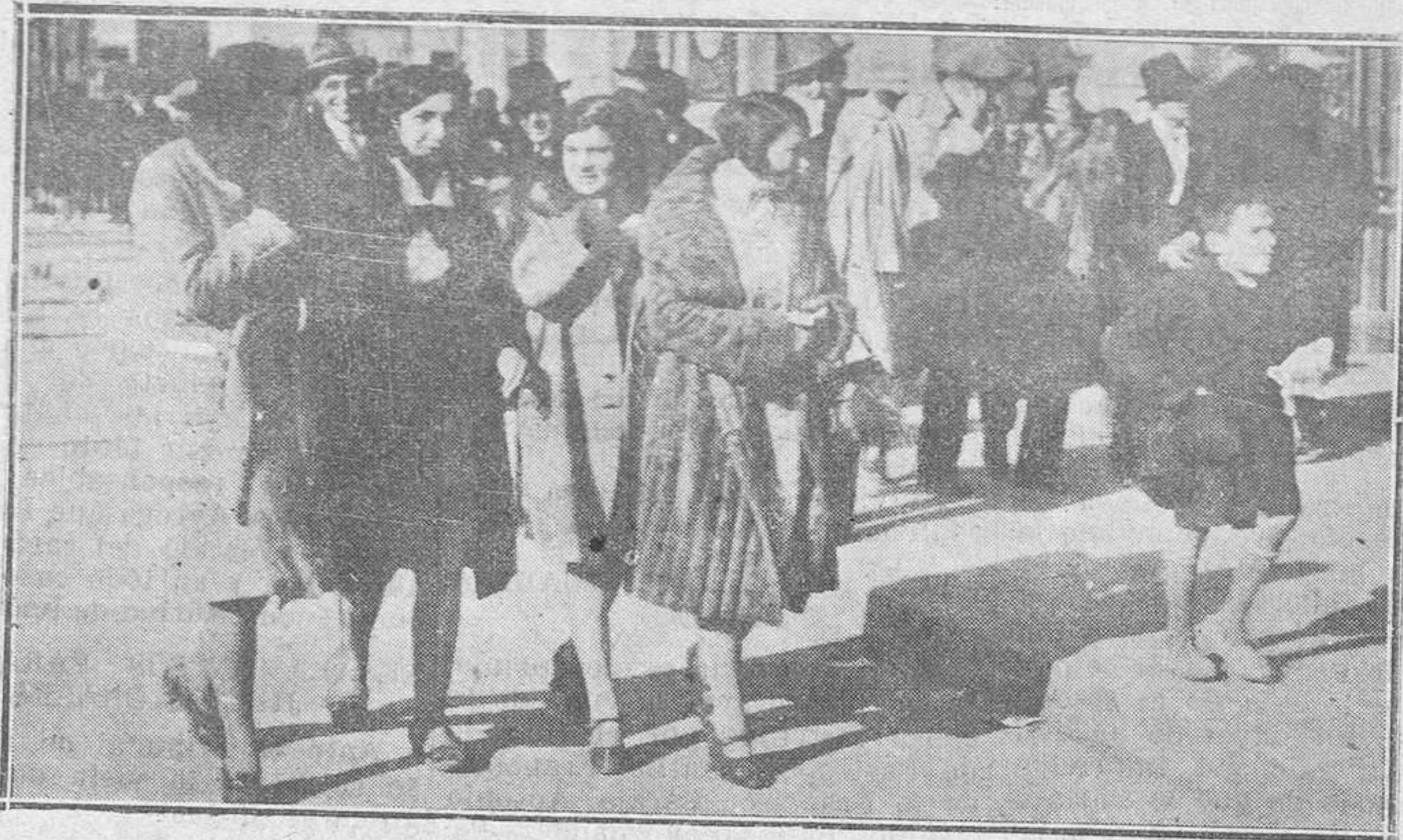
OVIEDO. — En la hora del paseo.