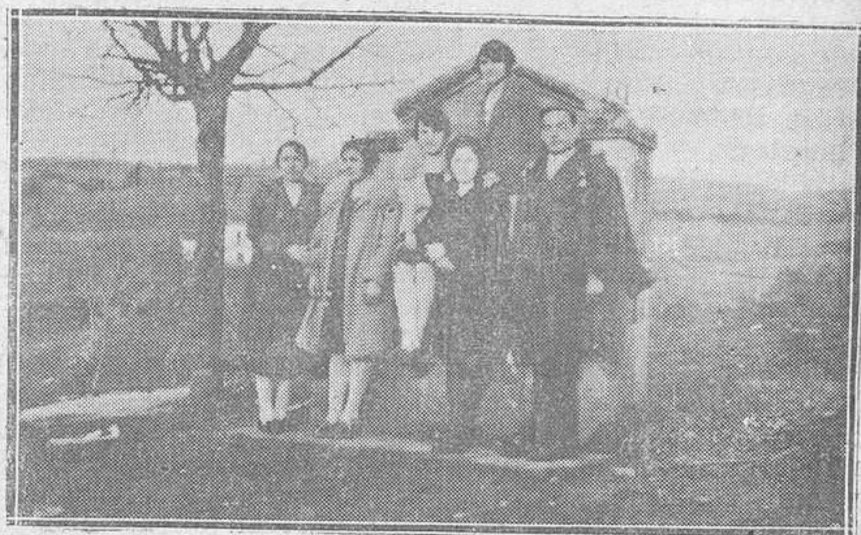
SAN MARTIN DE ANES. — A la salida del Catecismo.