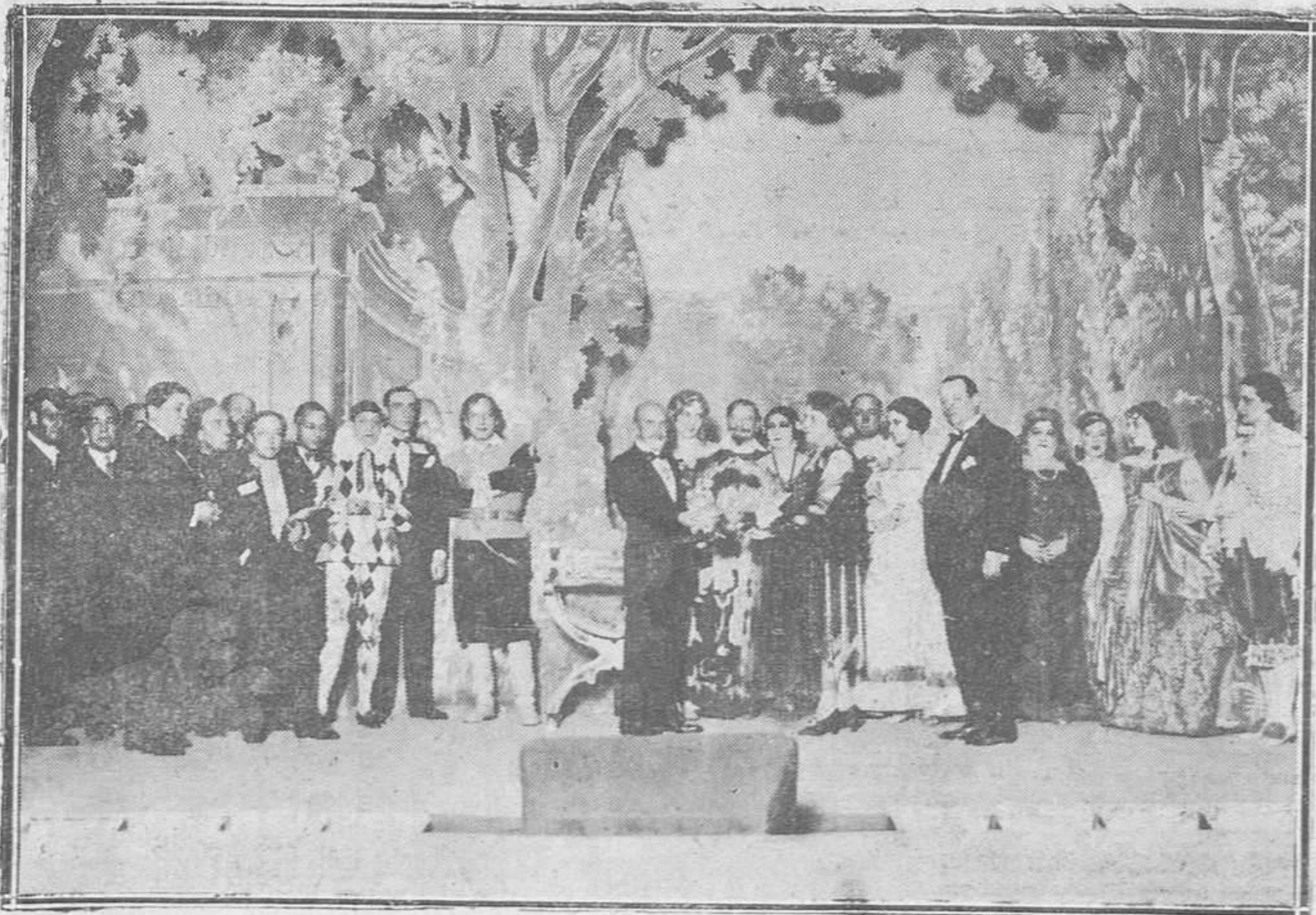
MADRID.—Homenaje a Donacento en el Teatro del Teatro.—Don Facinto, recibiendo de manos de Rosario Pino, la corona de laureles de plata que le dedicó el Montepío de Actores Españoles. Atención que fué inmediatamente agradecida por el insigne autor de Los intereses Creídos, con la cesión a favor del Montepío de todos sus derechos de autor, de esta inmortal obra.