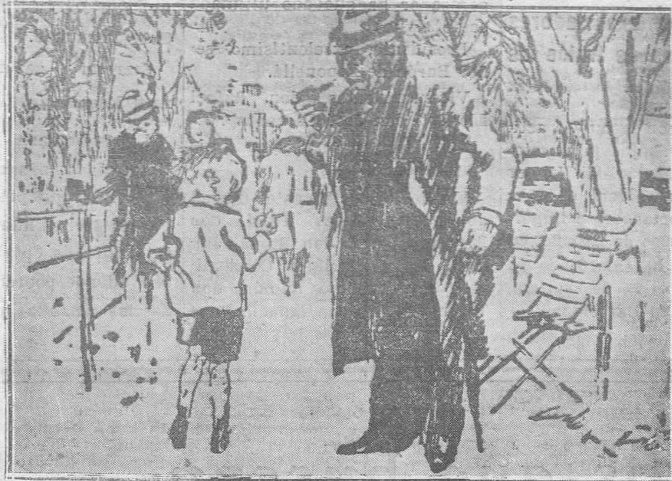
—El Niño. — ¿Me hace el favor de fuego? —El caballero. — ¿Pero cómo? ¡Un chico así! —El niño. — Es que mi madre no me deja jugar con cerillas.

Ayuntamiento, que está siempre atento a los intereses del concejo, sabrá lucidos festejos, con iluminación eléctrica, fuegos artificiales, bailes, etc.