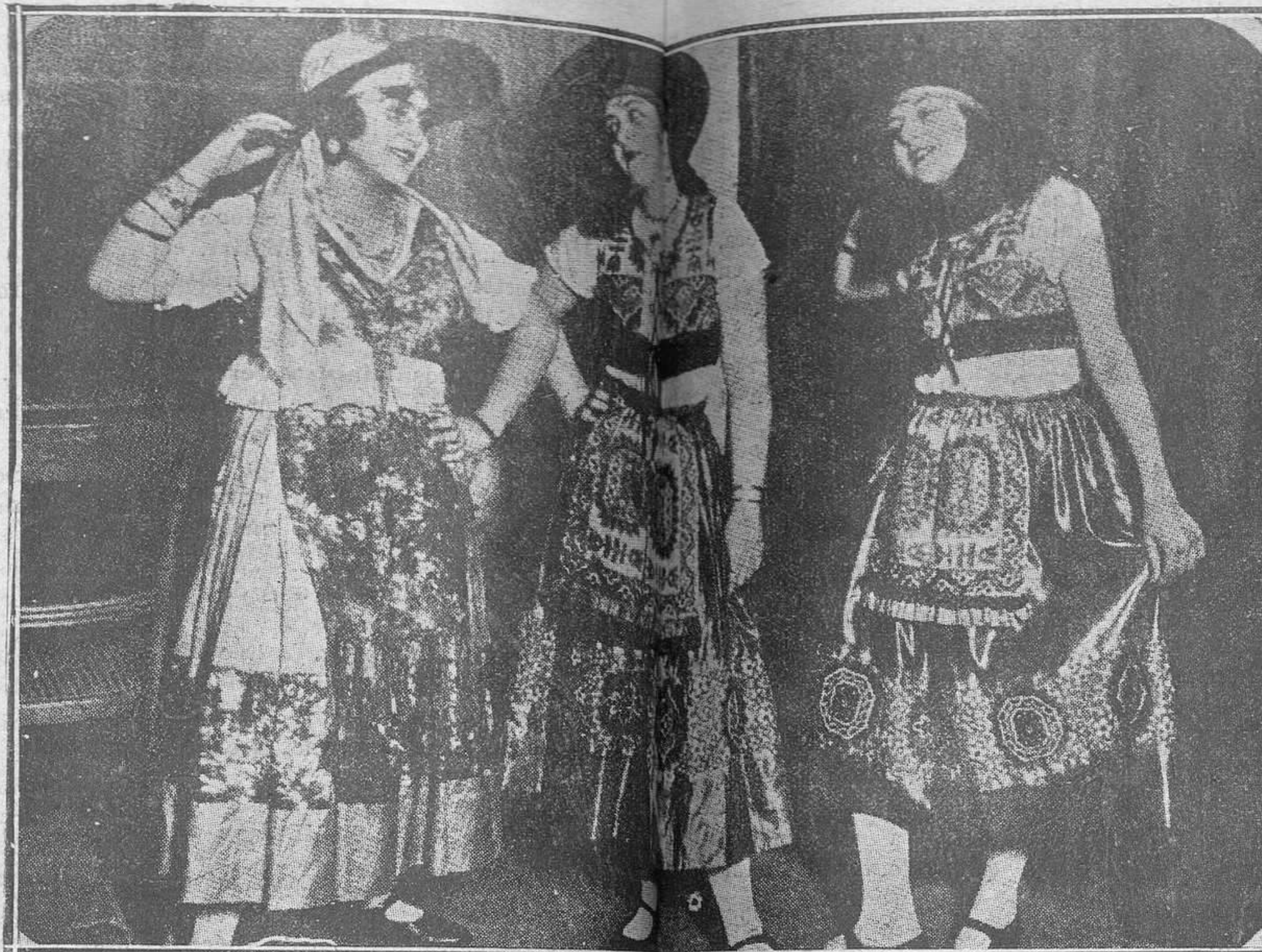
Clásicos trajes argentinos que pueden ayudar un poco la fantasía de las jóvenes en el cercano carnaval

Y es un orgullo nobilísimo para quienes no podemos pasar en silencio la extranjera hazaña el aplaudir-