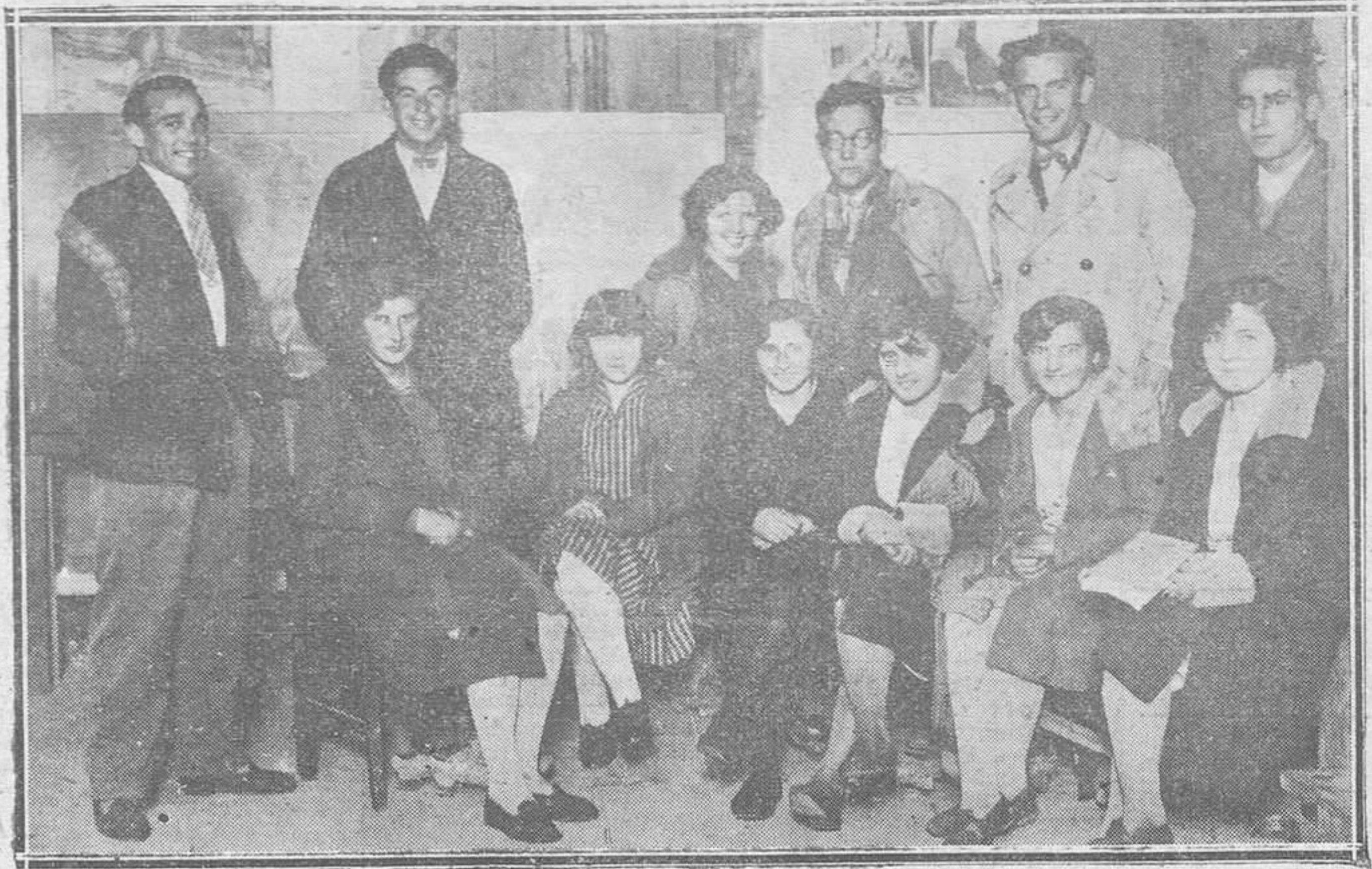
POLA DE SIERO. — Cuadro Artístico del Centro de Juventudes Católicas, que organiza conjuntos festivos a beneficio de dicho Centro.

Los novios, a quienes deseamos una eterna luna de miel, se trasladaron a Ol, en donde fijarán su residencia.