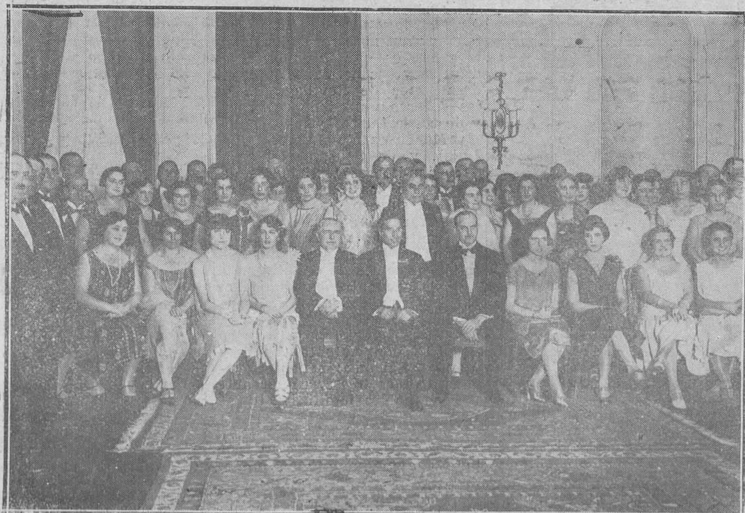
Grupo de concurrentes a la fiesta celebrada en el Ritz por los Clubs Rotarios españoles y portugueses, acto que fué presidido por el ministro de Estado y el embajador de los Estados Unidos.

La Junta provincial de Abastos, en su reunión del 26 de pasado noviembre, acordó conceder maíz a los fabricantes anotados en el registro de la Secretaría de la Junta, dándoseles, como margen de molturación, 3,50 pesetas en cien kilos, y debiendo venderse la harina, incluido el envase, al precio que resulte de cargar sobre 33 pesetas del valor del maíz; esa 3,50 de margen por merma y gastos de molturación y beneficio industrial, más los porteados del maíz desde el almacén portador hasta la localidad de destino, sin consentirse precio mayor por ningún concepto.