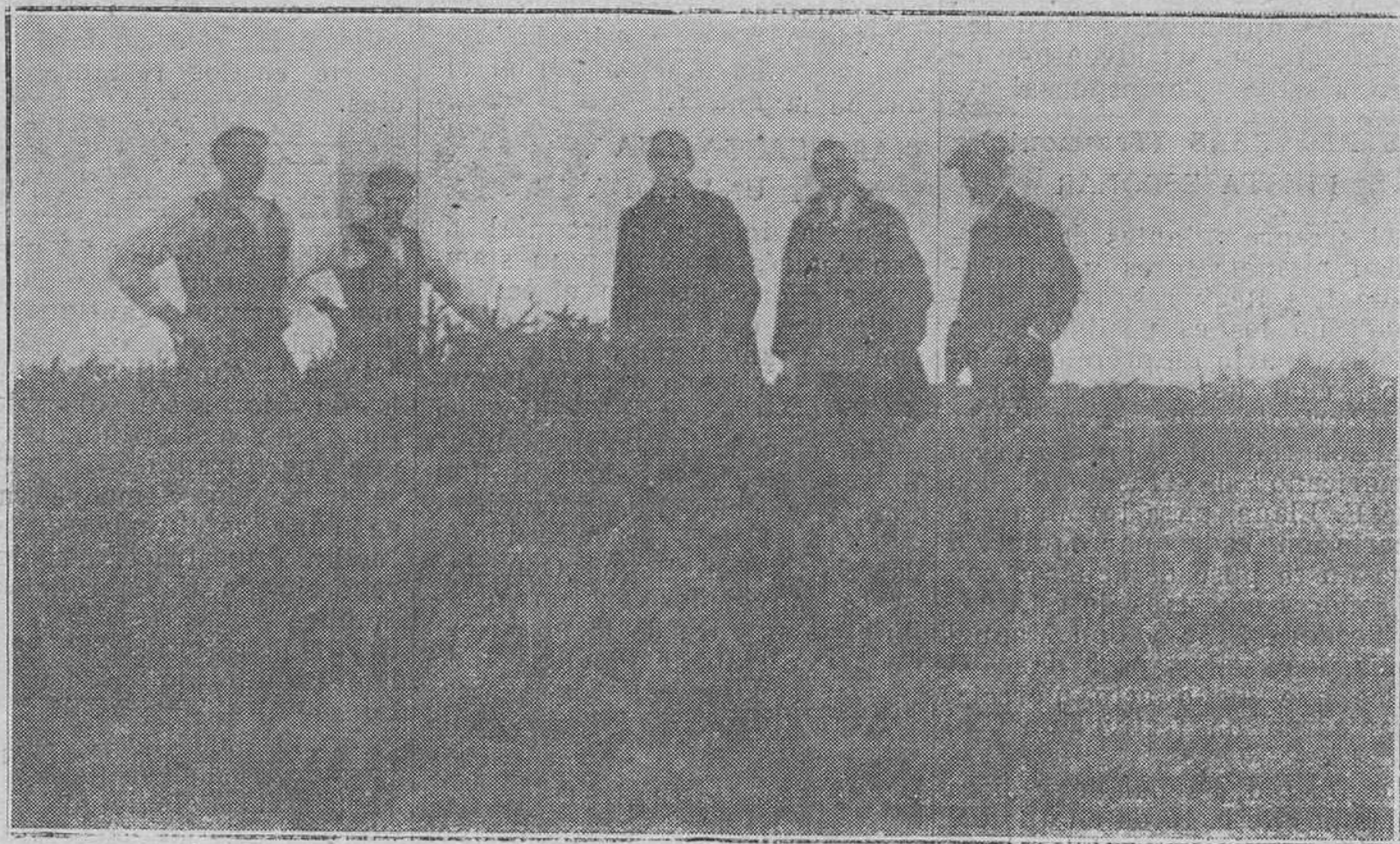
VILLANCIO A-DIÉS: MUNTENEGRO.-EN BUSCA DE DOLMENES.-En este monte y en el de los Cuestos, proximo, ha sido descubierta una nueva y muy importante zona dolménica.

Solicitar la supresión del arbitrio que cobra la Diputación sobre los carbones que se consumen en el interior de la provincia y que sea rebajando a treinta céntimos el que perci-