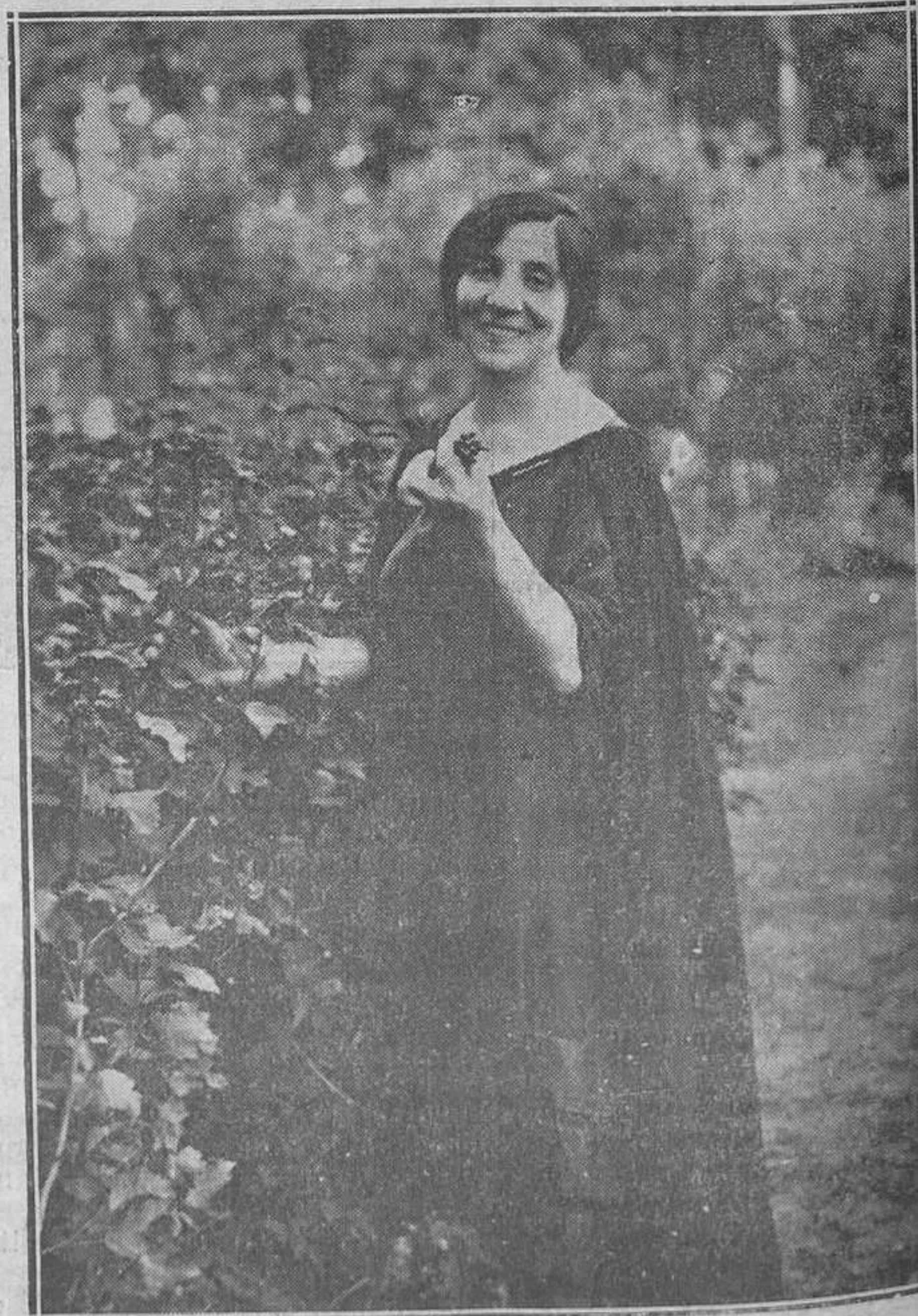
EL CONCIERTO DE AOCHE EN LA FILARMÓNICA.—La eminente artista Wandu Landowka que dió ayer un concierto de cavecín.