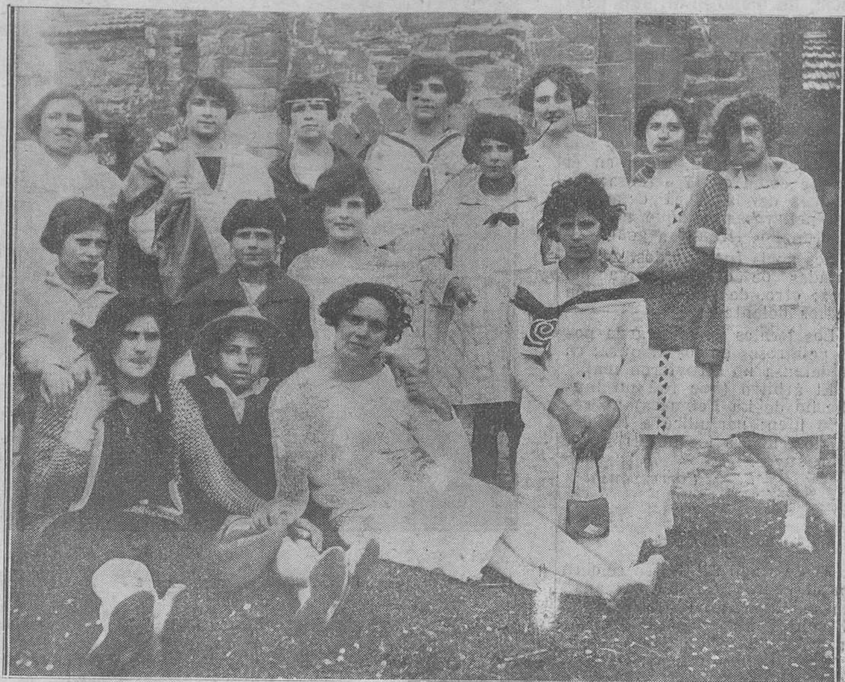
MOREDA (SANTA CRUZ).—Un grupo de lindas y simpáticas señoritas en una excursión a Santa Cristina (Lena).