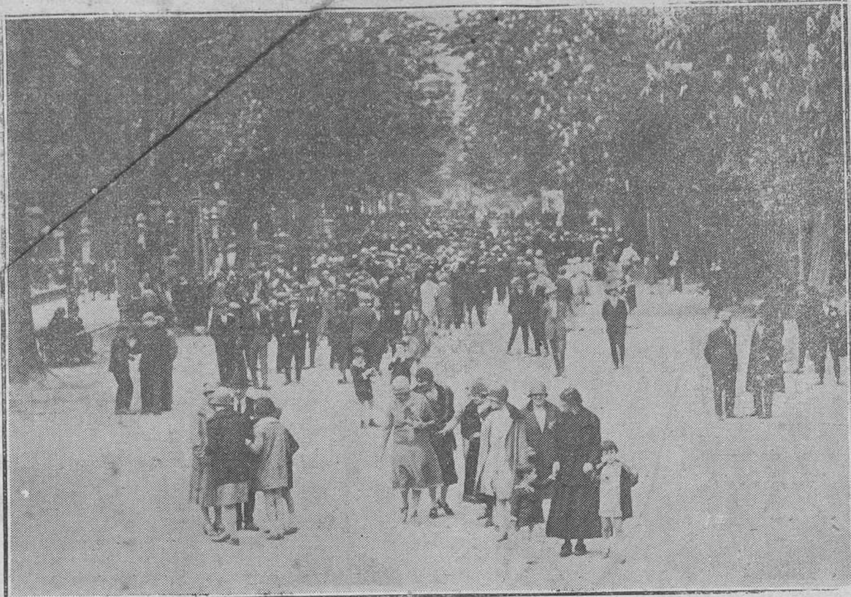
OVIEDO.—Una mañana de sol en el Bombé.