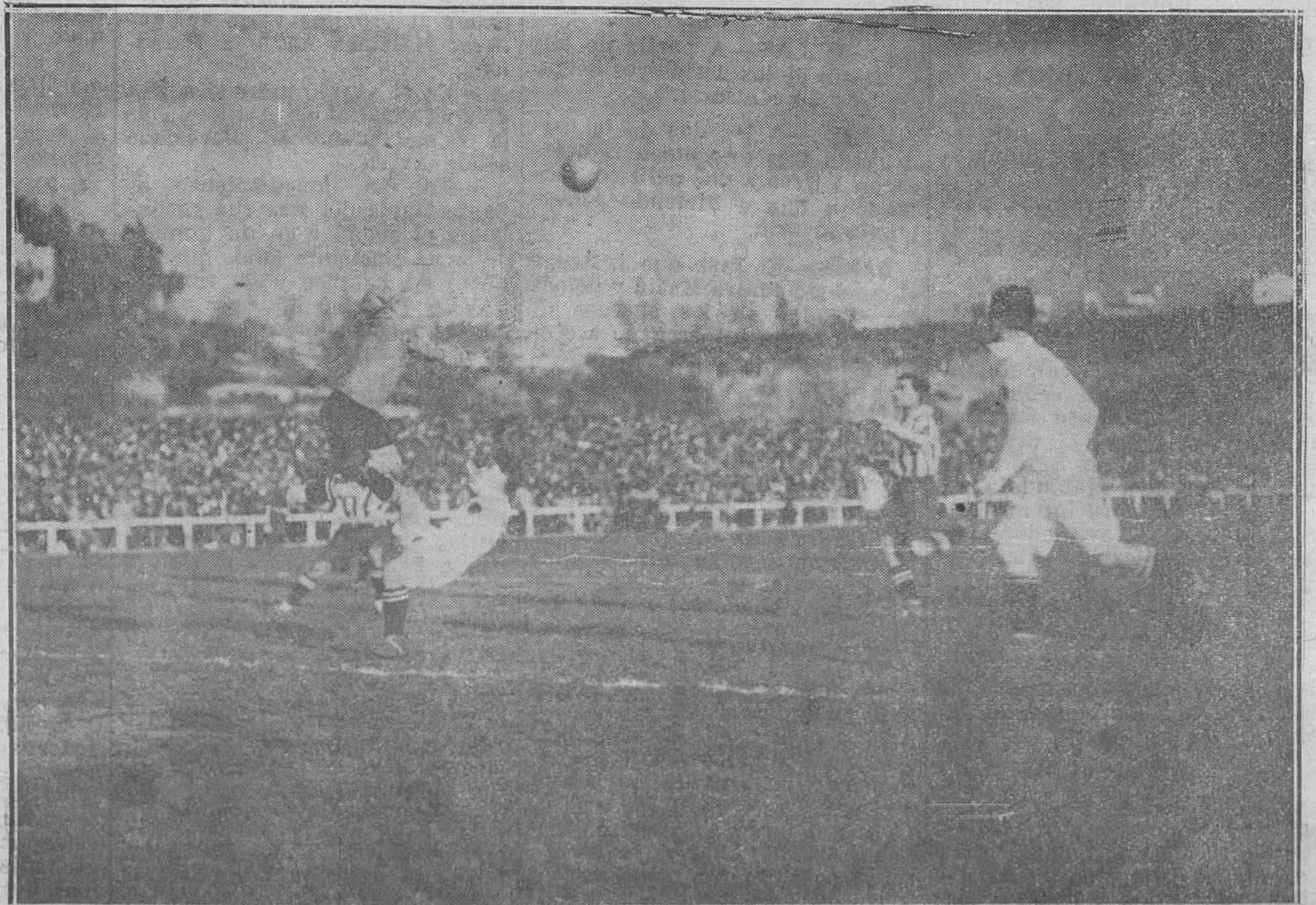
Otro momento interesante del partido