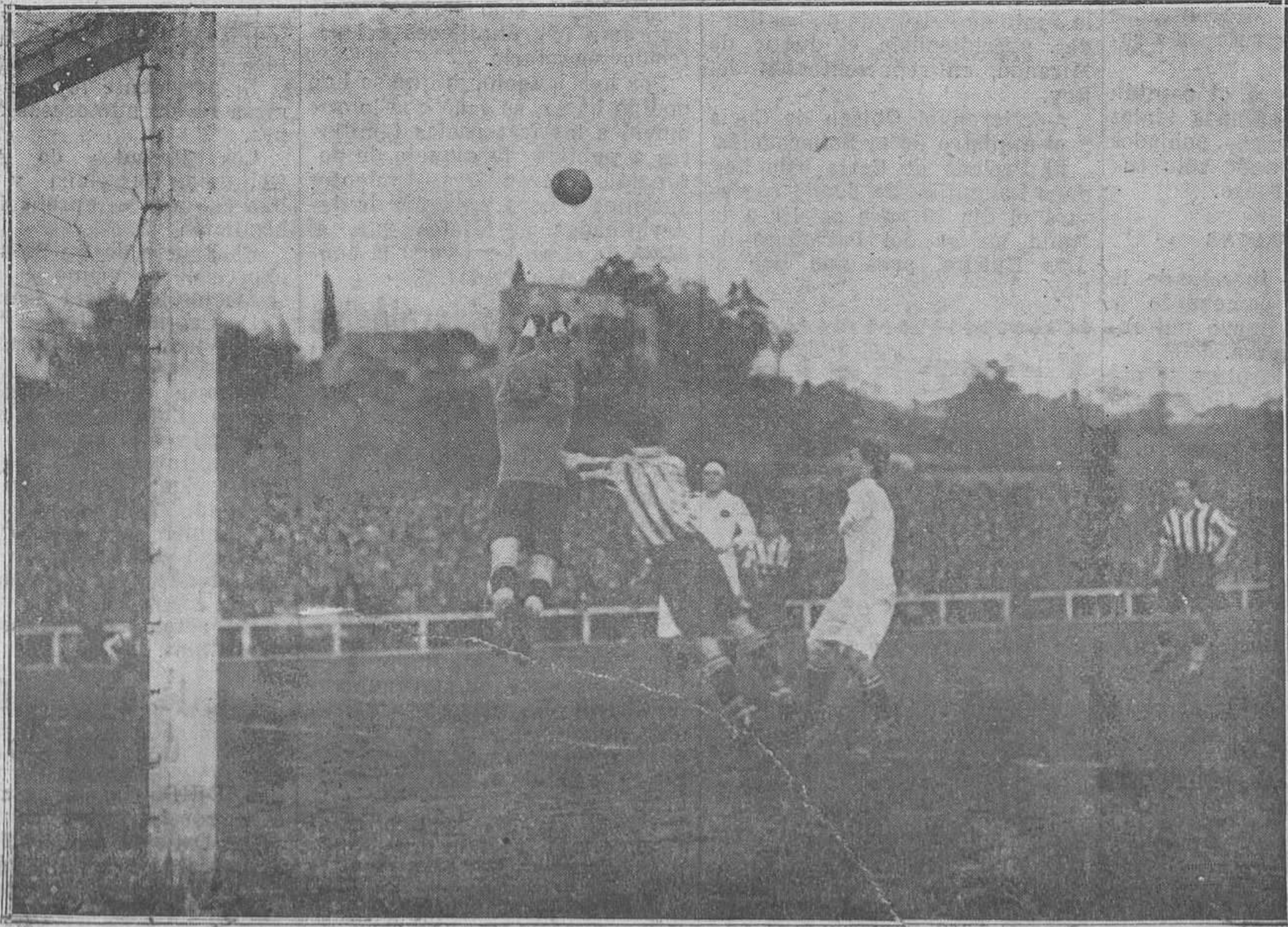
Un momento interesante del partido.

Ten siempre presente este consejo de un sabio: "El que dice máximas, sin acompañarlas con el ejemplo, es como esos postes que señalan el camino sin haberlo recorrido". Es siempre más fácil dar consejos que llevarlos a la práctica.