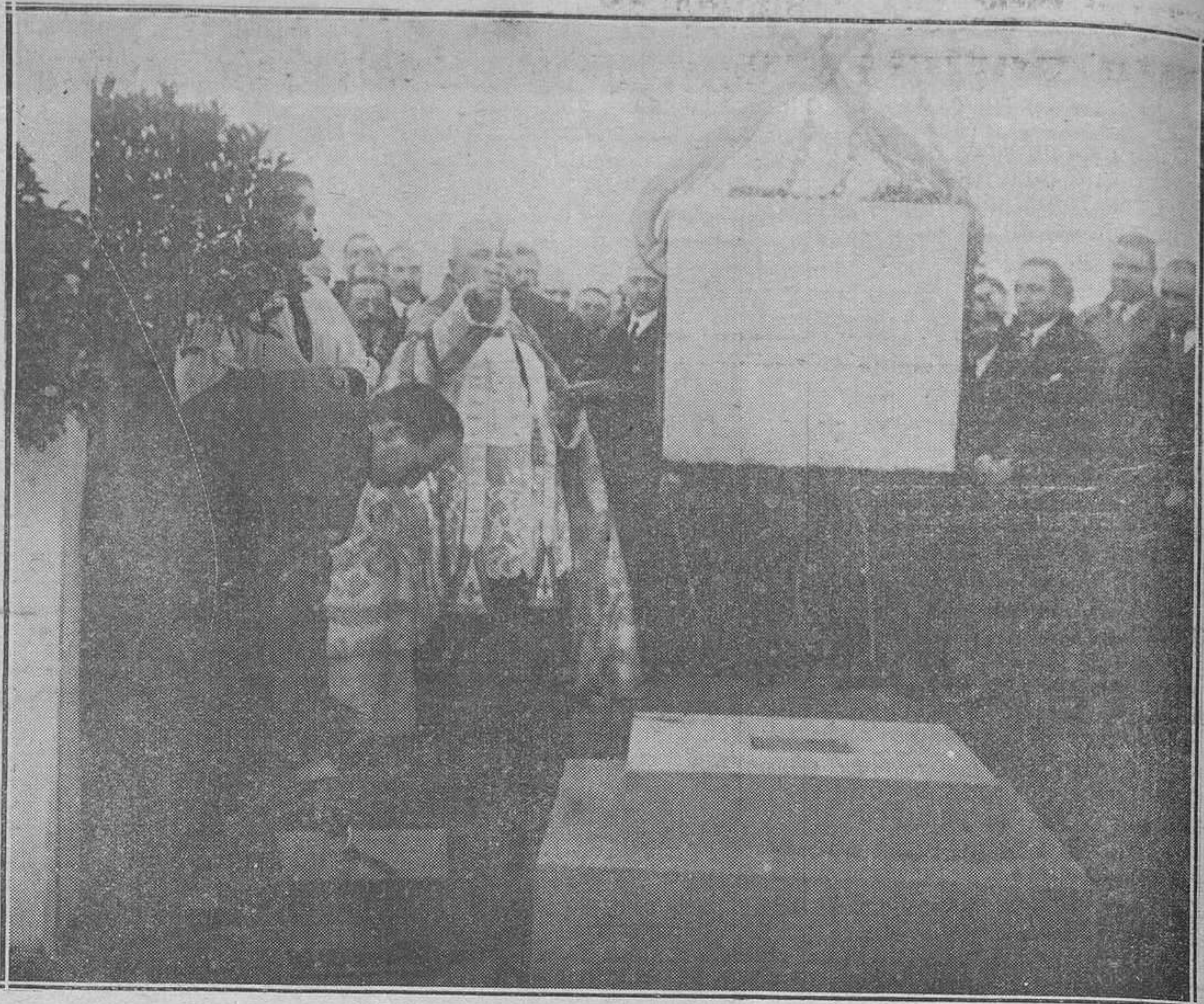
MADRID.—Fundación y colocación de la primera piedra del edificio para Colegio de Huérfanos ferroviarios.