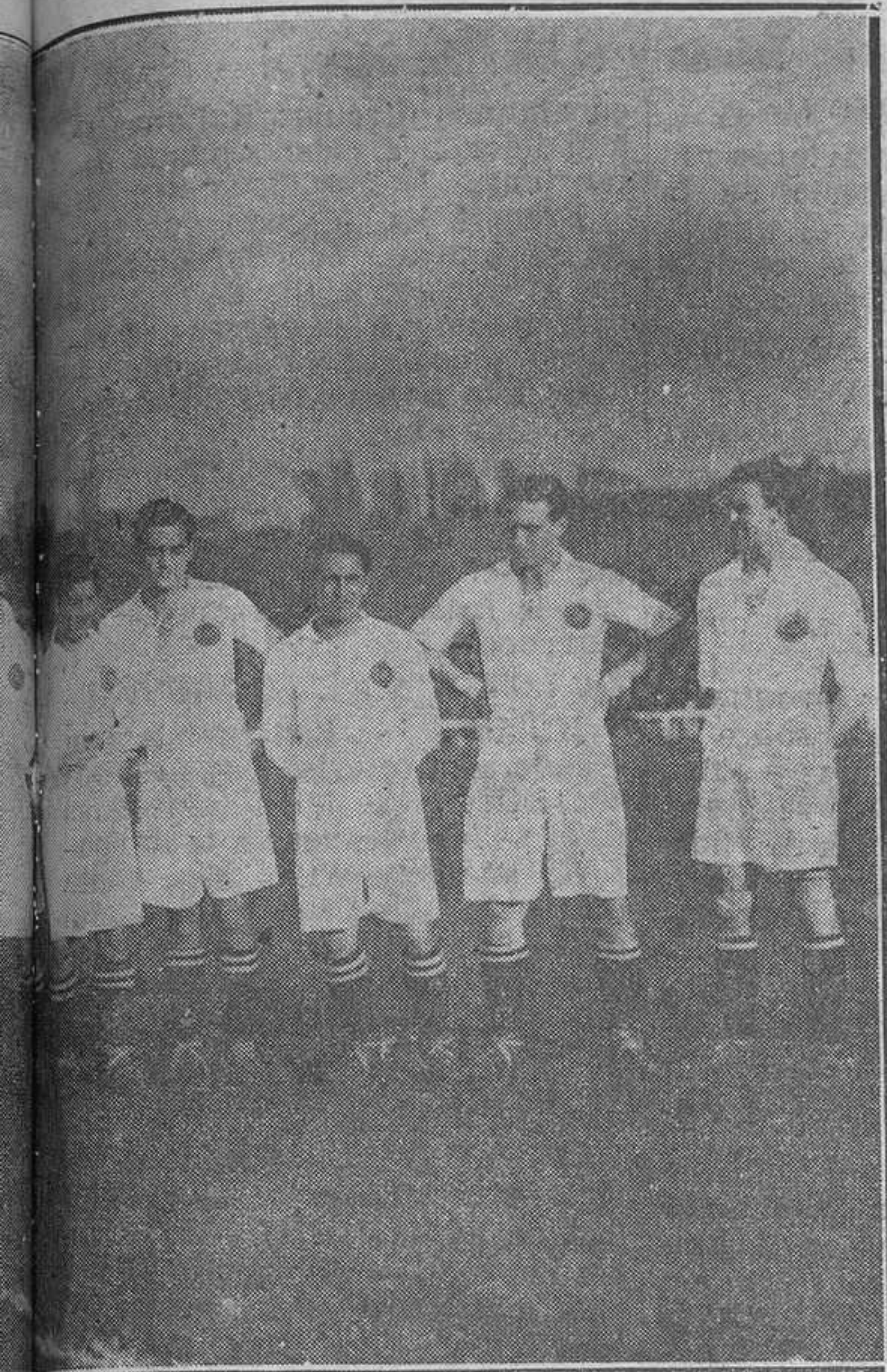
El Atlético; venció el primero por 3-1.-El equipo vencedor.

tan elocuentemente, ofrecióle tan buena cantidad, y prometió guardar tan en secreto la aventura, que Carrasco aceptó, cogió el dinero, y se fue desconsolado—eso sí, hondamente desconsolado—a una casa en otra calle.