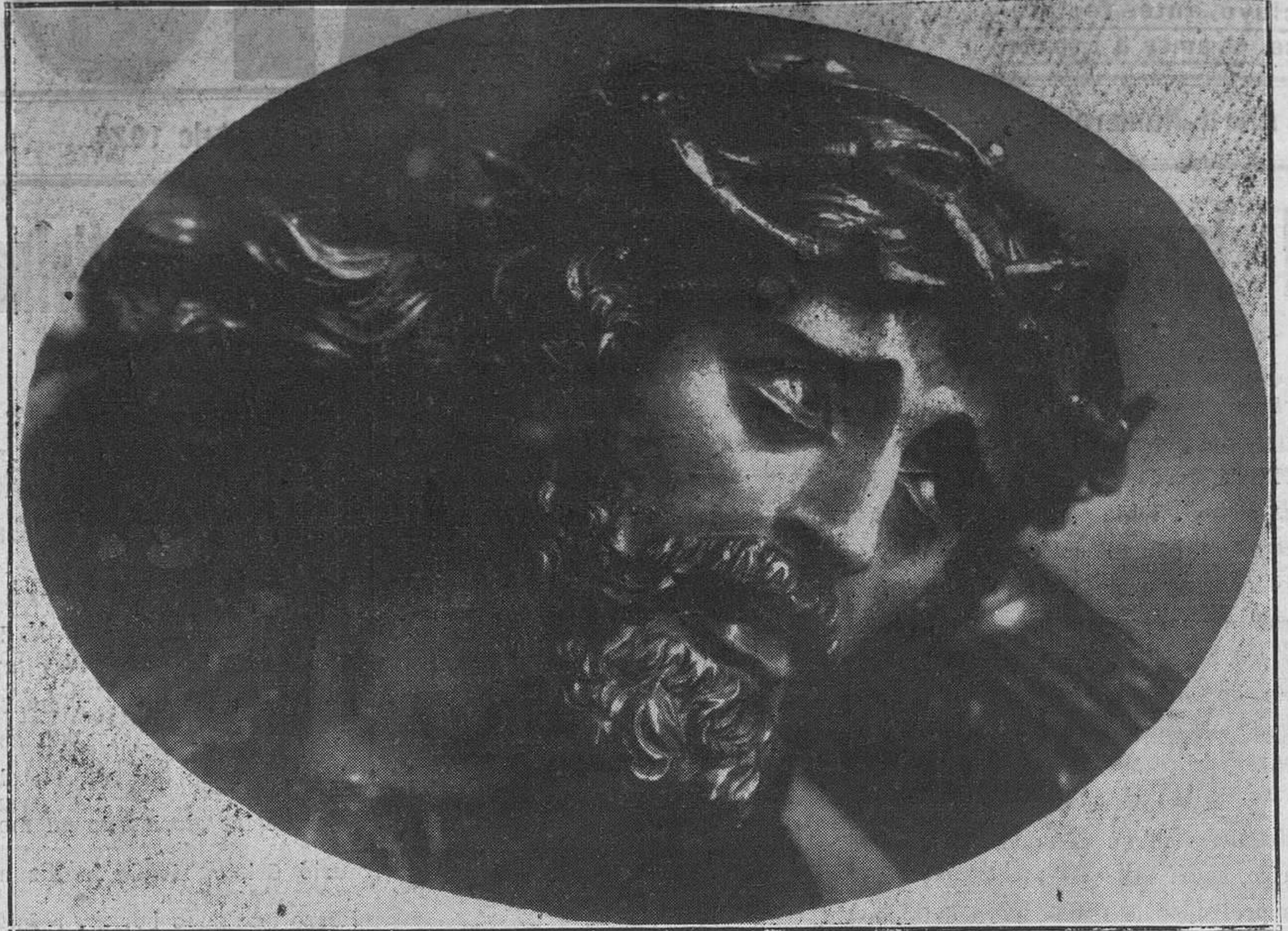
Santa Faz de la milagrosa imagen de Jesús Nazareno, que se venera en la capilla de Galiana, Avilés.