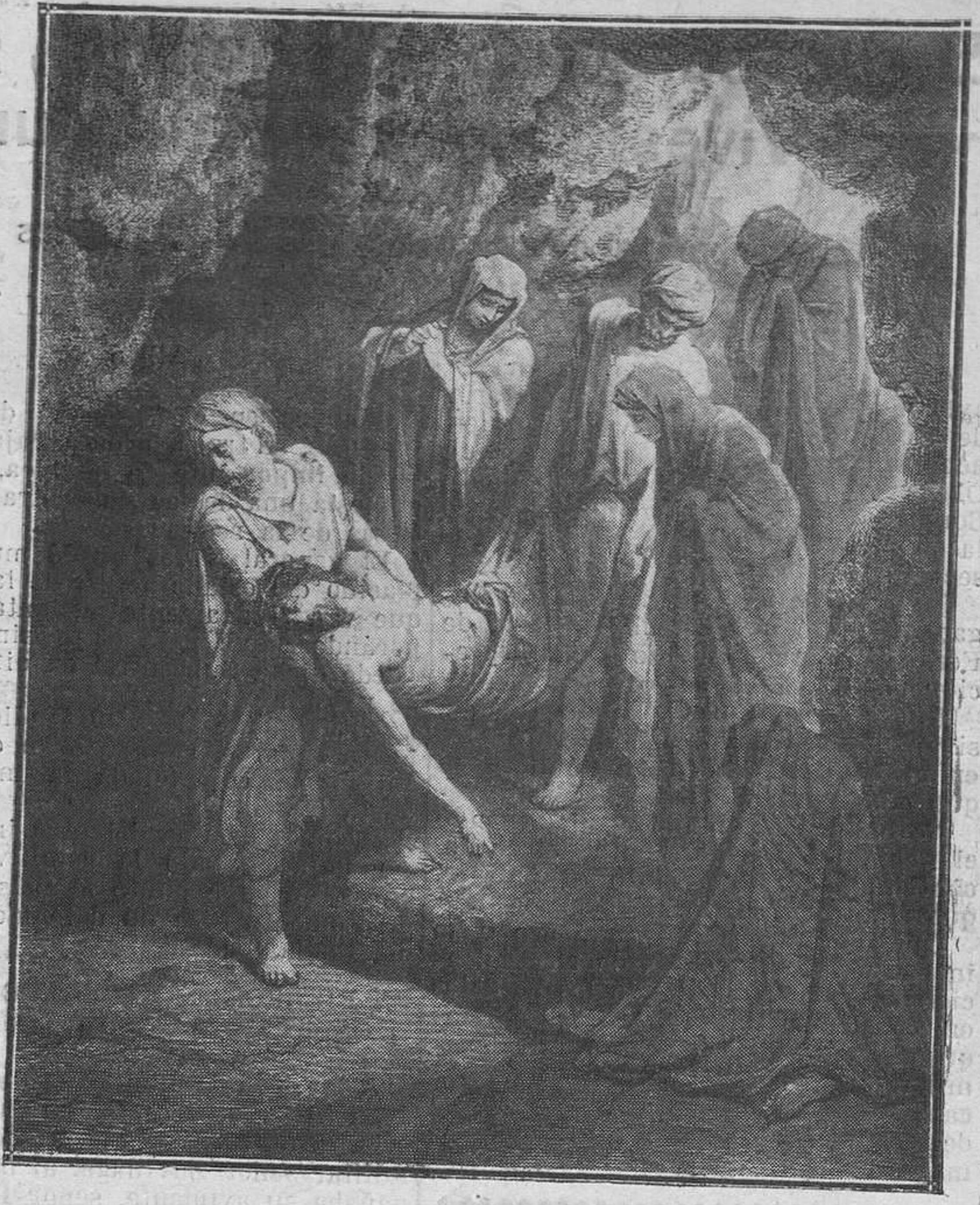
El entierro de Cristo. (Grabado de G. Doré)

Visítad la casa SAN MATEO y encontrareis economía en toda clase de aparatos eléctricos. Muchos y elegantes modelos en aparatos de comedor, tulipas y linternas de bolsillo. TELEFONIA - INSTALACIONES Argüelles, 13.-Teléfonos 8-38 y 8-93.-OVIEDO