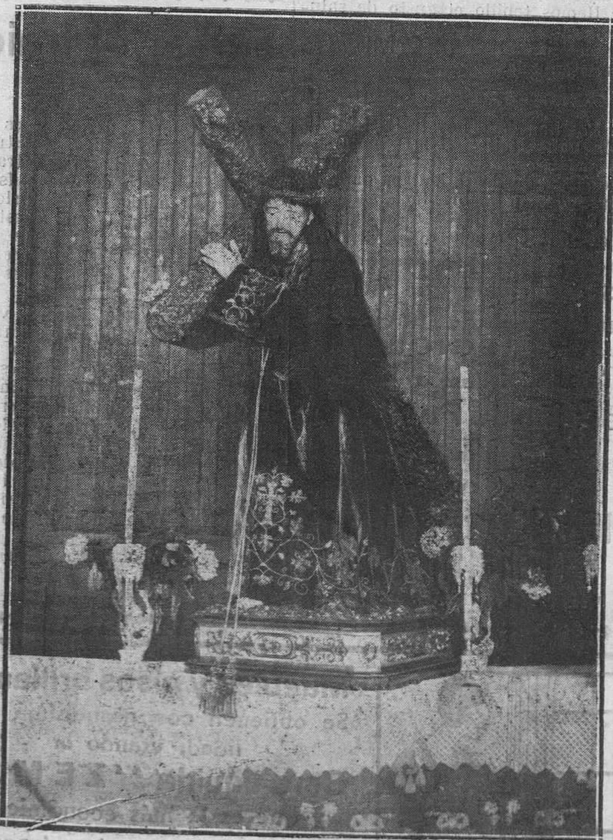
El milagroso Jesús Nazareno de Noreña.

Acaso tú, lector, como otros muchos mortales, llevés en la vida una cruz a cuestas. Llévala más dignamente cuanto menos la hayas merecido.