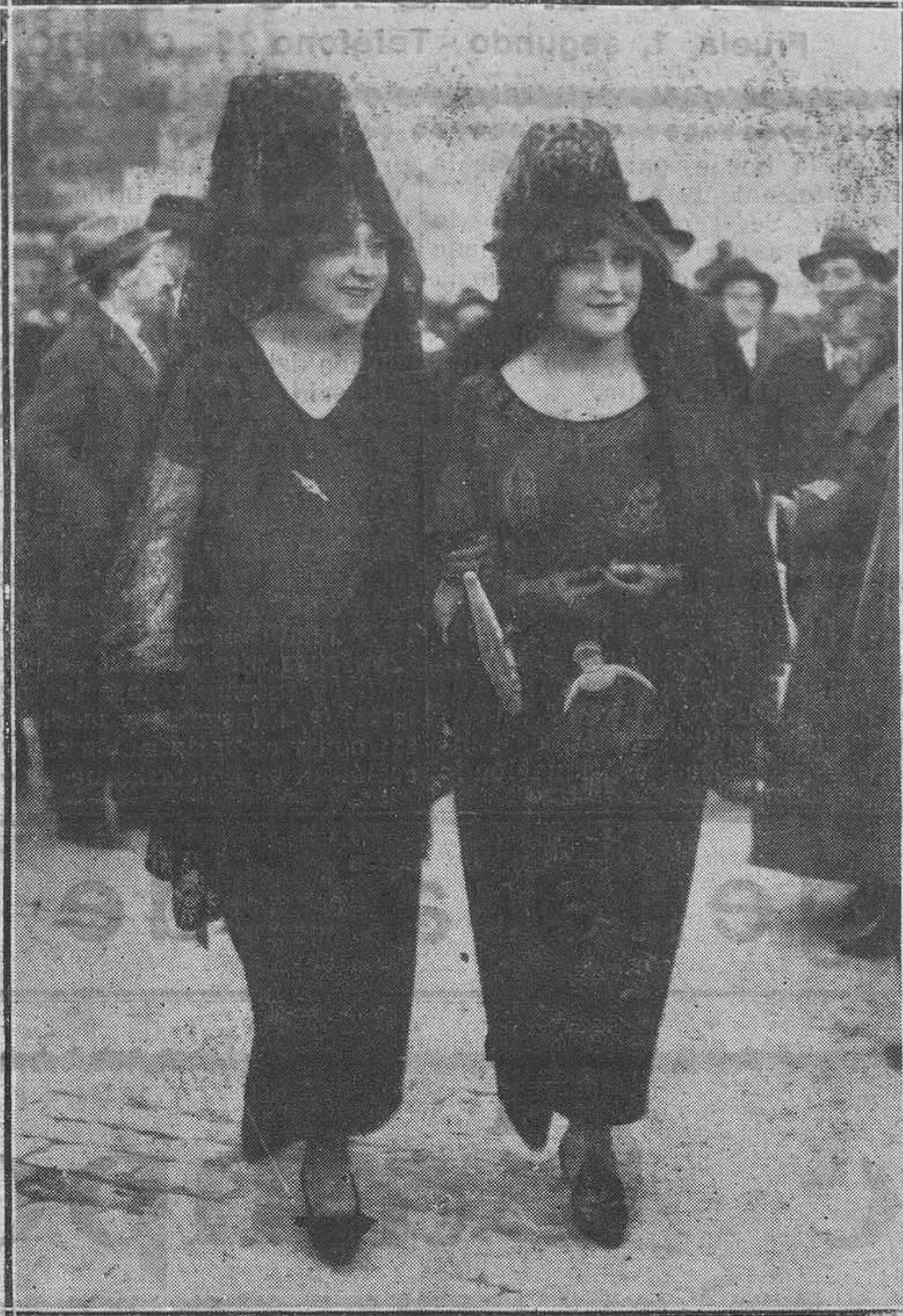
Recorriendo las iglesias