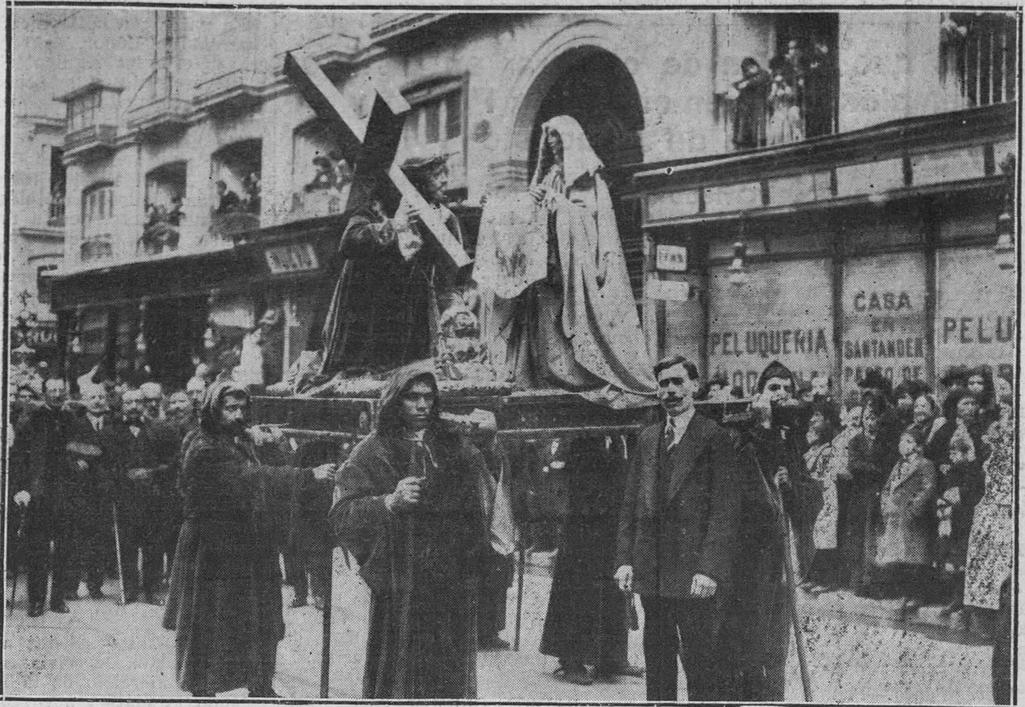
LA SEMANA SANTA EN MADRID.-El paso "La Verónica".