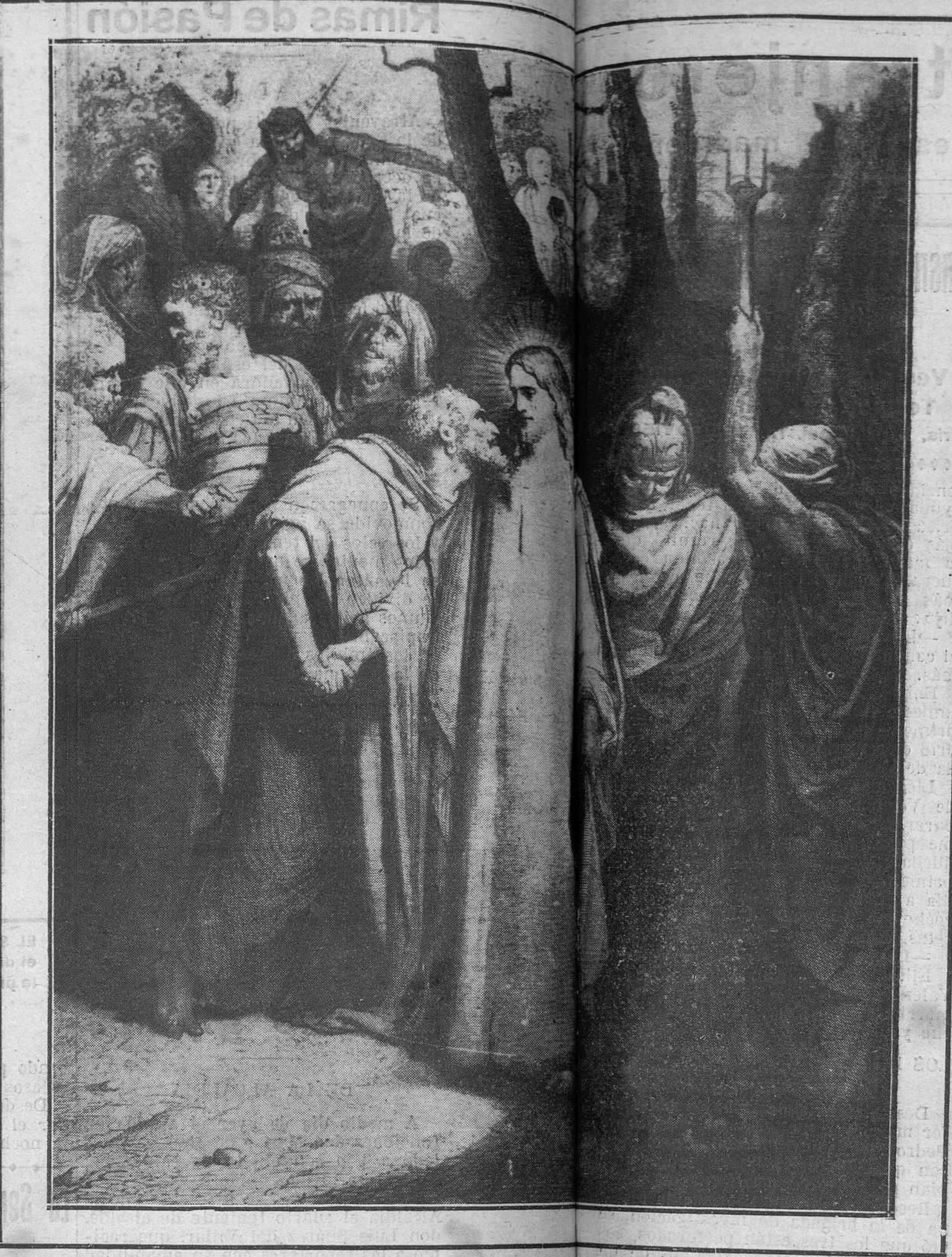
“EL BESO DE JUDAS” (Grabado de G. Doré)