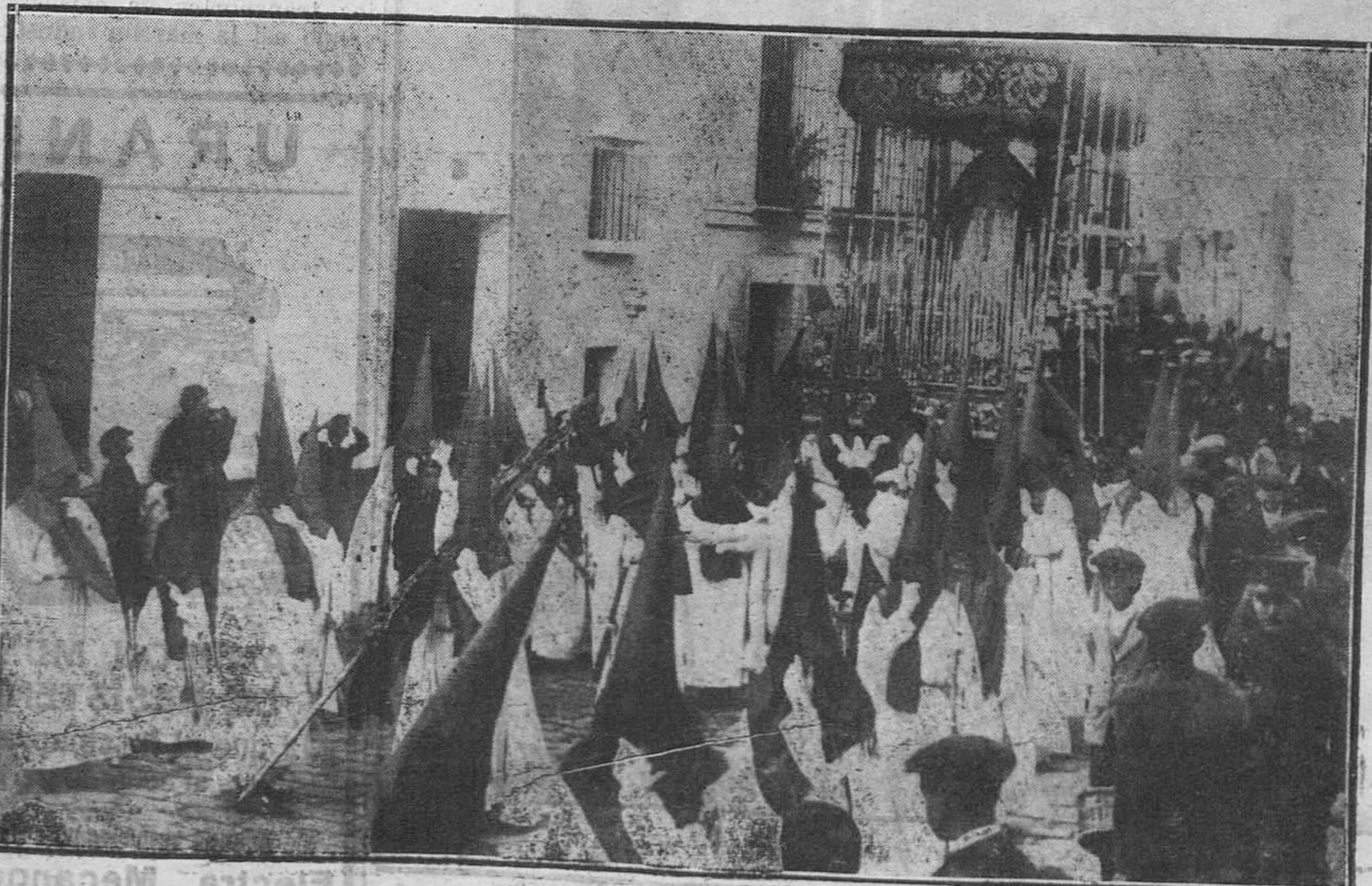
LA SEMANA SANTA EN SEVILLA.—Desfile de una Cofradía.