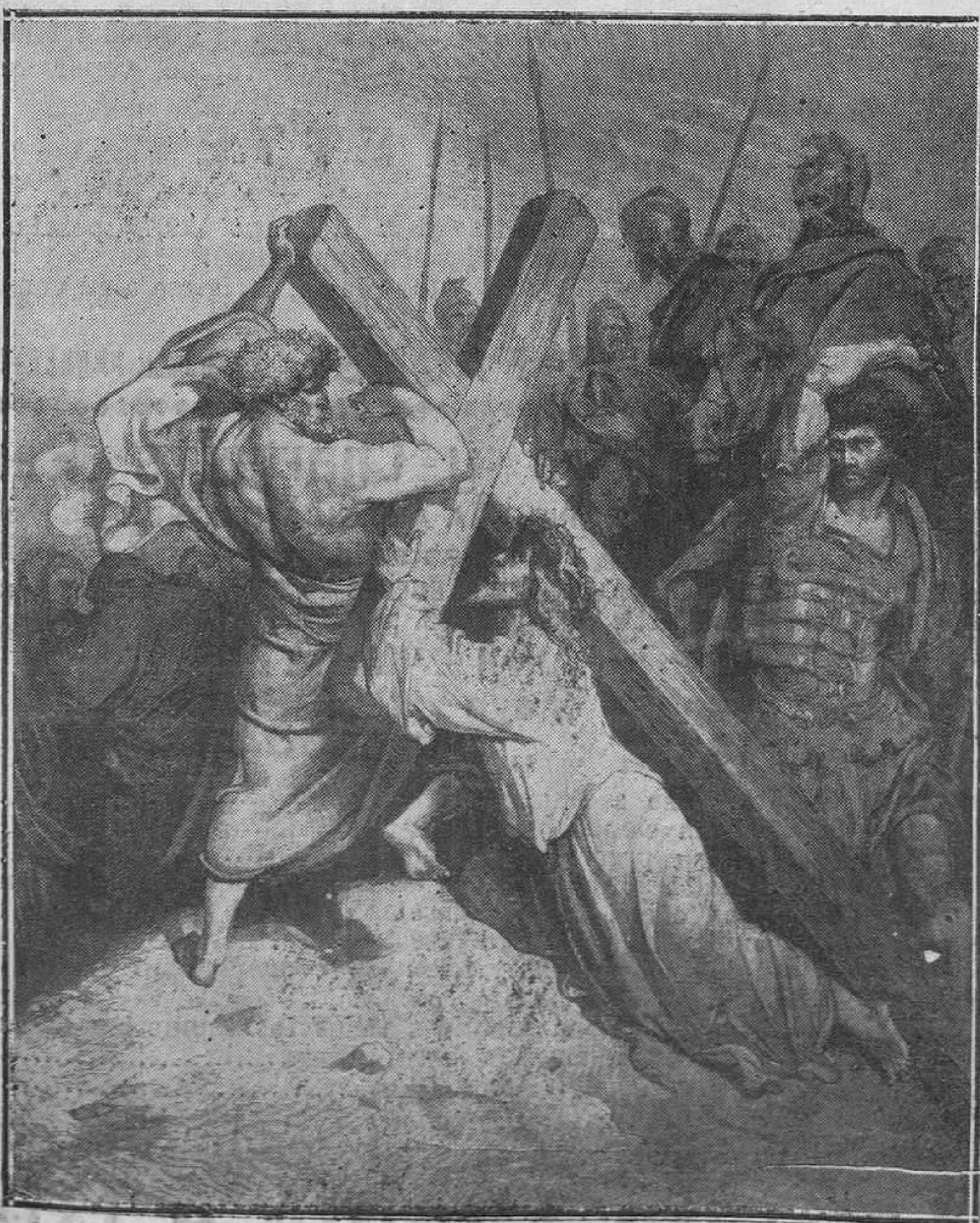
Caída de Jesús, camino del Calvario.