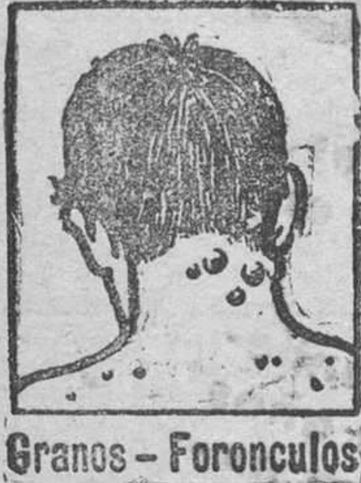
Granos - Foronculos

La sangre del artrítico esta entorpecida por venenos que provienen de una insuficiencia de vitalidad y por consiguiente, su circulacion es del todo defectuosa. Las piernas del enfermo estan hinchadas y entorpecidas con varices dolorosas con peligro de ruptura o de ulceracion interminable. Con frecuencia el artrítico esta atormentado con dolores gotosos o reumaticos que le hacen achacoso y con el tiempo le agotan. Sus riñones estan generalmente obstruidos con nefritis, albuminuria; arena en la orina (mal de piedra) y a veces fuertes dolores en la espalda. Las arterias duras y quebradizas como tubos de pipa (arterioesclerosis) amenazan a cada instante, accidente generalmente pronosticado con insomnios y dolores de cabeza. La mujer artrítica tiene epocas irregulares o penosas y su edad critica es un largo suplicio, con bocanadas de calor, vertigos, jaquecas, postracion profunda, con frecuencia fibromas o tumores en el vientre. Los artríticos de ambos sexos tienen tambien enfermedades de la piel, acné, eczemas, herpes, sarpullidos, prurigo, soriasis, foronculos, etc., con lesiones molestas y comezons intolerables. Todos esos enfermos de la sangre, todas esas victimas martires del artritismo no tienen que desesperarse y creerse incurables pues su curacion es segura pues el