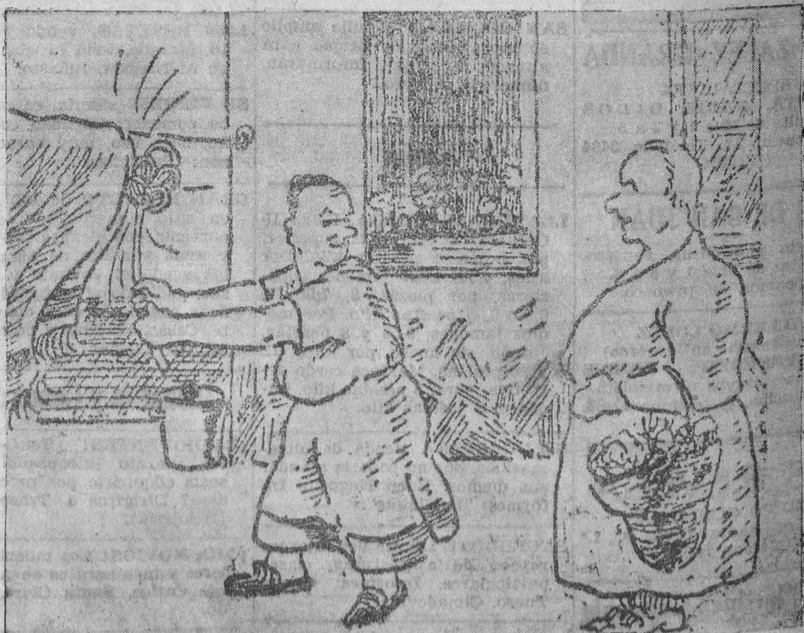
—Sí, señora; si no tuviera siempre presente el recuerdo de mi difunto marido, no sé dónde estaría contraria valor para golpear fuerto.

Terminó diciendo que procuraría impedir que nadie se saliera de la ley.