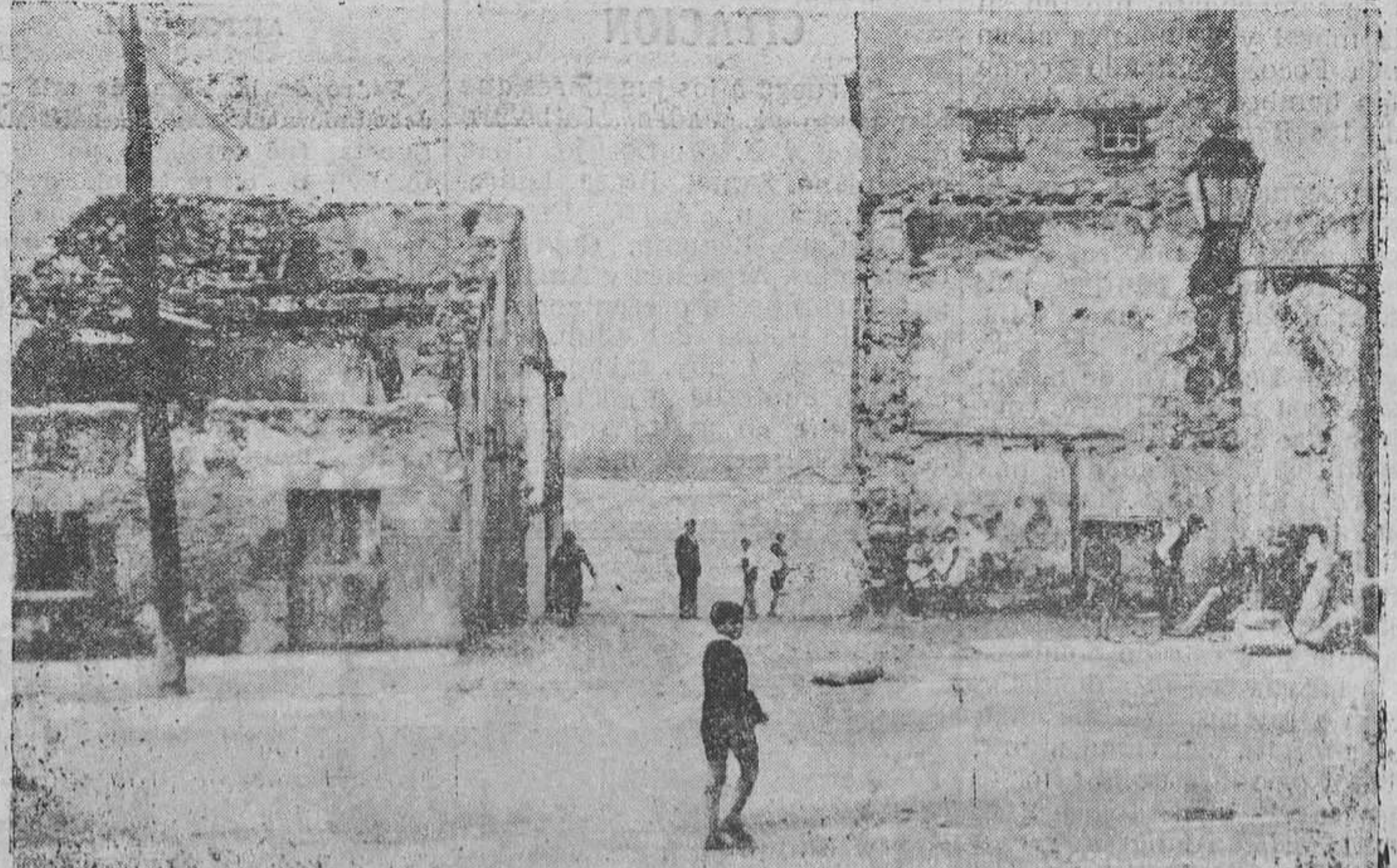
OVIEDO.— Por fin, se están realizando las obras de prolongación de la calle de Alonso Quintanilla. (Foto Mena).