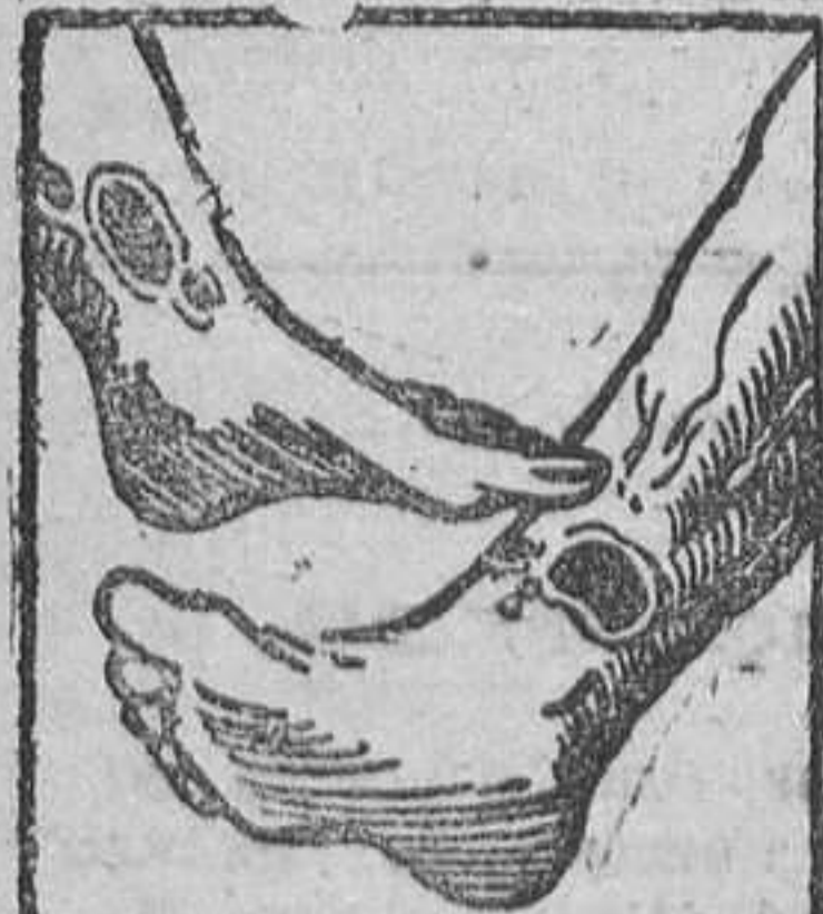
Males en las piernas