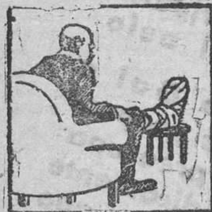
Gota - Dolores