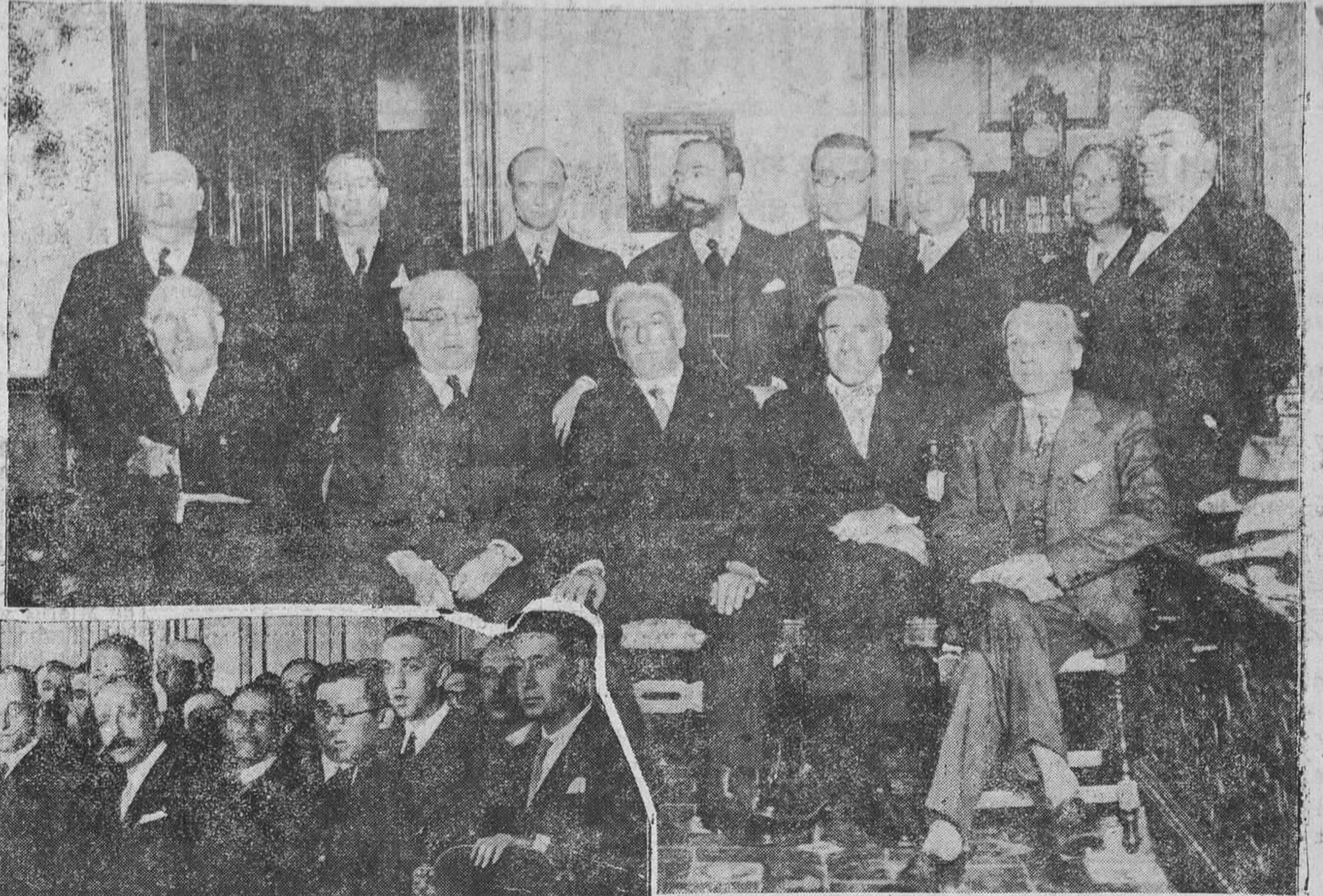
MADRID.— El nuevo Gobierno y el presidente de la Cámara visitan al señor Alcalá Zamora para saludarle y darle cuenta de la solución de la crisis..