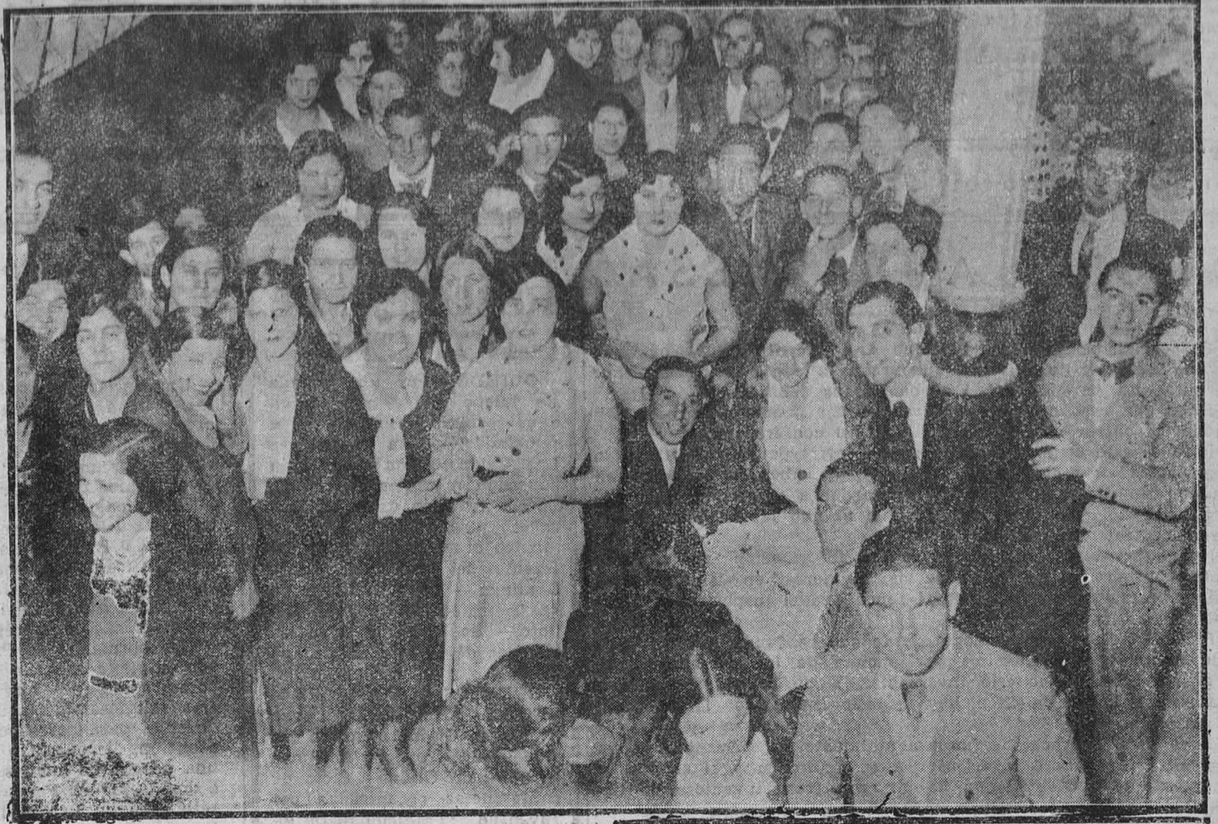
OVIEDO.—Un rincón del Orfeón Ovetense en el momento de ser elegida "Miss Orfeón".

Por esta vez, y aunque no todos mejoramos, hemos conseguido un pequeño triunfo, que ha beneficiado a los compañeros más perjudicados por la reforma de supresión del derecho de entrega de las cartas a domicilio y que tenían un sueldo inferior a mil quinientas pesetas anuales. Para los próximos presupuestos se destinan a carteros rurales y peatones de cuatro a cinco millones de pesetas, cantidad, que para todos no llena nuestras aspiraciones, pero que permite tener confianza en que irán poco a poco cubriendo nuestras más perentorias e inaplazables necesidades. Sin embargo, no olvidando que nuestra organización es la base de nuestra economía, llegaremos a la consecuencia, que cuanto más fuerte sea nuestro sindicato, mayor probabilidad habrá de que nuestras reivindicaciones sean un hecho real. Por lo que es necesario que todos los afiliados en general trabajen por atraer a los compañeros que faltan, que aunque son menos de la mitad, no por eso se debe prescindir de ellos, casí queremos afianzar nuestro éxito y emprender nuevas campañas.