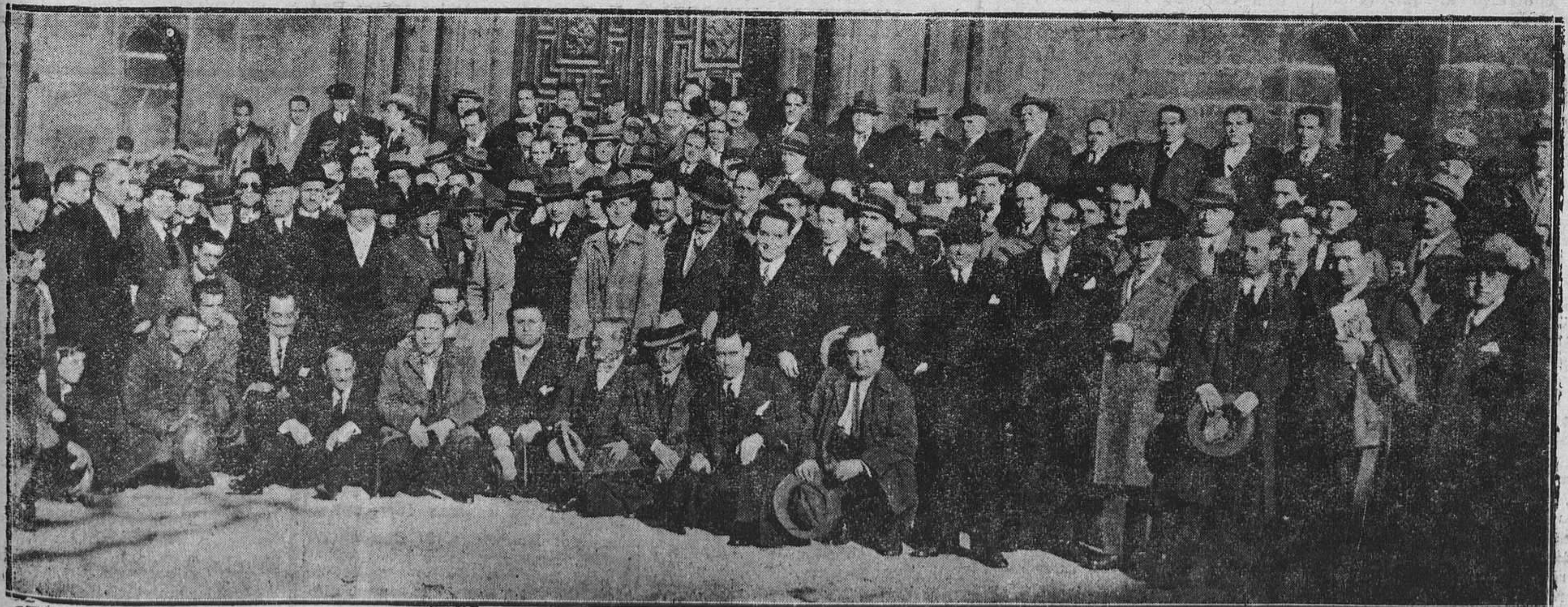
OVIEDO.--Grupo de concurrentes al banquete celebrado el domingo por los viajantes, representantes y dependientes de comercios para conmemorar el segundo aniversario de la fundación de su floreciente Sociedad.