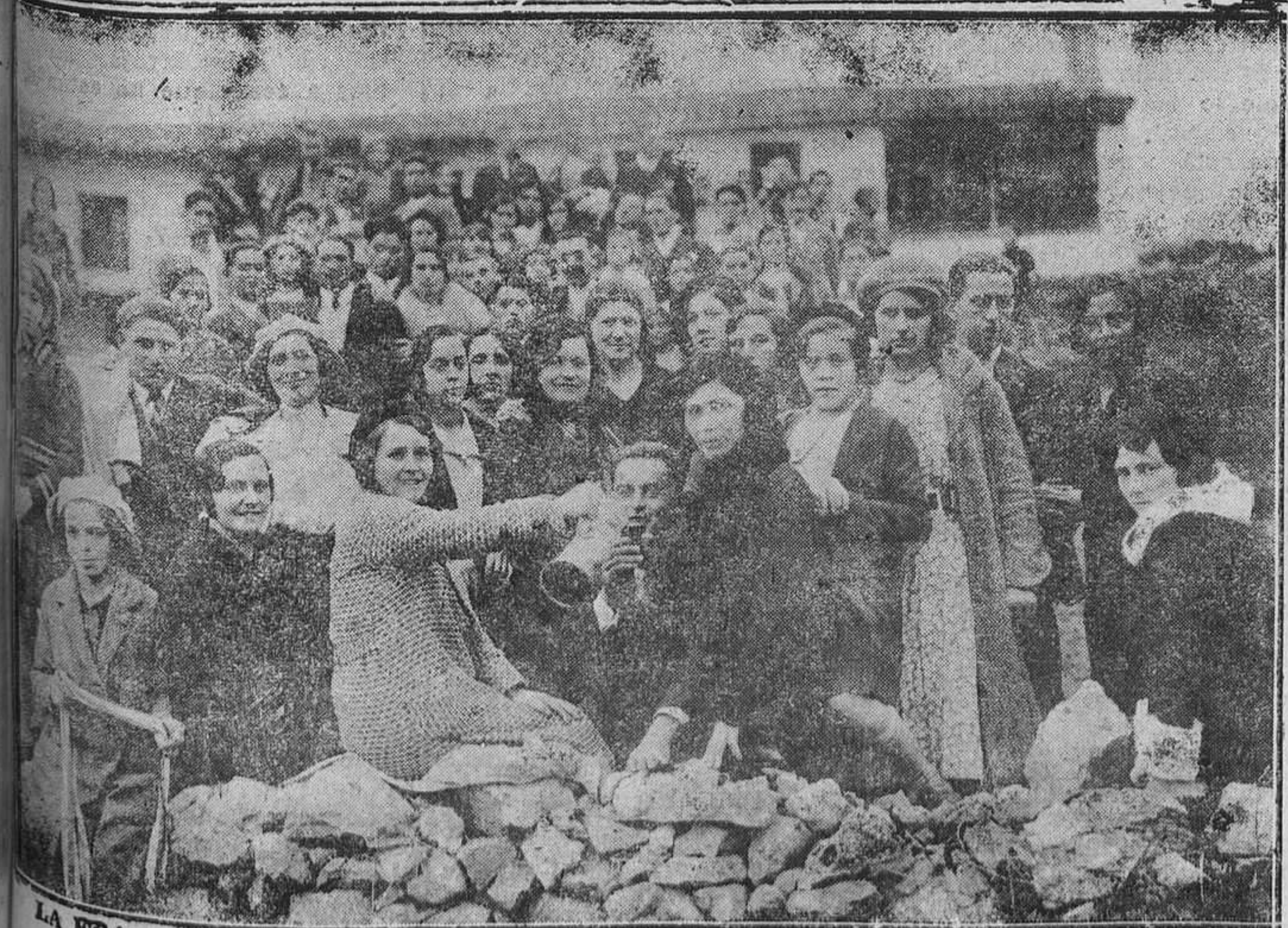
LA FRANCA (Colombres).—Entre este animado grupo figuran las lindas jóvenes que forman la comisión de festejos de San Andrés.