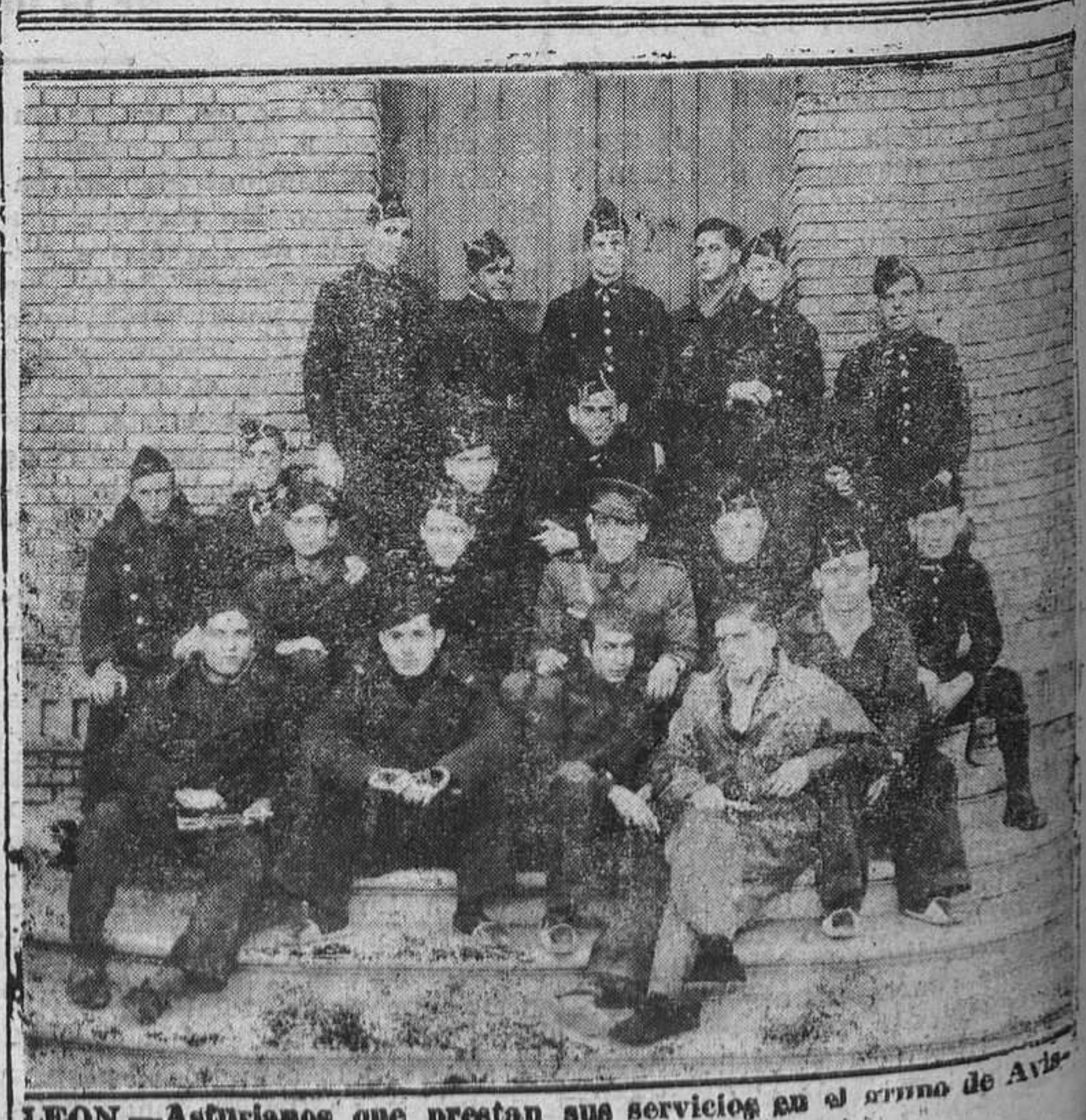
LEON.—Asturianos que prestan sus servicios en el armío de Avila. Año número 23.

A cuantos nos favorecen con el envío de originales, les recordamos que nos es imposible devolver los que no se publiquen, ni mantener correspondencia acerca de los mismos.