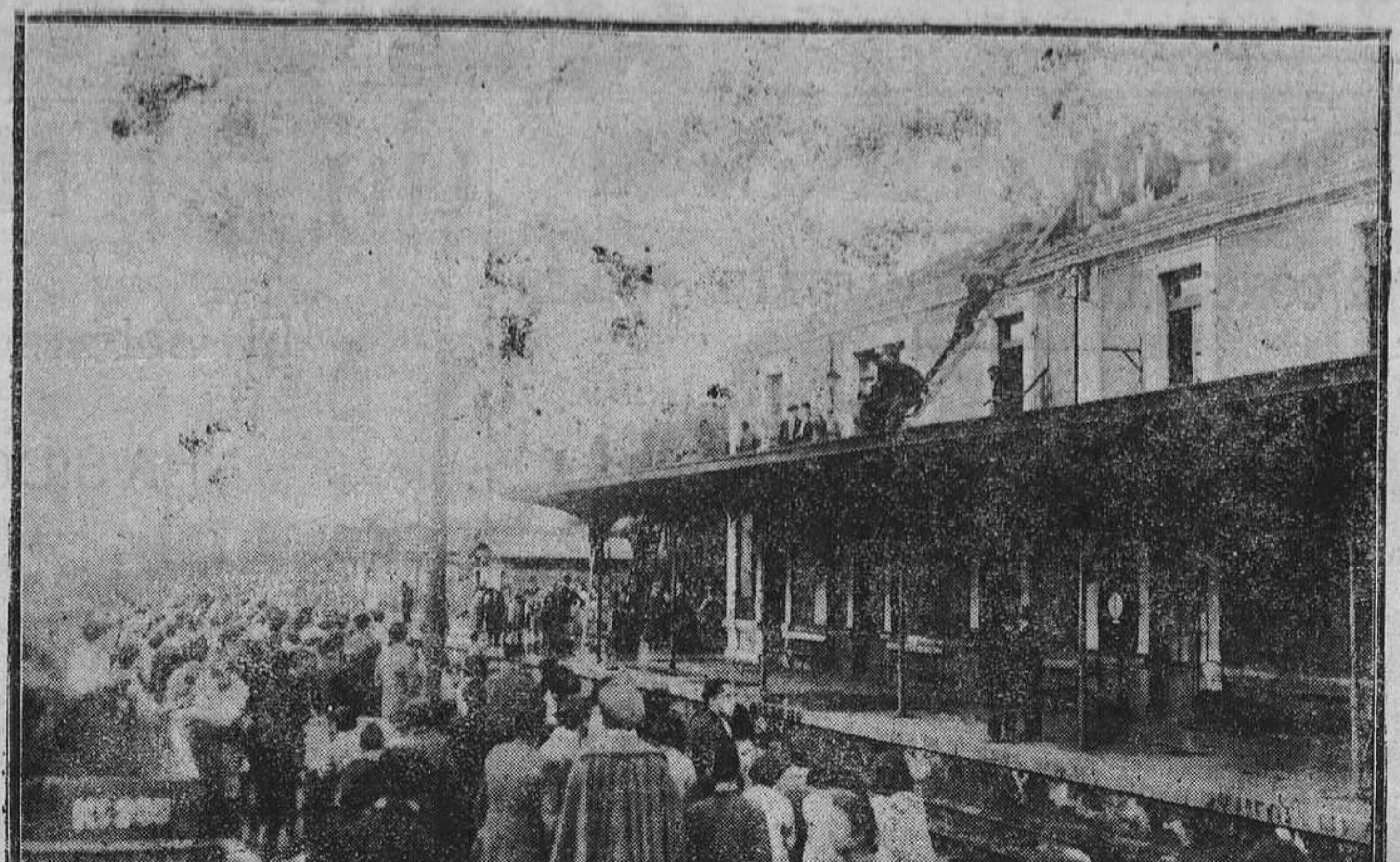
LLANES.—Un aspecto del incendio que ocasiono grandes destrozos en las habitaciones del señor Armas, dueño del restaurant de la estación.

Además lo habrá también el primer miércoles de cada mes hará un servicio a Oviedo, saliendo de Mallecina a las ocho de la mañana, para llegar a Oviedo a las diez y media y la salida de Oviedo será a las cuatro de la tarde.