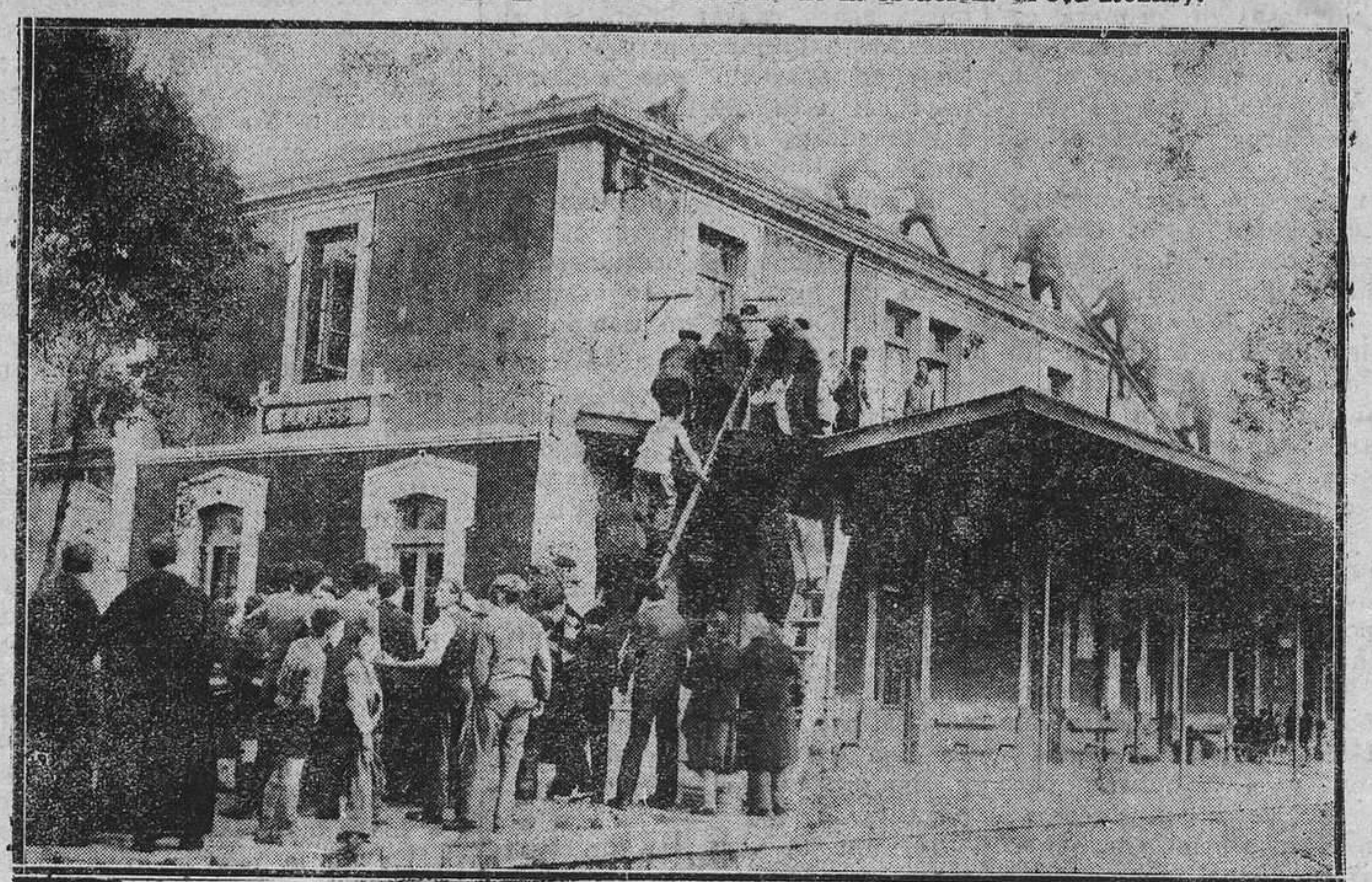
LLANES.—Incendio en la estación del ferrocarril. El vecindario presta, solícito, sus servicios desinteresados y logra cortar con su abnegación el siniestro.

VENTA Se vende o arrienda el inmueble y maquinaria de la Sociedad Anónima "Fundación Manzaneda". Informes: Llano - Ponte, 24, Apartado 21, Avilés.