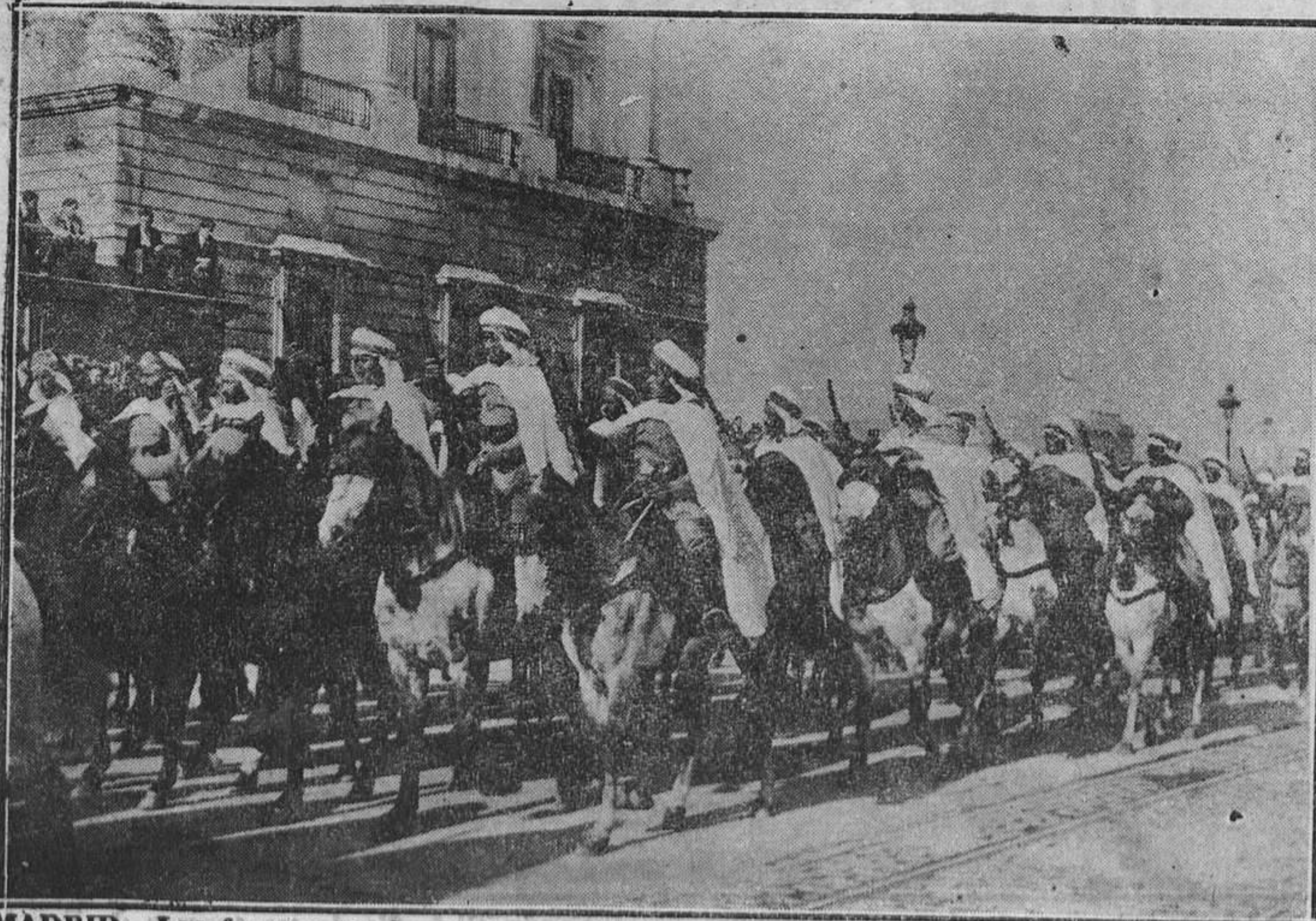
MADRID.—Las fuerzas de Regulares desfilando ante el presidente de la República antes de regresar a Marruecos.

El Presidente de la República abandonó Palacio a las siete de la tarde para dirigirse a la Academia de Ciencias Morales y Políticas con objeto de asistir a una reunión en la misma. Terminada ésta marchó a su domicilio particular.