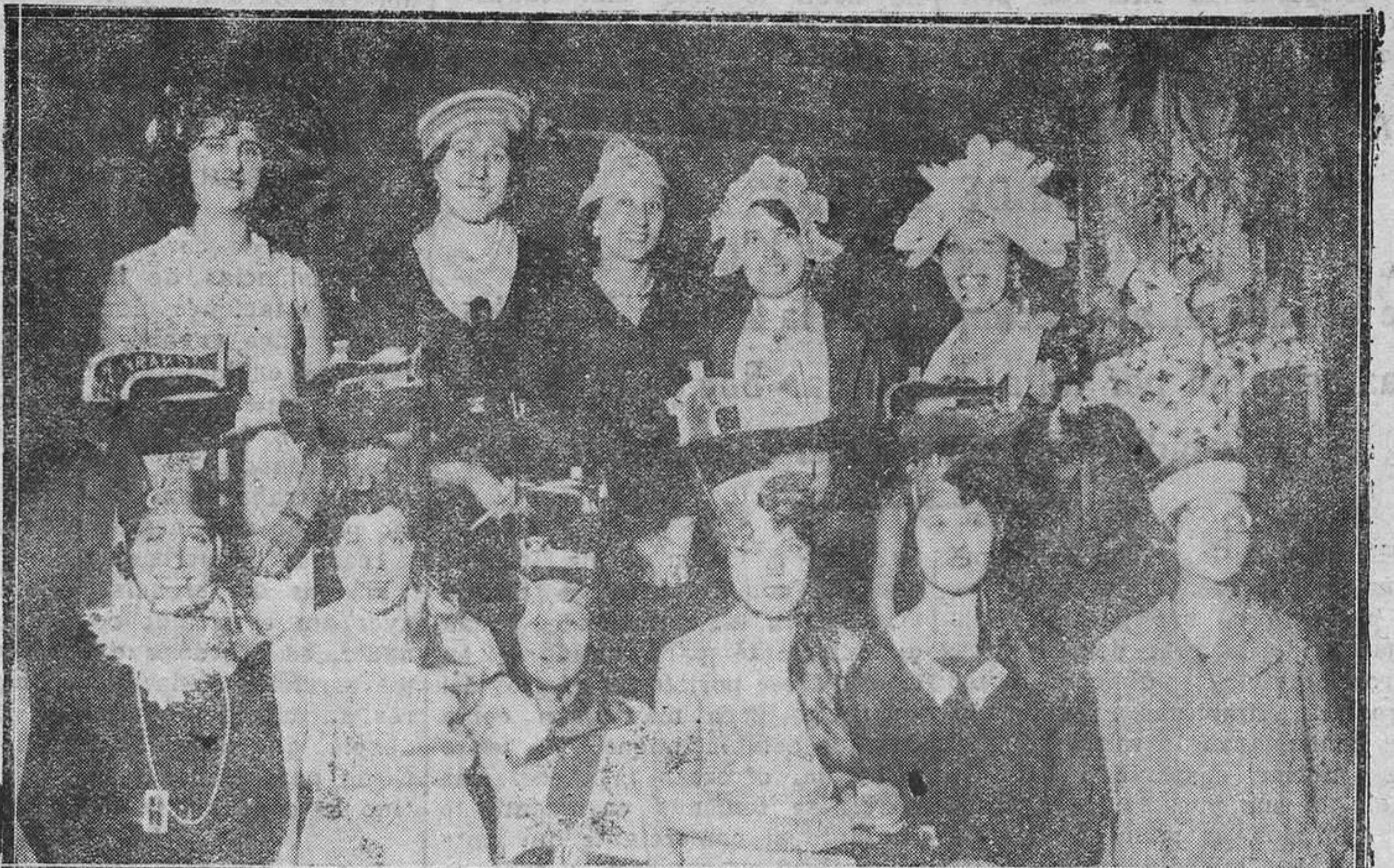
OVIEDO.—De la Patrona de las modistillas. Un grupo de lindas obreritas de la aguja de las que lucieron gorritos en el festival del domingo en la Coral Vetusta.

Cuantos se dirigen a REGION en súplica de que inserte notas oficiosas, convocatorias, retos, etc., tengan en cuenta que para asegurar su inmediata publicación en el periódico, sin perturbar la buena marcha de los servicios del mismo, deberán proceder de modo que los correspondientes originales se hallen en nuestro poder "antes de las ocho de la tarde."