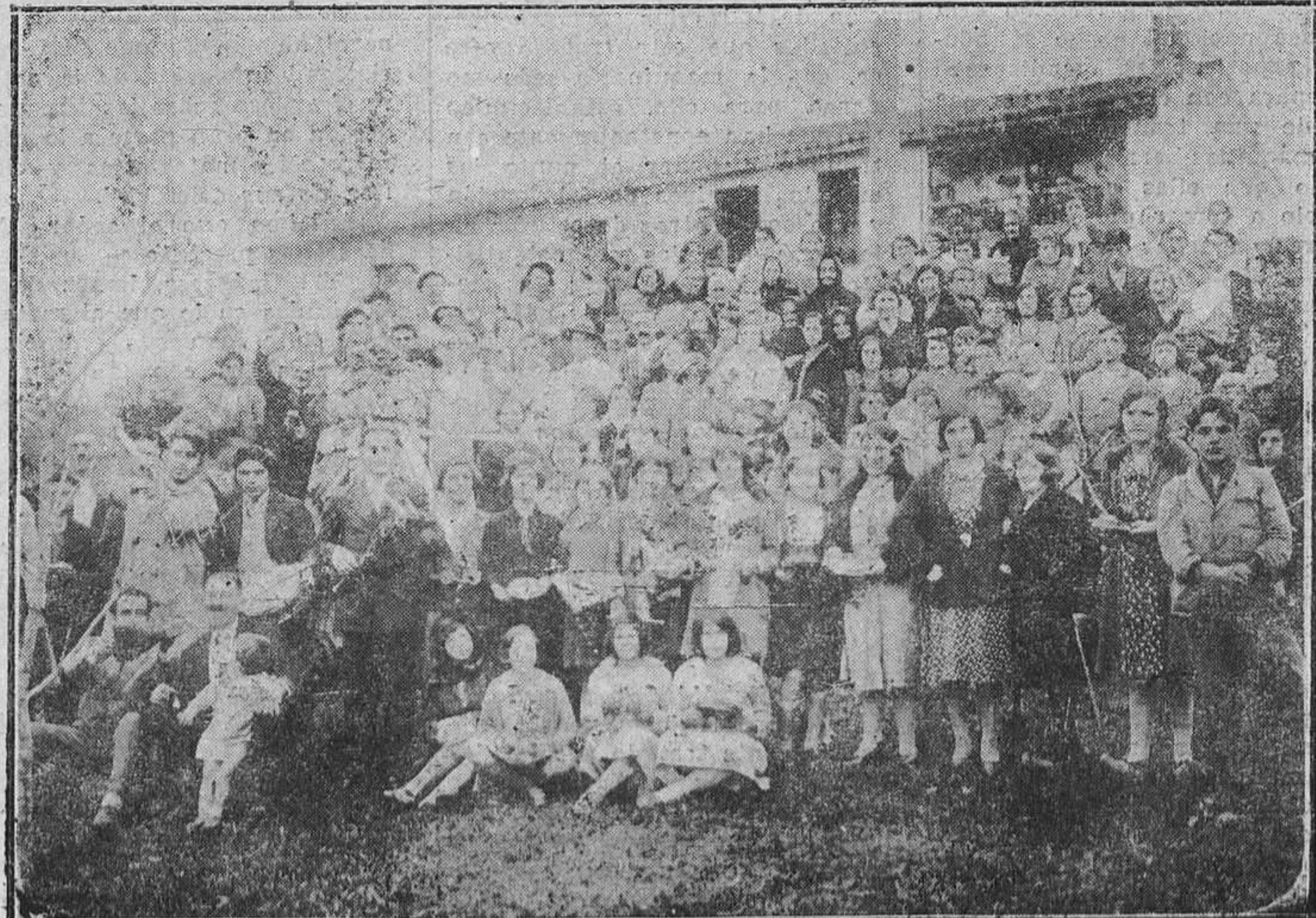
LA FRANCA (Colombres).—La juventud celebra con entusiasmo las fiestas de San Andrés.

Se anuncia un concurso por término de cinco días para la adquisición de un contador de cien milímetros de diámetro con destino al nuevo Matadero municipal.