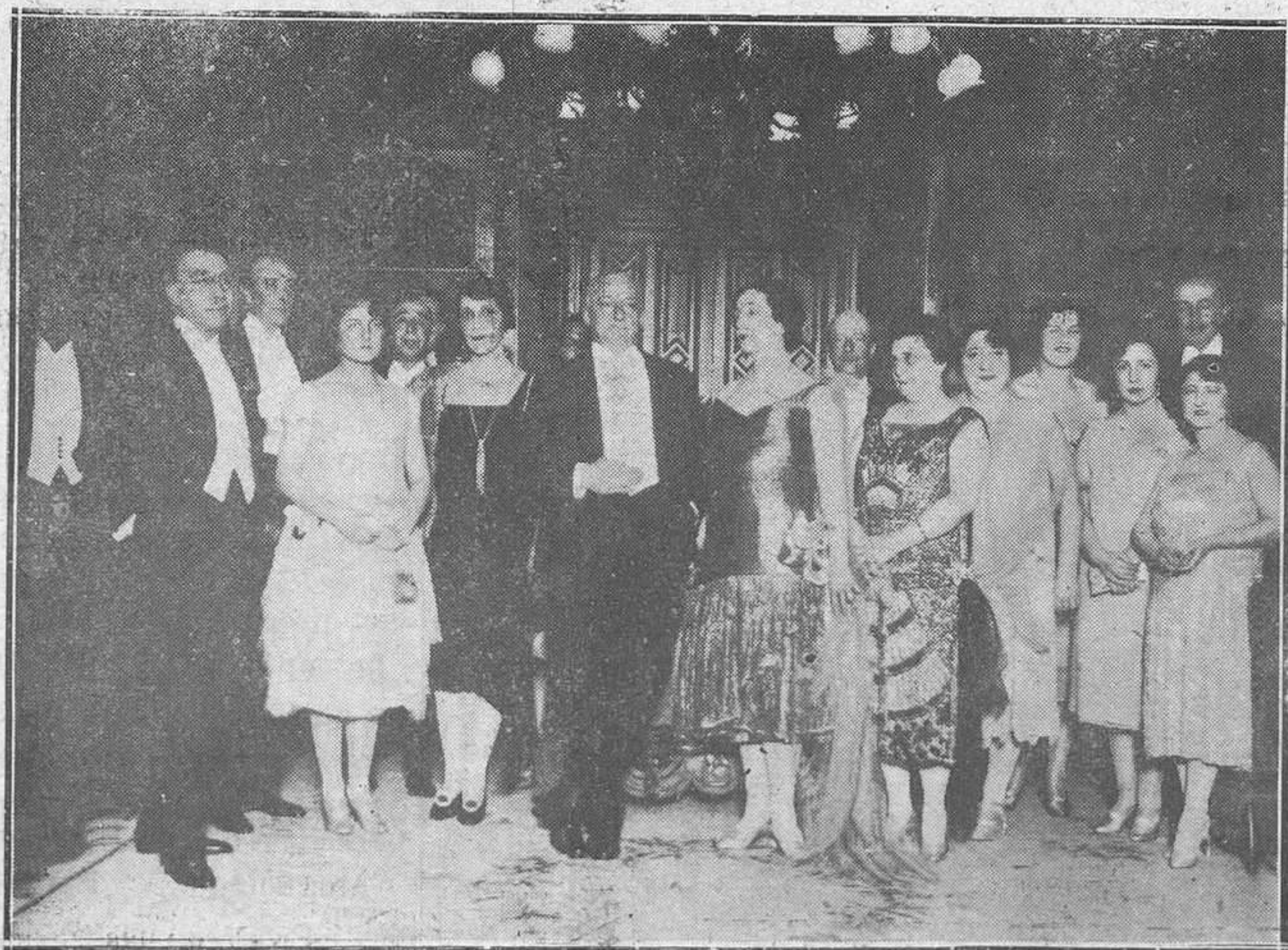
Madrid.-El general Primo de Rivera, con el embajador de Alemania, el ministro de Chile y varios distinguidos concurrentes al banquete en obsequio a dichos embajadores.