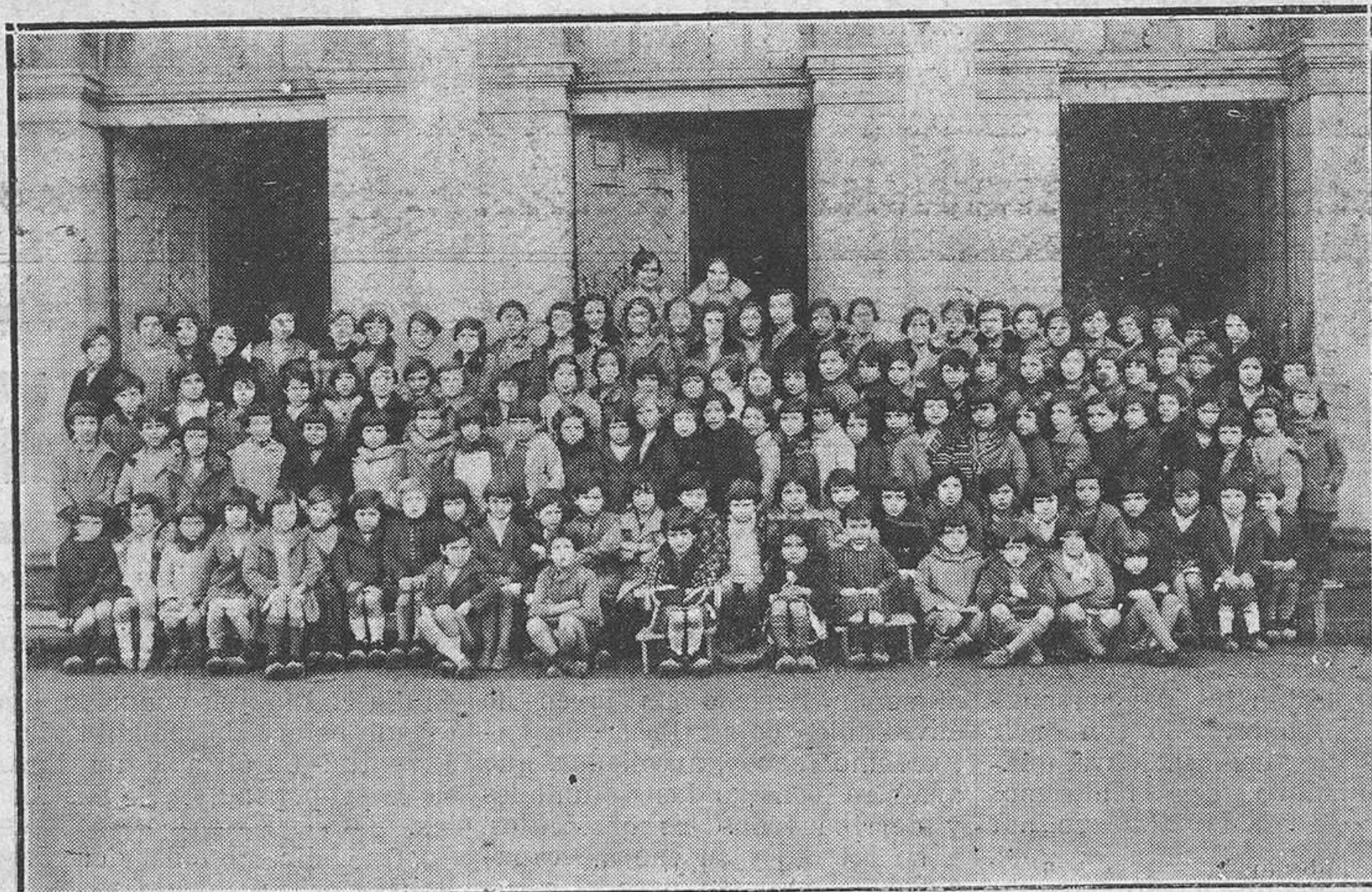
Niñas de las escuelas nacionales de Trubia.