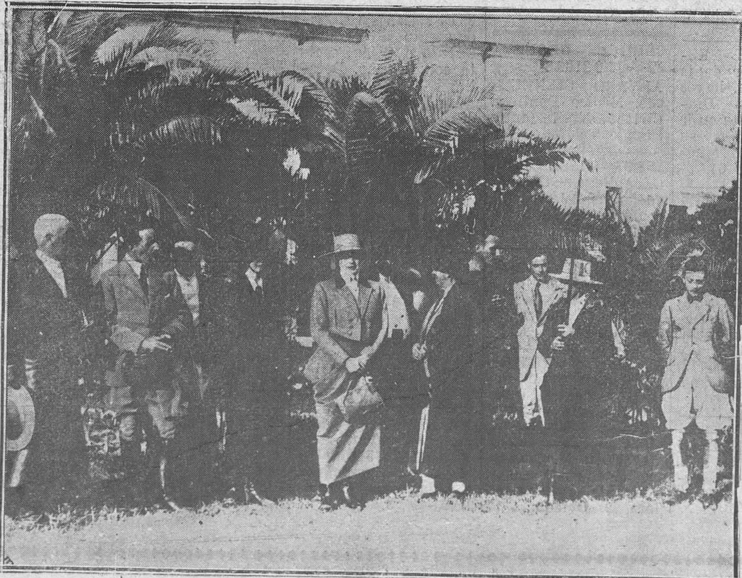
Una escena de la película "Hispania", una de las últimas producciones cinematográficas española, en la que aparece el Rey Alfonso XIII, la Reina Victoria Eugenia, el Príncipe de Gales, el Príncipe Jorge de Inglaterra e Infante de España y un grupo de aristócratas, en la cacería dada en honor de S. M. en el Coto de Doñana.