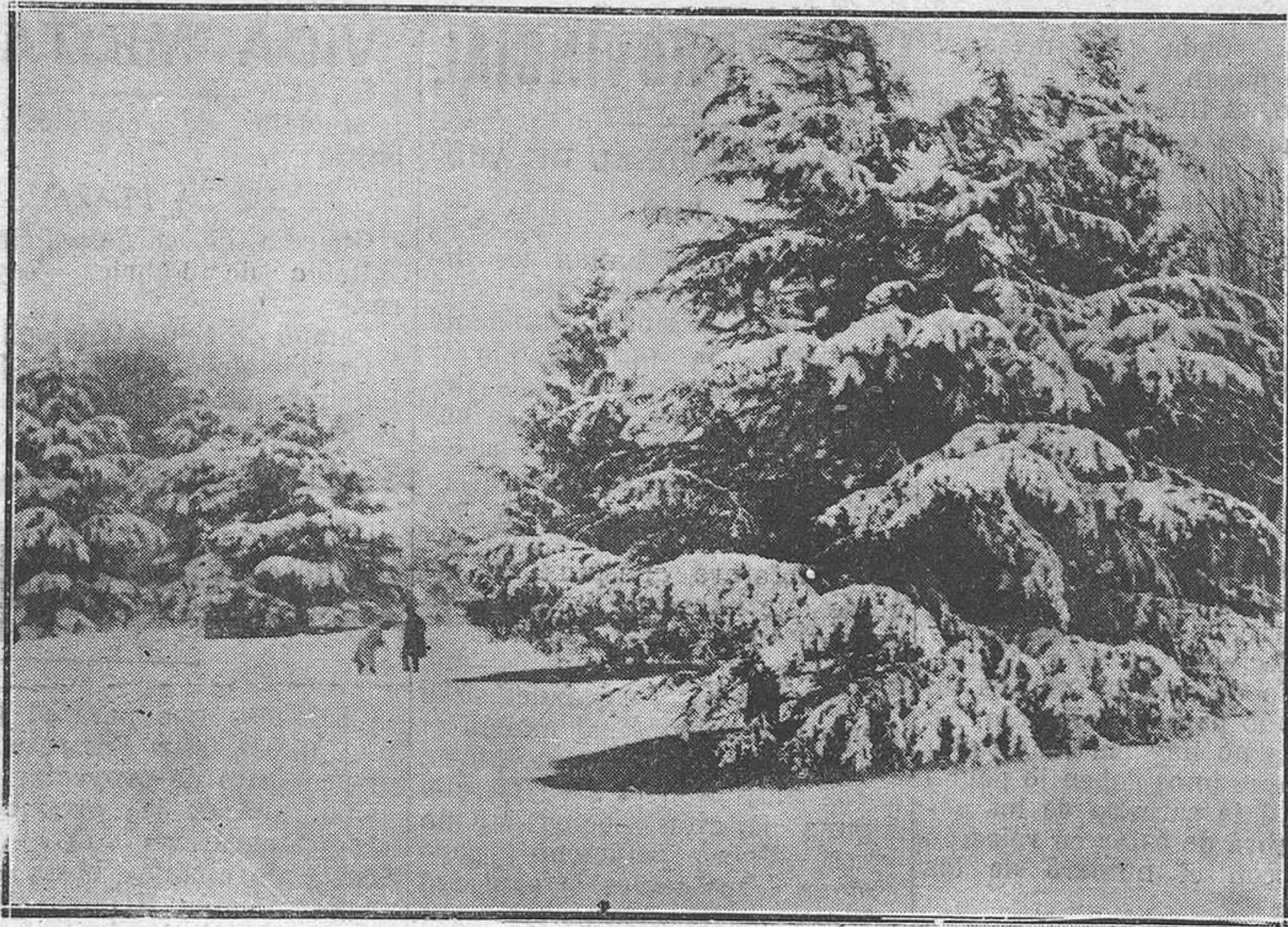
Madrid bajo la nieve.-La Moncloa.