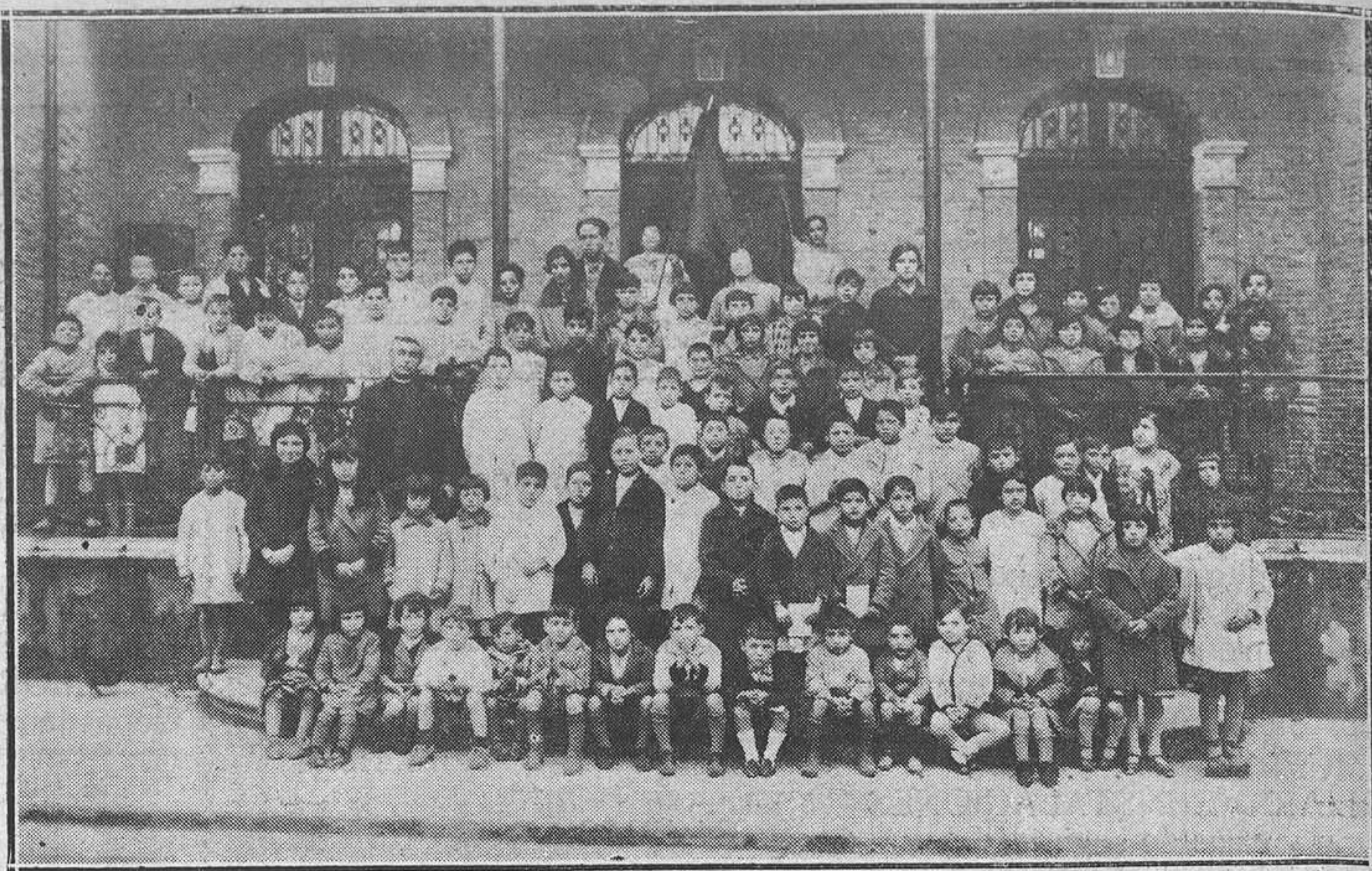
Grupo escolar de Cayés.

A las siete y a las diez, "Lluvia de primos" y "La reina de la moda".