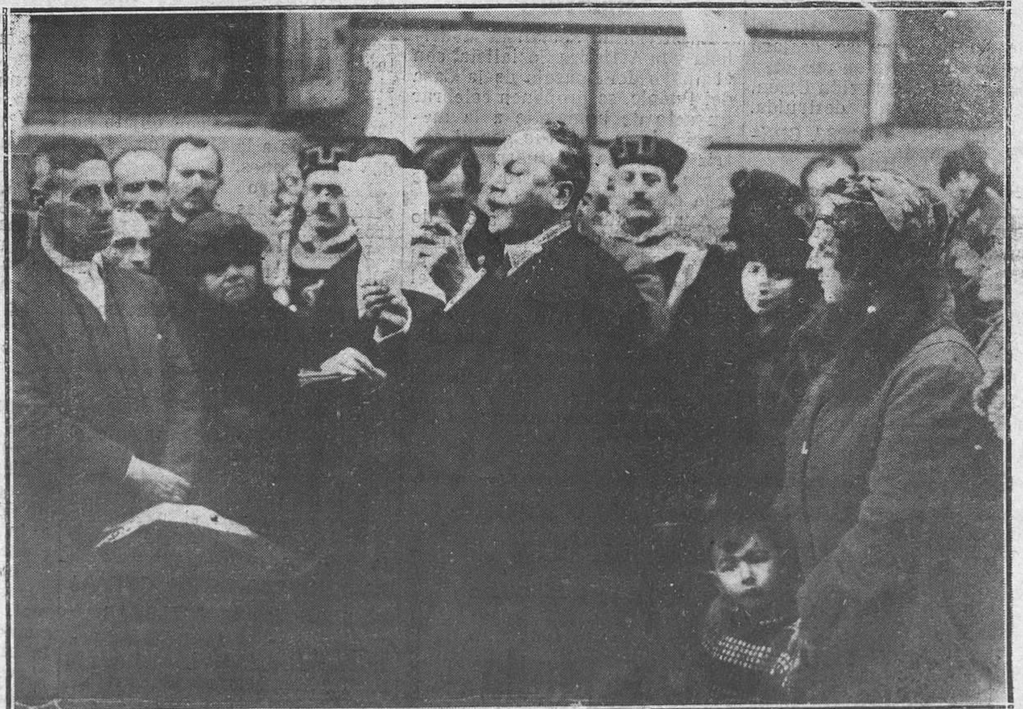
Madrid.-El ilustre comediógrafo don Serafín Álvarez Quintero, leyendo unas cuartillas en el acto del descubrimiento de la lápida dedicada a la memoria de Becquer.

el desayuno, consistente en un platito de crema o de mermelada y una taza de café. (Se trata de lograr una alimentación a un tiempo nutritiva y frugal, a fin de mejorar el funcionamiento de los órganos digestivos, en cuyo deficiencia tiene generalmente su origen el mal color del rostro). Antes de acostarse es muy conveniente tomar una cucharadita de aceite y hacer cinco minutos de ejercicio. Con la cabeza erguida, los talones juntos y el busto saliente, levántense los brazos por encima de la cabeza, júntense las puntas de los dedos y bájense hasta tocarse las puntas de los pies. Este ejercicio es excelente para estimular los músculos abdominales.