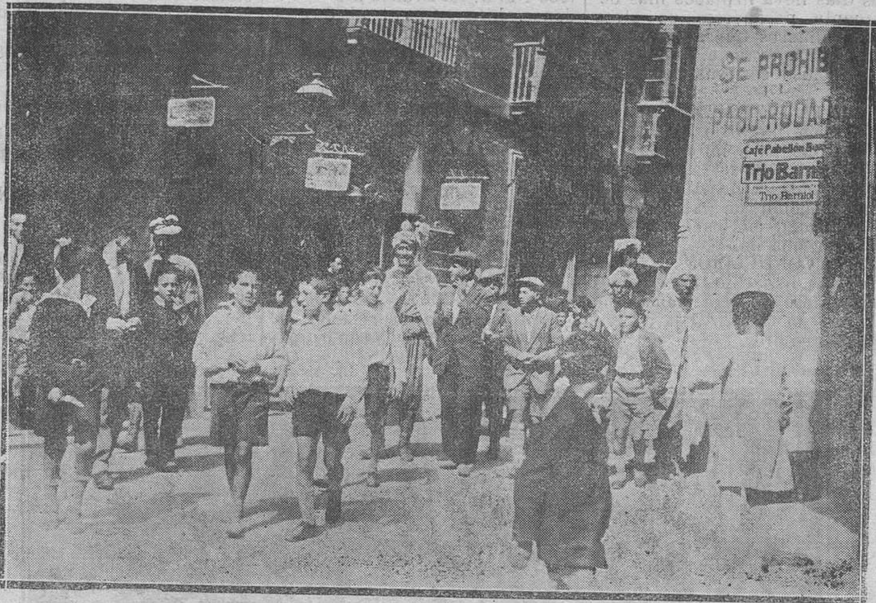
OVIEDO.—Los árabes que tomaron parte en el festival de la Asociación de la Prensa Gijonesa. (Foto Mena).

Conviene no cejar en esta campaña contra los desaprensivos traficantes con los alimentos de primera calidad.