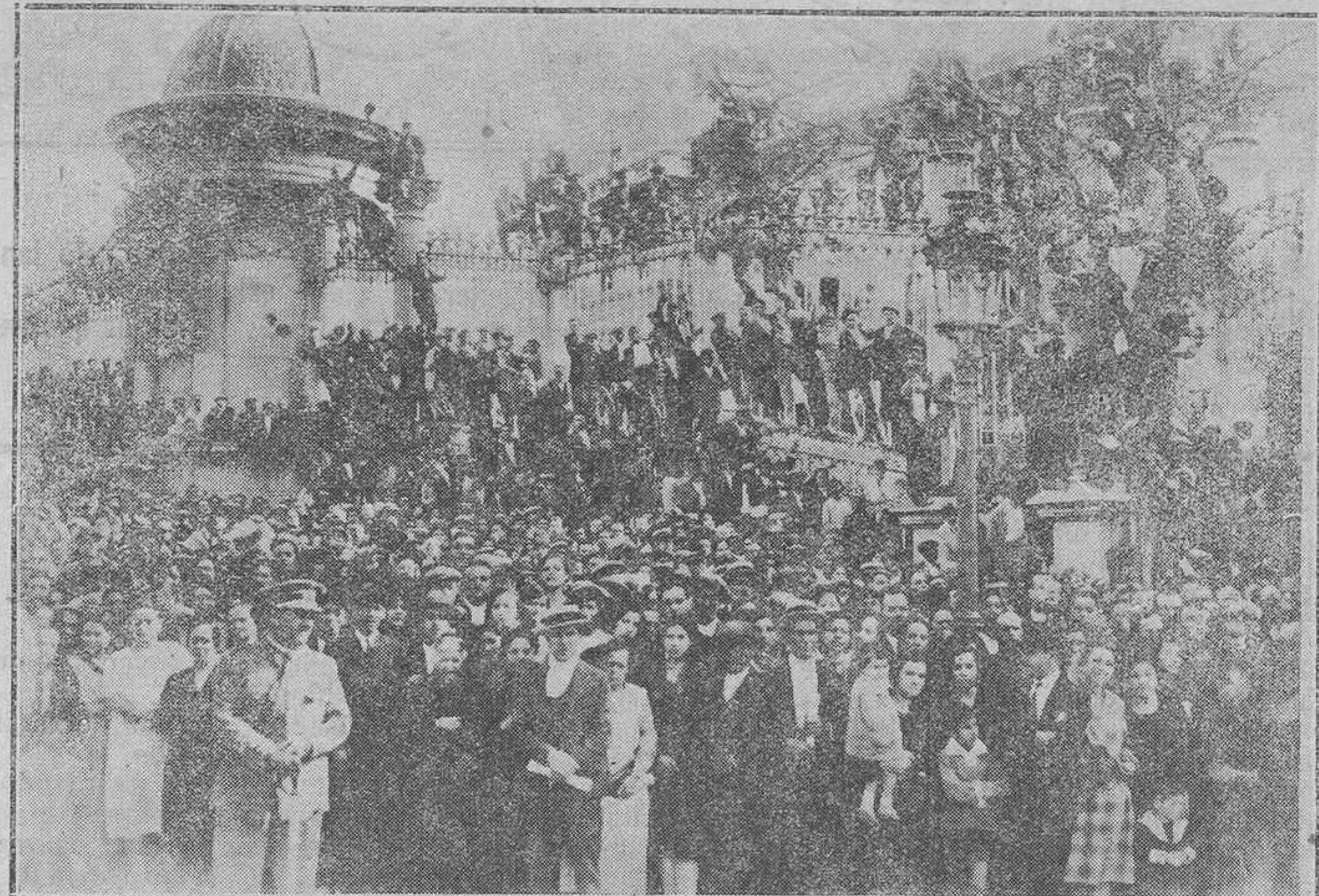
MADRID.—El entierro de las víctimas del Teatro de Novedades.—Un aspecto de la imponente multitud que ha asistido al entierro.

A la conducción del cadáver que tuvo lugar en la tarde de ayer asistió enorme concurrencia en imponente manifestación de duelo.