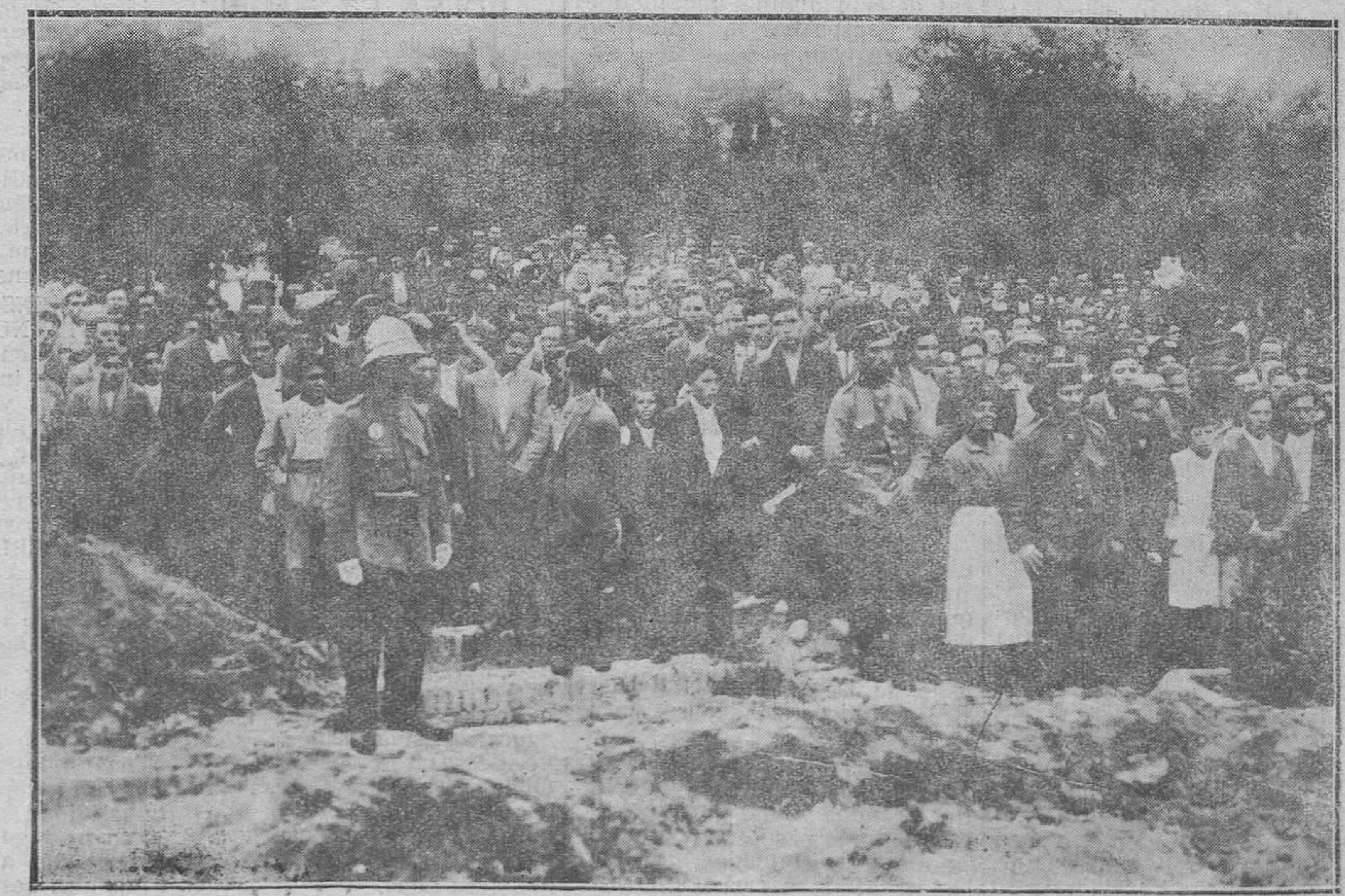
MADRID.-Et entierro de las víctimas del incendio del teatro Novedades.-El público ante la fosa en que han sido enterrados los muertos