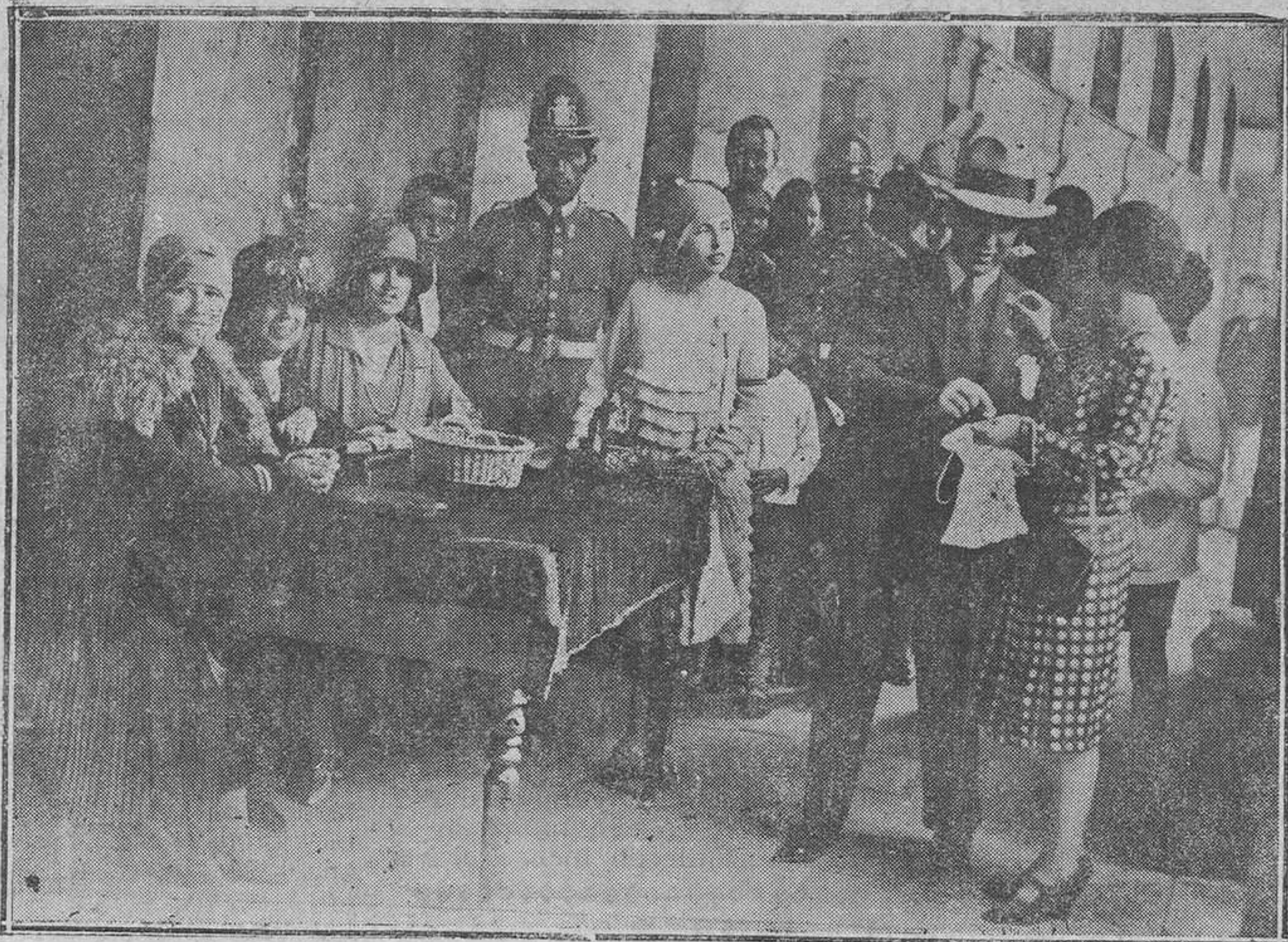
OVIEDO.—De la Fiesta de la Flor. La mesa que fué instalada en la Plaza del Ayuntamiento.

También pasó a disposición del señor Comisario por declararse insolvente, una mujer detenida en la noche de ayer.