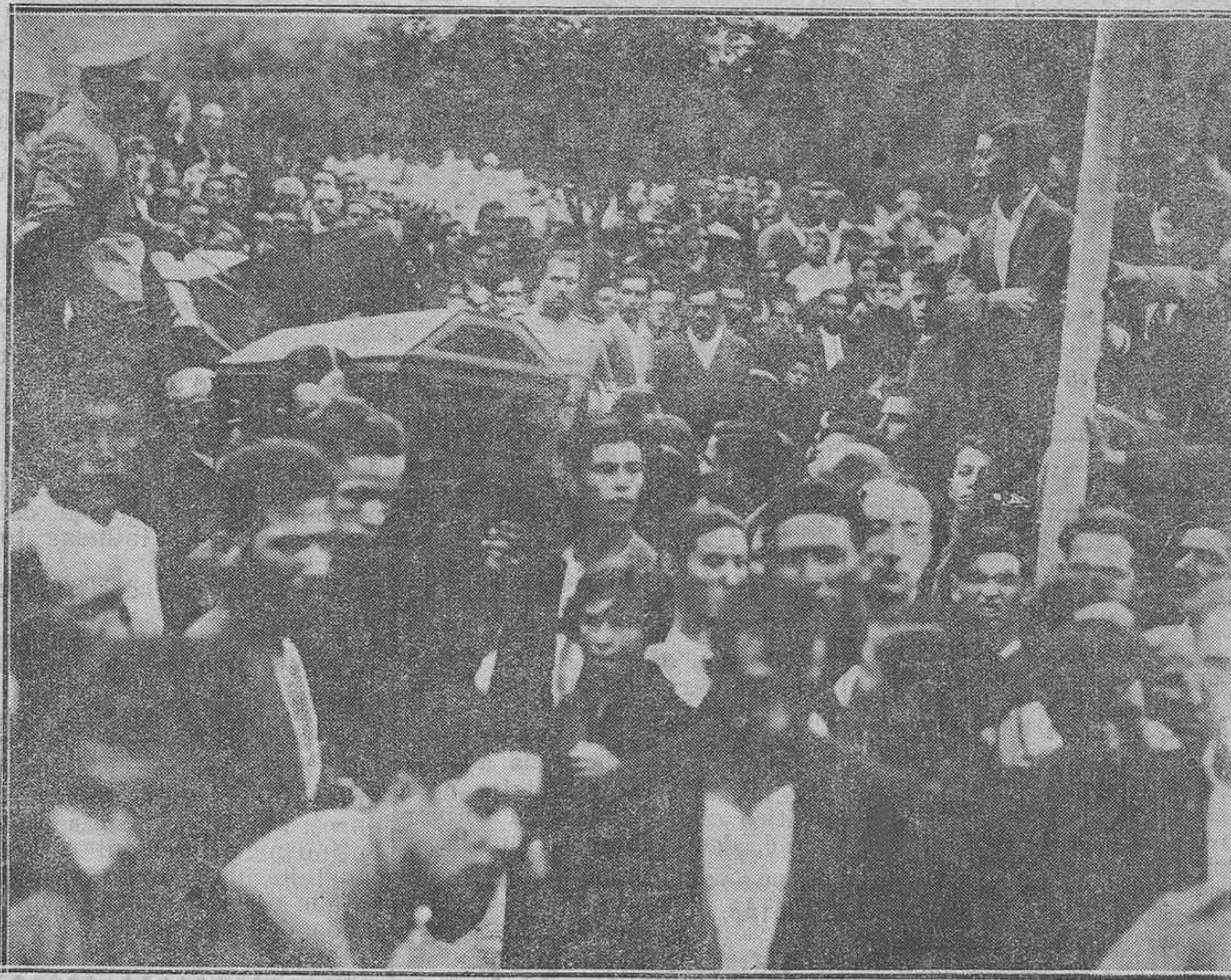
MADRID.—El entierro de las víctimas del Teatro de Novedades.—Llegada al cementerio del Este.

Pero no importa, qué diablo...! En cambio engordarán los contratistas a costa del sudor, de la miseria, del hambre de los gallegos...!