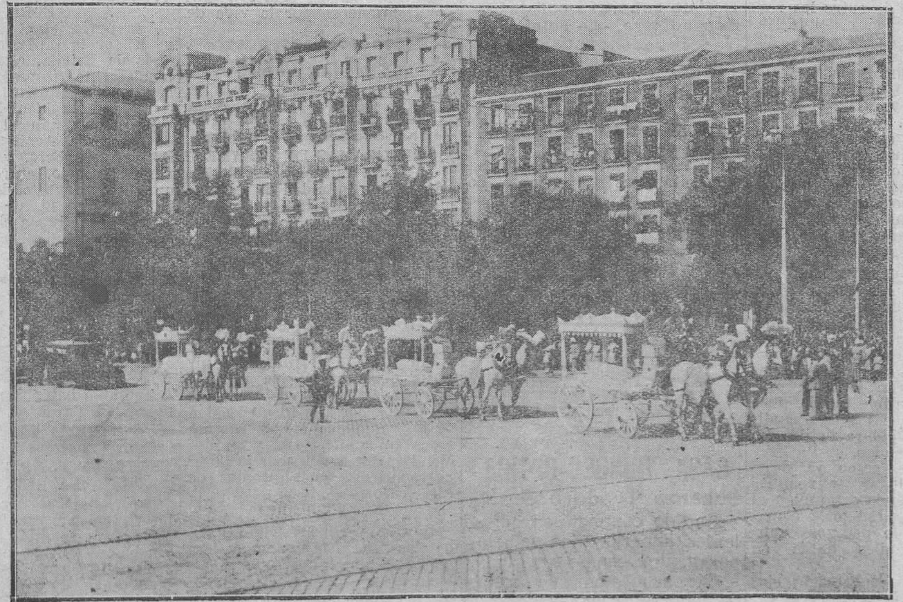
MADRID.-El entierro de las víctimas del incendio del teatro Novedades.-Las carrozas mortuorias conducían los cadáveres

—Que se envíe la caja a la Jefatura de Policía! La caja contenía unos caramelos deliciosos, que envía un correligionario de Fallieres a su presidente.