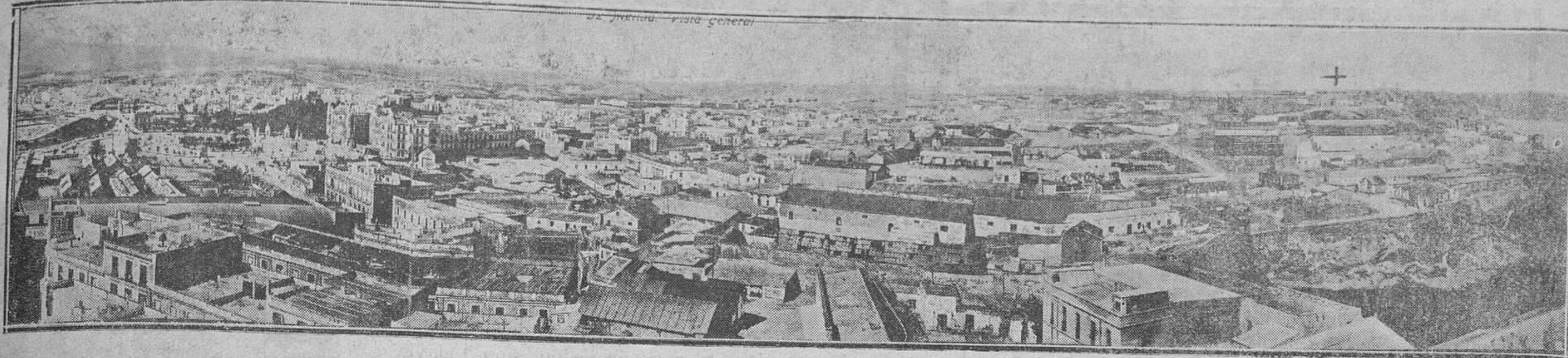
VISTA GENERAL DE MELILLA CON EL FORTIN DE CABRERIZA S BAJAS (X) DONDE SE PRODUJO LA TERRIBLE EXPLOSION QUE DE NUEVO TRAE EL LUTO A ESPAÑA

Anteayer aún se unía nuestro periódico con profundo sentimiento al gran dolor de Madrid en una hora de tragedia. Ahora tiene que unirse al gran dolor de Melilla Y antes y ahora al gran dolor de España.