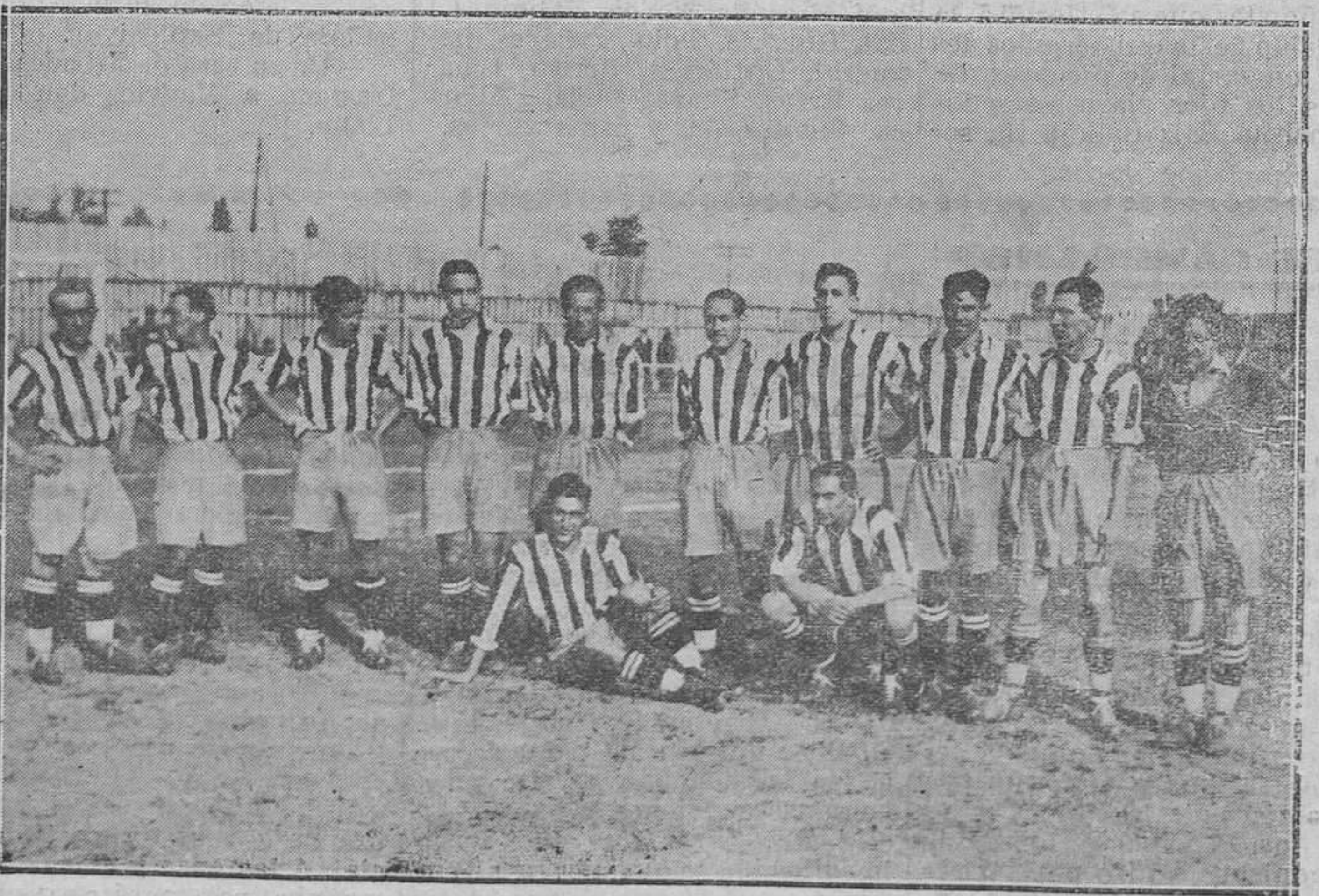
OVIEDO.—El equipo Athletic, de Madrid, tal y como jugó el domingo último.