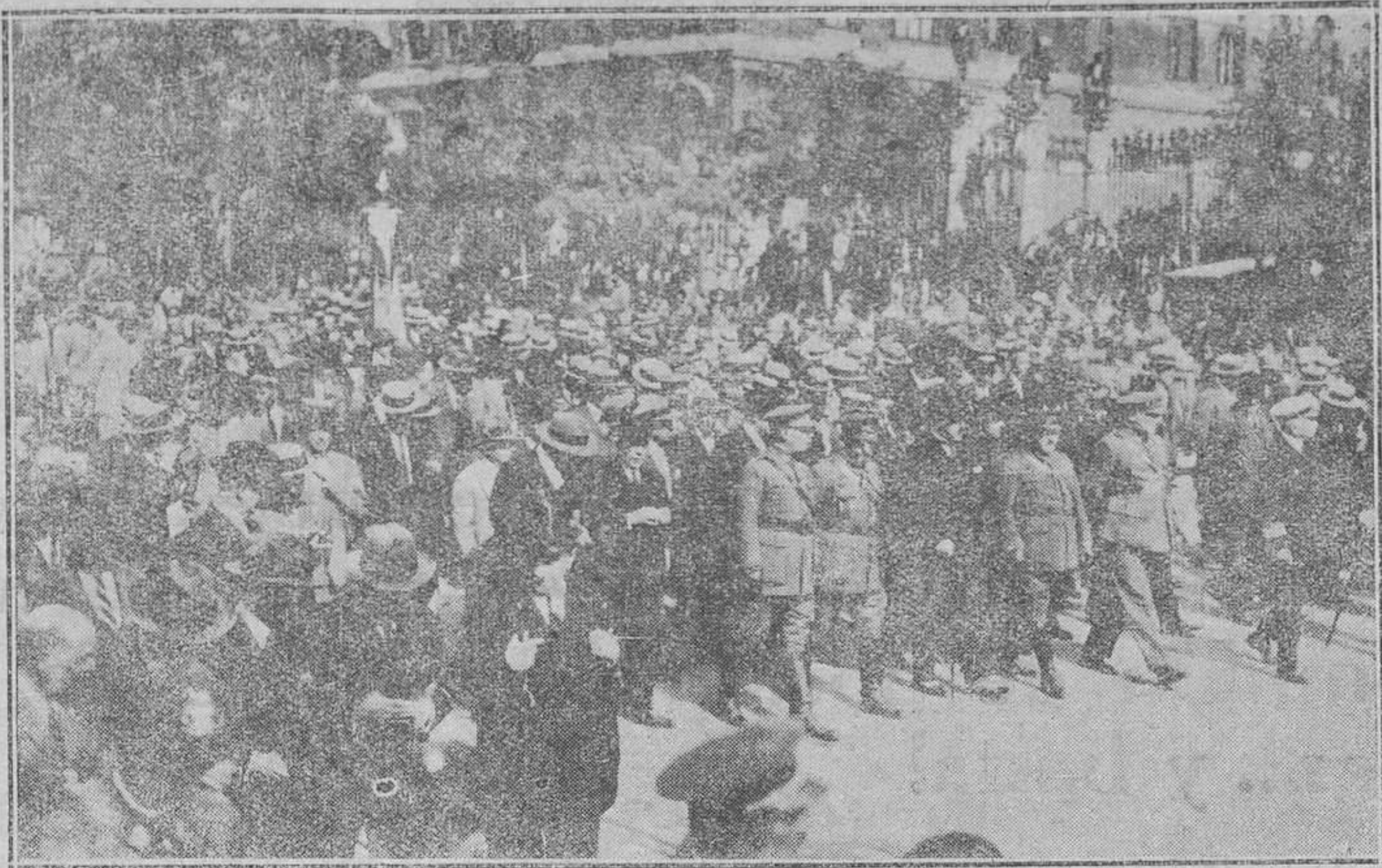
MALRID.—El entierro de las víctimas del Teatro de Novedades.—El general Frimo de Rivera, con el Gobierno, preside el duelo.