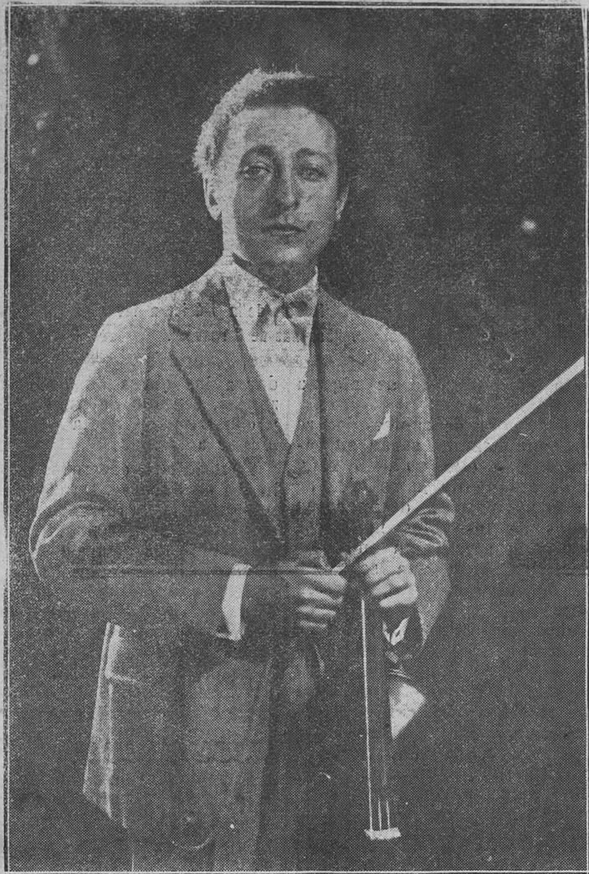
El famoso concertista de violín Jascha Heifetz, que ha dado una serie de conciertos en el teatro de la comedia y que han constituido uno de los mayores éxitos artísticos de la actual temporada.