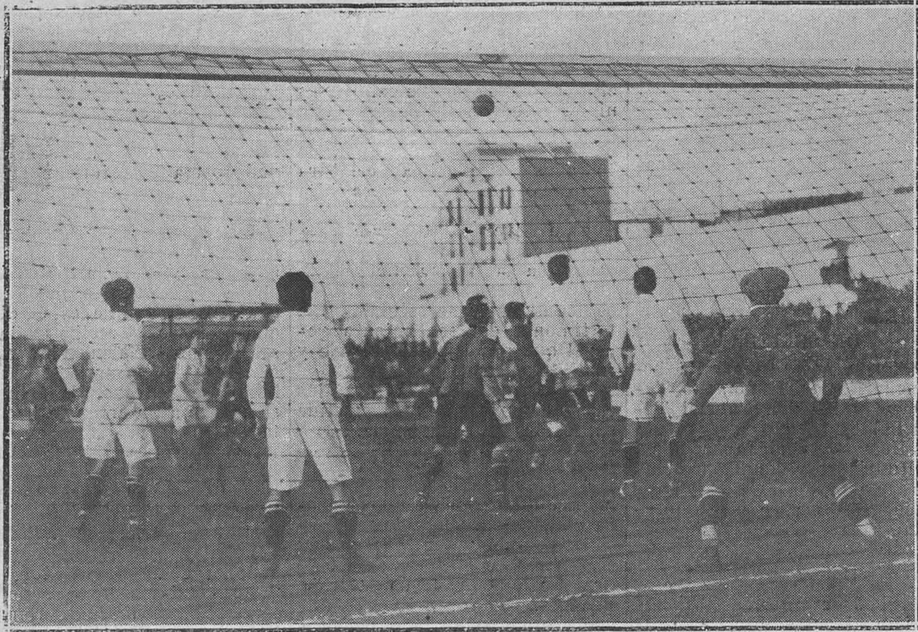
MADR.D.-Del partido de campeonato de primera categoría jugado entre el Real Madrid y el Racing; venció el Madrid por 2-0.