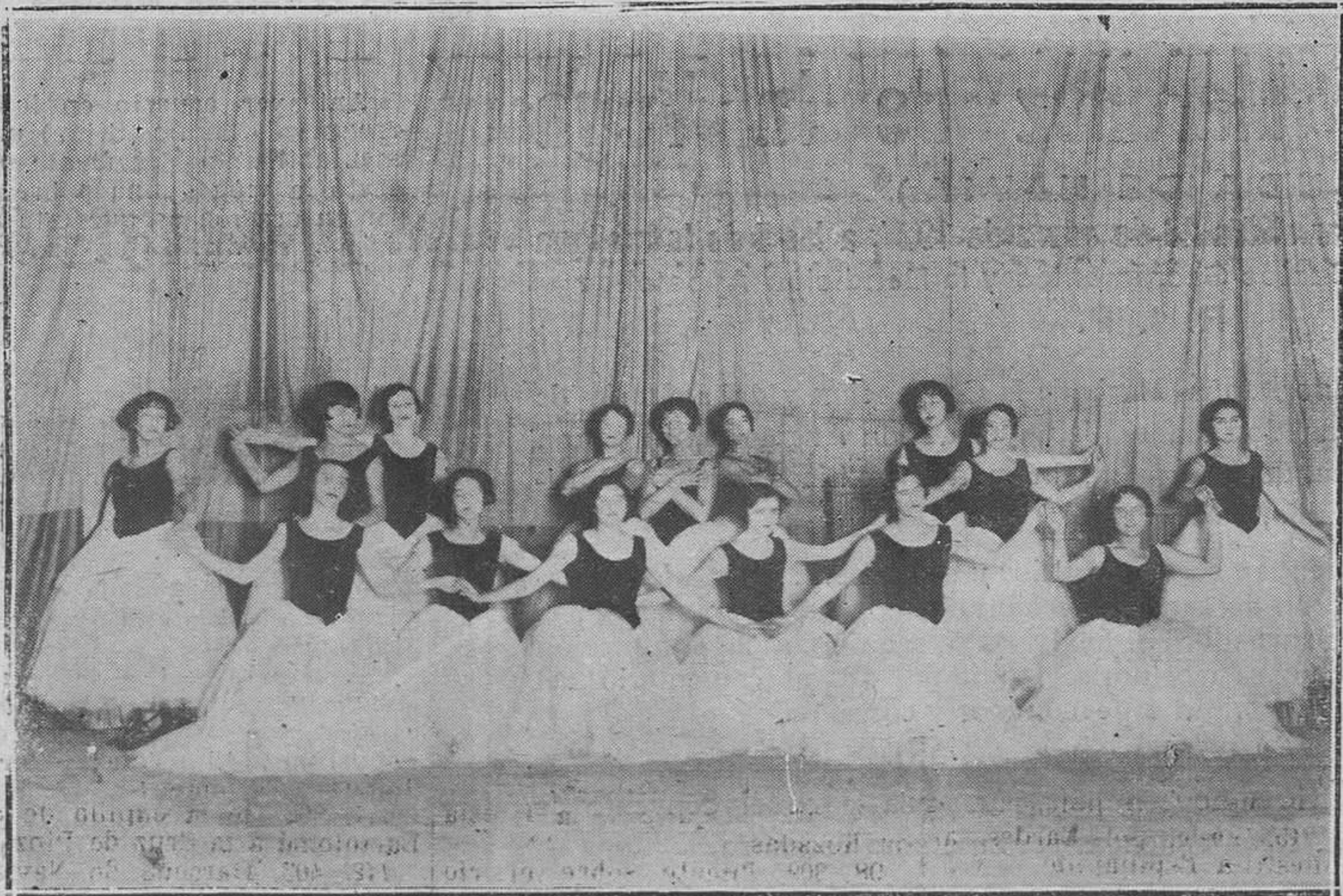
MADRID: "DE LA FIESTA DE ARTE".-Aristocráticas señoritas en el "Balle clásico".