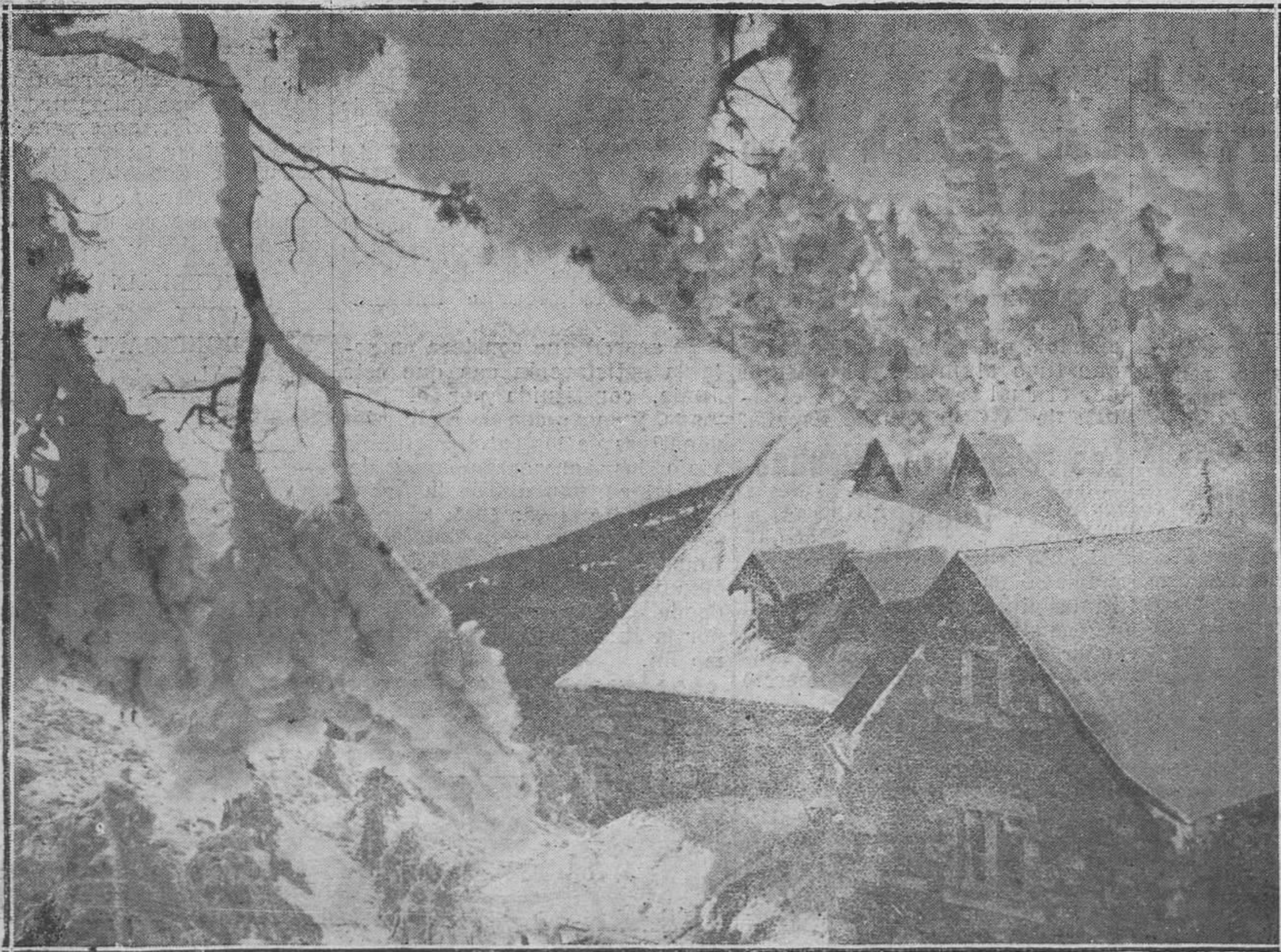
PAISAJES DE NIEVE: EN EL PUERTO DE NAVACERRADA.—El chalet de la Real Sociedad Peñalara.