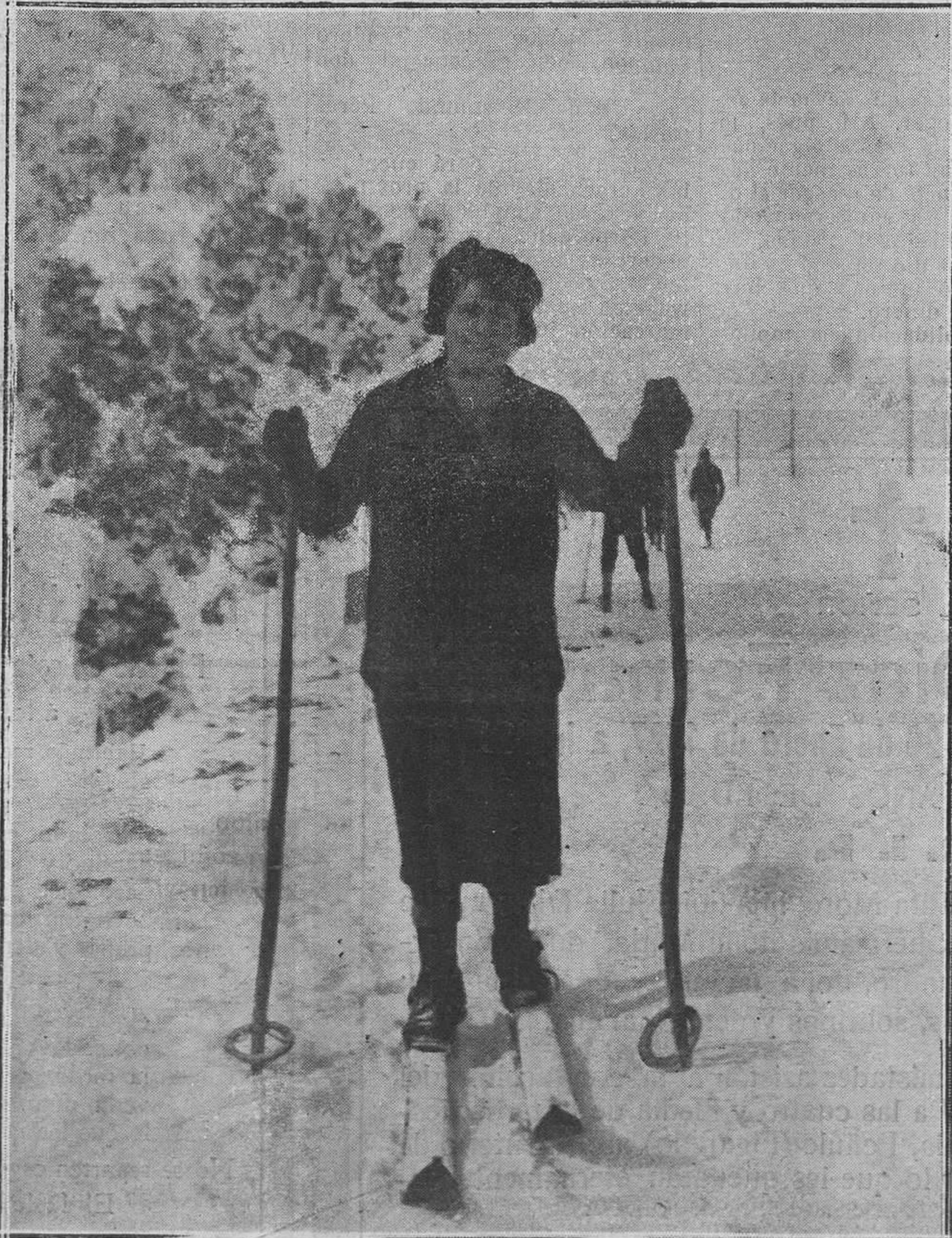
PAISAJES DE NIEVE: EN EL PUERTO DE NAVACERRADA.—Una bella "skieuse".