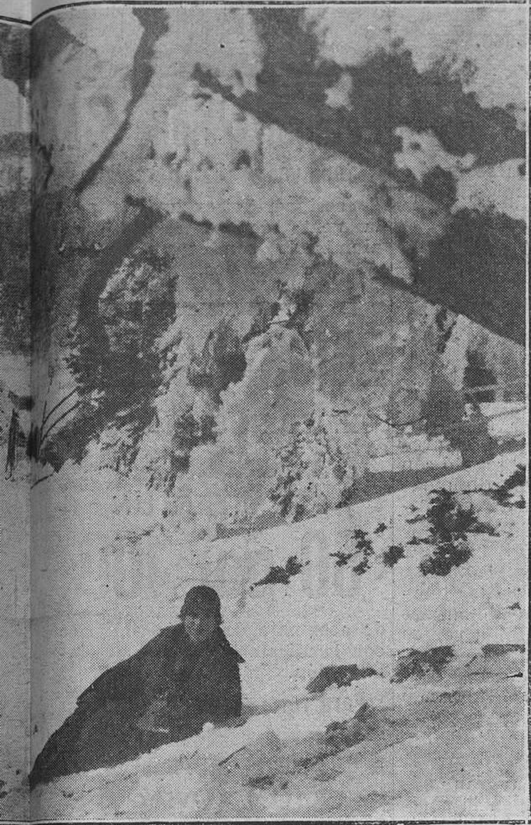
Camino del puerto de Navacerrada.