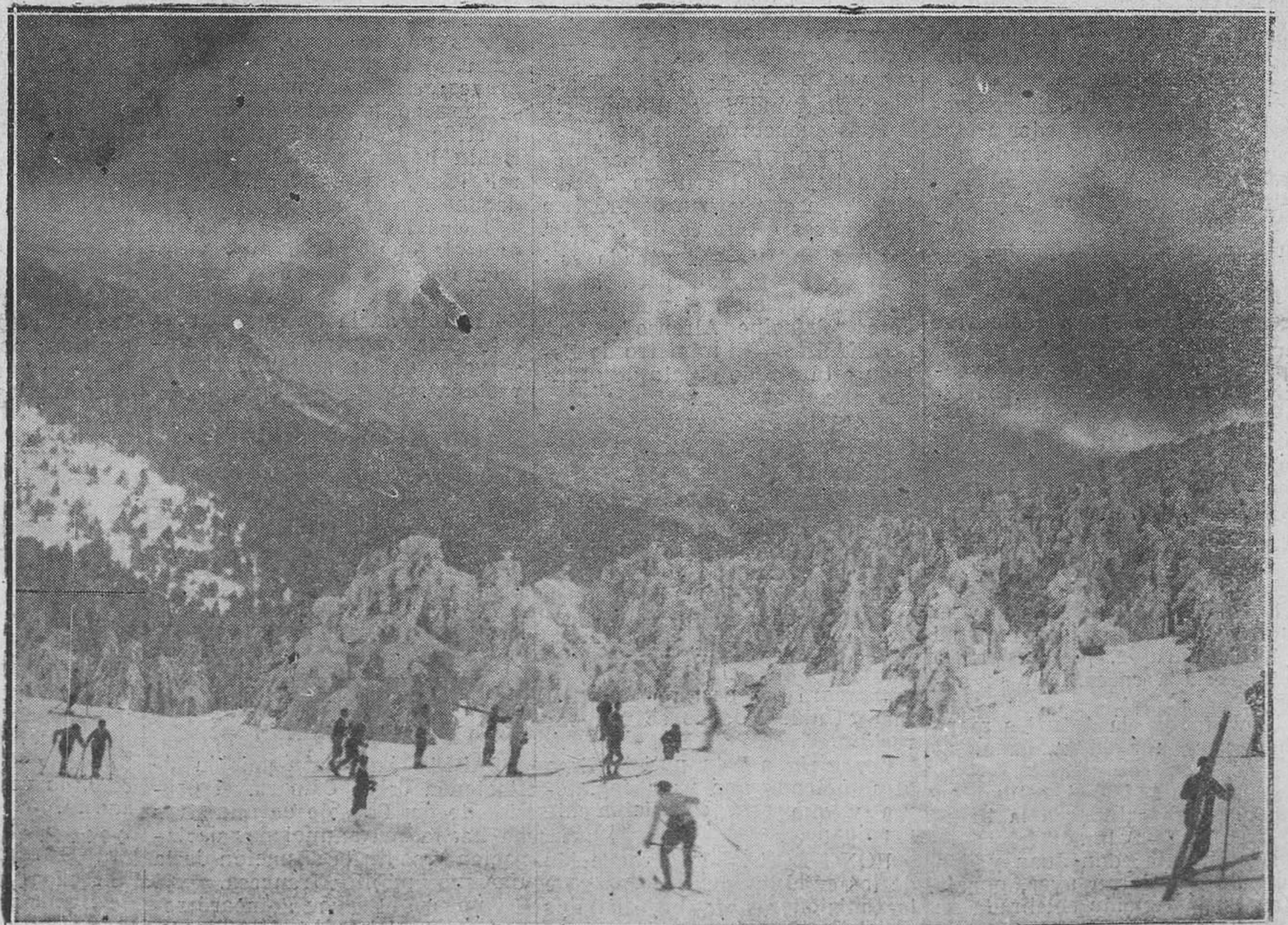
PAISAJES DE N'VE: EN EL PUERTO DE NAVACERRADA.-Aspecto de una pista de patinaje.