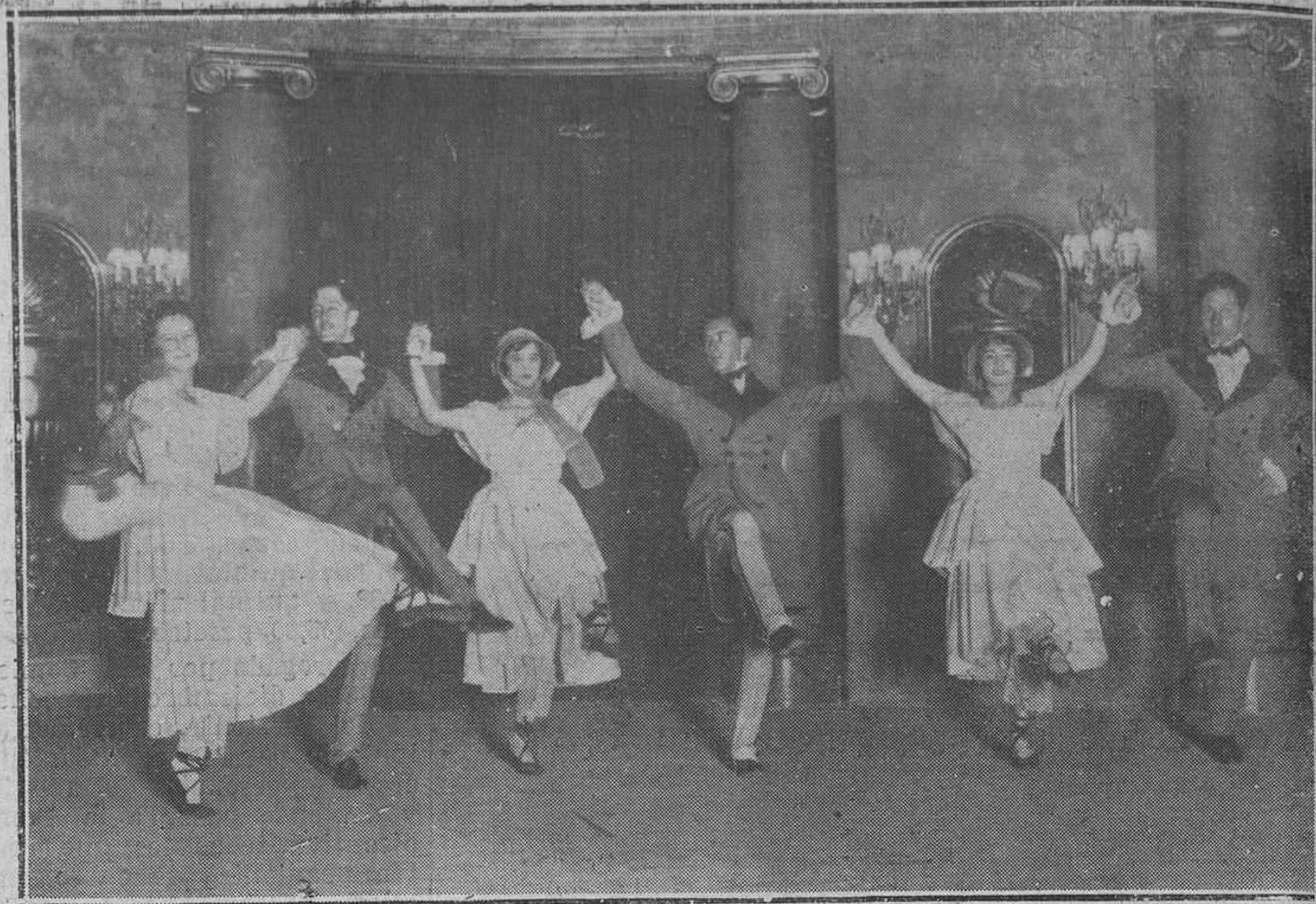
MADRID.-De la "Fiesta de Arte" organizada por la Cruz Roja y celebrada en el Palacio de la Música a favor del Aguinaldo del Soldado.-Señoritas y jóvenes de la alta aristocracia en "Escenas de Carnaval".

Días 5 y 7, todas las nóminas sin distinción y retenciones.