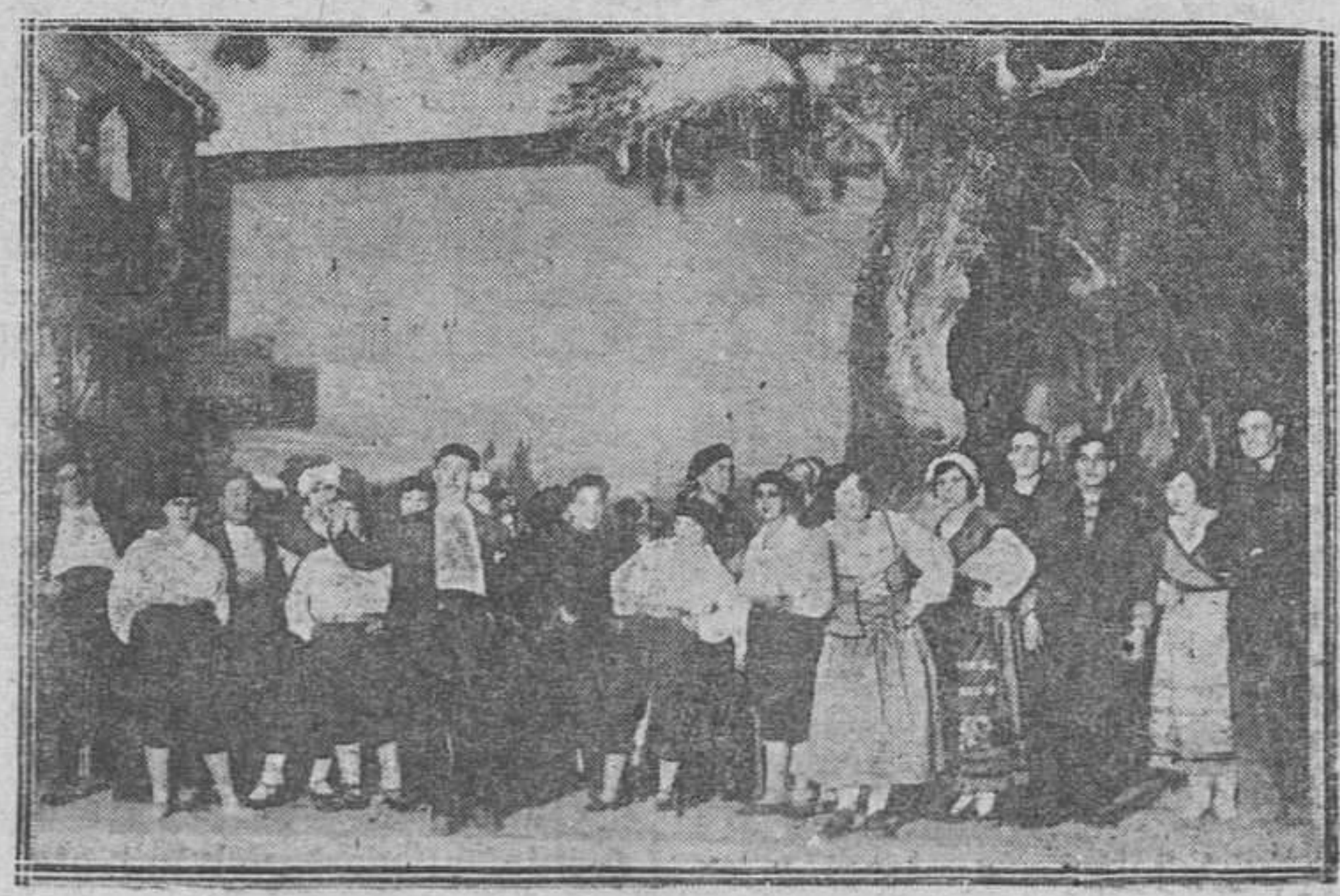
Una escena de la zarzuela LA PROMESA, original de Fernando Dicenta y Alfredo Escosura, música del maestro Torner