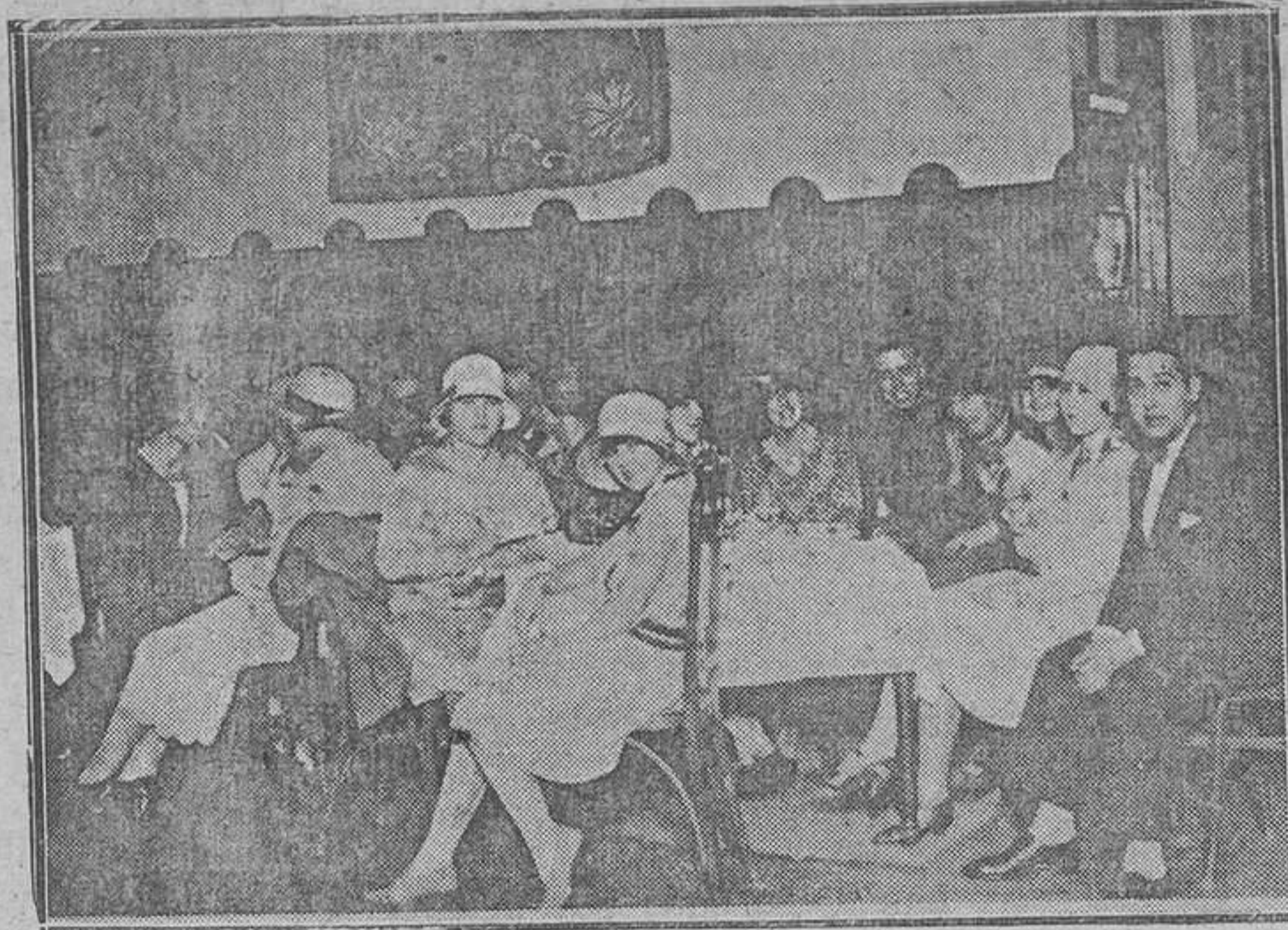
OVIEDO.—Un grupo de asistentes al the celebrado el jueves último, por los alumnos de de Artillería en obsequio a las seficitas ovetenses

des, o de la metapsíquica, como quieren hoy otros.