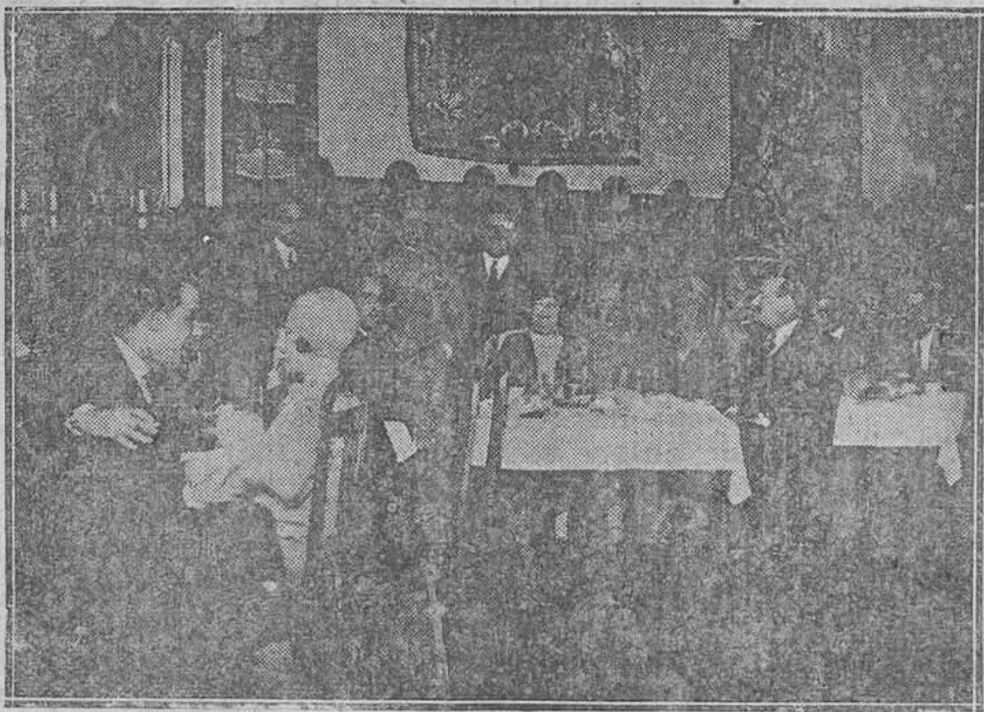
OVIEDO.—Concurrentes al the celebrado el jueves último por los alumnos de la Escuela de Artillería en honor de las señoritas de Oviedo (Mena)

De ocho de la mañana a una de la tarde y de tres a ocho.