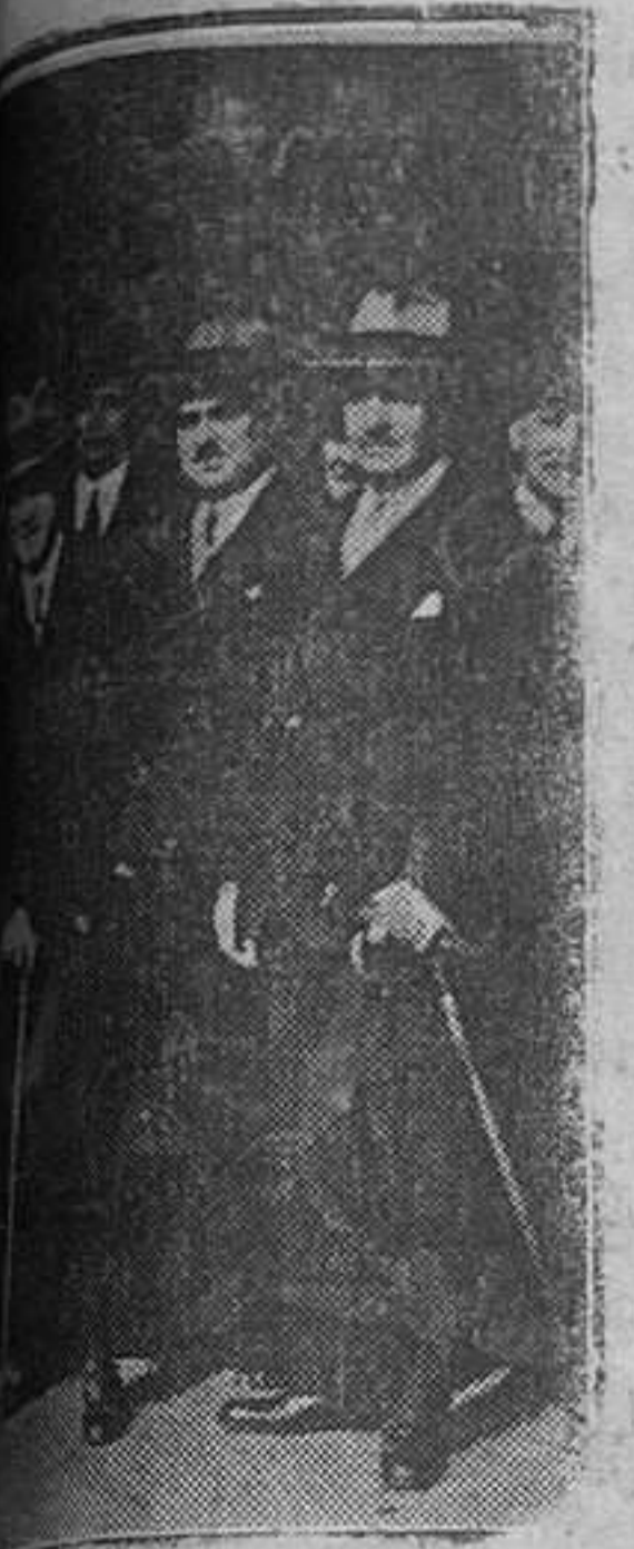
Barcelona hel Ministro de Trabajo, señor Aunós.