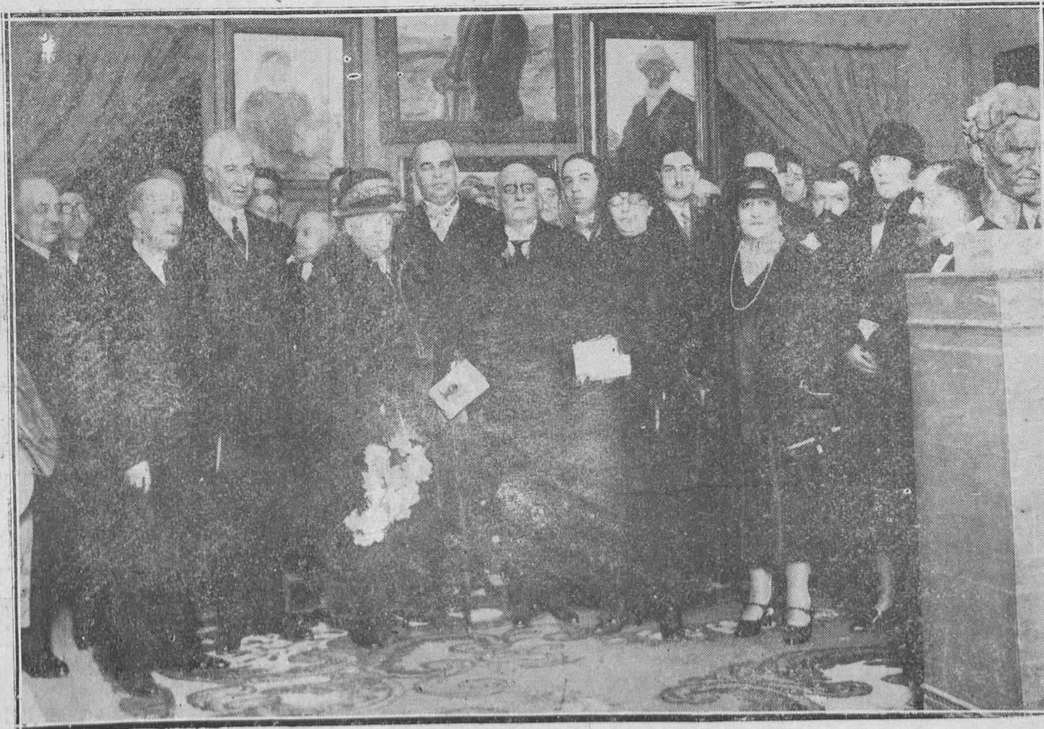
S. A. R. la Infanta doña Isabel, con el ministro de Instrucción Pública, embajadores de la Argentina y distinguidos concurrentes a la inauguración de la Exposición de Arte argentino.