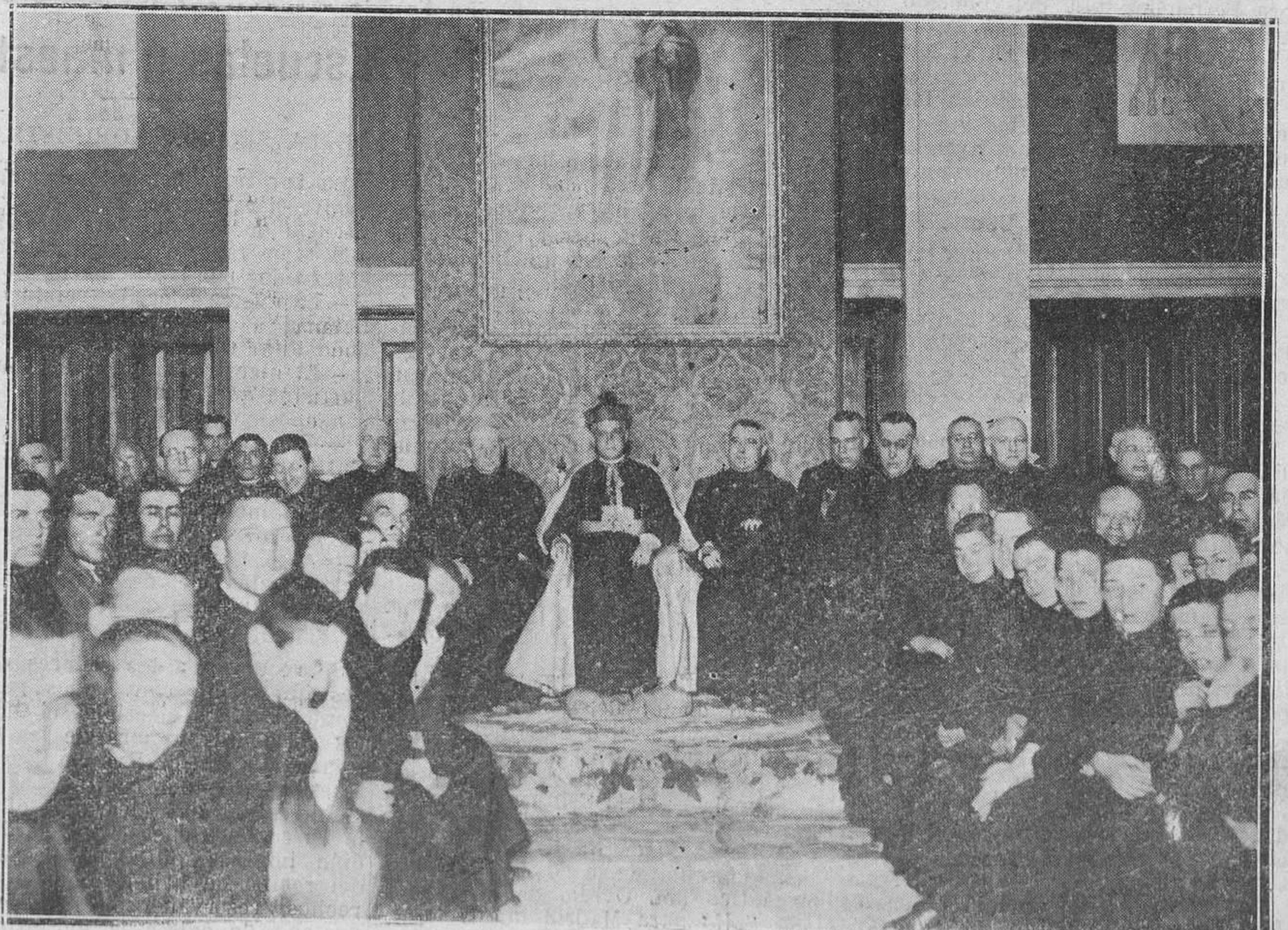
EN EL SEMINARIO CONCILIAR.--El Obispo de Madrid, don Or Eijó, en la fiesta celebrada con motivo de sus bodas de plata sacerdotales.

(Continúa lo del "raid" en la página 10)