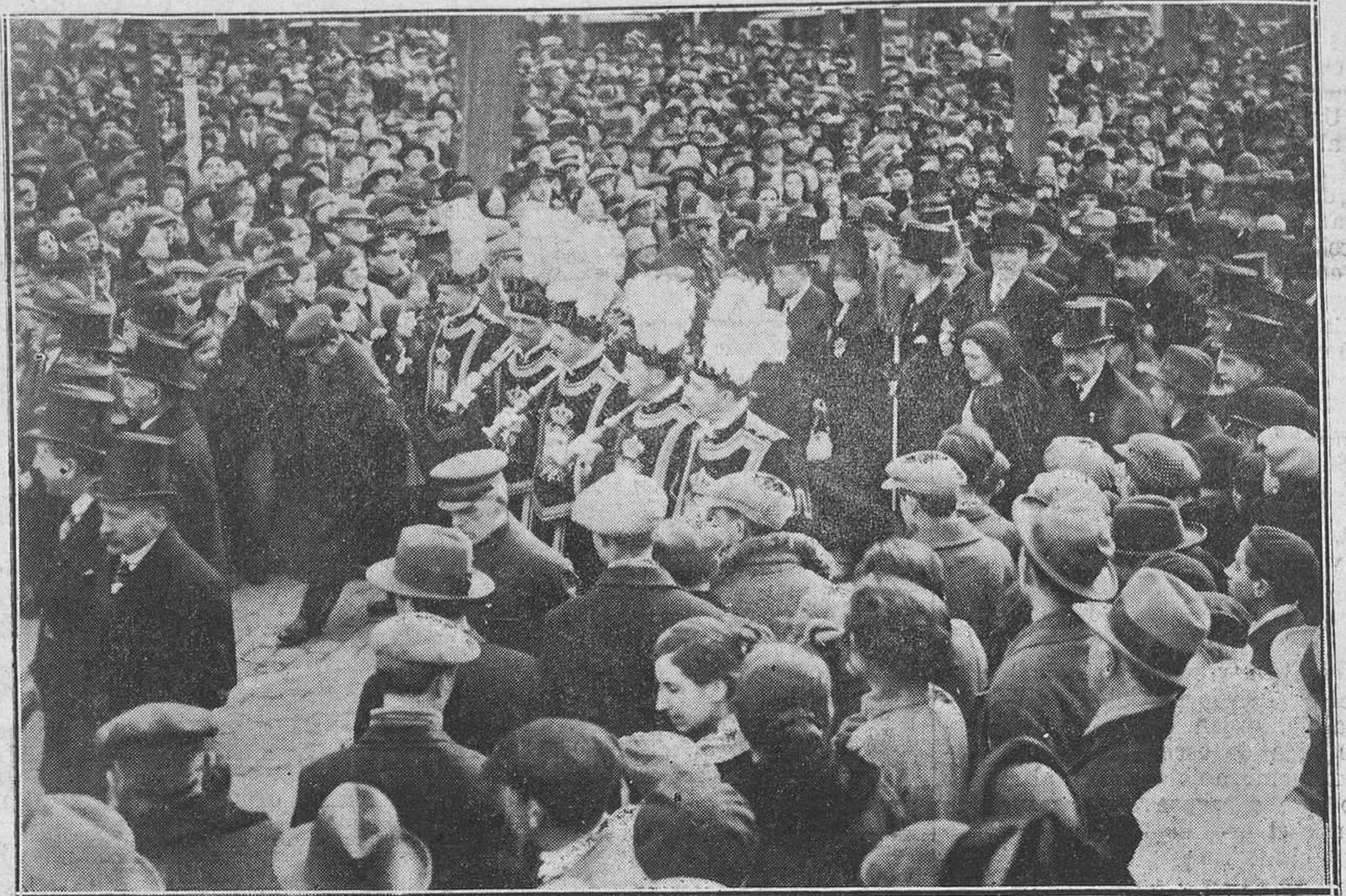
DE LA IMPONENTE MANIFESTACION CELEBRADA CON MOTIVO DE LA FELIZ LLEGADA DE FRANCO Y SUS COMPAÑEROS A BUENOS AIRES.-La presidencia de la manifestación.

A las cuatro y media, siete y diez, "STELA"; magia, ilusionismo, bailes modernos y de fantasía. Además se proyectará una bonita cinta cómica.