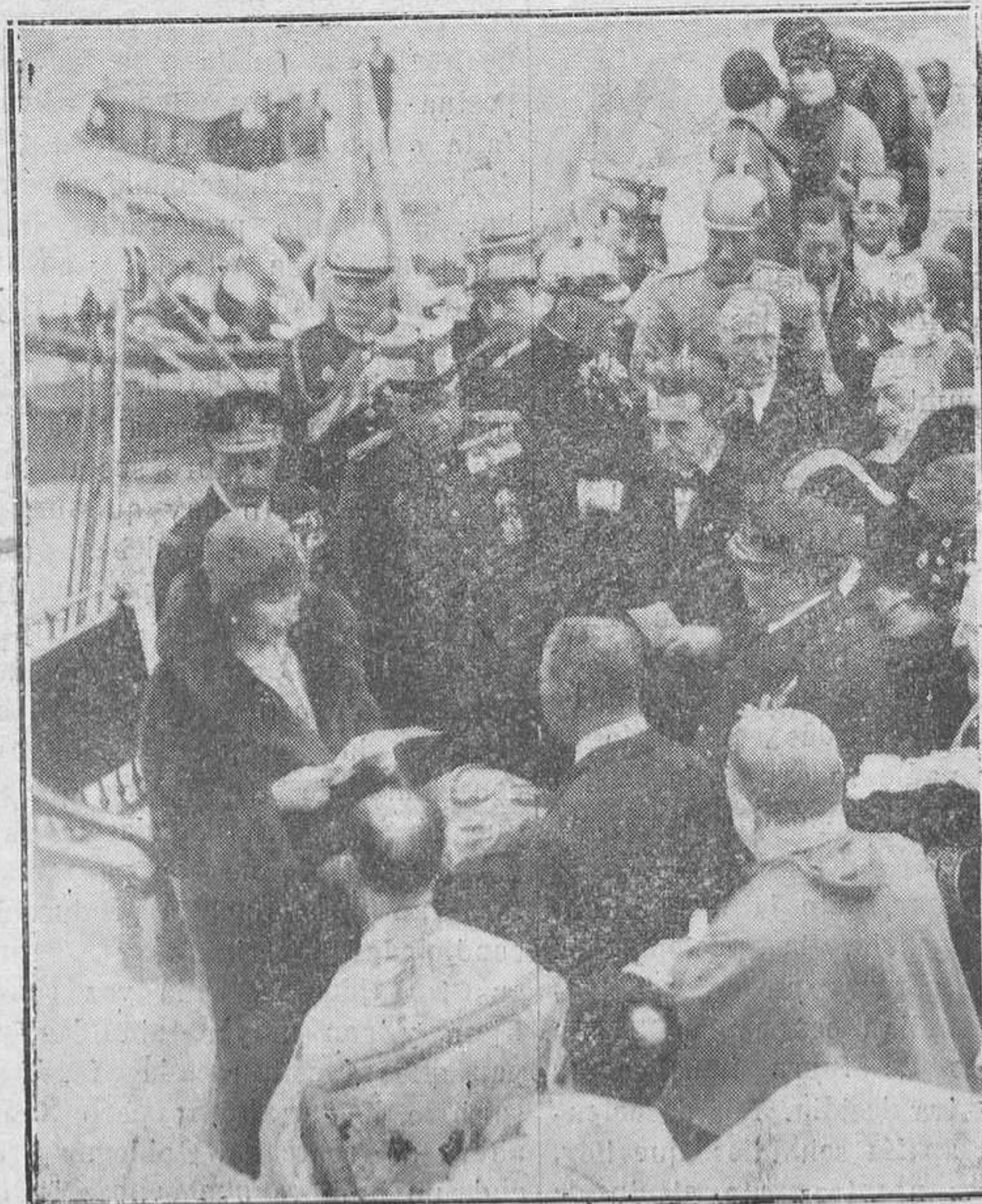
MALAGA: SOLEMNE ENTREGA DE LA BANDERA REGALADA POR LA CIUDAD, AL CAÑONERO "CANOVAS DEL CASTILLO".-S. M. la Reina Victoria leyendo su discurso.

Hace meses y con fruto dichoso, funciona el Consejo de Protección a la Infancia; en Barcelona los niños delincuentes tienen su casa; en Madrid existe un bienaventurado asilo llamado Porta Coeli; no es obra de un