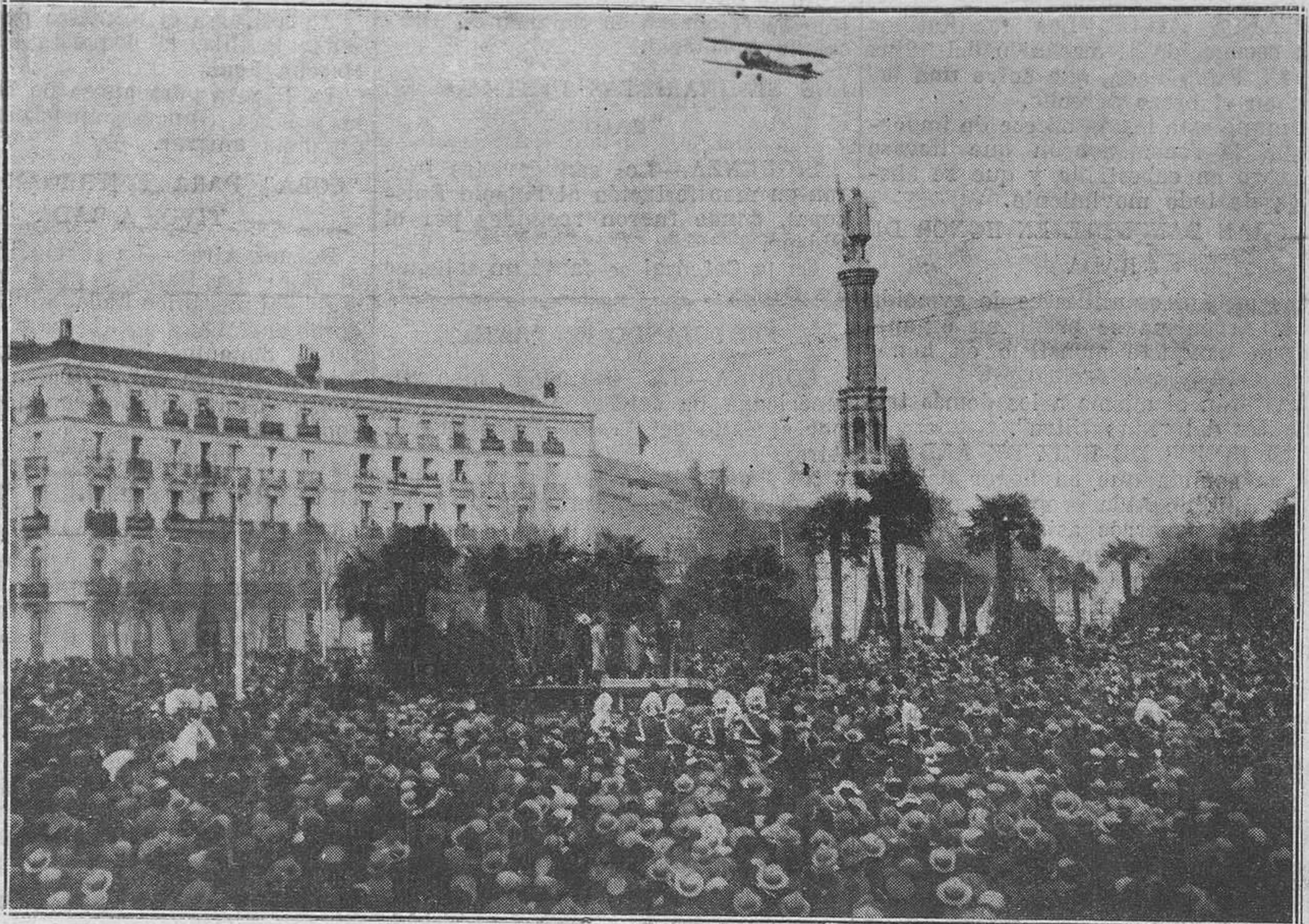
DE LA IMPONENTE MANIFESTACION CELEBRADA CON MOTIVO DE LA FELIZ LLEGADA DE FRANCO Y SUS COMPAÑEROS A BUENOS AIRES. Aspecto de la plaza de Colón, durante la imponente manifestación.

La "Gaceta" ha publicado una Real orden aprobando la agregación