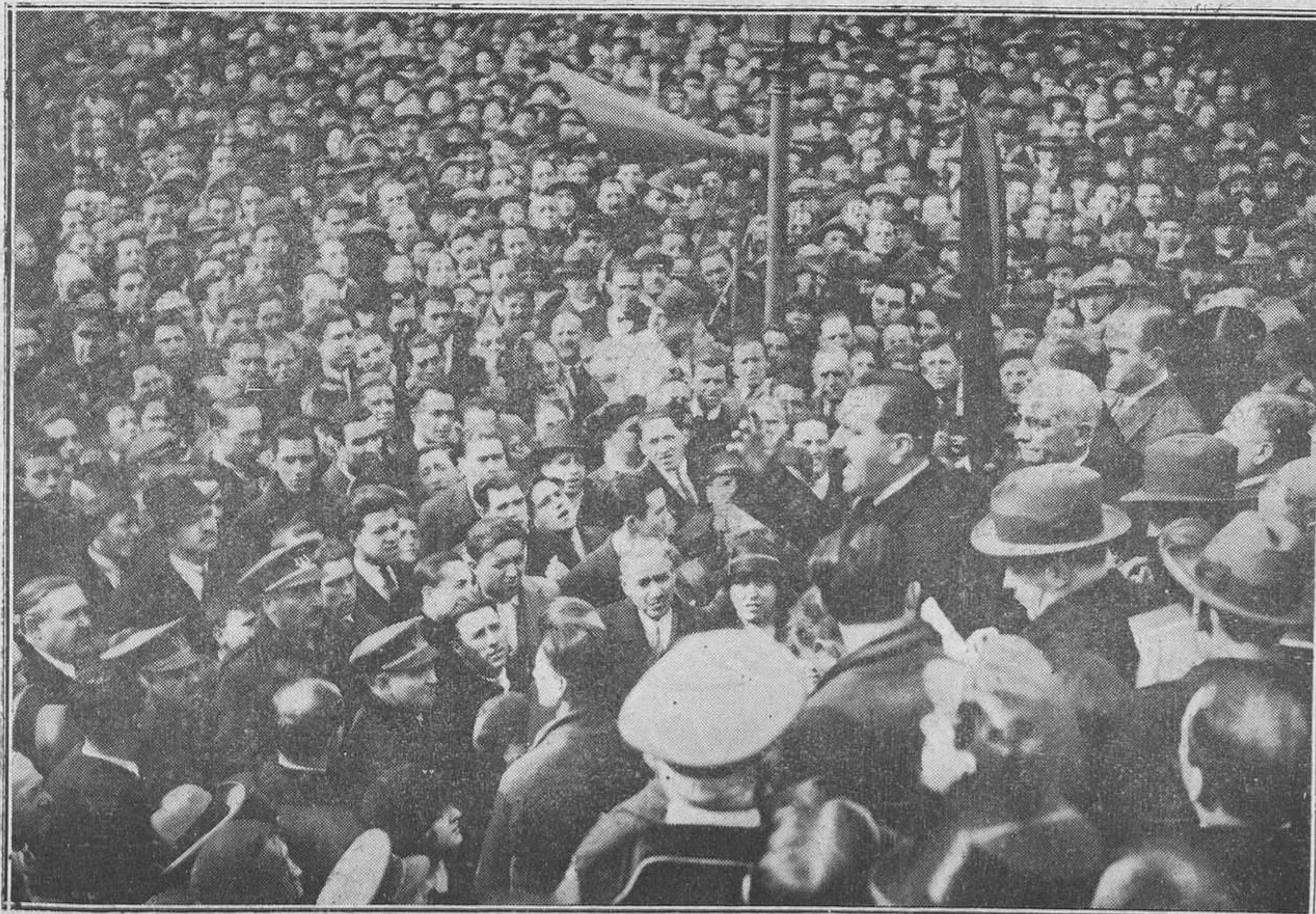
DE LA IMPONENTE MANIFESTACION CELEBRADA CON MOTIVO DE LA FELIZ LLEGADA DE FRANCO Y SUS COMPAÑEROS A BUENOS AIRES. -Discurso del alcalde, señor conde de Vallellano.