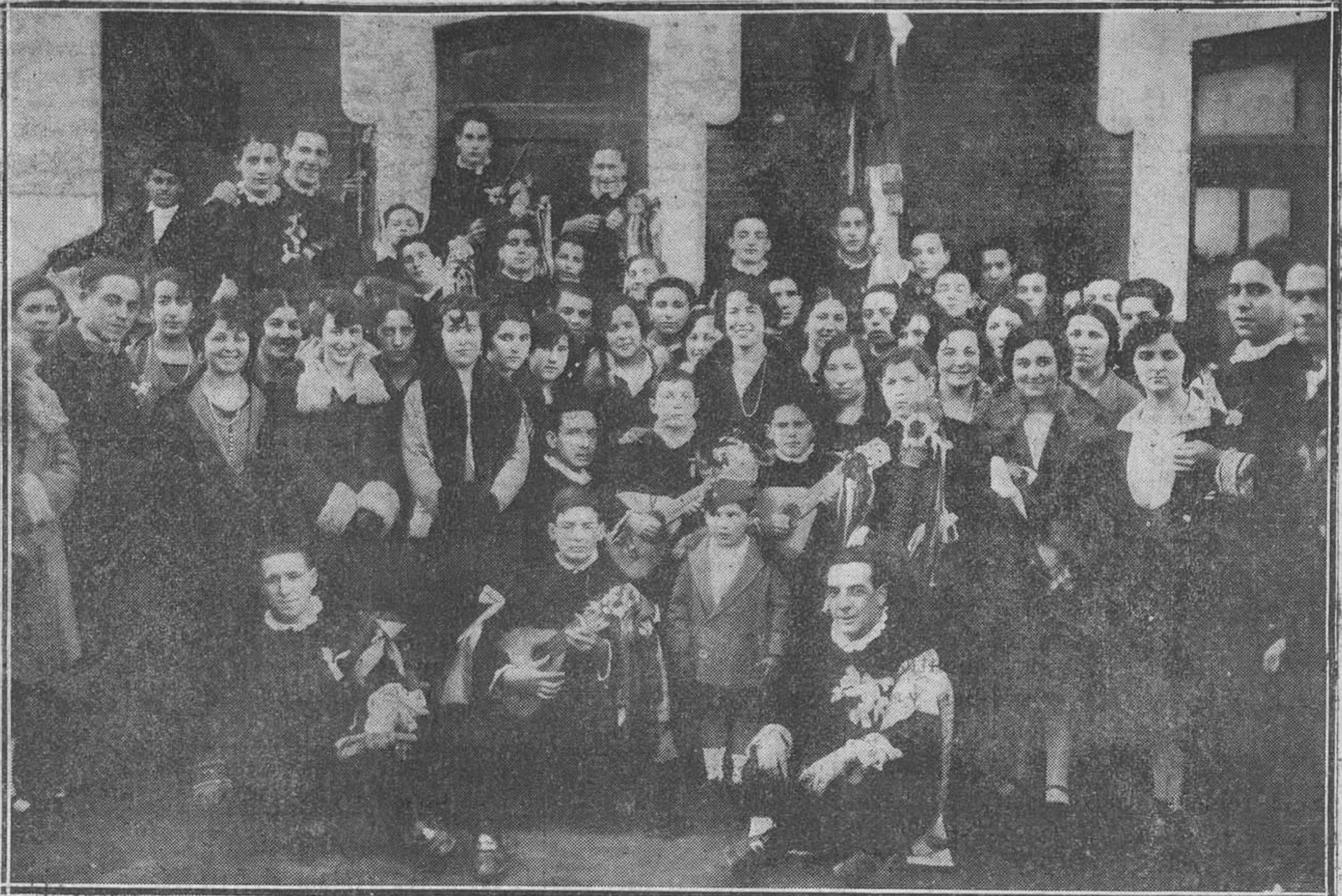
LLANES.—Entre este grupo de bellas llaniscas, los tunos gijoneses, seguramente no piensan en abandonar nuestra villa.

Y aún para que el atractivo sea mayor, tiene acordado conceder valiosos premios a las chicas que vayan ataviadas con disfraces más originales y caprichosos.