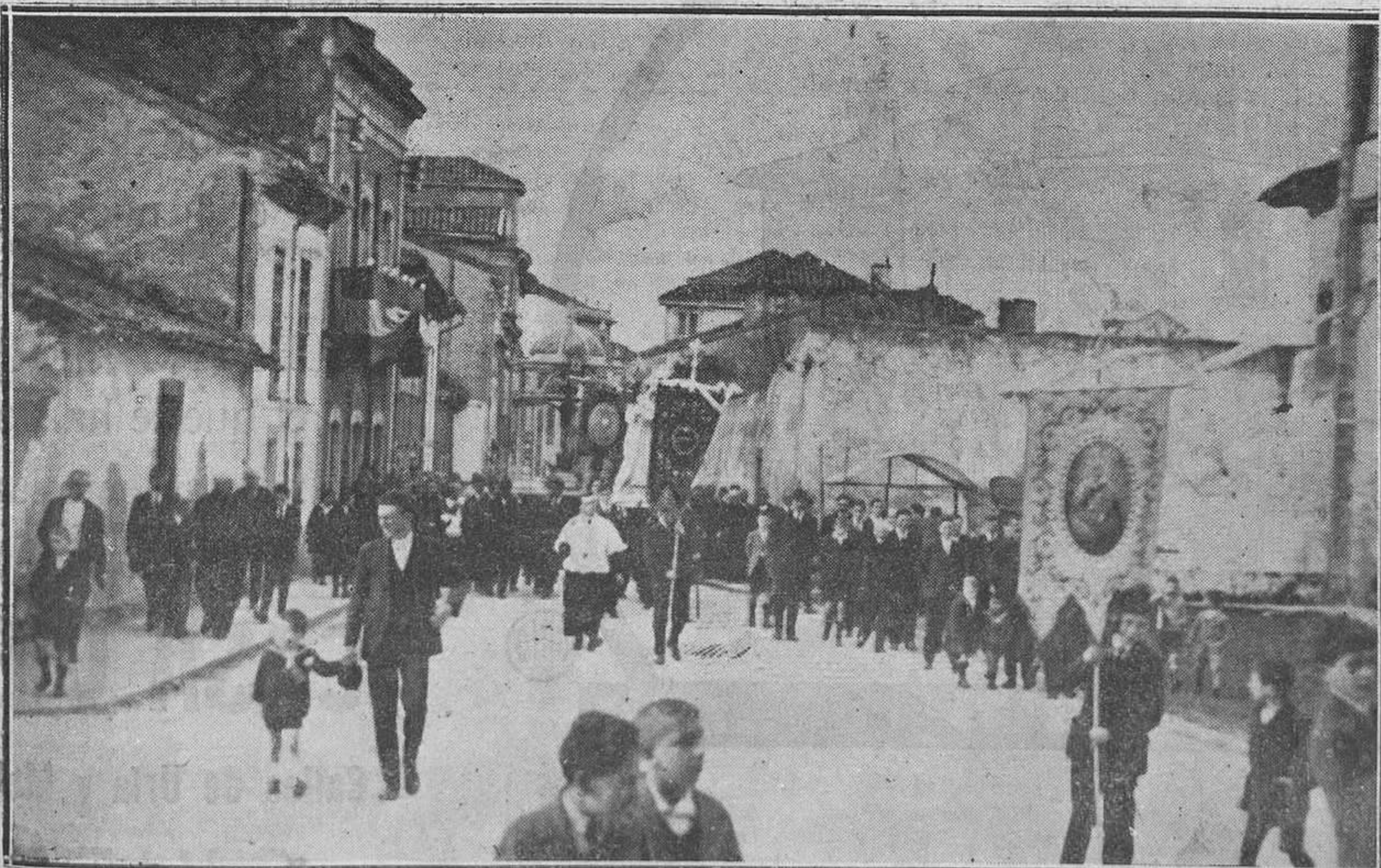
LUANCO.-La última procesión.

Guardia de Cárcel, Príncipe. Campo de Tiro, Príncipe. Guardia de Hospital, Zapadores. Retén de Fábrica, Zapadores.