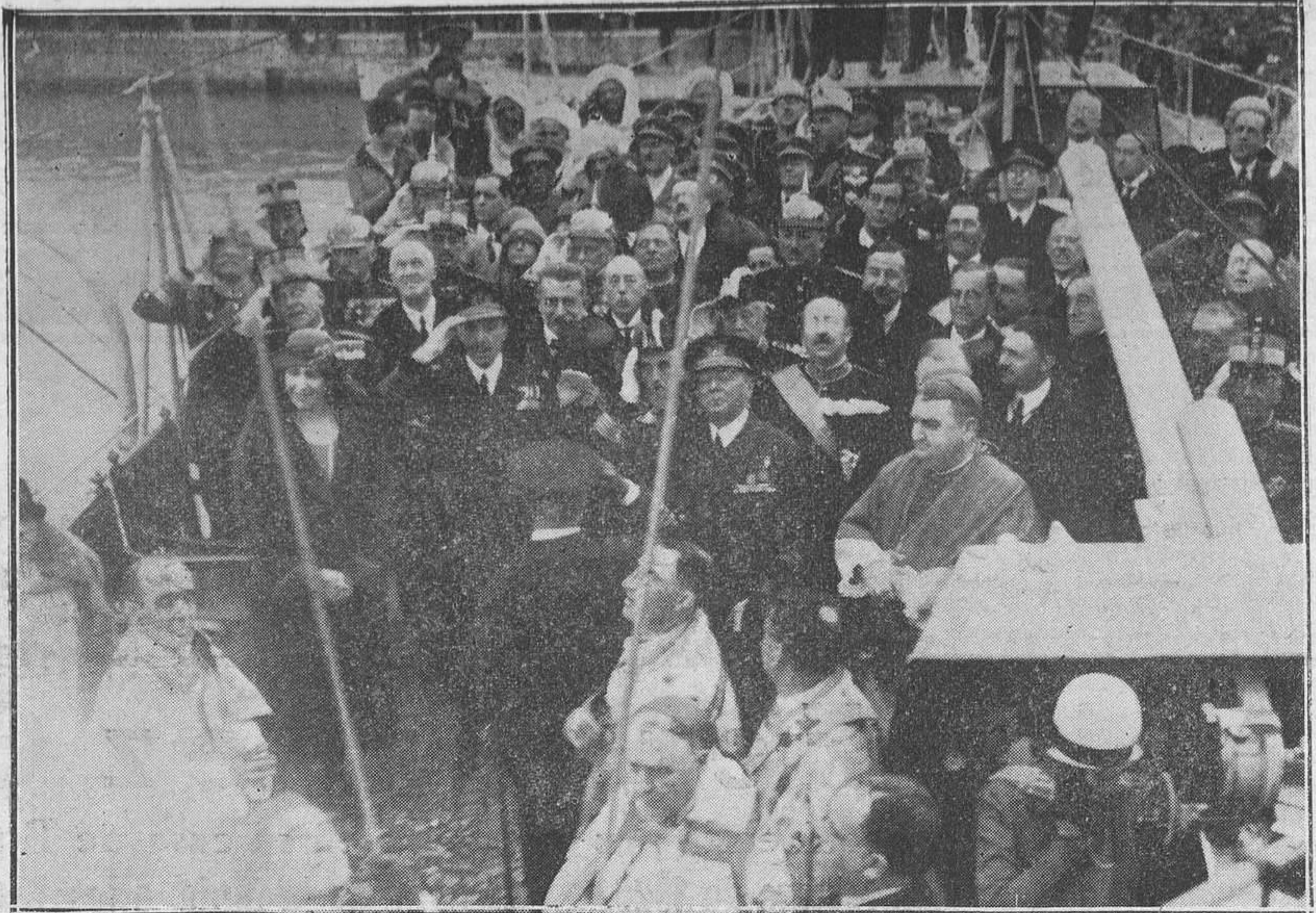
MALAGA. Momento de ser izada la bandera, ante Sus Majes'ades.