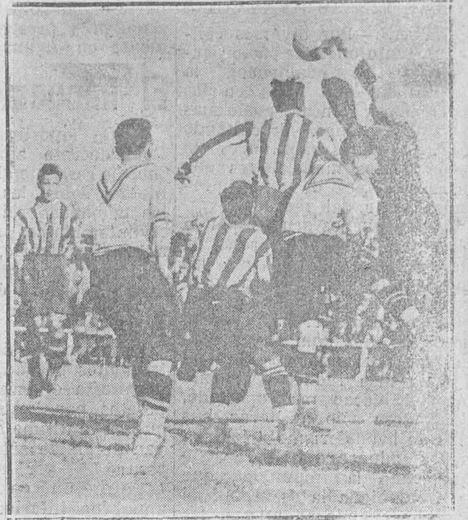
GIJON: SPORTING-UNION.—Una buena intervención del ca- pitán del Unión.