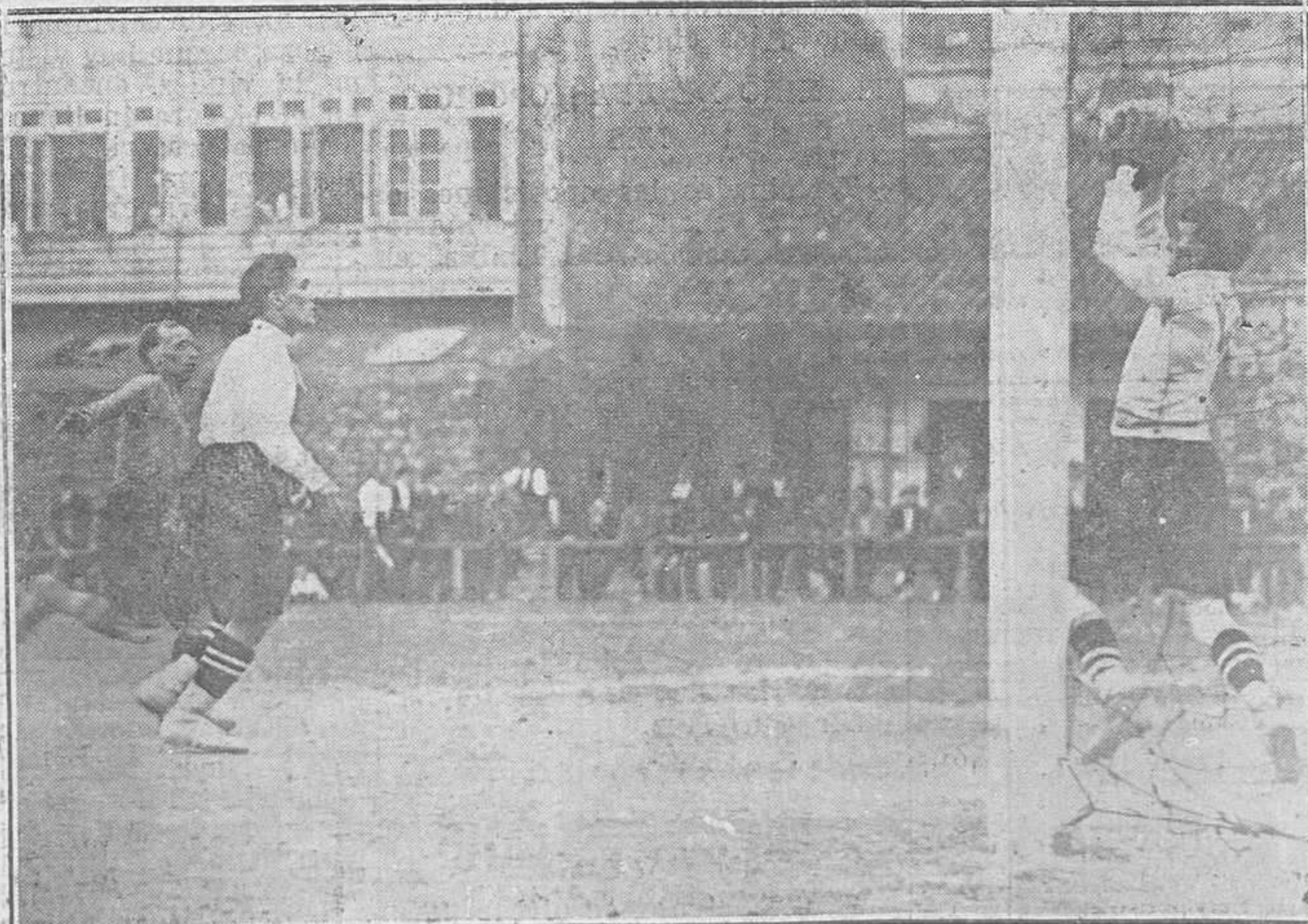
GIJON: FORTUNA-ATHLETIC.—A un fuerte chut, responde el guardameta del Fortuna con una estupenda parada.