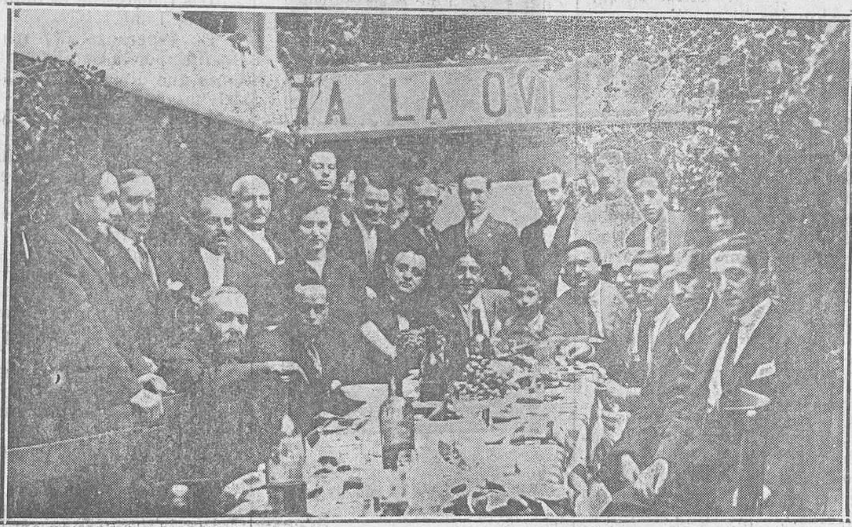
Los de La Cvetense, después del espléndido yantar.