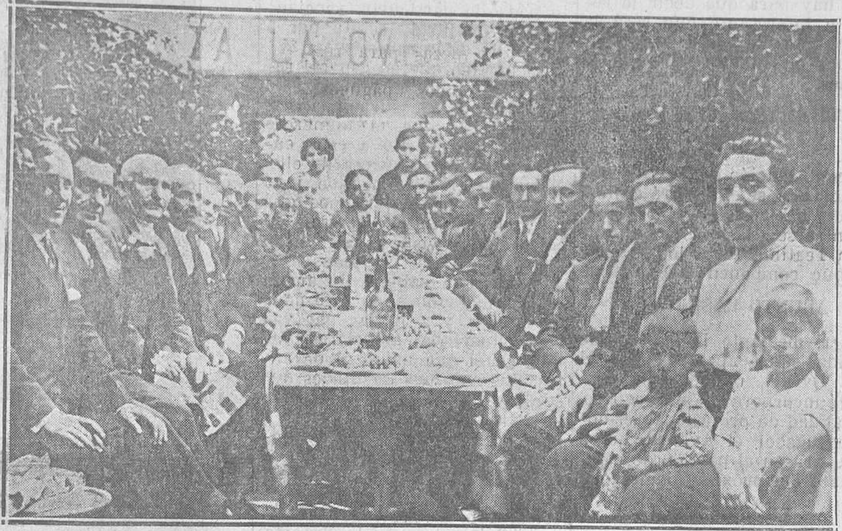
Un aspecto de la gran "fabada" de la Sociedad excursionista La Cvetense