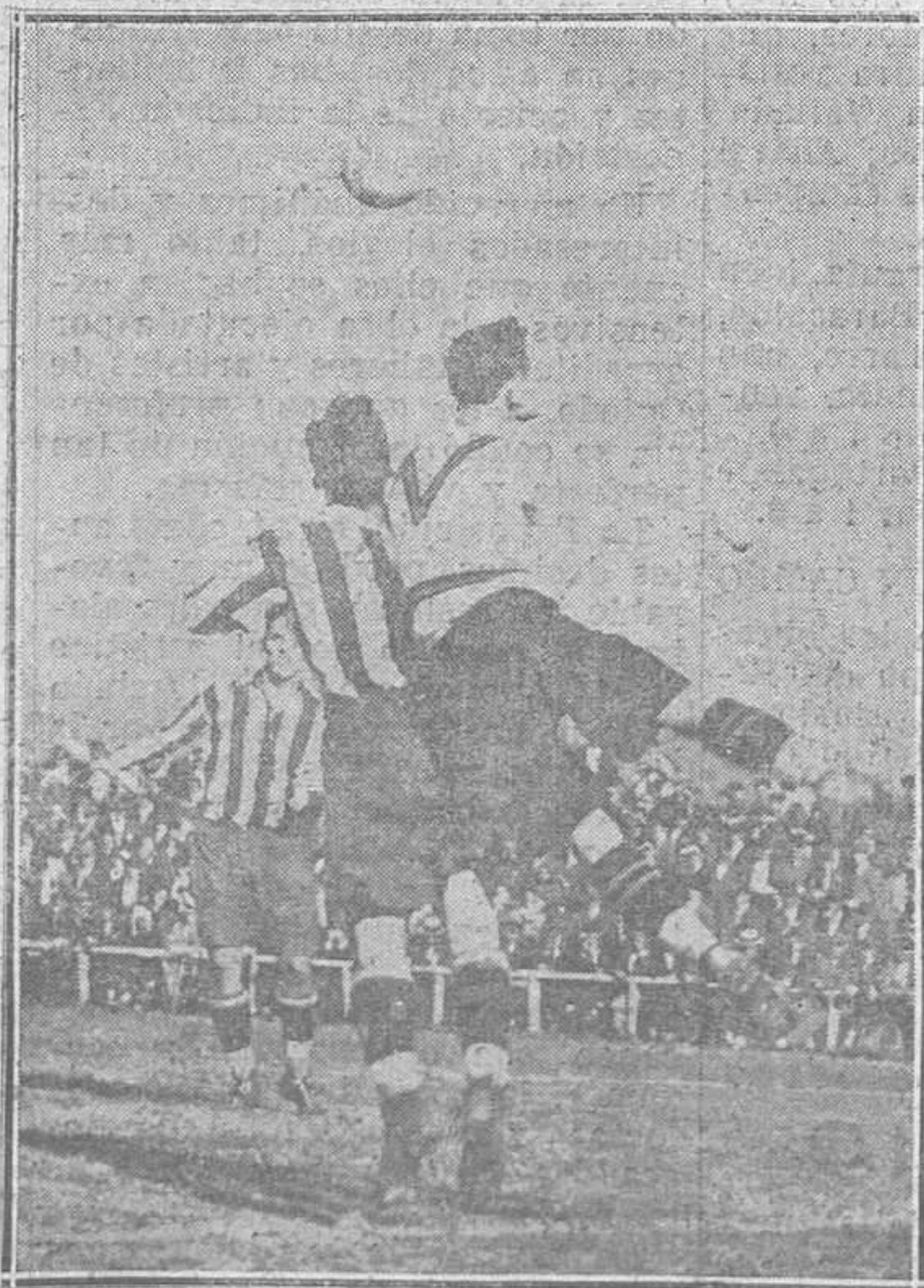
GIJON: SPORTING-UNION.-La defensa unionista cortando juego.

Fortuna llevó la ventaja, perforando la meta de Pis. Pero en el segundo tiempo, cuando los subcampeones se lanzaron cuesta abajo, fué ella. Dominaron más, jugaron más, demostraron más, mucha más potenciali-