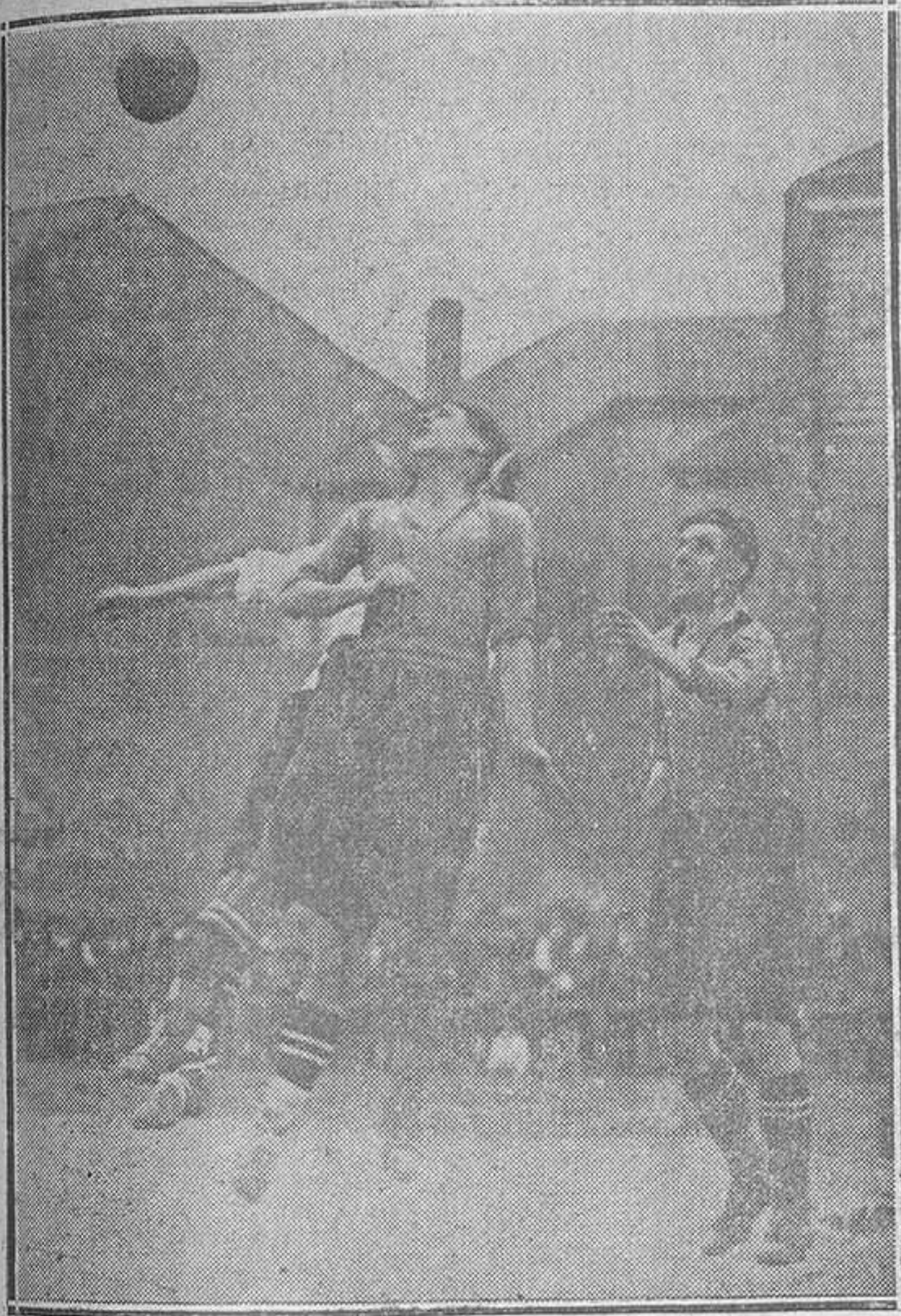
GIJON: FORTUNA-ATHLETIC.—Una fuerte presión del Fortuna.

Real y verdaderamente, podríamos, ahora, ir dando una peticula de lo que fué el encuentro, jugada por ju- gadores. Pero nos parece inútil. Preferimos dar a cono- cer solo las características y, si acaso, alguna jugada que otra.