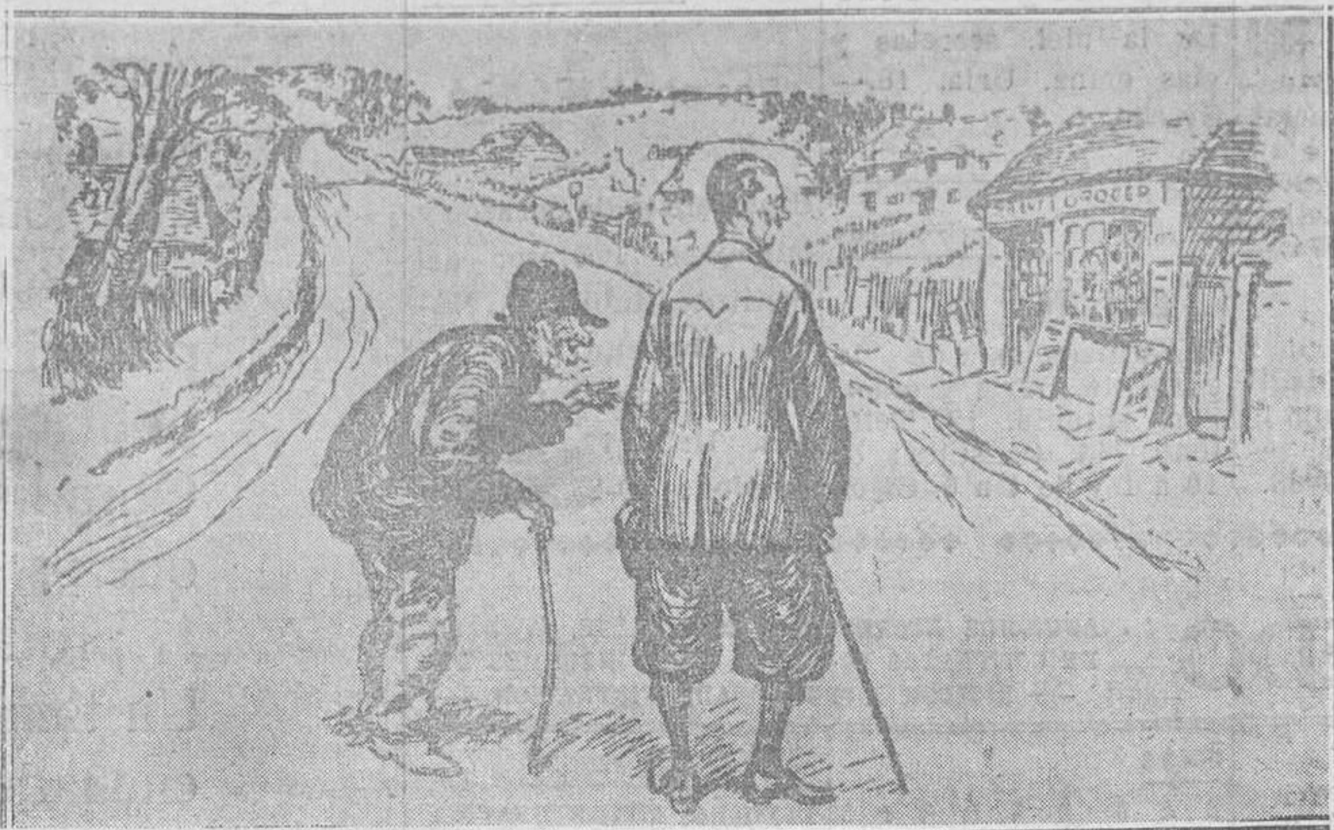
—¿Es este el principio de la ciudad o es una aldea, señor.