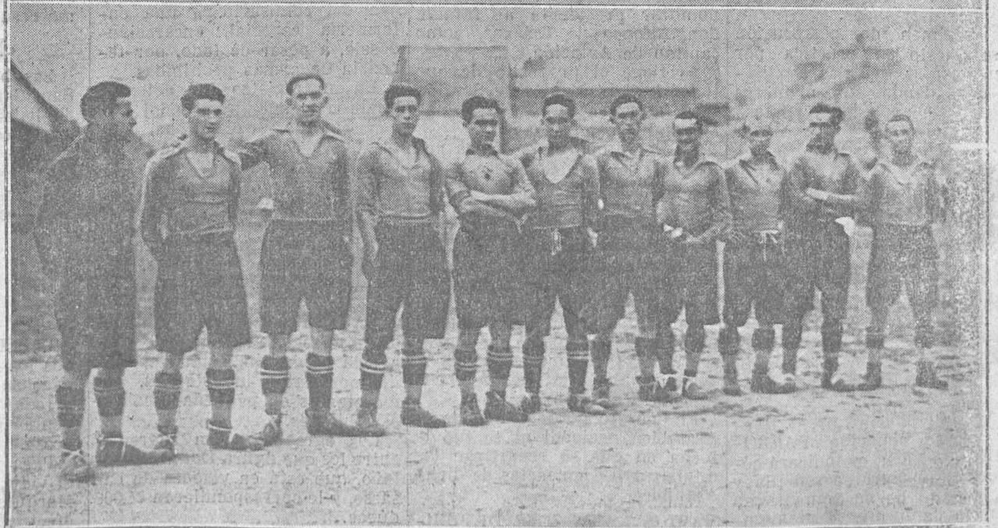
GIJON.—Arriba: El Club Fortuna que venció al Athletic por 5-1.—Abajo: El Real Athletic Gijón, que conten- tió con el Club Fortuna. (Fot. Fim)