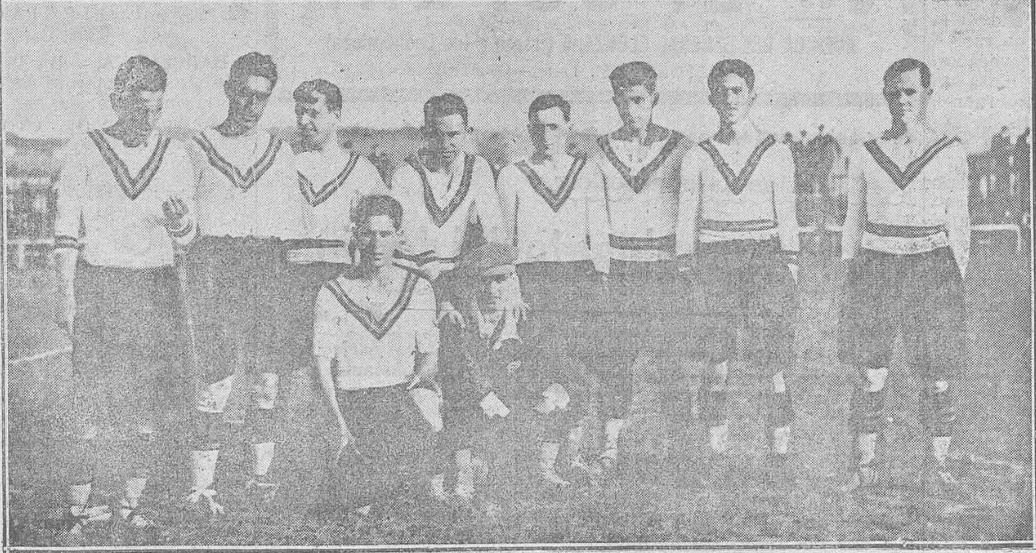
GIJON: COMIENZO DEL CAMPEONATO.-Arriba: El Real Sporting, que ganó por 6-0 al Unión Deportivo Racing.-Abajo: El Unión Deportivo, que cedió con el Real Sporting.