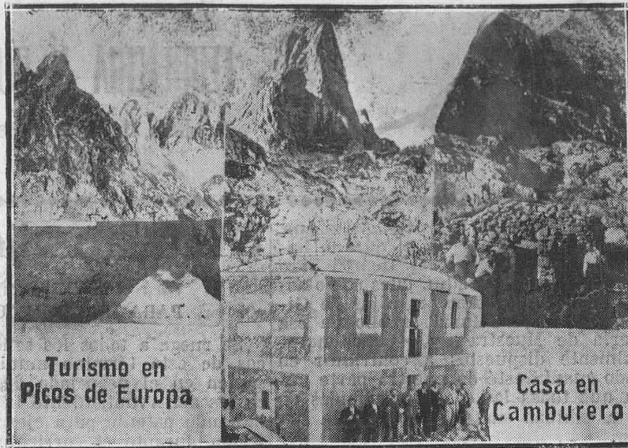
Turismo en Picos de Europa