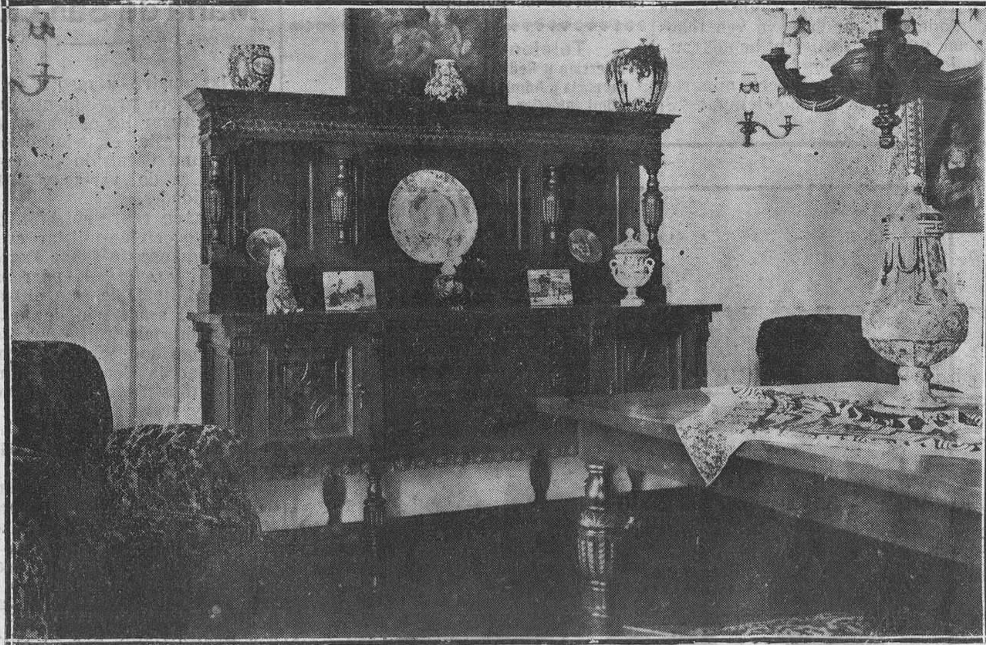
Comedor estilo asturiano, adquirido por una distinguida familia residente en la Habana.

Frecuentemente vemos lucir en este salón producciones nuevas. A veces es cosa de tres o cuatro días el cambio. Extráñanos que una casa que sólo se dedica a construir en sus talleres, produzca tanto, con el peligro que esto pudiera tener, ya que respondiendo sus obras a estilos determinados, no resultaría fácil encontrar mercado a colocarlas. Y construir para almacenar superfluamente sería un atentado a los propios intereses. Descontábamos, sí, que esta casa realizaba diariamente importantes operaciones, mas no suponíamos que fueran tantas. Inquirimos, al ir ayer a visitar la Exposición, el por qué de la frecuente renovación en los muebles expuestos.