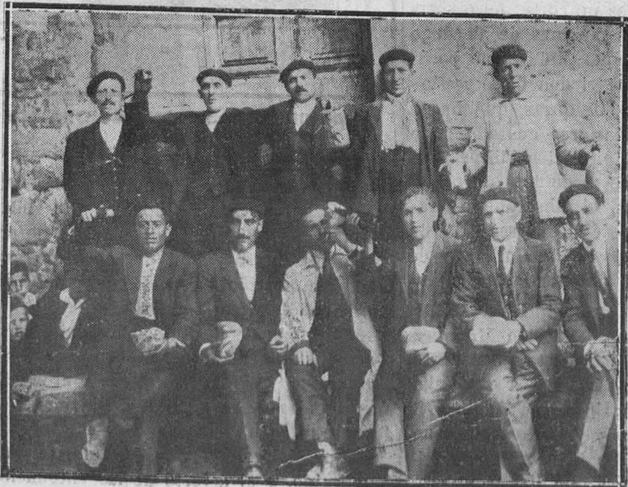
ABULI.—Comisión de festejos de San Juan de Abuli, que con gran éxito se celebran hoy.

La Real orden citada tiene fecha de 30 de junio próximo pasado.