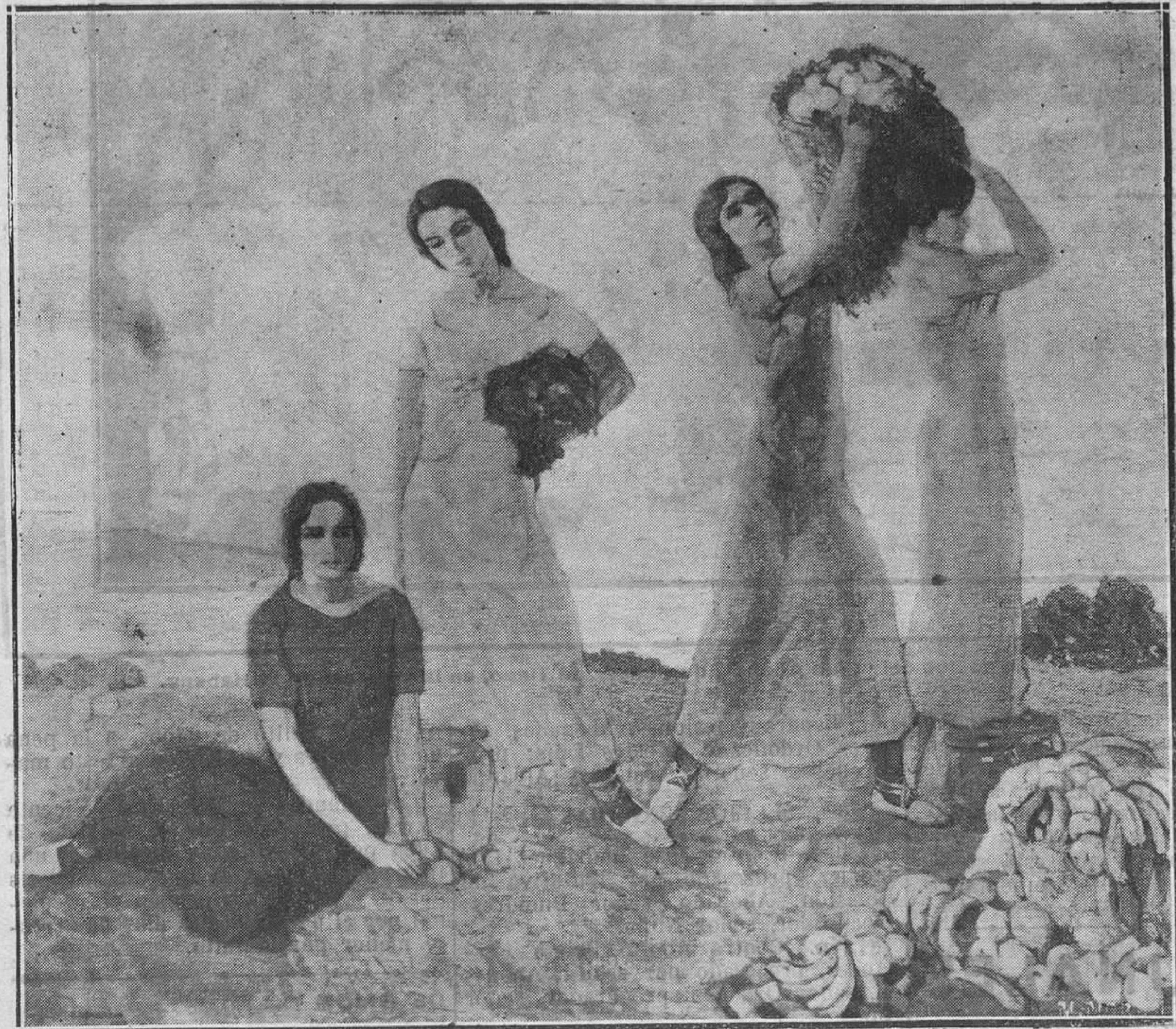
MADRID: EXPOSICIÓN NACIONAL DE BELLAS ARTES.—«Juventud», cuadro del pintor Roberto Fernández Valbuena, que figura en la Exposición y que ha sido premiado con tercera medalla.