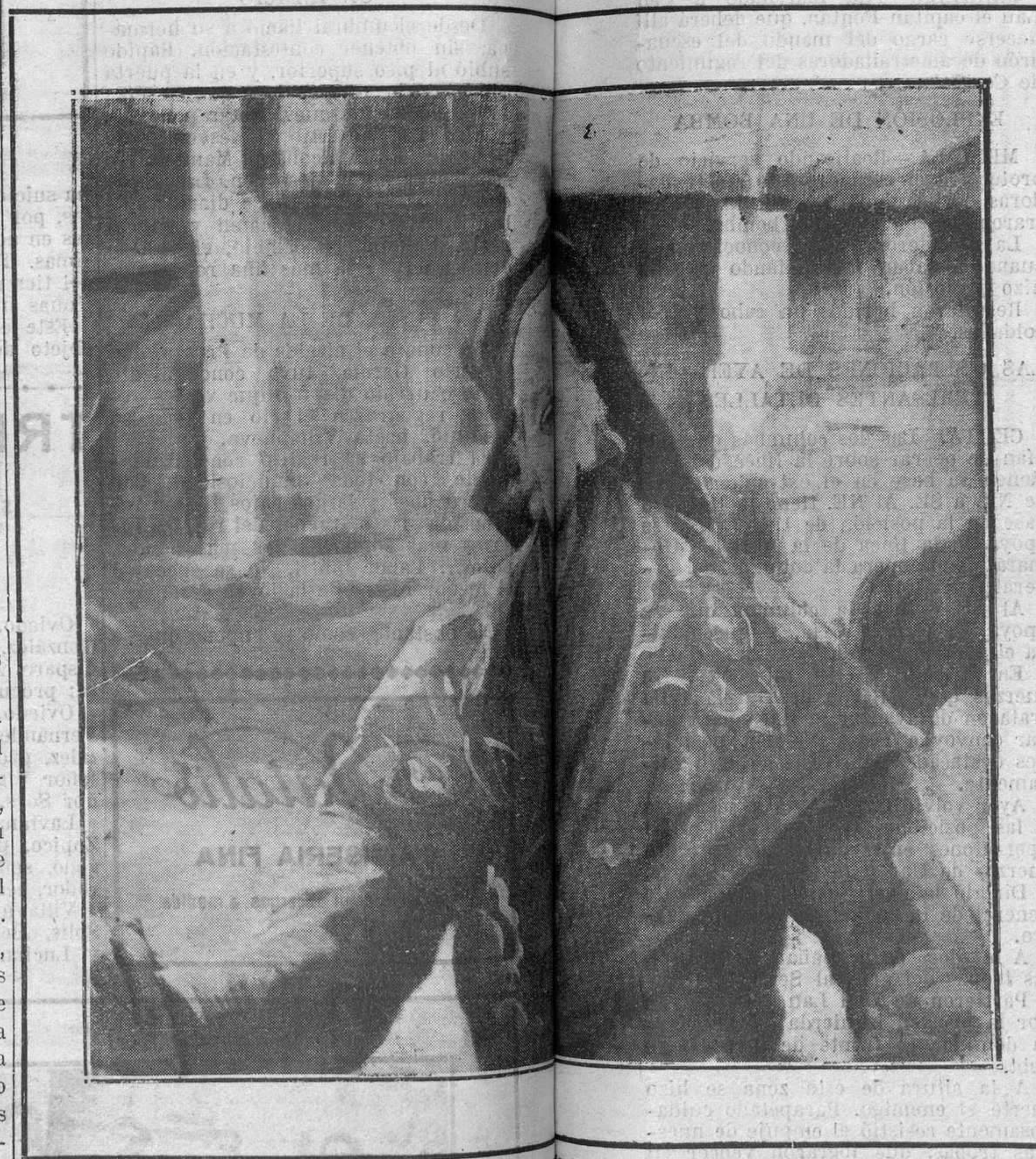
MADRID: EXPOSICIÓN NACIONAL DE BELLAS ARTES.—«Rosa», cuadro del ilustre pintor Zaragoza, que figura en la Exposición.

En el Salón de Exposiciones del Círculo de Bellas Artes se visita en estos días la notable Exposición de figuras que figuran los trabajos realizados por los alumnos de la escuela de Cerámica.