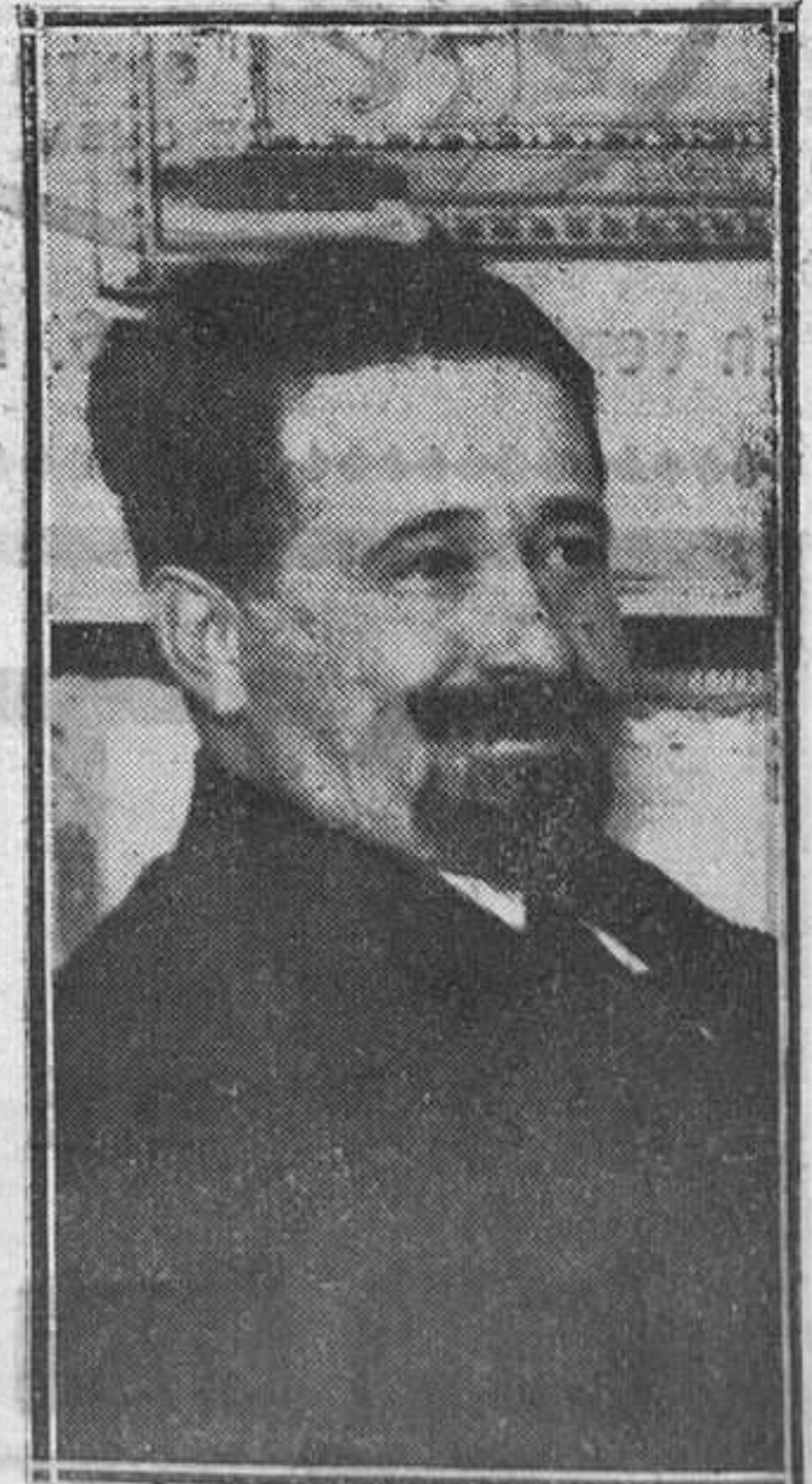
PORTUGAL.--D. Alfonso Costa, probable nuevo presidente del Gobierno portugués.

General Carrillo, número 10, Habana (Cuba).