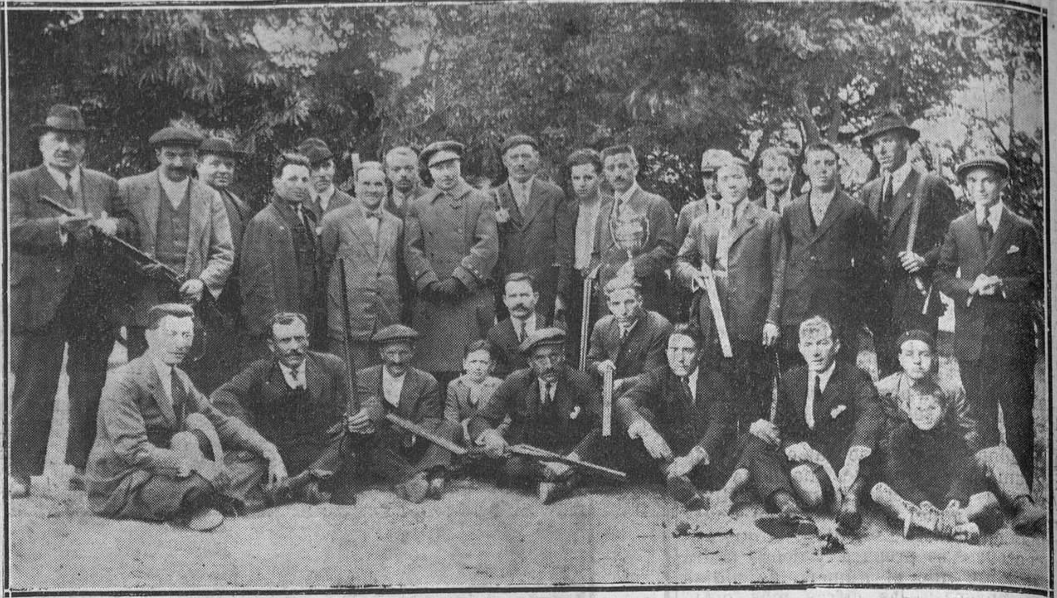
TINEO: CONCURSO DE TIRO DE PICHÓN.—El delegado gubernativo (1) y el alcalde (2), con los tiradores que tomaron parte en el concurso.