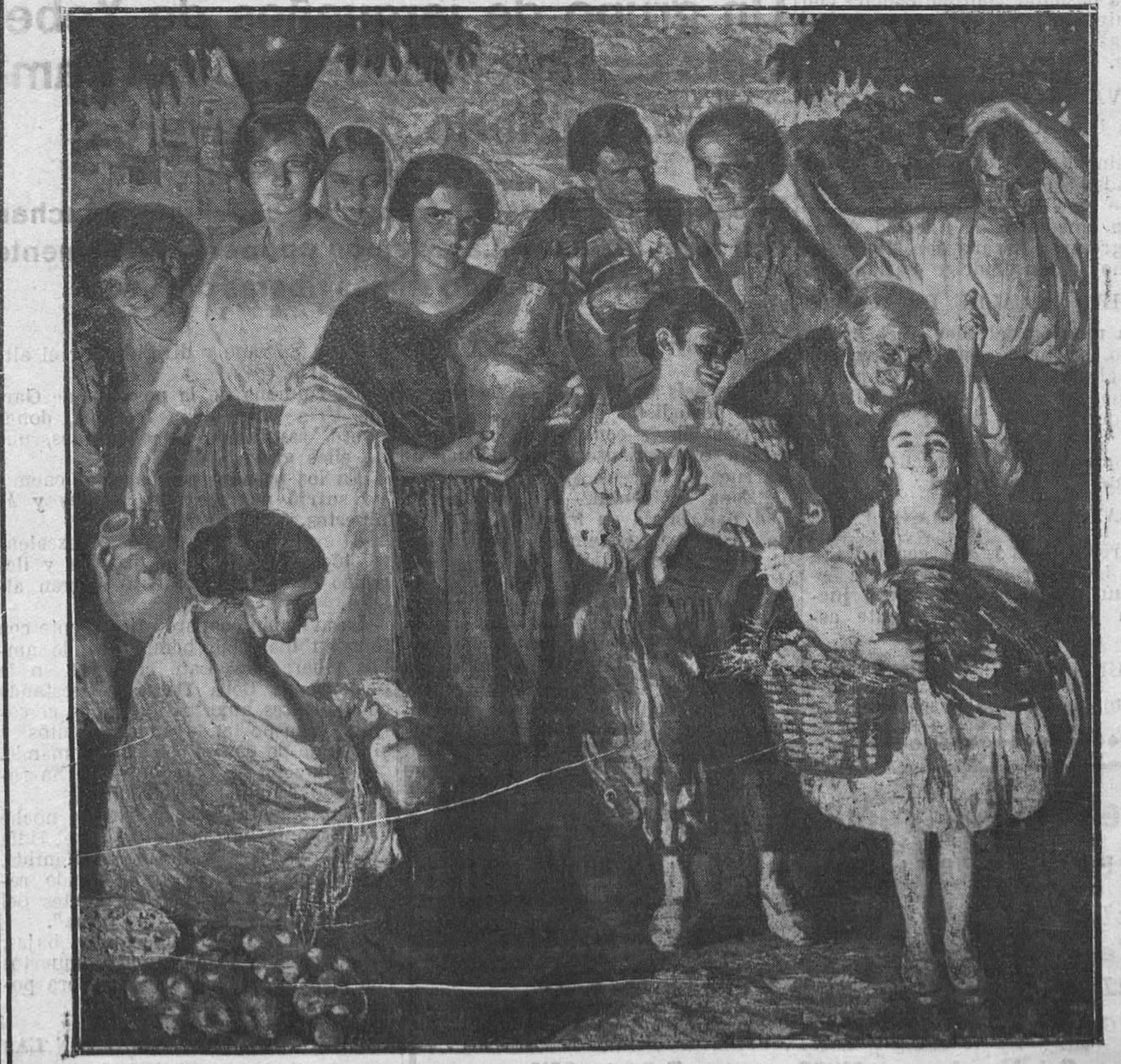
MADRID: EXPOSICIÓN NACIONAL DE BELLAS ARTES.—«El mercado», cuadro de Cruz Herrera, que figura en la Exposición y que ha sido premiado con segunda medalla.