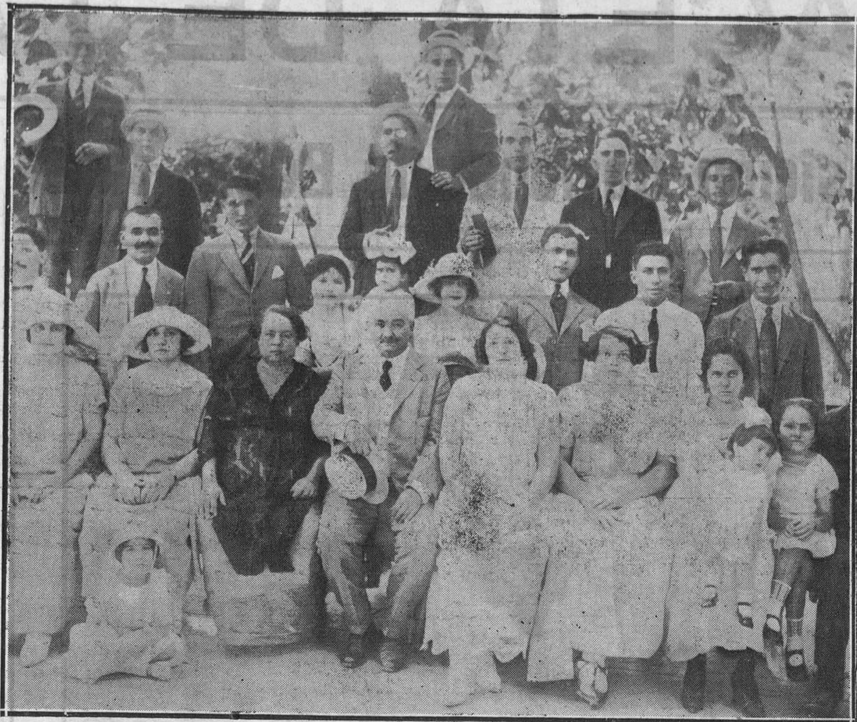
CUBA.—Grupo de socios del "Club Acebo", de Cangas de Tineo, en la Tropical de la Habana.

ha suicidado, se la buscó por los montes, por las barrancadas, tan frecuentes en aquella zona, y por las grandes simas. Tampoco fué hallada, a pesar del tiempo transcurrido y de las continuas investigaciones.