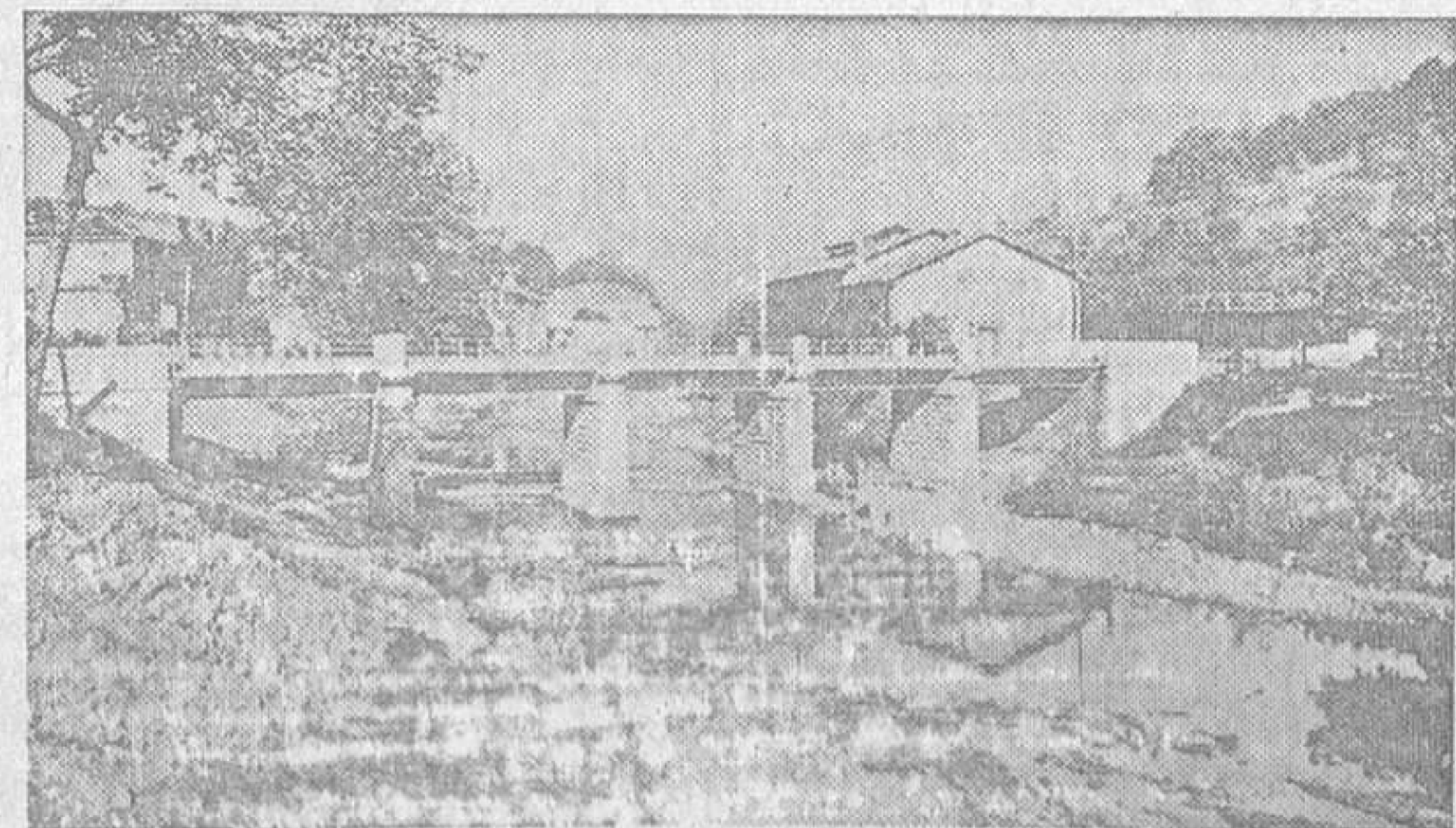
El Puente Nuevo en las afueras de la población

CRISTALES Y LENTES DE TODAS CLASES CRISTALES DE PRECISION - MONTURAS MODERNAS SE DESPACHAN FÓRMULAS DE OCULISTAS Relojes - Bisutería fina - Objetos de oro y plata Compostura de relojes y alhajas