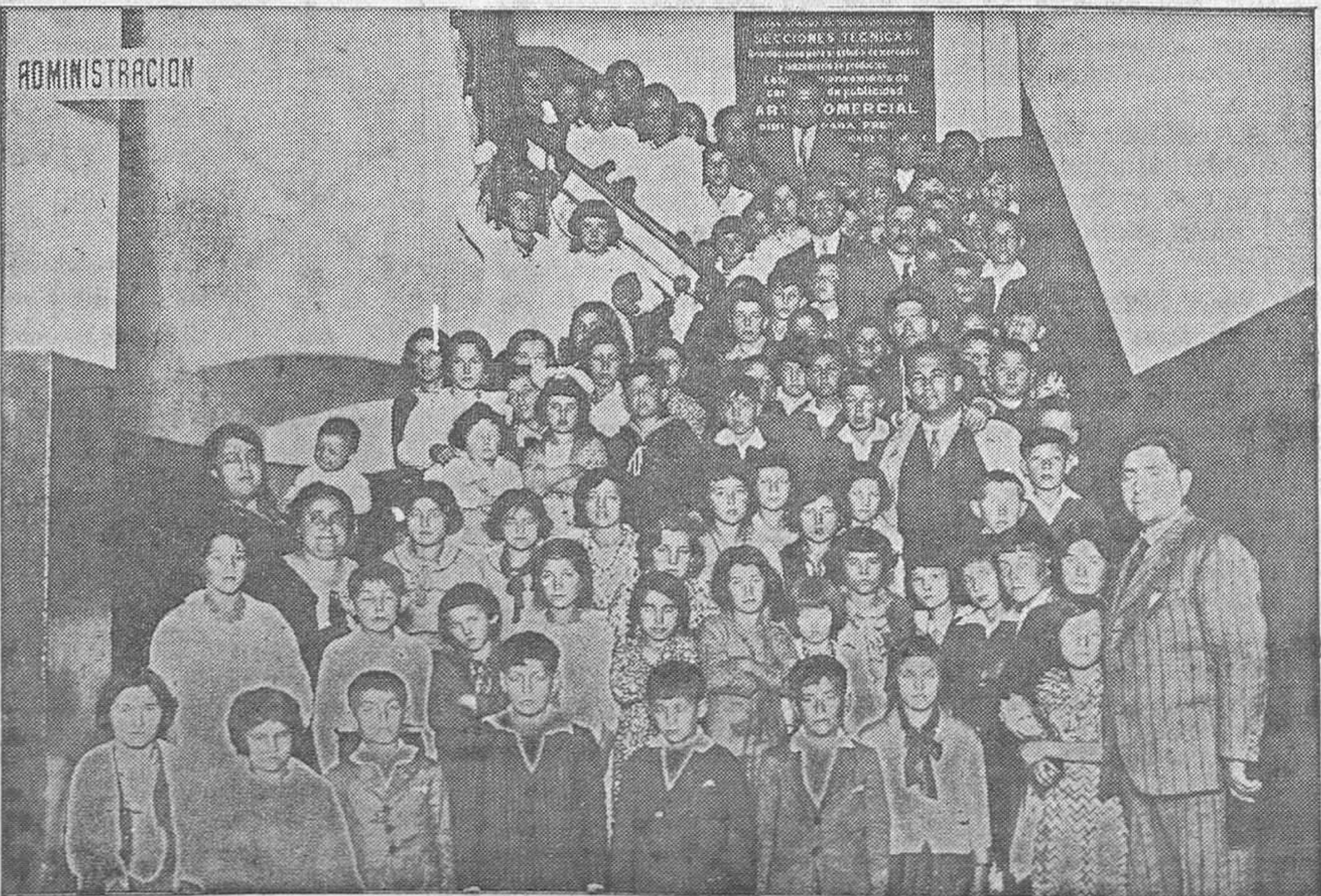
SIMPATICA VISITA.—Grupos de alumnos de las diversas escuelas del concejo de Riosa, que con sus profesores realizaron una excursión e incluyeron en el itinerario su visita a "La Voz de Asturias"