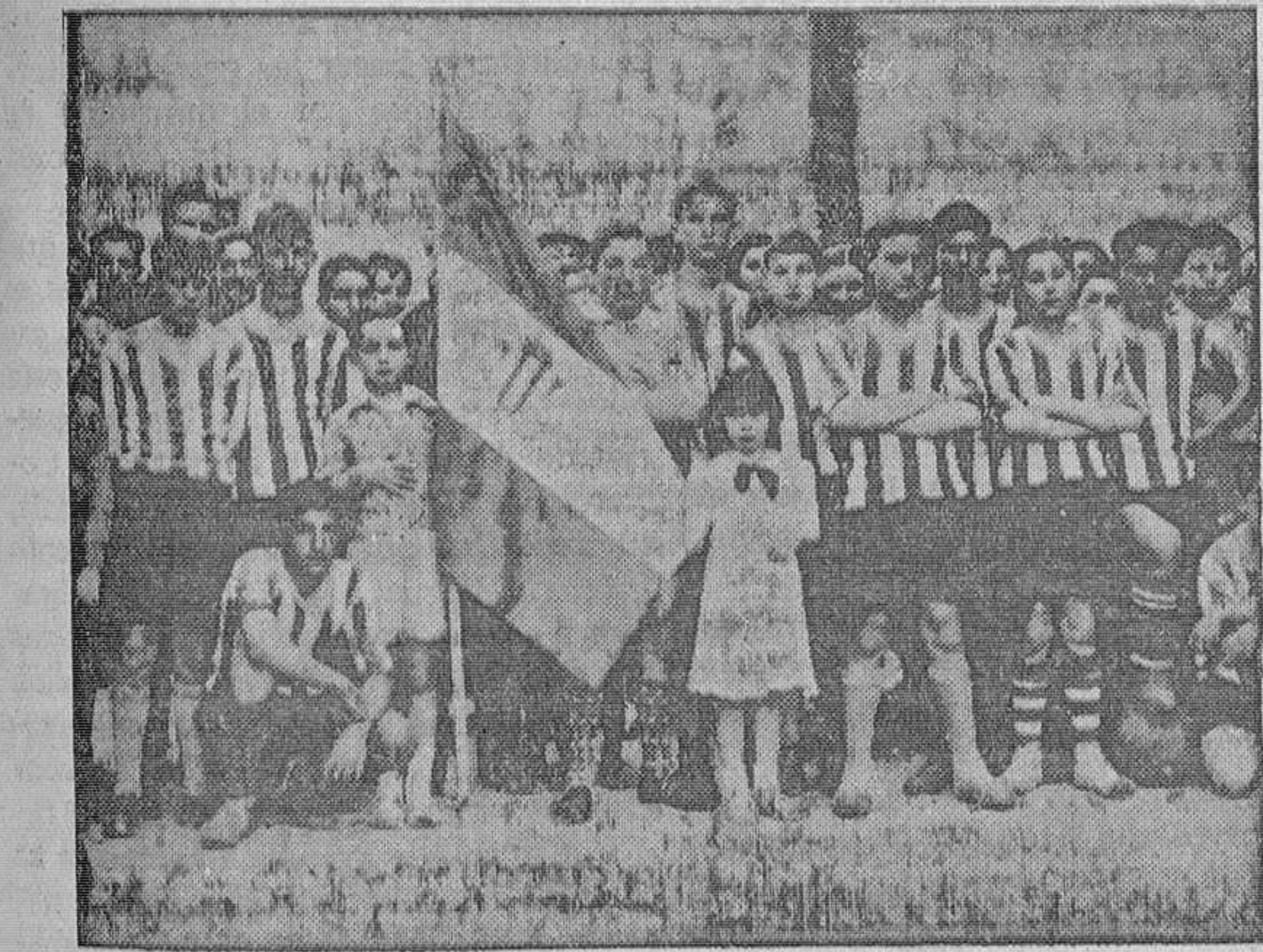
El Villamayor F. C. en un equipo infantil de nueva creación que en sus primeras armas con el infantil de la veterana Deportiva Filibéss, en el campo de Pialla, venció el novel por 4-1. El Villamayor F. C. recibió el domingo su bandera, después de la ceremonia de su bendición.