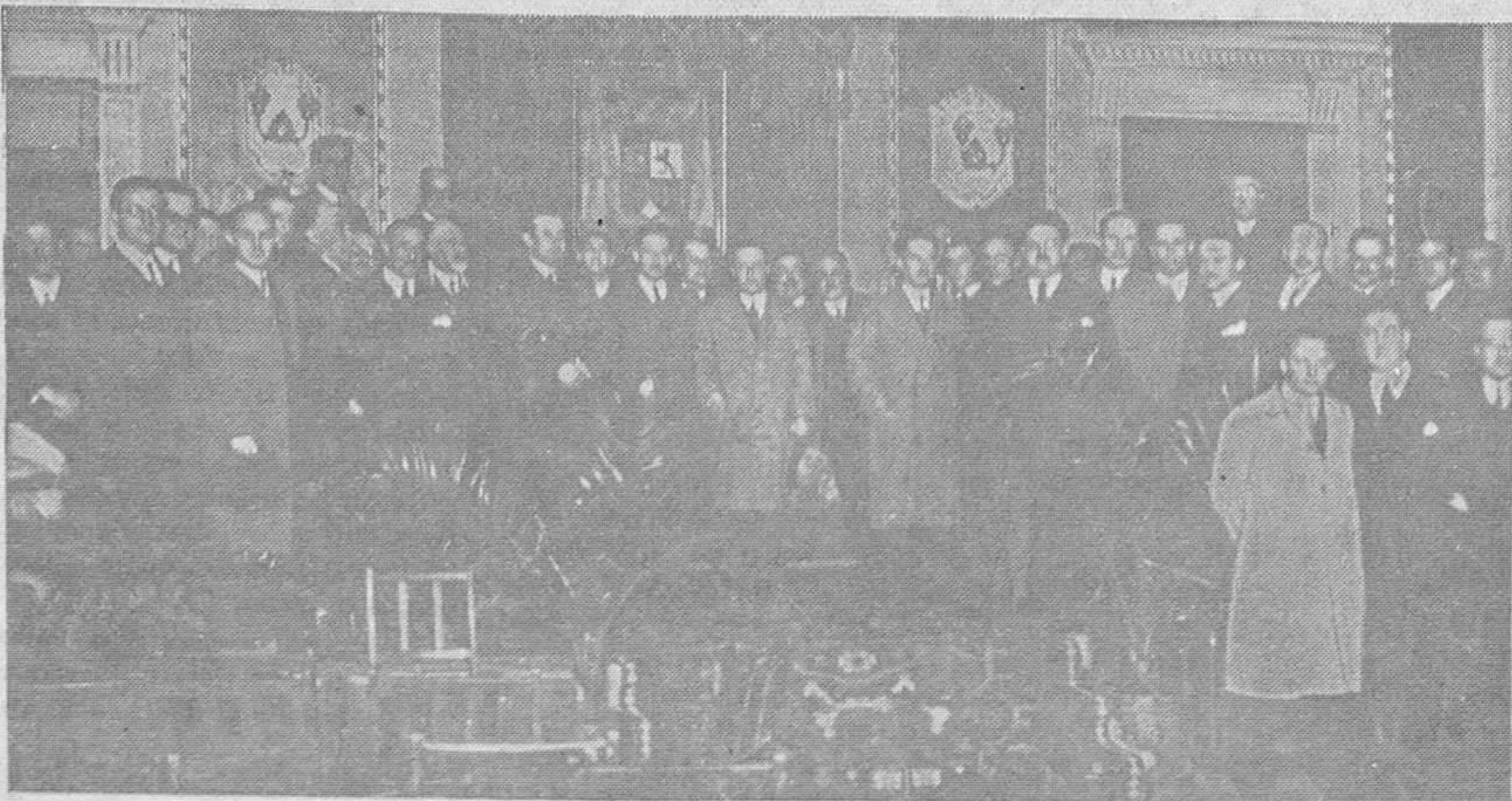
EN LA UNIVERSIDAD.—Las autoridades, con numerosos ingenieros de Minas y personalidades que asistieron a la sesión inaugural del Congreso de los técnicos

lee los anuncios de «La Voz de Asturias» y por esto son los que dan el mejor rendimiento