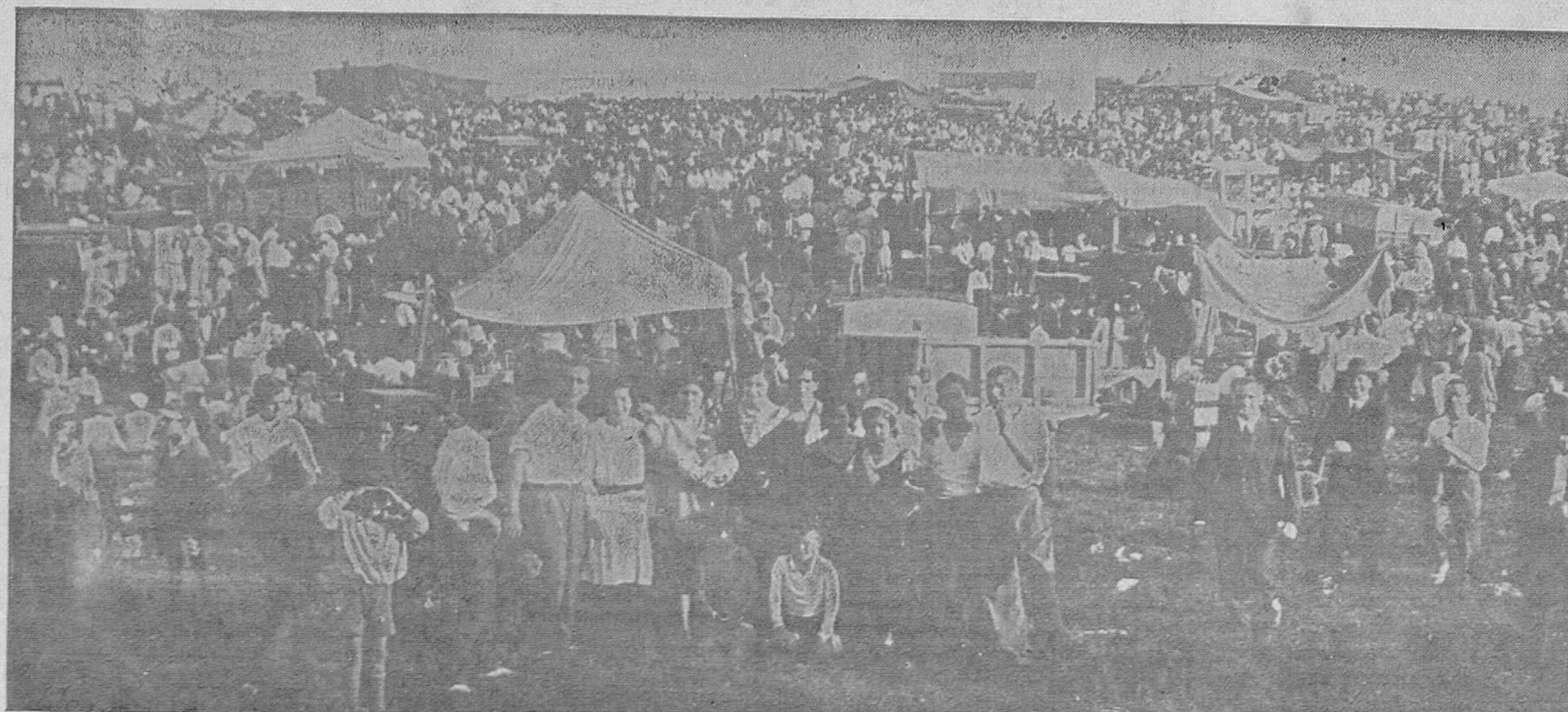
EL DOMINGO EN EL NARANCO.—Uno de los aspectos de la explanada donde se formó la gran romería asturiana después del acceso a la cumbre de nuestra montaña, en la que se reunieron, gracias a la admirable organización de la Sociedad Amigos del Naranco, millares de ovetenses y con ellos contingentes llegados de numerosos pueblos de la provincia.