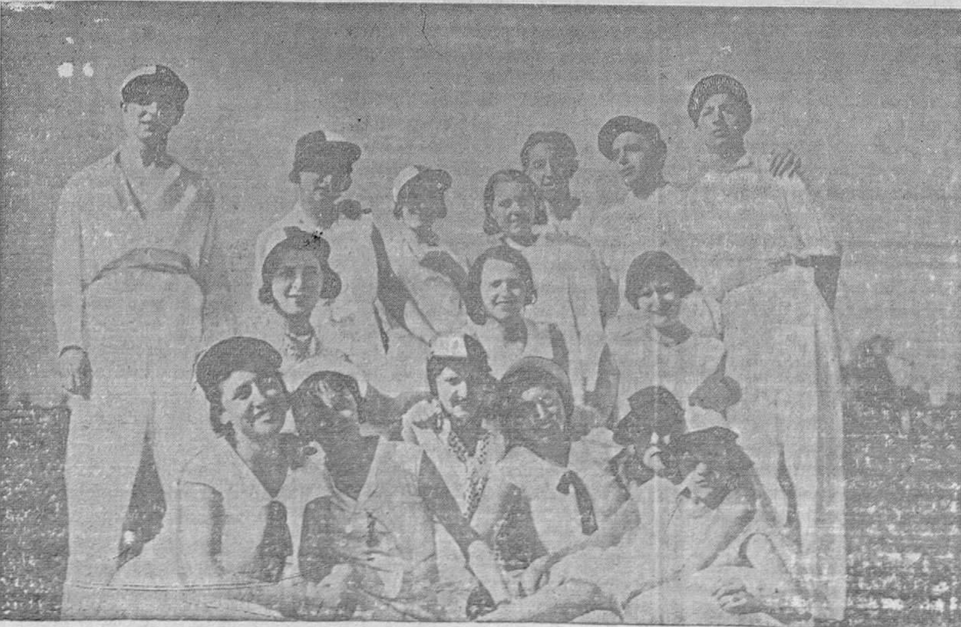
DE LA ROMERIA EN EL NARANCO.—En la fiesta inolvidable se formaron numerosos grupos para pasar el día alegremente, en honesta expansión.—El fotógrafo tenía mucho en que elegir, pero hay que ponderar su gusto al impresionar a este grupo en que se destacan chicas ovetenses de soberana belleza.