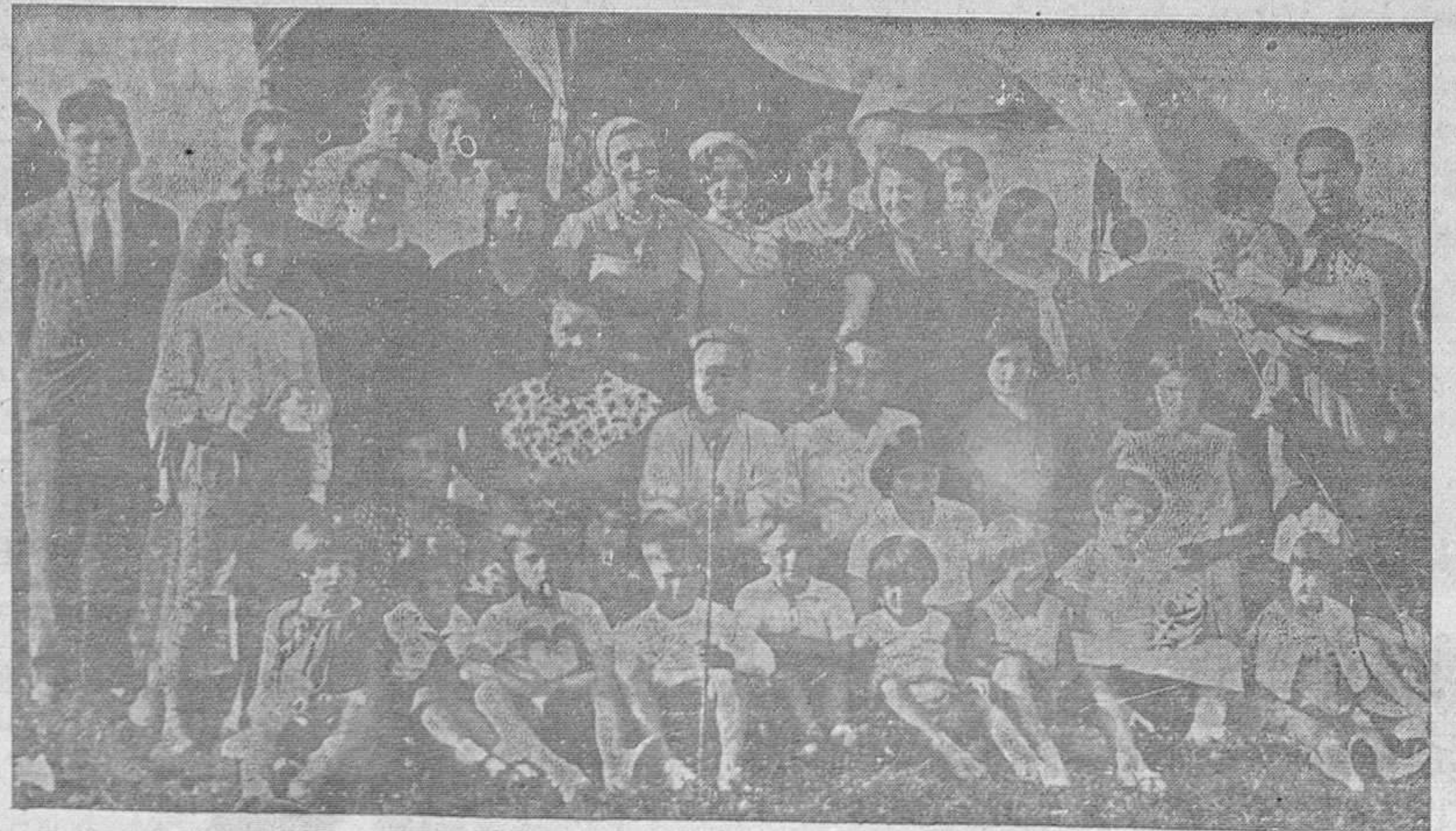
DE LA FIESTA EN EL NARANCO.—De la romería en la cumbre de la magnífica montaña han disfrutado todas las clases sociales y gentes de todas las edades.—Por eso al lado de las personas de edad—que, como buenos ovetenses, no pierden el humor—están hermosas muchachas, orgullo de la ciudad y traviesos chiquillos, que por esta vez se han mostrado formalotes, quizás alarmados por el gesto del fotógrafo.