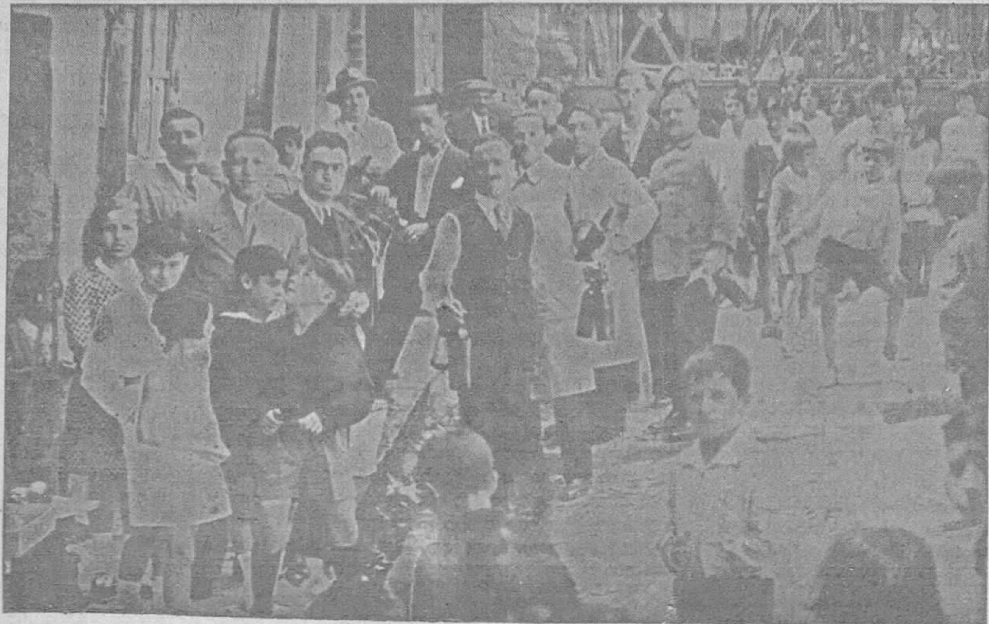
DE LAS FIESTAS EN «LOS POSTIGOS».—El acto del reparto del bollo y vino—todo de la mejor calidad—que se distribuyó en la mañana del domingo, con la mayor animación, a los cofrades de Santa María de la Corte.

La Guardia civil, que practicó las primeras diligencias, pasó el oportuno atestado al Juzgado de Instrucción